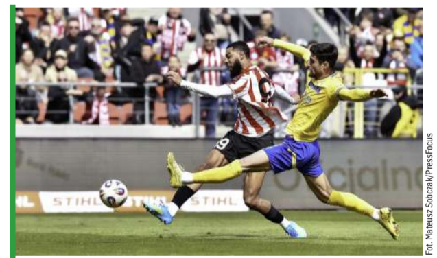
Napastnik Cracovii przez półtora roku rozegrał zaledwie dwie godziny...