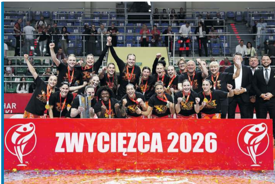
Konfetti już opadło - zdobywczynie Pucharu Polski w pełnej krasie.

Żywnę z Piotrkowa Trybunalskiego, szczypiornistki Zagłębia Lubin po raz jedenasty wywalczyły krajowy puchar.