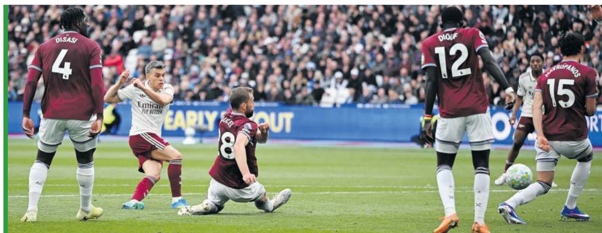
Leandro Trossard (drugi z lewej) strzelający gola na wagę zwycięstwa w derbach Londynu!