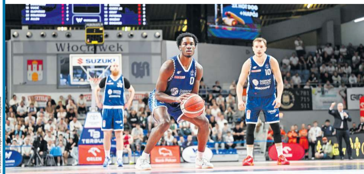
Anwil i MKS stoczyły we Włocławku mecz o wszystko.