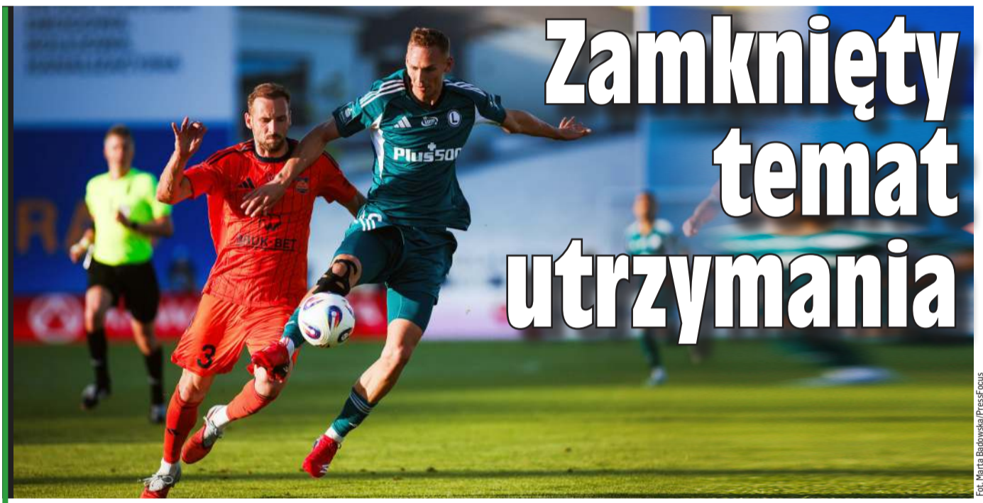
Na Adamsa legioniści zawsze mogą liczyć.

Jak będzie teraz? Dalej wszystko jest w nogach piłkarzy nie tylko z Zabrza, ale i z innych klubów, które grają o wysoką stawkę, jedni o mistrzostwo i europejskie puchary, drudzy o uniknięcie degradacji. Naprawdę się dzieje wiele i trudno prorokować jak będzie. We wspomnianym sezonie 2023/24 Warta Poznań po wygranej z Widzewem w 31. kolejce była z 37 punktami na bezpiecznym 13. miejscu. Potem przegrała trzy kolejne gry, żeby na koniec zameldować się na spadkowej lokacie, pierwszy raz w sezonie, i spaść. Dużo jeszcze przed nami w najbliższych dwóch tygodniach!