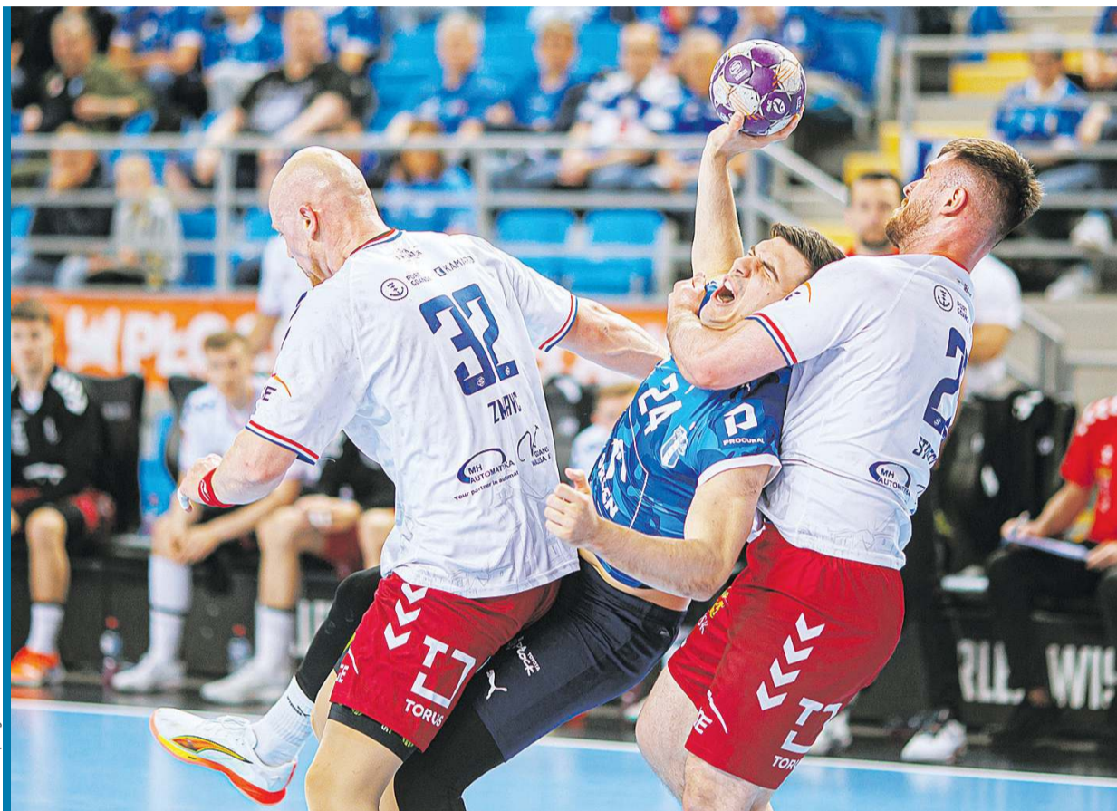
Gdyby Gdańszczanie bronili tak jak na tym zdjęciu, nie przegraliby w Płocku 20 bramkami.

Mistrzowie Polski nie dali najmniejszych szans rywalom z Gdańska i w wielkim finale zmierzą się z Industrią Kielce.