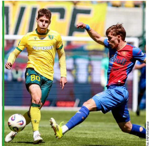
Walki w derbach nie zabrakło, ale efektów w postaci goli nie było