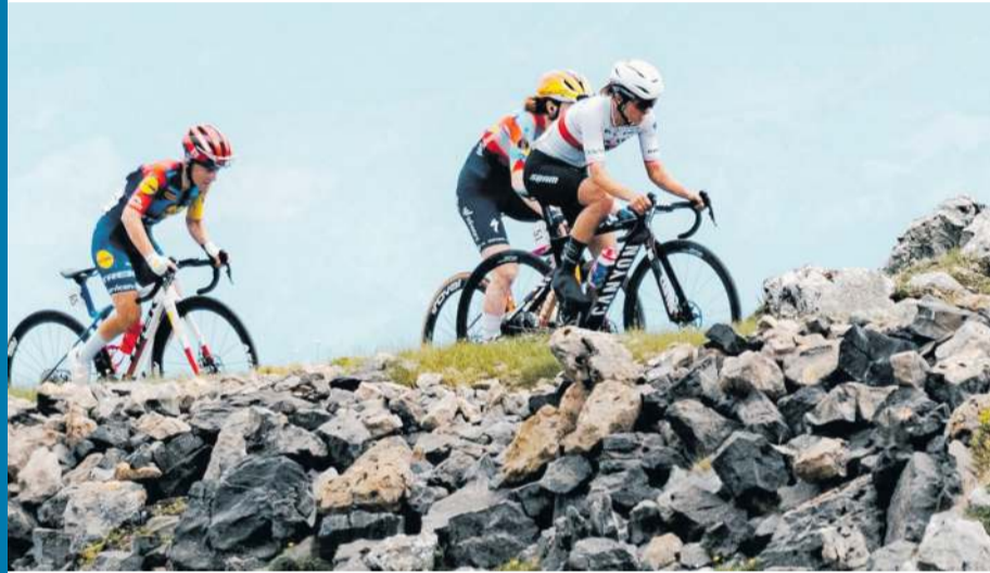
Mistrzyni Polski w drodze na L'Angliru.

Mniej więcej do połowy podjazdu, kiedy nie było jeszcze tak stromo, mistrzyni Polski utrzymywała się w czołowej grupie. Jednak potem, kiedy nachylenie na długich fragmentach prze-