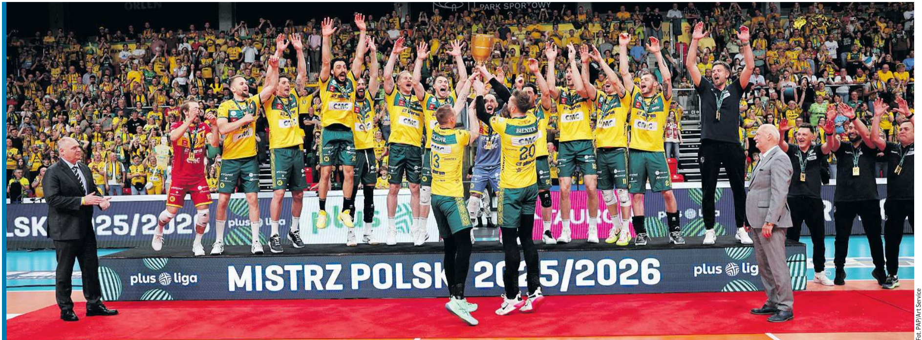
Zespół z Zawiercia został nowym mistrzem Polski!