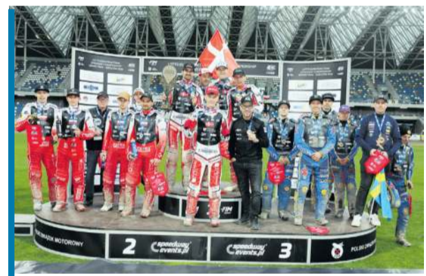
Polacy po raz pierwszy w DME nie zdobyli złota. Duńcy okazali się za silni