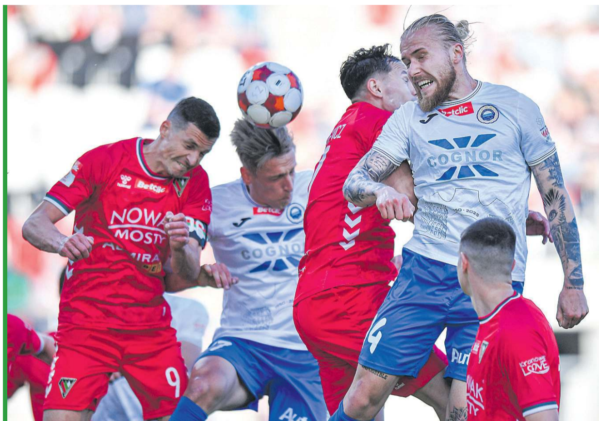
Takich spięć w Sosnowcu nie brakowało...

Piłkarze z Sosnowca nie mają litości dla swoich kibiców. W niedzielę zaliczyli kolejny blamaż.