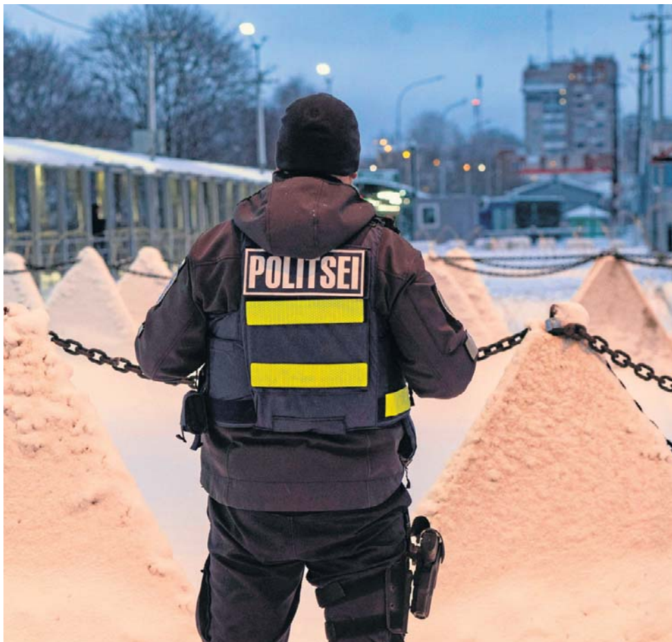
Tylko 162-metrowy most oddziela estońską Narwę od Rosji. Dziś stoją na nim zapory przeciwczołgowe i instalacje przeciwdronowe

Z trzech krajów bałtyckich najsłabszym ogniwem wydaje się Łotwa, której „głównym problemem jest pewna kruchość, niewydolność państwa”. - Ryga jako centrum polityczne ma problemy z wdrażaniem podjętych decyzji, czy to dotyczy gospodarki czy społeczeństwa. Też wewnętrzny system polityczny Łotwy jest