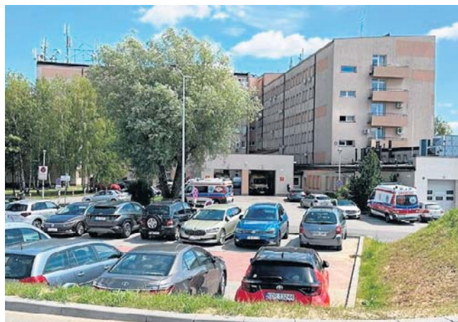
Szpital powiatowy w Brzesku. Centrum zdrowia psychicznego powstanie po jego wschodniej stronie

Centrum Zdrowia Psychicznego powstanie również w Bochni. Tam obiekt znajdzie siedzibę w budynku po dawnym pogotowiu ratunkowym przy ul. Konstytucji 3 Maja. Niebawem zostaną rozpoczęte prace w terenie. ©©