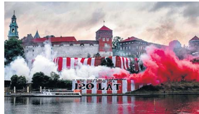
W sobotę rano kibice zrobili oprawę na Wawelu, co spotkało się z reakcją policji - 3 osoby zostały ukarane