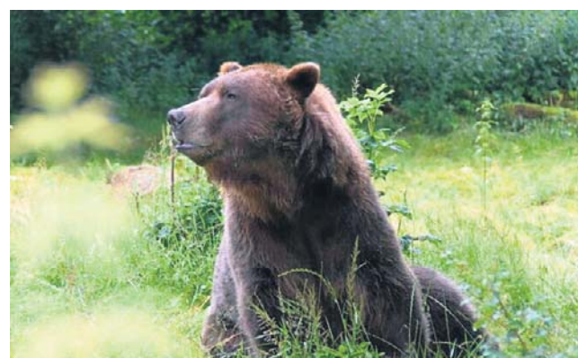
FOT. PIKABAYCOM/ZDJEŃ ILLUSTRACYJNE

Zauważony niedźwiedź to prawdopodobnie ten sam osobnik, którego obecność w przysiółku Liciąż w Joninach wcześniej zgłaszali do gminy myśliwi.