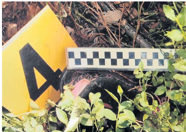
Ślad nr 4 to jeden z butów ofiary. Był wciśnięty między ściółkę i zeschnięte gałęzie. Obok leżała twarzą do ziemi Samanta. Miała naciągnięty na twarz kaptur...

Zeznania na temat relacji Samanty z chłopakiem są roz-