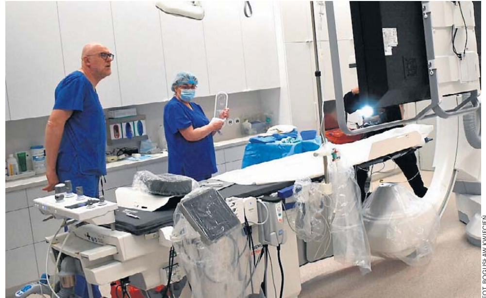
Centrum GVM Carint posiada światowej klasy sprzęt, który będzie pomagał specjalistom ratować życie i zdrowie pacjentów kardiologicznych z Małopolski zachodniej

Są wśród nich dwa zaawansowane angiografy, konsola