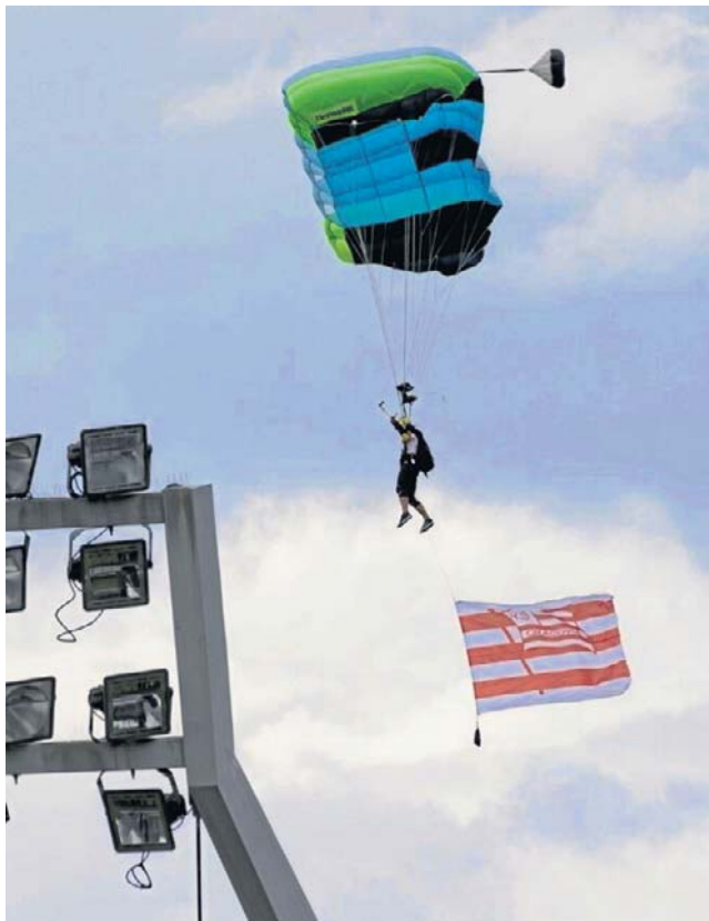
Kibice zgromadzenie na stadionie przy ul. Kałuży mogli podziwiać m.in. takie widoki spadochroniarzy

Z kolei zgromadzeni na stadionie fani mogli oglądać pokazy lotnicze, a także skoki spadochronowe. Piknik trwał cały dzień, były koncerty, m.in. Macieja Maleńczuka, twórcy hymnu Cracovii. ©©