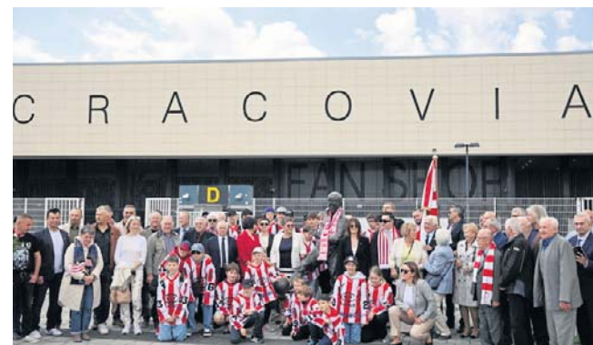
Kilka pokoleń „Pasiaków”: Zawodnicy Akademii Hokejowej Cracovia CANPACK i Rada Seniorów