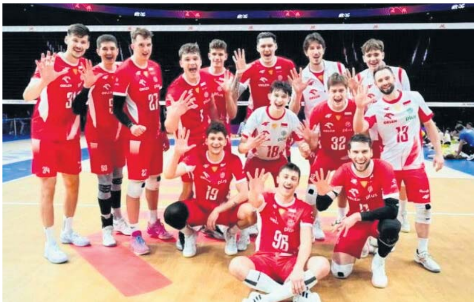
Polska na turnieju Ligi Narodów w Linyi w Chinach wygrała dwa mecze i dwa przegrała

Dopiero w trzecim secie „Biało-Czerwoni” byli w sta-