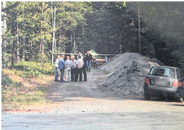
Zwłoki Samanty znaleziono w lesie pod Namysłowem. Miejsce zbrodni zasłonięte było hałdami ziemi z remontowanej nieopodal drogi

obrażeń wskazujących na gwałt, ale śledczy biorą też pod uwagę, że została sterroryzowana i zmuszona do współżycia. Śledczy, z którymi rozmawiałam, akta tej sprawy znają niemal na pamięć.