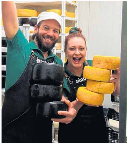
Podczas 12. edycji konkursu Premios Cincho 2026 po raz szósty do rywalizacji zaproszono serowarów spoza Półwyspu Iberyjskiego. W tym roku zgłoszono ponad 1300 serów, a polskie serowarnie wystawiły 85 produktów. Polska reprezentacja zdobyła łącznie 6 medali. Dwa z nich trafiły do Wrocławia.