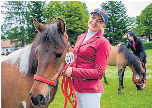
W Klikowej ocenie poddawane były zarówno ogiery, jak i klacze, w różnych klasach