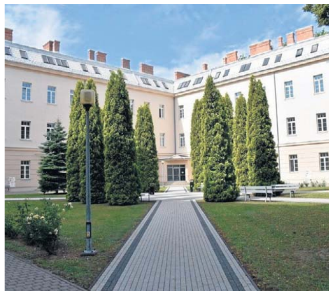
Akademia Tarnowska przygotowała ponad 2300 miejsc na I roku studiów w roku akademickim 2026/2027

Aplikować można między innymi na kierunek lekarski, pielęgniarstwo, psychologię, prawo, kierunki politechniczne, administrację, ekonomię, chemię, studia artystyczne oraz humanistyczne. W przypadku tych ostatnich w ofercie tarnowskiej uczelni pojawiły się dwa nowe kierunki: pedagogika specjalna (studia magisterskie - dzienne i zaoczne) oraz lingwistyka stosowana (studia licencjackie).