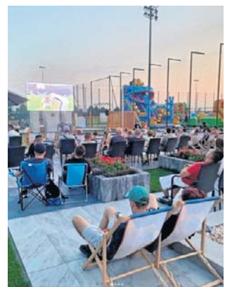
Na zewnątrz gotowy do transmisji jest telebim

- My tu dalej żyjemy piłką - usłyszeliśmy w Klubie Kibica, który przygotowuje miejsca do wspólnego oglądania piłkarskich pojedynków.