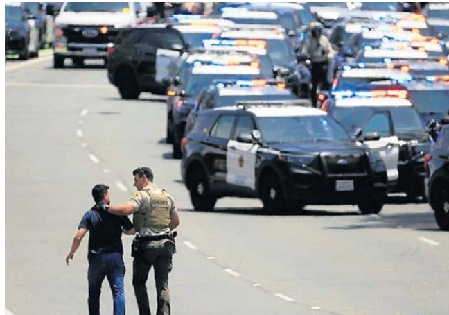
W akcji uczestniczyło wielu funkcjonariuszy policji oraz oddziały SWAT-u

Prezydent Donald Trump nazwał strzelaninę „straszłą sytuacją”, dodając: „Otrzymałem kilka informacji, ale wrócimy do sprawy i dokładnie ją przeanalizujemy”.