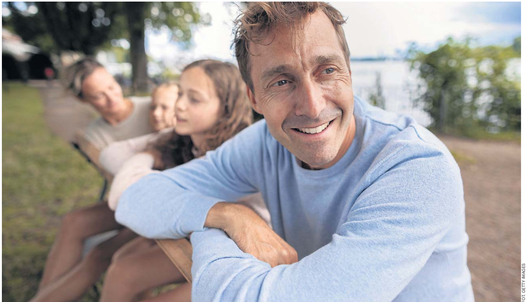
Starzenie się przebiega skokowo, a nie stopniowo – wskazują nowe badania

Między 40. a 60. rokiem życia wyraźnie rośnie ryzyko cho-