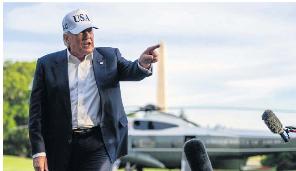
Trump polecił siłom USA, by wstrzymały się z atakiem, ale też by były gotowe do przeprowadzenia „pełnego, zakrojonego na szeroką skalę ataku na Iran w każdej chwili, w przypadku braku akceptowalnego porozumienia”

Jak dodał, polecił siłom USA, by wstrzymały się z atakiem, ale też by były gotowe do przeprowadzenia „pełnego, zakrojonego na szeroką skalę ataku na Iran w każdej chwili, w przypadku braku akceptowalnego porozumienia”.