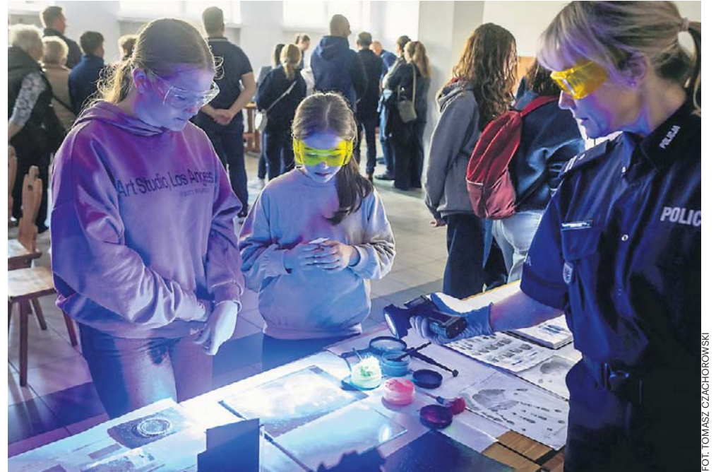
Czy sztuczna inteligencja pomoże funkcjonariuszom w analizowaniu danych? Na zdjęciu Noc Muzeów w Komendzie Wojewódzkiej Policji w Bydgoszczy

- Będziemy te zbiory modernizować. Minister spraw wewnętrznych i administracji Marcin Kierwiński powołał zespół do wykorzystania sztucznej inteligencji w obróbce danych - mówił wiceszef resortu spraw wewnętrznych i admini-