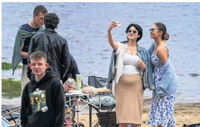
Plenerowe sceny do filmu „Całopalenie” w poniedziałek kręcono na Kępie Bazarowej, na brzegu Wisły

Tak, po około półtorej godziny, zakończyła się praca