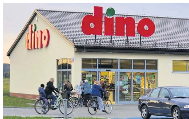
Na koniec marca 2026 r. sieć liczyła 3094 sklepy, czyli o 348 więcej niż rok wcześniej. Zatrudniła 56,7 tys. osób

Związkowcy zwracają uwagę, że podczas ostatnich mediacji, nie pojawił się żaden przedstawiciel spółki Dino Polska. W związku z tym wraz z mediatorem został podpisany protokół rozbieżności. Spółka odmówiła jednak jego podpisa-