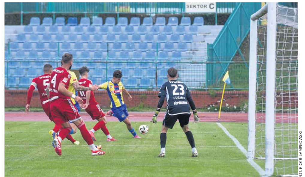
Piłkarze z Luzina to rewelacja sezonu 2025/26 w Betclit 3. Lidze

W rundzie jesiennej Zawisza przegrał w Luzinie 1:2. Czas na rewanż bydgoski rycerzu! ©