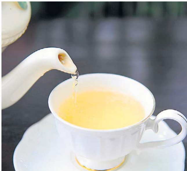
Żółta herbata to wyjątkowo rzadki i ekskluzywny napój, który był podawany tylko na dworze cesarza

● Dahongpao - wielka szata (często mylony z oolong) - klasycznie Dahongpao to oolong. Jednak w niektórych tradycjach i na niektórych obszarach, nazwa ta bywa również przypisywana bardzo wysokiej jakości żółtym herbatom, które przechodzą in-