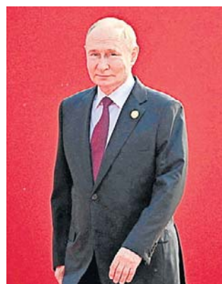
To już piąta wizyta Putina w Chinach od 2022 roku

- Temat ten zostanie omówiony bardzo szczegółowo. Jesteśmy gotowi poważnie przedyskutować tę kwestię - powiedział doradca prezydenta Jurij Uszakow, dodając, że Rosja „zachowuje rolę niezawodnego dostawcy” surowców energetycznych do Chin, a w pierwszym kwartale wyeksportowała na