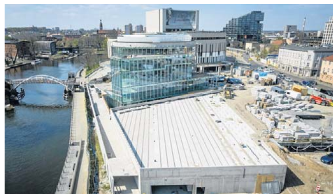
Uczestnicy w spaceru będą mogli zobaczyć IV krąg Opery Nova jeszcze przed jego otwarciem

Trzeci spacer poświęcony będzie Filharmonii Pomorskiej. Termin jest w trakcie ustalania - wiadomo, że odbędzie się w września. ©