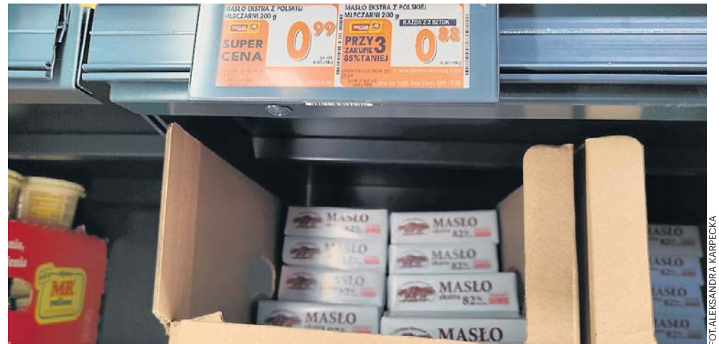
Nadpodaż mleka i agresywna walka sieci handlowych o klientów - oto przyczyny, że masło przestało być symbolem drożyzny i stało się tanie jak barszcz

Według informacji branżowego portalu dlhandlu.pl, związek wskazuje na agresywny marketing, a ceny rzędu 0,99-1,99 zł za kostkę mogą oznaczać sprzedaż poniżej kosztów zakupu i zaburzać uczciwą konkurencję. „Społem” podaje, iż według danych zebranych od producentów, minimalna ekonomicznie uzasadniona cena detaliczna - uwzględniająca transport, magazynowanie oraz marżę - powinna wynosić od 4,90 zł do 6,90 zł za kostkę (25-35 zł/kg). Zdaniem