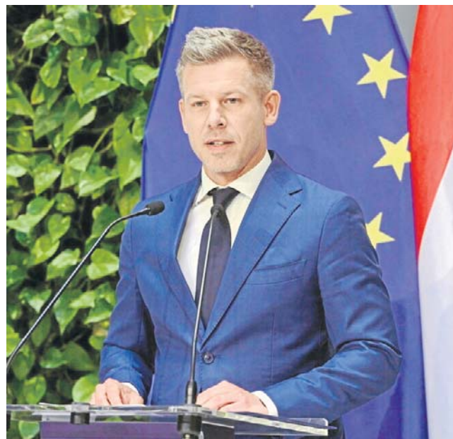
Wizyta w Polsce to pierwsza zagraniczna podróż Petera Magyara w charakterze szefa węgierskiego rządu

Zdaniem krakowskiego publicysty Tomasza Terlikowskiego naturalny jest wybór Krakowa i Wawelu jako miejsca