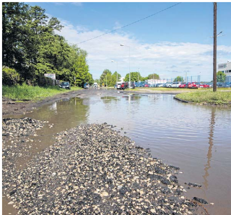
Od soboty autobusy nie kursują ulicą Srebrną, co wynika z fatalnego stanu nawierzchni

Obecnie wszystkie służby pracują nad tym, aby jak najszybciej przywrócić kursowanie komunikacji publicznej w tym obszarze i udrożnić przejezdność ulic. ©©