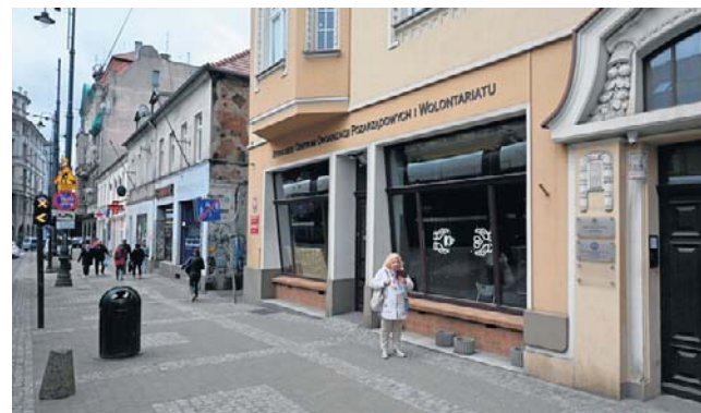
Spotkanie odbędzie się 21 maja w BCOPW przy ul. Gdańskiej 5 w godz. 10-13. Wstęp jest wolny

Będzie można dowiedzieć się np. o chorobie wieńcowej i o tym czy kobiety chorują inaczej. W czasie innego wykładu uży-