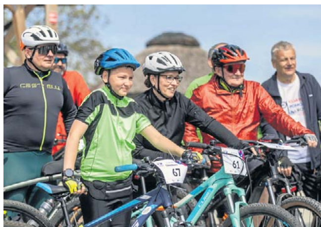
Rajd w Chrostkowie zaliczony i całkiem udany. Można się zgłaszać na kolejne

Więcej informacji na temat rajdów i zgłoszeń na kolejne edycje można znaleźć na stronie kujawsko-pomorskiarowery.pl