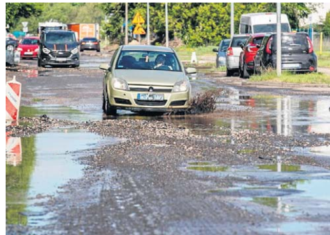
Od soboty autobusy nie kursują ulicą Srebrną, co wynika z fatalnego stanu nawierzchni

- Obecnie wszystkie służby pracują nad tym, aby jak naj-