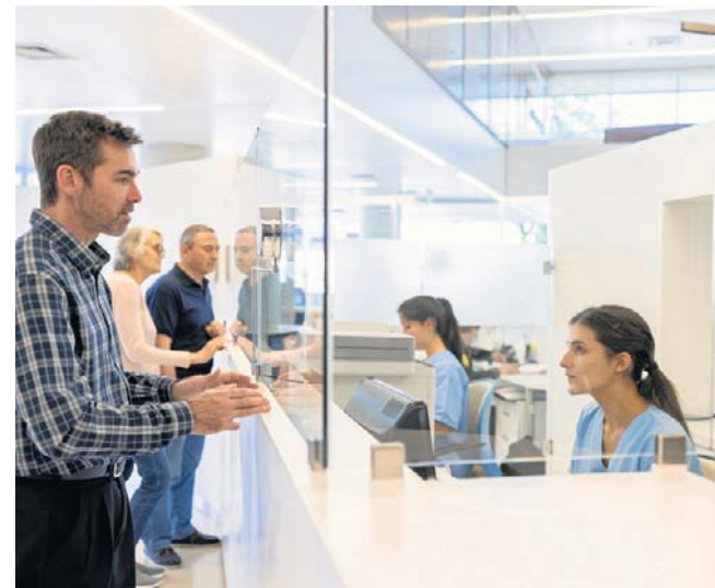
Do końca maja przychodnie mają czas na wdrożenie e-rejestracji

Kluczowe korzyści to dostęp do wolnych terminów w czasie rzeczywistym, możliwość szybkiego wyboru placówki, mniej „martwych dusz” w kolejkach, wynikających z nieodwołanych wizyt.