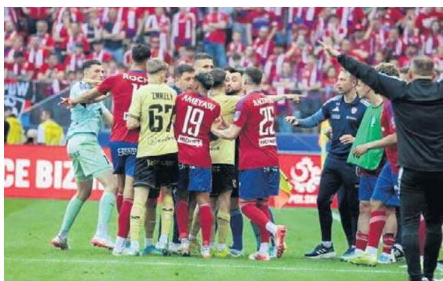
W końcówce spotkania na murawie doszło do awantury