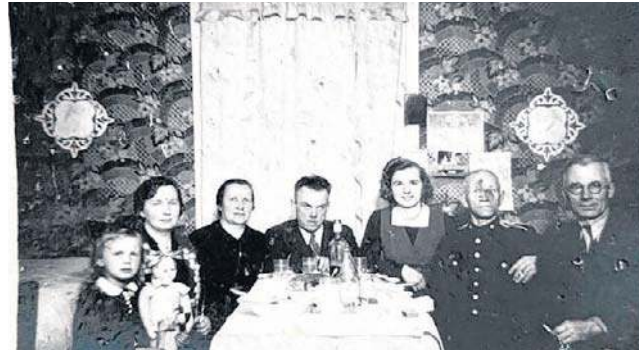
Kto jest widoczny na tej fotografii, kiedy ją zrobiono i do kogo należała?

Z nietypową informacją do redakcji „Dziennika Bałtyckiego” zwrócił się Morski Oddział Straży Granicznej. Otóż na jednej z gdyńskich ulic przechodzień natknął się na... archiwalne zdjęcie. Teraz strażnicy proszą o pomoc w odnalezieniu właściciela fotografii, dla którego zapewne jest to rodzinna pamiątka. Poznajcie te osoby?