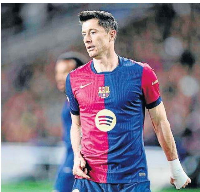
Lewandowski będzie rozmawiał o swojej przyszłości dopiero wtedy, gdy Barca zapewni sobie mistrzostwo

Mistrzostwo Portugalii po kolejnej skromnej wygranej zapewniło sobie FC Porto. „Smoki” wygrały u siebie z niżej notowaną Alvercą (1:0) po голу polskiego obrońcy Jana Bednarka, który przesądził o 31. tytule w bogatej