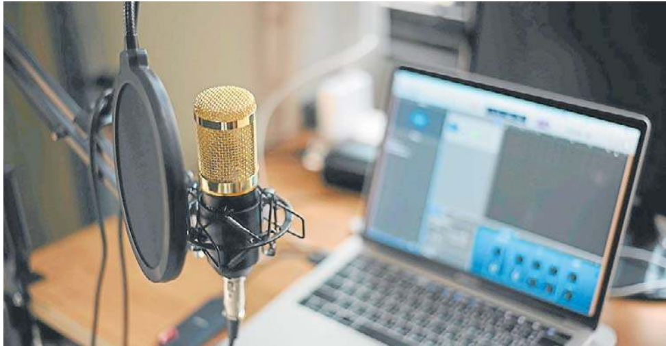
Celem akcji „Mój głos. Moja własność” jest obrona aktorów głosowych, dubbingowych oraz lektorów oraz uzyskanie prawnej i finansowej ochrony dla twórców

- Mamy do czynienia z osobą publiczną, głosem zarabiającą na życie, dla której jest to istotny element identyfikacji i wizerunku. Bez znaczenia po-