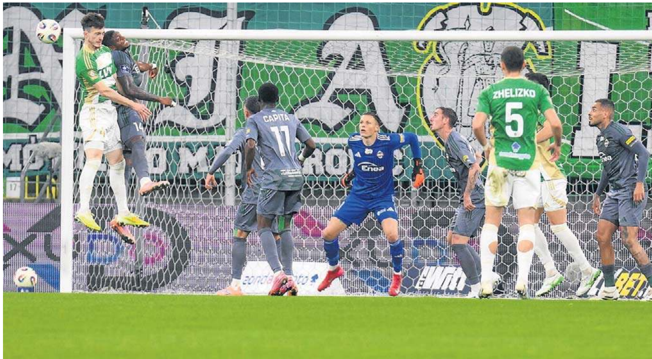
Lechia chce wygrać w Radomiu i zrewanżować się za jesienną porażkę w Gdańsku