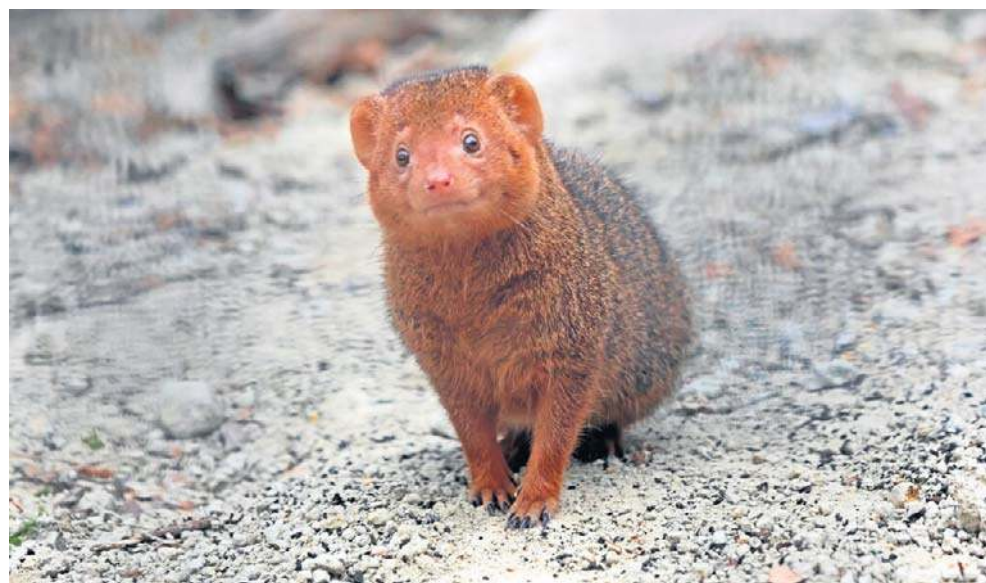
Zwierzęta żywią się głównie pokarmem mięsnym, szczególnie owadami, a także korzeniami, bulwami i owocami