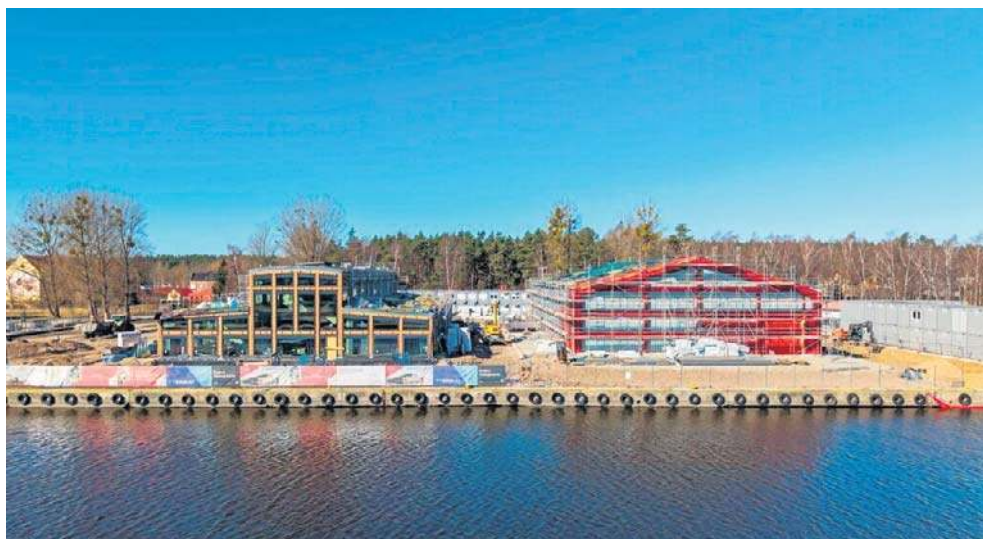
Zaawansowanie budowy bazy serwisowej w Łebie w marcu.

Rozpoczęła się produkcja wież morskich turbin wiatrowych dla projektu Bałtyk 2. Wkrótce na Bałtyku rozpocznie się etap właściwej instalacji, zaczynając od monopali i elemen-