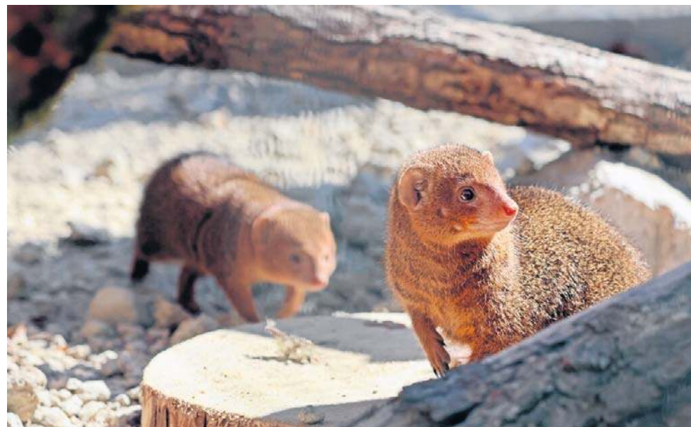
To niezwykle aktywne i inteligentne zwierzęta. Praktycznie cały czas pozostają w ruchu, komunikują się ze sobą i współpracują

niar, kierownik sekcji zwierząt drapieżnych w Gdańskim Ogrodzie Zoologicznym. - Ich interakcje społeczne są złożone, żyją w grupach rodzinnych, a do nas przyjechała grupa kawalerska.