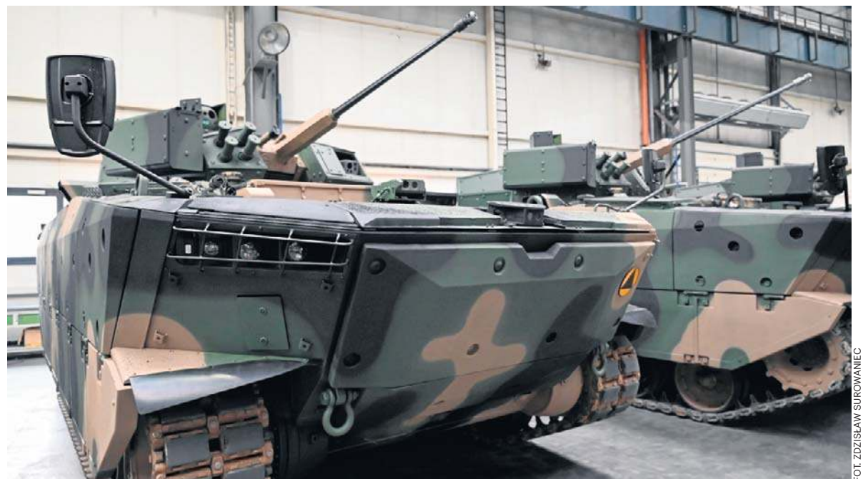
Borsuki są wyjątkowo ciężkie, ważą po 26 ton. Równocześnie są to pojazdy pływające