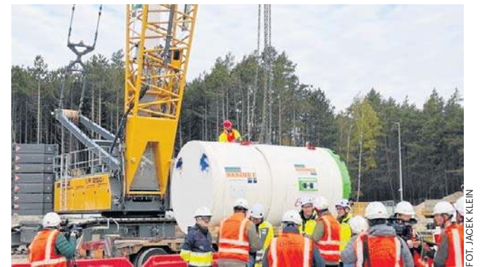
Basia zostanie umieszczona w komorze startowej mikrotunelu. To otwór o głębokości kilku metrów

Kluczową korzyścią, jaką płynie z bezwykopowego przekroczenia strefy przybrzeżnej