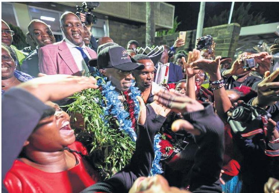
Rekordzista świata Sebastian Sawa został powitany w Kenii niczym narodowy bohater

Przełamanie wyniku 1:55:00 byłoby ogromnym szokiem dla świata nauki i sportu, bo nikt nie jest jeszcze na to gotowy, ale myślę, że już powinniśmy się nim...oswajać. Oczywiście wiem, że najnowsze modele prognostyczne jako limit biologiczny naszego organizmu pokazują czas 1:58.00 na dystansie 42 kilometrów i 195 metrów, ale moim zdaniem to etap przejściowy, a nie prawdziwy kres ludzkich możliwości. Naturalnie, mam świadomość, że aby złamać wskazaną przeze mnie granicę biegacz musi każde 100 metrów pokonać średnio w 16,3 sekundy, a każde 5 kilometrów w 13,37 minuty, czyli każdy kilometr przebiegać o 7 sekund szybciej niż świeżo