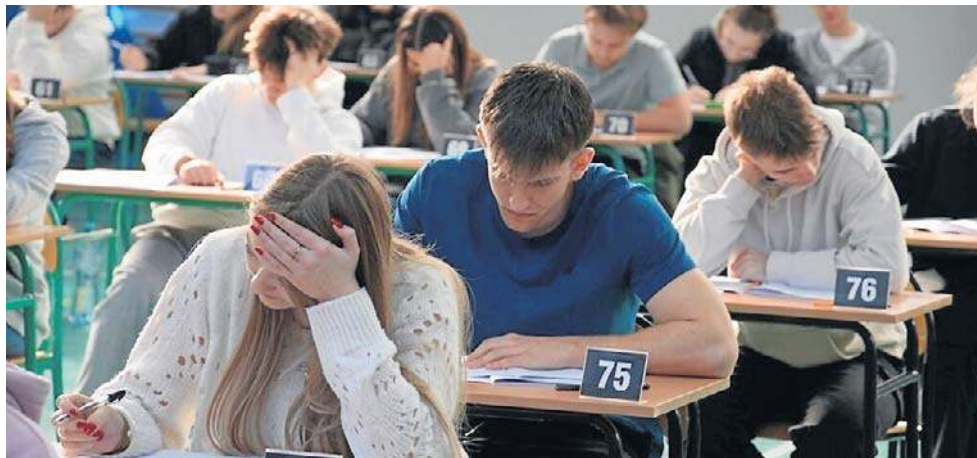
Dzisiaj maturzyści piszą egzamin z języka polskiego. Wśród typowanych w internecie tematów jest pytanie o to, czy jednostka ma obowiązek poświęcenia się dla ogółu

Po egzaminach obowiązkowych rozpocznie się seria egzaminów na poziomie rozszerzonym. Harmonogram obejmuje między innymi następujące daty: 8 maja - biologia (poziom rozszerzony); 11 maja - matematyka (poziom rozszerzony); 12 maja - wiedza o społeczeństwie (poziom rozszerzony); 13 maja - chemia (poziom rozsze-