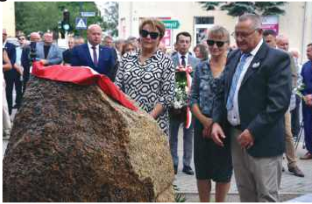
Odsłonięcia pomnika dokonali potomkowie ofiar Wołynia. Na tablicy obelisku umieszczono słowa: „Narody tracąc pamięć, tracą życie” oraz „W hołdzie Ofiarom ludobójstwa dokonanego na narodzie polskim przez ukraińskich nacjonalistów”.

W 82. rocznicę krwawej niedzieli na Wołyniu, przed budynkiem Starostwa Powiatowego w Biłgoraju odsłonięto pomnik poświęcony ofiarom ludobójstwa dokonanego przez ukraińskich nacjonalistów. Kamień i tablica mają przypominać o tragedii z 1943 roku i być symbolem pamięci o tysiącach Polaków zamordowanych tylko dlatego, że byli Polakami.