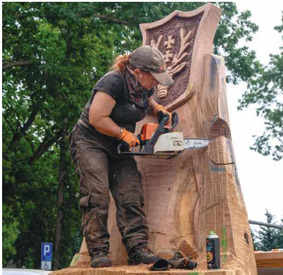
Tron Władysława Jagiełły powstał z pnia zabytkowego dębu „Wiktor”. Autorami dzieła są Andrzej Mirończuk i Natasza Sobczak Art.

– Wykonawcą rzeźbionego fotela królewskiego jest Andrzej