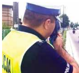
40-latek z Ukrainy został ukarany mandatem w wysokości 2 tys. zł., otrzymał też 14 punktów karnych i stracił prawo jazdy na 3 miesiące.

Tylko jednego dnia policjanci hrubieszowskiej drogówki zatrzymali trzech piratów na drodze z Teratyna (Gmina Uchanie) do Zosina (Gmina Horodło). Wszyscy trzej kierowcy znacząco przekroczyli prędkość dozwoloną w obszarze zabudowanym. Zatrzymani kierowcy stracili na 3 miesiące