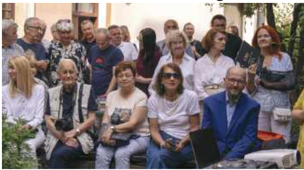
Dawne fotografie, wspomnienia i rozmowy o tym, co Zamość straciła, a co warto ocalić. „Wernisaż z pompą” był spotkaniem z historią miasta zapisaną w obrazach, słowach i emocjach.