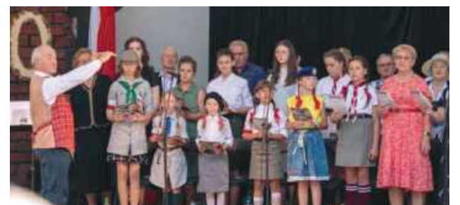
Tomaszów co roku pamięta o rocznicy Powstania Warszawskiego.

W 81. rocznicę wybuchu Powstania Warszawskiego mieszkańcy Tomaszowa Lubelskiego spotkają się w Parku Miejskim, by oddać hołd bohaterom jednej z najważniejszych kart polskiej historii. O godz. 16:45 rozpocznie się uroczysty koncert pieśni powstańczej i patriotycznej, który wspólnie wykonają Chór Tomaszowiaczy oraz uczestnicy Warsztatów