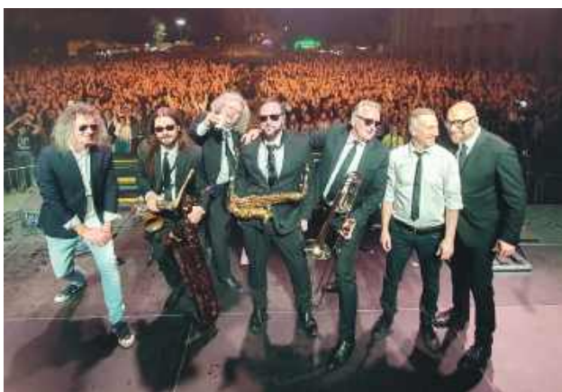
Jedną z gwiazd Chłopomanii będzie zespół Poparzeni Kawą Trzy.

Wydarzenie jest nową inicjatywą społeczno-kulturalną, organizowana przez Młodzieżową Radę Miasta Zamość, przy współpracy z Miastem Zamość, Stowarzyszeniem „Kultura dla Zamościa” oraz ZDK. Jego celem jest promocja dziedzictwa kulturowego polskiej wsi, budowanie więzi międzypokoleniowych oraz łączenie tradycji z nowoczesnością. Organizatorzy zapraszają całe rodziny, turystów oraz wszystkich miłośników kultury ludowej i dobrej zabawy. – Zależy nam, by program wydarzenia był atrakcyjny i zróżnicowany – zarówno dla dzieci, młodzieży, jak i osób starszych. Łączymy folklor z nowoczesnością, lokalność z profesjonalizmem, edukację z rozrywką. Zamojska Chłopo-