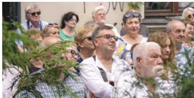
„Wernisaż z pompą” był niezwyklej podróżą do korzeni miasta.