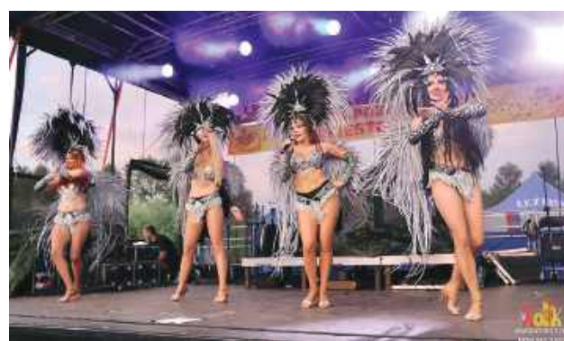
Zespół Maraquja zaprezentował znane i lubiane przeboje w nowych tanecznych aranżacjach.