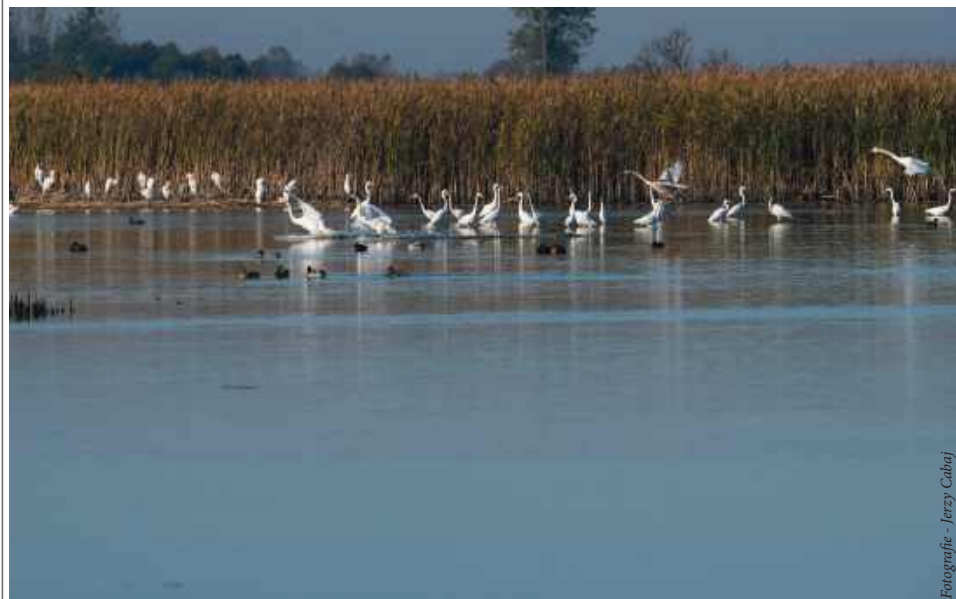
Fotografie - Jerzy Gabaj

Warto zatrzymać się na terenie gminy Łaszczów na dłuższą oraz