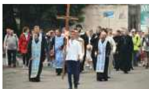
Piesza Pielgrzymka z Beża do Częstochowy wyruszy 31 lipca.

31 lipca rozpocznie się 43. Piesza Pielgrzymka Zamojsko-Lubaczowska na Jasną Górę – jedno z najważniejszych wydarzeń religijnych w regionie. Tegoroczna edycja odbędzie się pod hasłem „Pielgrzymi Nadziei”, a wyruszą w niej pątnicy z wielu miejscowości diecezji – także po raz 15. z Beża, po stronie ukraińskiej.