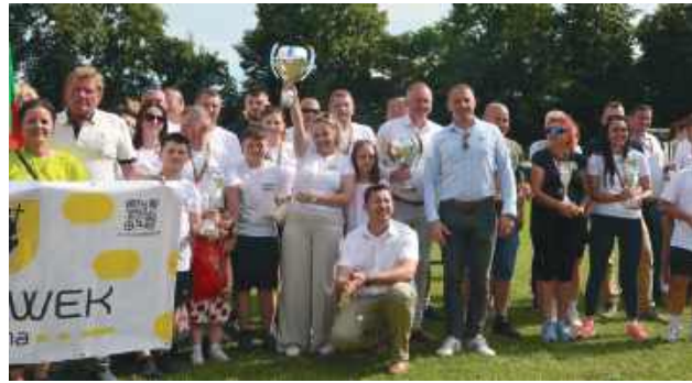
Udział w igrzyskach wzięło w tym roku dziesięć gmin. Rywalizacja była bardzo zacięta

Drużyny rywalizowały także w grach zespołowych: piłce nożnej kobiet i mężczyzn, siatkówce kobiet i mężczyzn oraz przeciąganiu liny. Dodatkowe punkty można