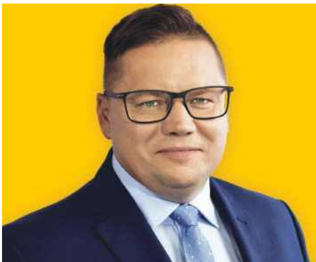
Posel Polski 2050 Sławomir Ćwik stwierdził, że „każdy, kto łączy kropki, wie dlaczego została i tyle”. – Każdy, kto interesuje się polityką, niech połączy kropki – skomentował utrzymanie przez Barbarę Nowacką stanowiska ministra edukacji po rekonstrukcji rządu.

„Od Polski 2050 oczekiwałam wyższych standardów” – tak minister edukacji Barbara Nowacka zareagowała na dwuznaczne słowa zamojskiego posła Sławomira Ćwika na temat tego, dlaczego utrzymała stanowisko po rekonstrukcji rządu. Poseł dwukrotnie prostował w piątek swoje słowa. Nowacka napisała, że oczekiwała „przeprosin jej rodziny i rodziny premiera”.