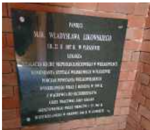
Tablica powstała na Rotundzie.