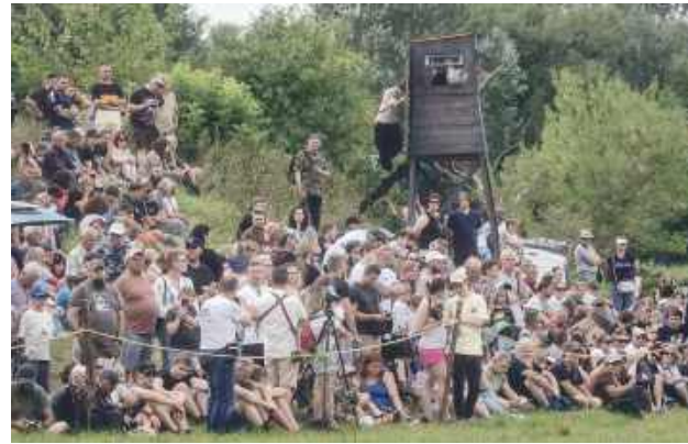
Publiczność też dopisała, w tym roku widzów w Czumowie było zdecydowanie więcej niż na dwóch poprzednich rekonstrukcjach.

– Moim pomysłem było ukazanie drogi Bolesława Chrobrego do Korony. Stąd tytuł in-