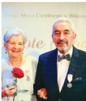
Złote Gody świętowały pary, które związek małżeński zawarły w 1974 roku.

Prezydent Rzeczypospolitej Polskiej uhonorował me-