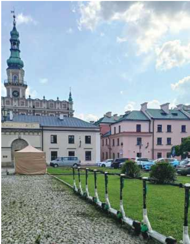
Zmiany będą wprowadzane w przyszłym miesiącu.