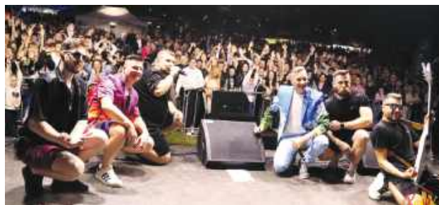
Na wieczornych koncertach gwiazd bawiły się tłumy.

Dalsza część programu należała do muzyki. Na scenie zaprezentowali się Powersi , Lejdi M oraz Malibu , zachęcając do wspólnej zabawy i skutecznie rozgrzewając publiczność przed koncertem gwiazdy wieczoru, czyli zespołu