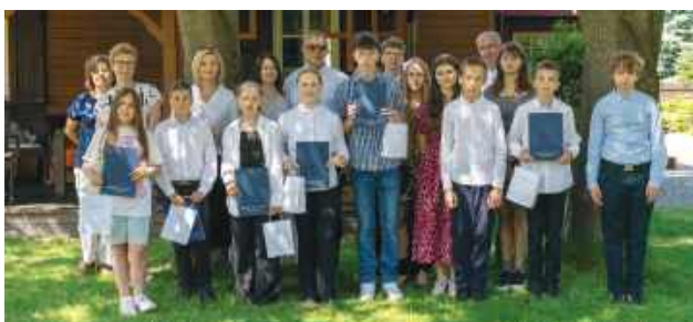
Tegoroczni stypendyści Fundacji Falków.

Fundacja Falków istnieje od 6 lat. Jej celem jest prowadzenie działalności edukacyjnej i kulturalnej, zwłaszcza w zakresie wspierania i pomocy w przedsięwzięciach edukacyjno-kulturalnych na rzecz dzieci i młodzieży, a także wspieranie dzieci i młodzieży w trudnej sytuacji życiowej. Fundacja realizuje swoje cele głównie