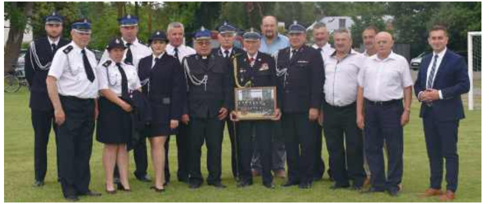
Jedno z pamiątkowych zdjęć podczas jubileuszu 120-lecia OSP Bełżec I.

OSP Bełżec I przez cały okres swojego istnienia nie tylko gasiła pożary i ratowała życie, ale także kształtowała postawy obywatelskie. Brała udział w wojnie obronnej 1939 roku, wspierała partyzantkę w czasie okupacji,