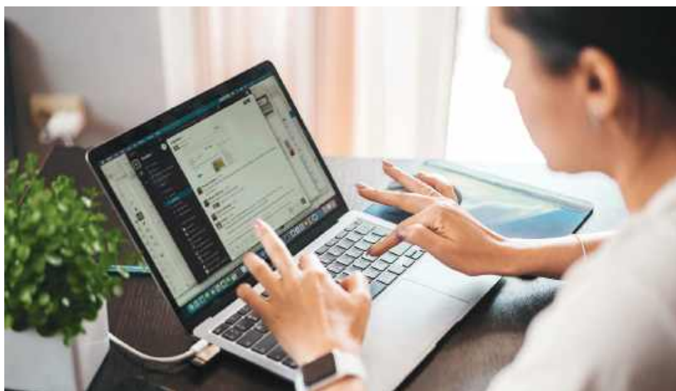
Praca zdalna zmieniła nasze podejście do przestrzeni mieszkalnej, a rosnąca świadomość ekologiczna i technologiczna napędza popyt na nieruchomości energooszczędne i z inteligentnymi rozwiązaniami.

Jednym z najbardziej widocznych trendów jest rosnące zapotrzebowanie na większą przestrzeń. Kiedy dom stał się jednocześnie biurem, szkołą i centrum rozrywki, każdy dodatkowy metr kwadratowy zyskał na wartości. Kupujący, którzy