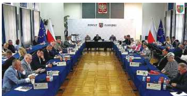
Radni powiatu zamojskiego przyjęli stanowisko w sprawie zatrzymania napływu nielegalnych imigrantów.

Rada Powiatu w Zamościu wyraża swoje zaniepokojenie wobec napływu nielegalnych imigrantów, czyli osób z krajów spoza Unii Europejskiej przez granice Unii Europejskiej bez spełnienia wymogów prawnych dotyczących wjazdu i pobytu w jednym lub kilku krajach wspólnoty – czy-