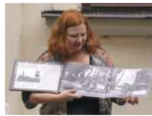
Album obejmuje 40 rozdziałów, plus dwa piękne alonże (element książki w postaci zgiętego, połączonego z wkładem paska, który po rozłożeniu wystaje poza obrys – przyp. red.) – mówi Renata Jarecka , współautorka albumu.

– Są w nim zdjęcia, pokazujące historię Zamościa i jego mieszkańców. Fotografie są bardzo różne, zarówno zdjęcia studyjne najstarszych zamojskich fotografów, jak i zdjęcia reportażowe sprzed II wojny światowej. Są także fotografie