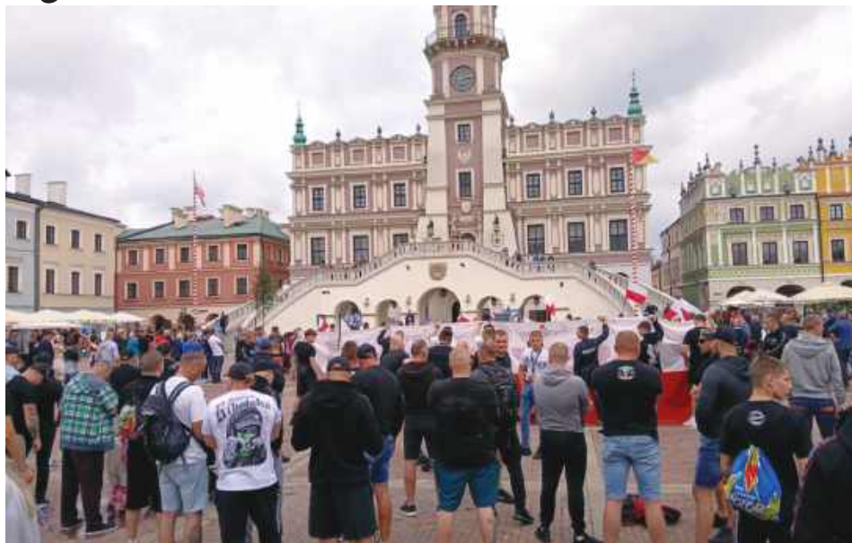
W wiecu „Stop imigracji!” wzięło udział około 200 osób.

Nagranie z wiecu zorganizowanego na Rynku Wielkim w Zamościu przez Konfederację oraz środowiska narodowe można było zobaczyć w internecie i na tej podstawie prokuratura wszczęła śledztwo z urzędu. Dotyczy ono wystąpienia działaczki Młodzieży Wszechpolskiej, która mówiła m.in. o obawach związanych z osobami o innym kolorze skóry przyjeżdżającymi do Zamościa,