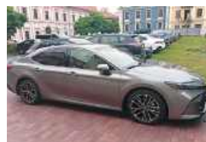
... i obecne auto w miejskiej flocie.

MZK za rządów jego poprzednika Andrzeja Wnuka. „Miasto wynajmowało ją od spółki za 3 tysiące złotych miesięcznie. Gdy ją kupowano – 6 lat temu – kosztowała ponad 160 tys. zł brutto (145 tys. zł netto). To było auto z najbogatszym wyposażeniem w tym modelu: silnik z turbodoładowaniem o mocy 272 KM, napęd na cztery koła, przyspieszenie prawie jak w porście (setka w 5,5 sek.) i wiele innych bajerów” – czytamy.