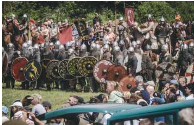
W tegorocznej rekonstrukcji Bitwy nad Bugiem wystąpiło ponad pół tysiąca rekonstruktorów z całej Polski i zagranicy.

– Jak to zwykle w życiu bywa doprowadziła do tego polityka, jaką na początku XI w. prowadzili Bolesław Chrobry i Jarosław Mądry. Chrobry podjął interwencję na Ruś, aby na kijowskim tronie osadzić swojego zięcia Światopelka. Ten był bratem Jarosława Mądrego. Światopelk poślubił nieznaną z imienia córkę Bolesława Chrobrego, ale to Jarosław wygrał walkę o tron kijowski. Bolesław chciał go z tego tronu zdjąć i osadzić tam swojego zięcia. Wyruszył na Ruś. W tym samym czasie Jarosław Mądry, wyruszył ze swoimi wojskami na Lachy. Obydwie strony bardzo się zdziwiły, gdy spotkały się na wysokości Grodu Wołyń, po dwóch stronach Bugu. To było nieoczekiwane spotkanie wojsk polskich z ruskimi. To nie