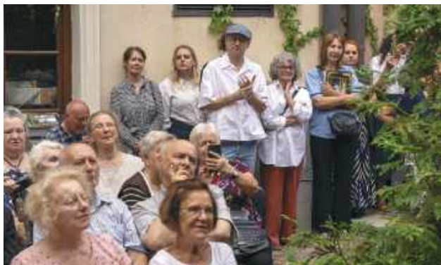
Dziedziniec wokół staromiejskich kamienic przy Muzeum Fotografii był wypełniony do ostatniego miejsca.