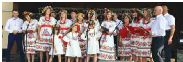
Na scenie zaprezentowały się zespoły o szerokim wachlarzu stylów muzycznych – od dostojnej orkiestry dętej, przez śpiewaków ludowych, aż po energiczne zespoły rockowe, które porwały publiczność do wspólnej zabawy.

Festyn w Goraju, który odbył się 20 lipca był prawdziwym świętem lokalnej społeczności – pełnym muzyki, tańca, smaków i wzruszeń. Wydarzenie zgromadziło setki uczestników i po raz kolejny udowodniło, jak żywa i różnorodna jest kultura gminy.