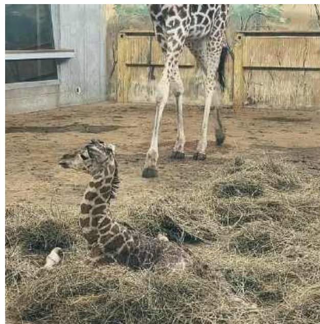
Za 3-4 tygodnie maluch sam będzie próbował coś podjadać, ale do 9-12 miesięcy życia podstawowym pokarmem będzie dla niego mleko matki.

Dumny tata Mugambi obserwuje malucha z boku, w którym został oddzielony. Jest bardzo zainteresowany sytuacją i już wkrótce dołączy do rodziny. – Za 3-4 tygodnie maluch sam będzie próbował coś podjadać, ale do 9-12 miesięcy życia podstawowym pokarmem będzie