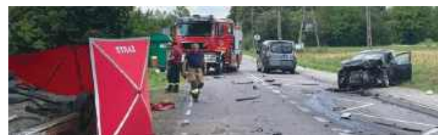
Citroenem kierowała 64-latką z gminy Sitno. Życia kobiety nie udało się uratować.