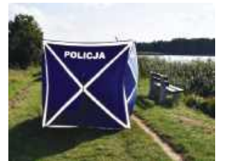
50-letni mieszkaniec Zamościa utonął w miejskim zalewie.

Policjanci z Zamościa wyjaśniają okoliczności utonięcia 50-latka, którego ciało zostało w poniedziałek 21 lipca odnalezione w zalewie miejskim. Poprzedniej nocy mężczyzna miał bawić się na dyskotecce.