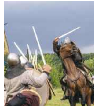
Rekonstruktorzy i organizatorzy bardzo dbają, by odtworzenie tamtych czasów było jak najwierniejsze.

Wójt gminy Hrubieszów osobiście brał czynny udział we wszystkich czterech dotychczasowych rekonstrukcjach Bitwy nad Bugiem. Pierwszy raz w 2018 r. na błoniach Hrubieszowa. Wtedy był jeszcze burmistrzem tego miasta. A po-