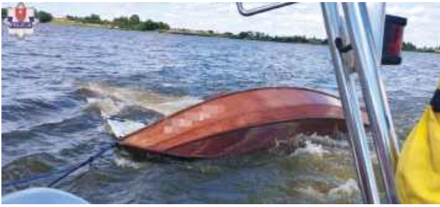
Policyjny wodniak z Nielisza wspólnie z bosmanem – ratownikiem zamojskiego WOPR uratowali małżeństwo, którego żaglówka przewróciła się na zalewie w Nieliszu.

W środę 23 lipca policjanci z Posterunku Policji w Nieliszu otrzymali zgłoszenie, że na zalewie w Nieliszu doszło do przewrócenia się jachtu żaglowego. Policyjny wodniak natychmiast zareagował. O zdarzeniu powiadomił bosmana Wodnego Ochotniczego Pogotowia Ratunkowego i wspólnie z nim wykorzystując jednostkę pływającą WOPR, ruszył na pomoc. Szybko zlokalizowano miejsce, gdzie doszło do zdarzenia. Dopływając