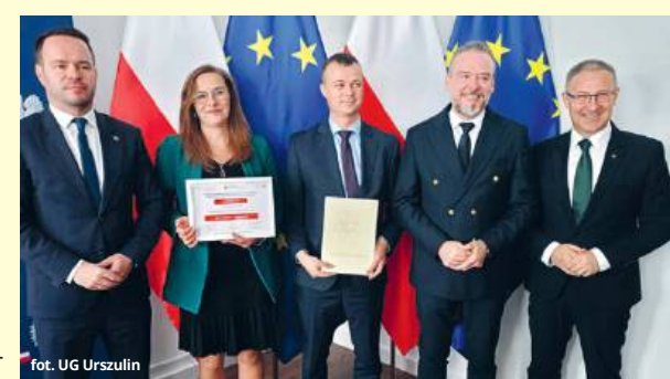
fol. UG Urszulín

Inwestycja zostanie zrealizowana w 2026 roku w ramach Rządowego Programu Rozwoju Północno-Wschodnich Obszarów Przygranicznych na lata 2024-2030. Wysokość dofinansowania to 1 999 779,20 zł, co pokrywa aż 79,99% kosztów. Wkład własny gminy to 500 257,30 zł. Podpisanie umowy miało miejsce w obecności woje-