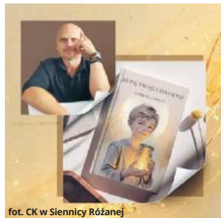
fol. CK w Siennicy Różanej

Pisanie jest dla niego drogą – osobistą, szczerą, wypływającą z wewnętrznego impulsu. „Coś puka i mówi: napisz to” – zdradza autor. Jego proza przenosi czytelnika w przestrzeń emocji, dziecięcej wrażliwości i auten-