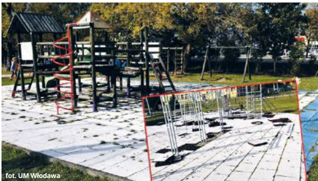
fol. UM Włodawa

WŁODAWA Samorząd miasta pozyskał kolejne środki na rozwój infrastruktury rekreacyjnej. Tym razem do Włodawy trafi 500 tys. zł z Planu Strategicznego dla Wspólnej Polityki Rolnej na lata 2023-2027.