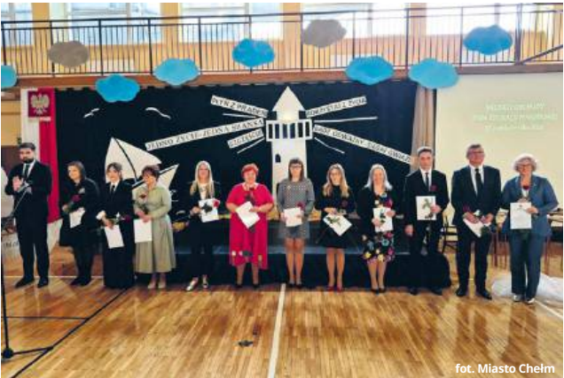
fol. Miasto Chełm

CHEŁM W środę, 15 października, w Szkole Podstawowej nr 6 w Chełmie odbyła się uroczystość z okazji Miejskiego Dnia Edukacji Narodowej. Była to okazja, by uhonorować nauczycieli i dyrektorów chełmskich placówek oświatowych za ich codzienną pracę, zaangażowanie i pasję w wychowaniu młodego pokolenia.