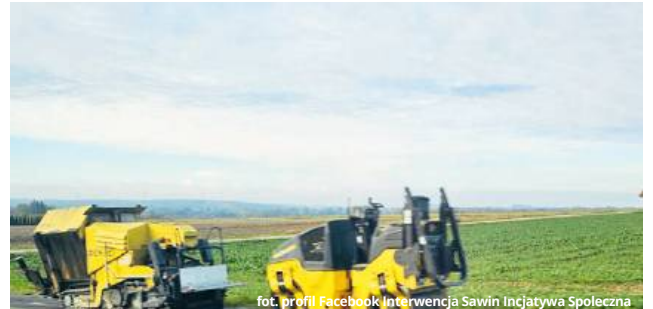
Na nowy asfalt wykładane są kolejne warstwy. Czy to dobre rozwiązanie?

To prawda – do naszego urzędu spływa mnóstwo pytań i uwag dotyczących jakości wykonywanych prac. Chciałabym jednak zapewnić, że dokładamy wszelkich starań, aby ta inwestycja została zakończona i odebrana tak, jak należy. Wykonawca już 26 września zgłosił nam gotowość do przeprowadzenia odbioru końcowego, ale nie przyjęliśmy tego zgłoszenia ze względu na uwagi mieszkańców i nasze obserwacje. Zastrzeżenia miał też inspektor nadzoru. My, jako gmina, mamy obowiązek przyjąć tylko