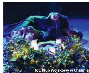
fol. Klub Wojskowy w Chełmie

strzowski sposób oddaje emocjonalną głębię postaci, zabierając widzów w intymną podróż przez lęki, pragnienia i odkrycia głównej bohaterki. Monodram staje się nie tylko teatralnym doświadczeniem, ale także zaproszeniem do refleksji nad własną drogą i siłą kobiecej duchowości.