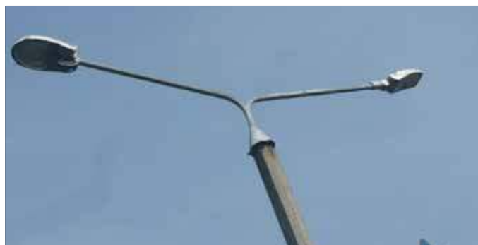
Lampy na zniszczonych słupach

z Tauronem, jednak – jak mówi – brakuje informacji zwrotnej. Maile mieszkańców i radnych trafiają do spółki, ale odpowiedzi jak nie było, tak nie ma.