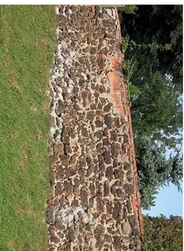
Mur cmentarny z XVIII wieku (dominanta)

Określenie „pod płótem” dzisiaj używane jest już relatywnie rzadko. Dawniej było wszak zwrotem dość powszechnym, a dotyczyło pochówku zmarłych. Jeśli mówiono, że ktoś powinien zostać pochowany pod płótem albo tam właśnie pochowany został, to sformułowanie takie miało charakter stygmatyzujący, niemalże pogardliwy. Kojarzono to z „pochówkiem” chociażby zwierząt. Często mówiono bowiem, że kogoś pochowano pod płótem „jak psa”.