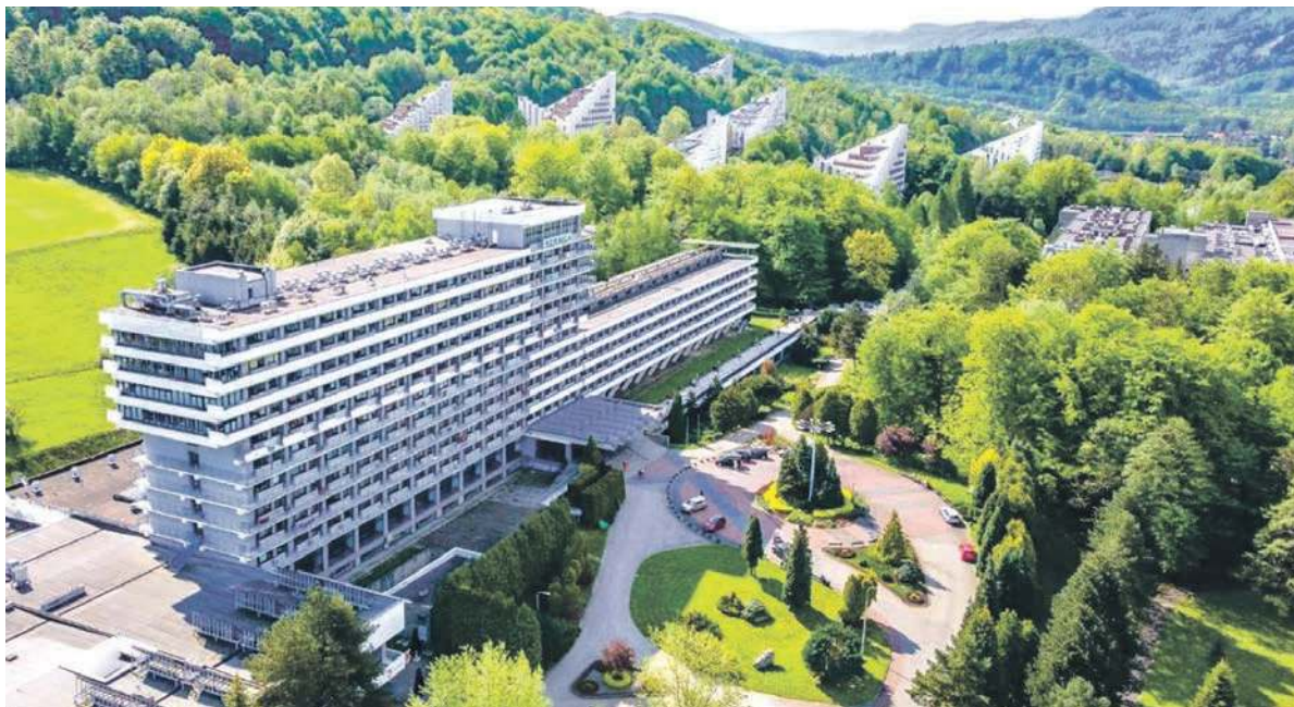
Wiele sanatoriów działa na przykład w Ustroniu

BYTOM. SANATORIA, ROZSŁAWIONE DZIĘKI TELEWIZYJNEMU SERIALOWI, CIESZĄ SIĘ WIELKĄ POPULARNOŚCIĄ. I TO NIE TYLKO DLA TEGO, ŻE KWITNIE TAM BOGATE ŻYCIE TOWARZYSKIE. TO MIEJSCE, GDZIE PRZED W SZYSTKIM PODREPERUJEMY SWOJE ZDROWIE, ODPOCZNIEMY I W DODATKU PRAWIE NIC ZA TO NIE ZAPŁACIMY.