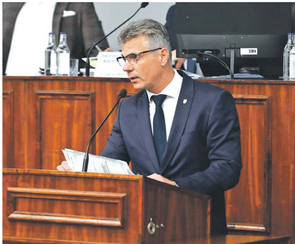
Prezydent Mariusz Wołosz nie miał problemu z uzyskaniem absolutorium

W ciągu ostatnich 12 miesięcy ruszyły też ważne przedsięwzięcia drogowe. Chodzi między innymi o przebudowę ul. Nickla i Tysiąclecia oraz wiaduktu oddzielającego Szombierki od Bobrka. Prócz tego wykonano termomodernizację Przedszkola Miejskiego nr 9 w Szombierkach, reaktywowano nieczynny od 22 lat basen w łagiewnickiej Szkole Podstawowej nr 28 oraz