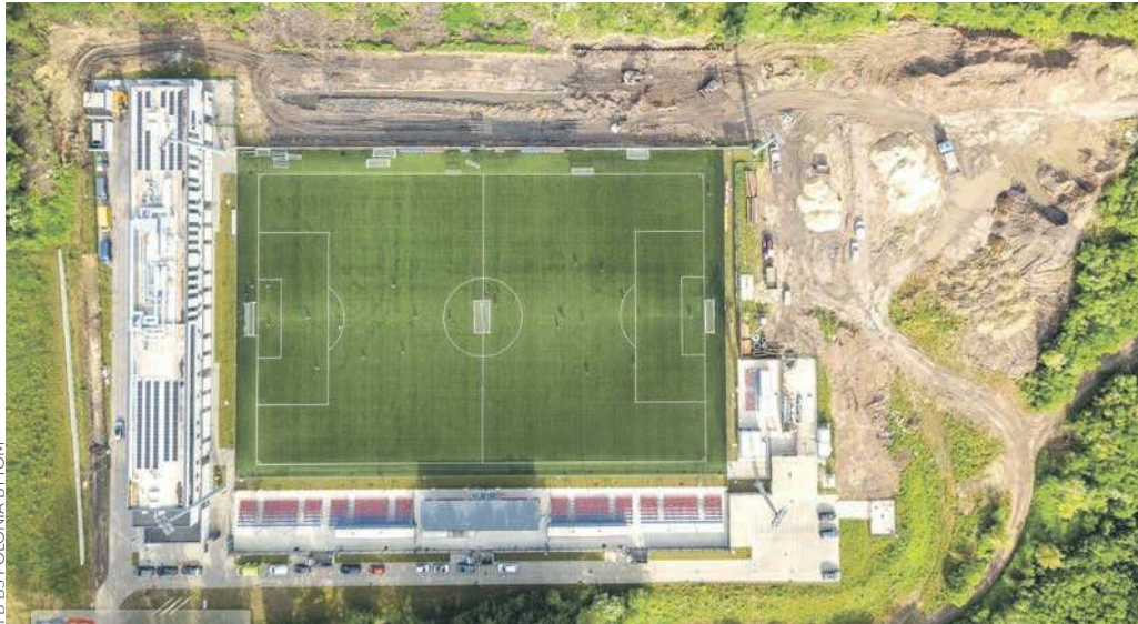
Przebudowa boiska Polonii trwa. Pierwszy mecz dopiero 9 lub 10 sierpnia

BYTOM. ZALEDWIE KILKANAŚCIE DNI ODPOCZYNKU MAJĄ PO ZAKOŃCZENIU ROZGRYWEK PIŁKARZE POLONII BYTOM. JUŻ 23 CZERWCA WRÓCĄ DO TRENINGÓW, A POTEM CZEKA ICH SERIA SPOTKAŃ SPARINGOWYCH. WIADOMO: DO WYSTĘPÓW W BETCLIC 1. LIDZE TRZEBA SIĘ SOLIDNIE PRZYGOTOWAĆ. TERMINARZ JEST JUŻ ZNANY, NASI ZACZNĄ OD TRZECH WYJAZDÓW.