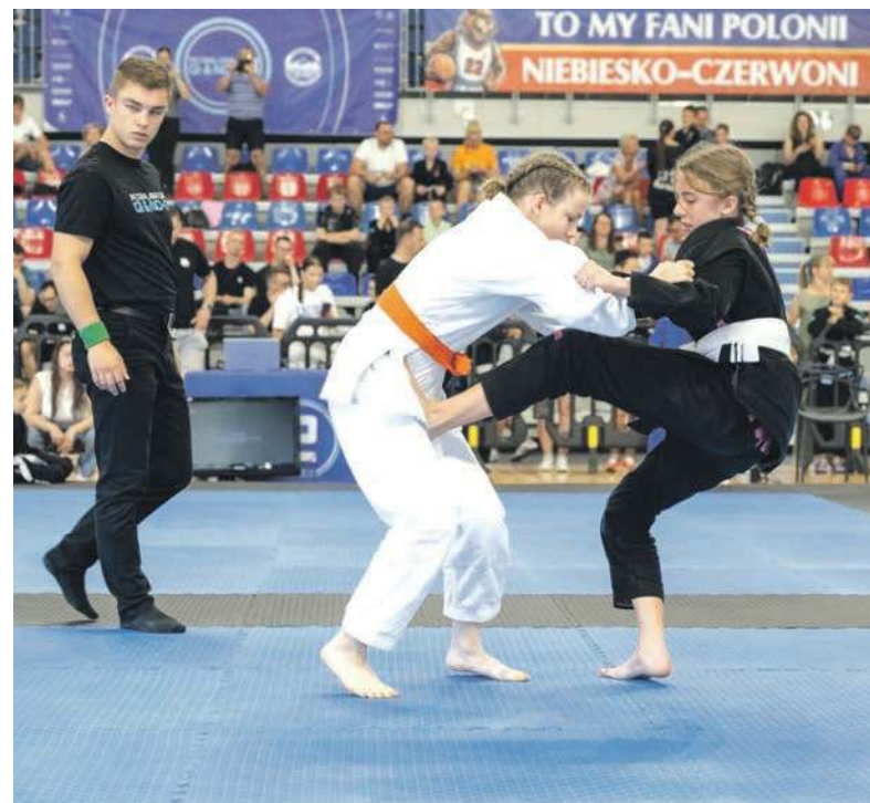
Emocji nie brakowało, wiele pojedynków było widowiskowych

Jiu jitsu jest niezwykle widowiskową dyscypliną. Uczestnicy walk nie skupiają się na ataku, ponieważ głównym celem pojedynku jest rozładowanie i zatrzymanie siły przeciwnika. To sport, który wymaga przede wszystkim dużej sprawności fizycznej i szybkości, ale także umiejętności logicznego myślenia i sprytu. W jiu jitsu stosuje się różnego rodzaju dźwignie, duszenia oraz rzuty. ■