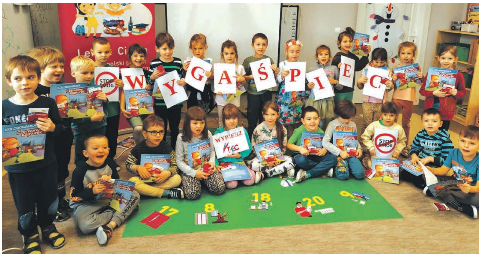
Dzieci na LC otrzymują książeczki lub kolorowanki...

Zainteresowanie lekcjami jest bardzo duże, a o ich jakości i standardzie