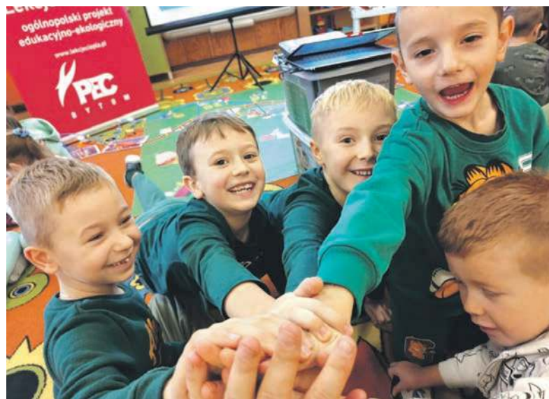
Zajęcia są pełne ciepła i pozytywnej energii!

świadczą opinie nauczycieli, których podopieczni biorą w nich udział.