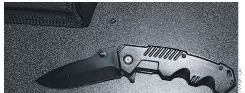
Nóż został zabezpieczony przez policjantów

Na miejsce przybyła także załoga pogotowia, celem udzielała pomo-