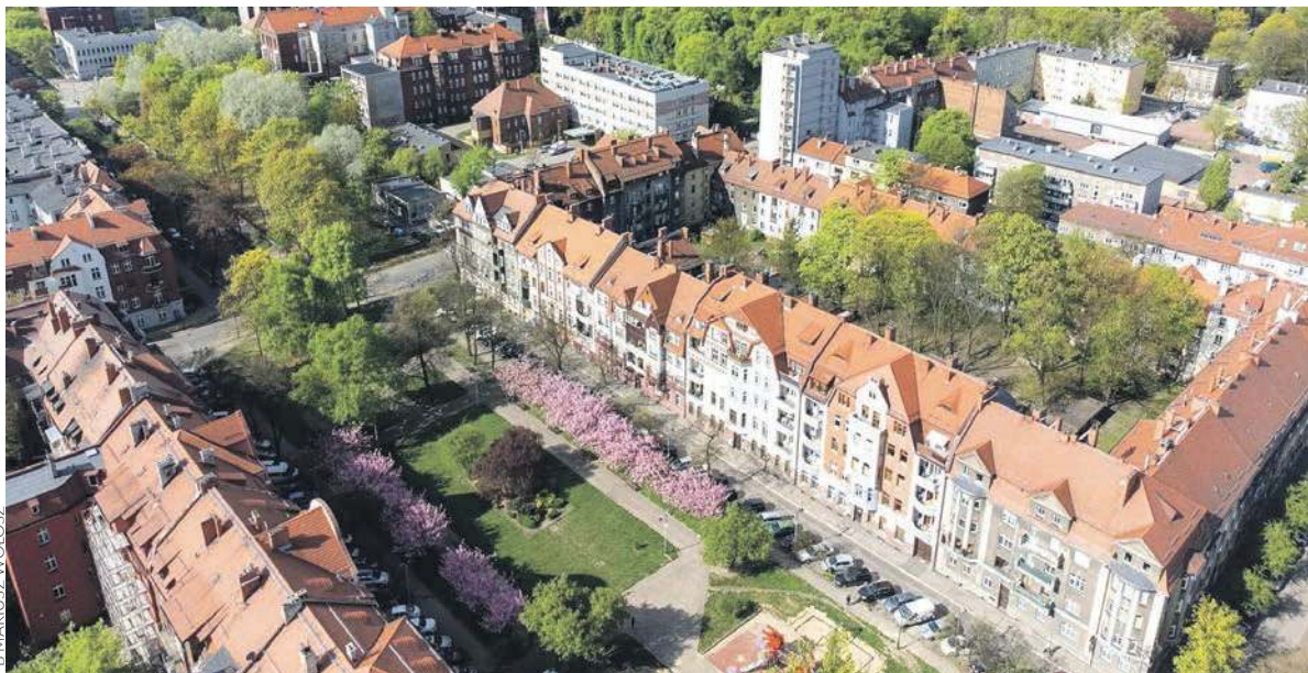
Bytom bez wątpienia mocno ucierpiał wskutek działalności kopalni