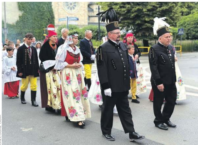
Procesja Bożego Ciała przeszła między innymi ulicami Rozbarku

W wielu parafiach w gronie uczestników procesji Bożego Ciała znalazły się osoby w tradycyjnych śląskich