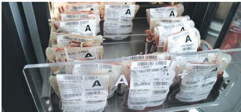
Krew musi być przechowywana w ściśle określonych warunkach