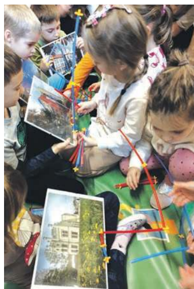
Wspólnie budują system ciepłowniczy...