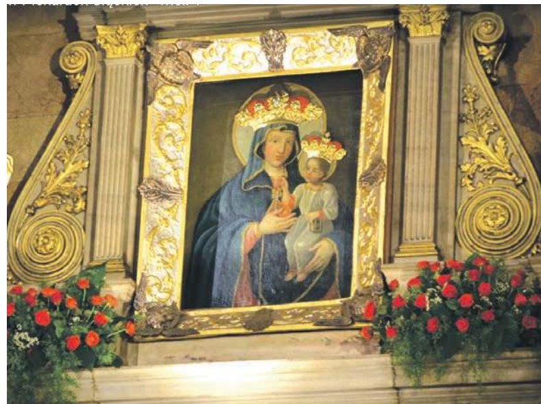
Nojswiyntszo Paniynka z Piekor

Mówić sobie po imieniu, mówić na „ty”, to po naszymu godać sie za jedno. I tak jak do starszych i zocniejszych Ślonzoki odnoszom sie ze szacunkim, bo majom łonych we zocy, to na równym poziomie wartko przechodzom na „ty”, czyli godajom sie za jedno. Ino sie poznajom, a juz skrocajom dystans. I tu musa wom pedzić ło jednym fest ważnym zjawisku. Nawet bych sie ło nym niy pomysłał, keby fto inkszy