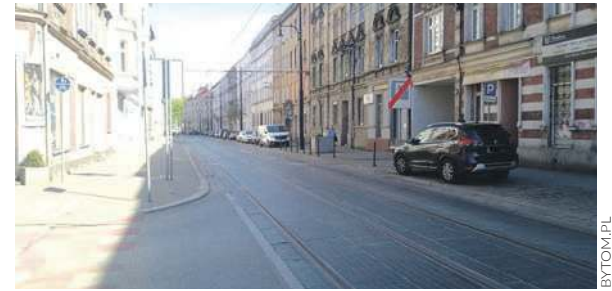
Kierowcy pytają, kiedy Katowicka będzie całkiem przejezdna

A skoro drogą zawładną robotnicy, to znaczy, że musimy się liczyć ze zmianą organizacji ruchu. Na wspomnianym odcinku Katowicka będzie nieprzejezdna. Jakies objazdy? Oczywiście: od strony skrzyżowania ulicy Matejki z Katowicką dojazd będzie możliwy ulicami: Matejki - Katowicką - Głęboką, Krakowską,