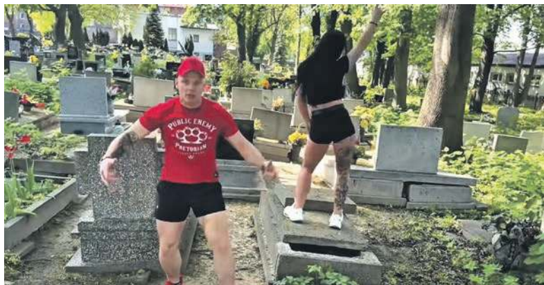
Trudno pojąć tego typu zachowanie

Raper BoBo udostępnił na platformie YouTube teledysk do utworu zatytułowanego... „Je... te k...”. To już sporo mówi o jego „twórczości”, ale jak się okazuje nie wszystko. Używając niemal wyłącznie wulgaryzmów wykonawca rozlicza się z osobami, które donosiły na niego i przez nie miał trafić za kraty. Agresywnej treści towarzyszy teledysk kręcony w różnych miejscach. Na kolejnych kadrach widzimy między innymi obdarte mury, brudne podwórka, ściany umazane w grafitti.