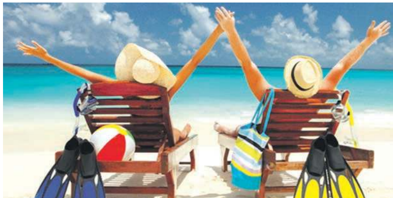
Urlop się należy i basta!

Do okresu pracy, od którego zależy wymiar urlopu, wlicza się ukończenie: zasadniczej lub innej równorzędnej