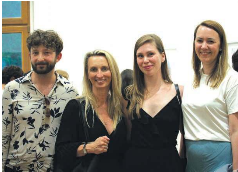
Pałac w Miechowicach po raz kolejny dał szansę pokazania się miłośnikom malarstwa

Potem przyszedł czas na zajęcia przy sztalugach. Stypendystka przekazywała uczestnikom warsztatów swoją wiedzę, uczyła technik malarskich oraz pomagała w tworzeniu. Nie zapomniała też o tym, by namówić ich do eksperymen-