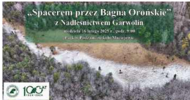
Bagna Orońskie, dawniej zwane „Lasem Duże Błoto”, to prawdziwy raj dla miłośników przyrody

Nadleśnictwo Garwolin zaprasza na kolejny spacer przyrodniczy po lasach garwolińskich. - Z okazji Międzynarodowego Dnia Mokradeł zapraszamy na niezwykłą wyprawę po jednym z najbardziej tajemniczych zakątków Mazowsza! - piszą organizatorzy spaceru, który odbędzie się w niedzielę, 16 lutego.