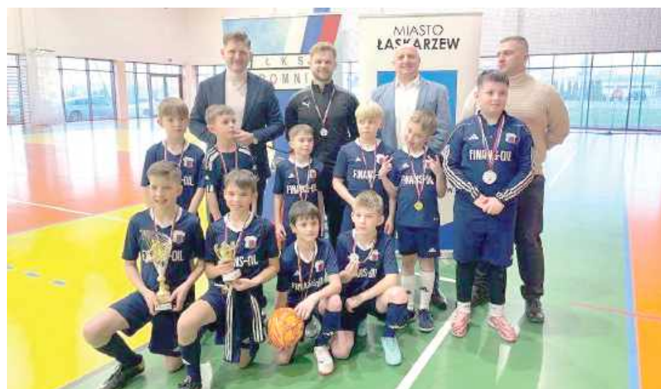
Reprezentanci Promnika Łaskarzew okazali się bardzo niegościnni. Wygrali organizowany przez ich klub turniej