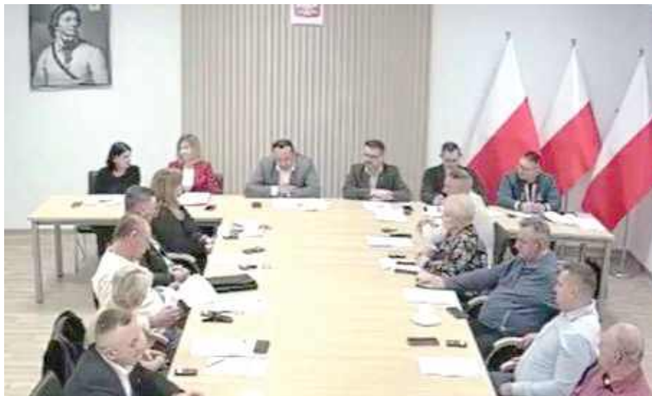
Burmistrz zdał radnym sprawozdanie

W Starostwie Powiatowym w Garwolinie zostało zorganizowane spotkanie ws. opracowania dokumentacji projek-