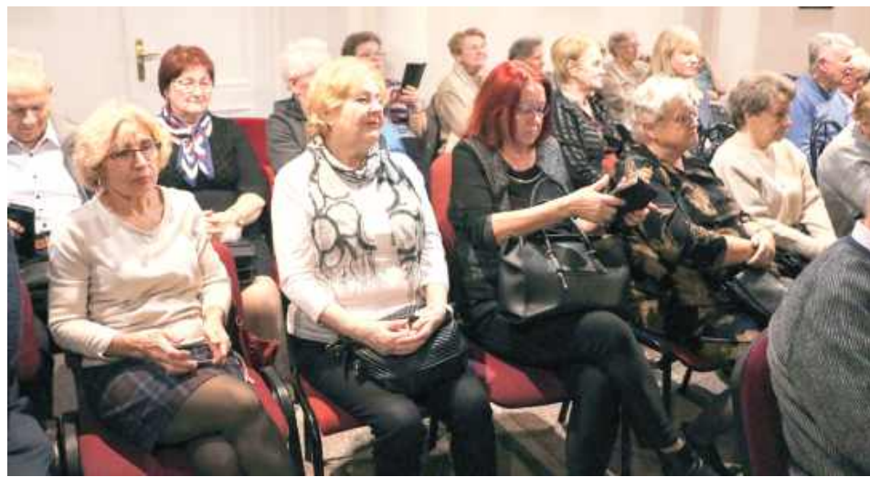
Na spotkaniu zjawili się wielu mieszkańców Garwolina

po prostu przyjemnie się słucha. Spotkanie było też wyjątkowe pod względem zaangażowania widzów. Przybyli słuchacze chętnie dopowiadali wątki do wspomnianych historii, w lot łapali przygrywane na gitarze nuty i entuzjastycznie włączali się w śpiewanie dawnych przebojów. Sala wybrzmiewała więc kultową „Mexicaną”, radiowym