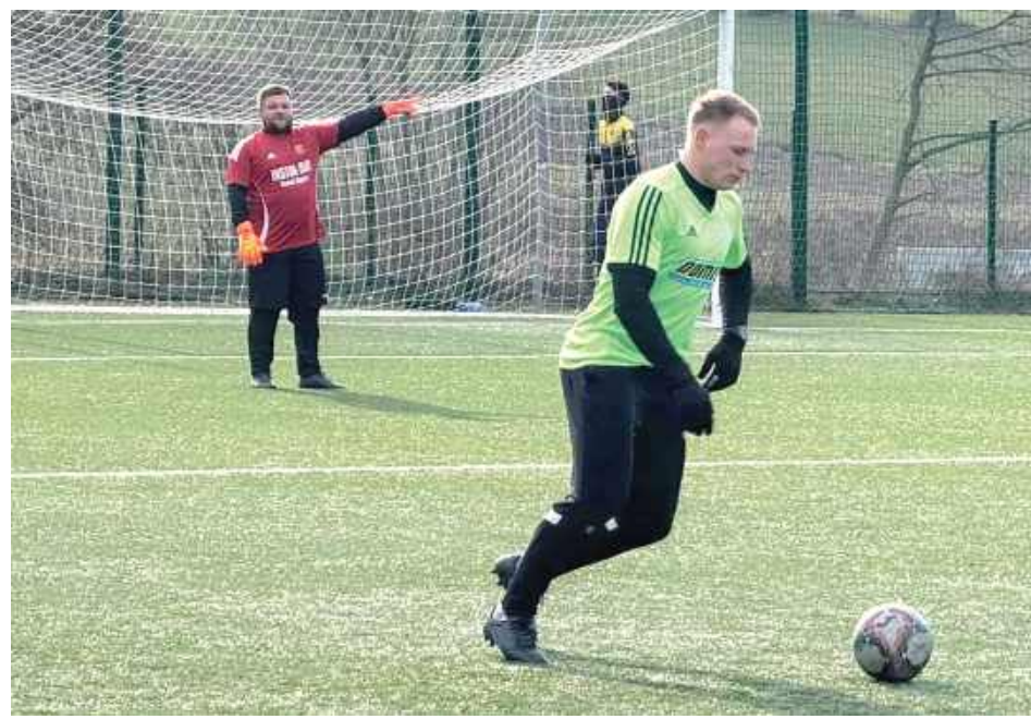
W trzecim sparingu tej zimy Amur pokonał rywala z siedleckiej klasy „A” Wilgę Miastków Kościelny 3:1

Starcie Amura Wilga i Wilgi Miastków Kościelny zapowiadało się bardzo ciekawie, wszak obydwie zespoły grają na tym samym poziomie rozgrywkowym, a jedynie w innych okręgach mazowieckich klas „A”. Ci pierwsi po rundzie jesiennej zajmują wysokie ósme miejsce, choć z niewielką przewagą nad drużynami wciąż zagrożonymi spadkiem. Z kolei zawodnicy Wilgi wciąż w czynny sposób mogą włączyć się do walki o awans do