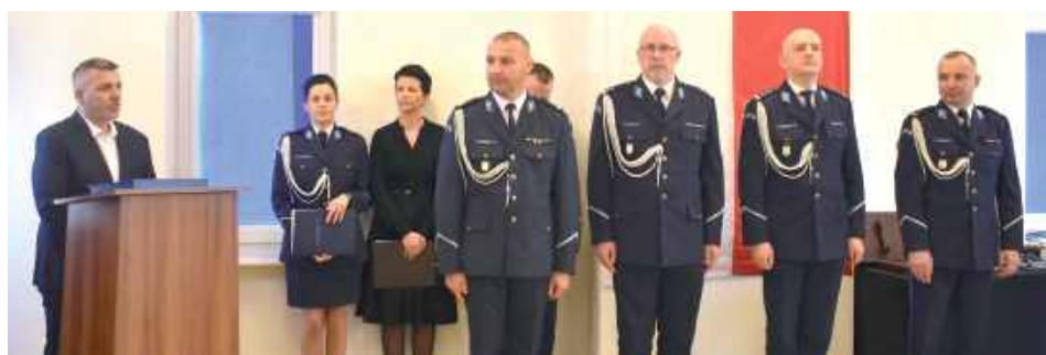
Wzniosłym punktem uroczystości była ceremonia pożegnania i przywitania ze sztandarem Komendy Powiatowej Policji w Garwolinie