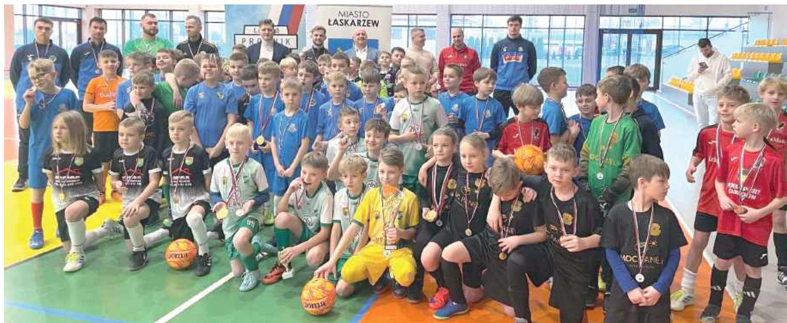
W Promnik Cup 2025 rocznika 2015 wzięło udział aż dziesięć zespołów

Kolejna świetna inicjatywa łaskarzewskich pasjonatów futbolu już za nami. Tym razem Promnik Cup 2025 dla dzieci urodzonych w roczniku 2015 zgromadził na hali w Górnicy dziesięć zespołów, w większości klubów powiatowych takich jak: SPF Sabio, Zryw Sobolew, Iskra Pilawa, Amur Wilga, Wilga Garwolin, Promnik Gończyce, Wilga Miastków i Sęp Żelechów oraz gospodarze. Stawkę uzupełnił Advit Wiązowna. Hasłem przewodnim zawodów było „Chodź na boisko, internet to nie wszystko”. Rywalizowano w dwóch grupach po pięć zespołów, spośród których najlepsze uzyskały promocję do półfinałów. Z grupy „A” byli to gospodarze i Advit Wiązowna, zaś z grupy „B” SPF Sabio i Zryw Sobolew. Po pasjonujących półfinałach do finału udało się awansować Promnikowi i zawodnikom SP-F-u Sabio, zaś o trzecie miejsce zmierzyły się dwie pozostałe ekipy. Co ciekawe mecze o miejsca piąte, trzecie i finał zakończył się rzutami karnymi!