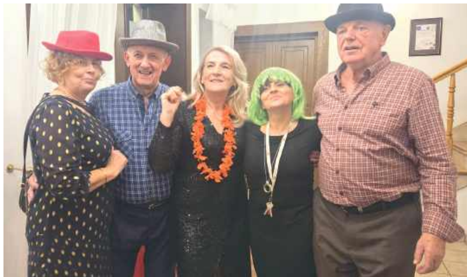
Było gwarno i wesoło. Wszystkim dopisywały humory, o czym świadczył gromki śpiew, radosny taniec, a nawet udział w przebierankach