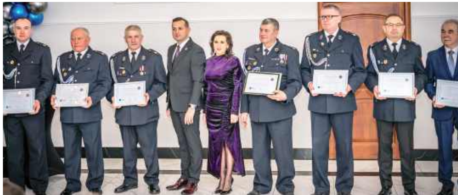
Na spotkaniu wójt gminy oraz przewodnicząca rady gminy podziękowali również Strażakom Ochotniczym Straży Pożarnych z terenu Gminy Łaskarzew