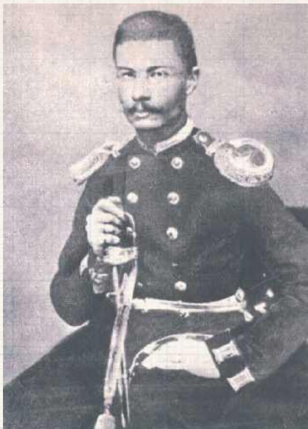
Romuald Traugutt w mundurze podpułkownika saperów w roku 1862. Kształcił się w żelechowskiej szkole oficerskiej. Mieszkał w ostatnim domu przy ulicy Oficerskiej właśnie. Poznał najważniejsze ówczesne osoby w mieście. Ostatni dyktator Powstania Styczniowego został stracony na stokach Cytadeli Warszawskiej w roku 1864 („Romuald Traugutt. Dyktator Powstania Styczniowego. Mieszkaniec Żelechowa w latach 1845-1853”, Gmina Żelechów, Żelechów 2014)