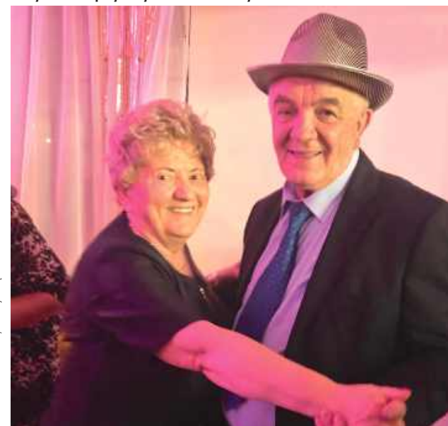
O muzykę zadbał Dj MC