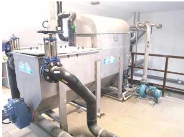
Całkowita wartość prac wyniosła 13.177.738,31 zł

29 listopada 2024 r. zakończona została realizacja zadania pn. „Rozbudowa oczyszczalni ścieków w miejscowości Celejów, gmina Wilga”. Wykonawcą inwestycji było Przedsiębiorstwo Inżynieryjno-Budowlane „Przem-Gri” Sp. z o.o. z siedzibą przy ul. Przemysłowej 3, 10-418 Olsztyn.