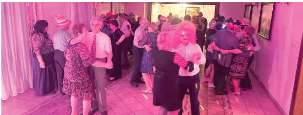
Powiatowe Centrum Kultury i Promocji w Miętmem zorganizowało piękny wieczór dla seniorów

1 lutego w Powiatowym Centrum Kultury i Promocji Miętmem odbyła się zabawa karnawałowa, na którą zaproszono seniorów. Był poczęstunek, śpiew, taniec i przede wszystkim świetna zabawa!