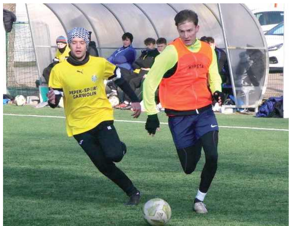
Sęp górą w kolejnej grze kontrolnej. Tym razem po hokejowym wyniku pokonali Ar-Tig Huta Dąbrowa z bialskiej klasy „A”