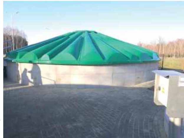
Inwestycja polegała na rozbudowie mechaniczno-biologicznej oczyszczalni ścieków

Całkowita wartość prac wyniosła 13.177.738,31 zł z czego: Pożyczka z WFOŚiGW – 5.685.248,03 zł, Pomoc finansowa z Programu Rozwoju Obszarów Wiejskich na lata 2014-2020 (PROW) – 5.000.000,00 zł, środki własne – 2.492.490,28 zł. Inwestycja polegała na rozbudowie mechaniczno-biologicznej oczyszczalni ścieków. Realizacja operacji pozwoliła na rozbudowę oczyszczalni i zwiększenie przepustowości średniej dobowej Q śrd = 110 m 3 /d do przepustowości Q śrd = 260 m 3 /d. Aktualnie praca oczyszczalni ścieków oparta jest na dwóch niezależnie pracujących ciągach technologicznych. Zakres robót obejmował powstanie nowych obiektów oraz modernizację istniejących. Nowe obiekty: - pompownia główna ścieków surowych, - reaktor biologiczny/II ciąg technologiczny, - punkt zlewny ścieków dowożonych, - taca na