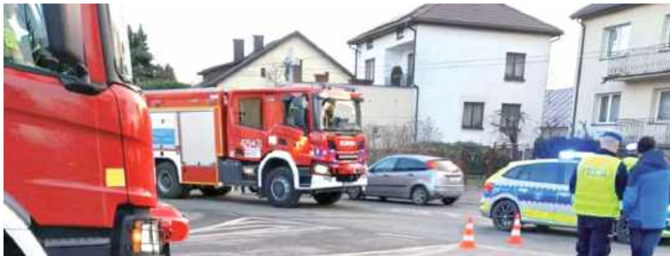
W wyniku zdarzenia do szpitala trafiły kierująca Peugeotem i pasażerka Fiata

- Na miejscu wstępnie ustalono, że kierujący pojazdem Fiat Panda 77-latek na skrzyżowaniu, wyjeżdżając z ulicy Jana Pawła II, prawdopodobnie nie ustąpił pierwszeństwa przejazdu podczas skręcania w lewo, zderzył się z jadącym ulicą Sienkiewicza pojazdem Peugeot, który poruszał się w kierunku ulicy Stacyjnej - poinformowała podkom. Małgorzata Pychner,