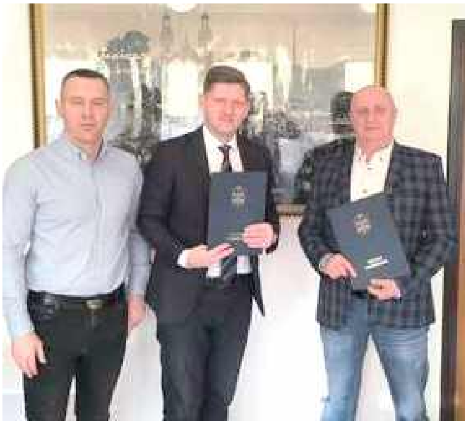
Celem zadania jest wspieranie i rozwój aktywności sportowej mieszkańców, propagowanie zdrowego stylu życia oraz podnoszenie poziomu sportowego zawodników klubu

Dziękujemy przedstawicielom ŁKS Promnik za zaangażowanie w rozwój sportu w naszym mieście i życzymy wielu sukcesów w realizacji przedsięwzięcia! - piszą władze miasta w mediach społecznościowych.