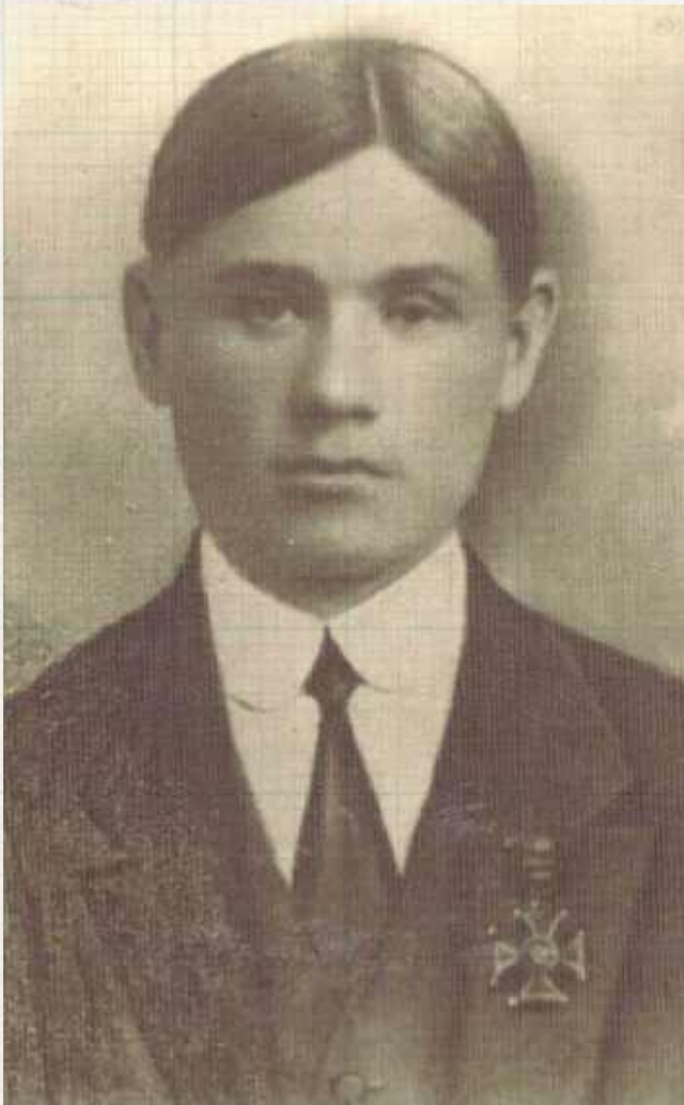
Szymon Fornal zginął w czasie walk w Warszawie w przewrocie majowym 14 maja 1926 r. W chwili śmierci liczył sobie zaledwie 28 lat (Wojskowe Biuro Historyczne, Kolekcja Orderu Wojennego Virtuti Militari)

Szymon Fornal w czasie wojny z bolszewikami położył wybitne zasługi na polu boju. W 1936 r. jako szeregowy wojskowy 4. plutonu 201. Pułku Szwoleżerów został pośmiertnie odznaczony Krzyżem Srebrnym Orderu Virtuti Militari V klasy