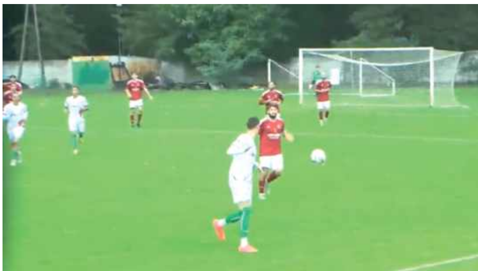
Wilga po wartościowym sparingu w wymiarze 2x60 minut uległa Legionovii

- Udało rozegrać się mecz 2x60 minut. Miałem do dyspozycji dwudziestu zawodników, w tym dwóch testowanych. Pierwsze 60 minut dobre, drugie