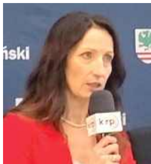
„Wszyscy panowie każdego dnia jeździli samochodami służbowymi i nikt nie robił z tego powodu problemu”

W 2024 r. decyzją Rady Powiatu za kwotę 250 tys. zł zakupiono nowe auto służbowe