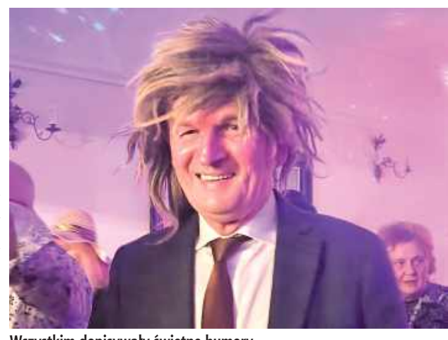
Wszystkim dopisywały świetne humory