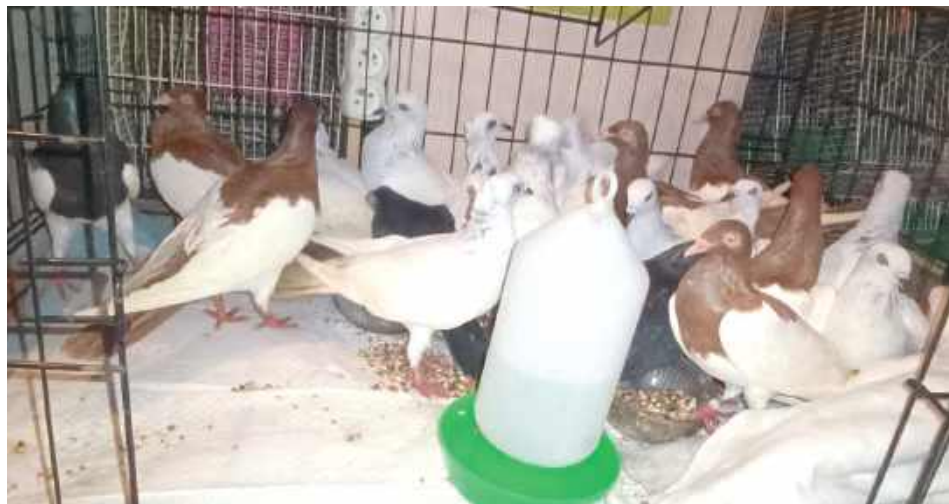
Gołębie wymagają opieki

Nasza rozmówczyni zadzwoniła do kobiety i ustaliła, że pa-