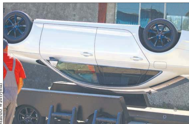
Jedną z atrakcji Dnia Bezpieczeństwa były symulatory