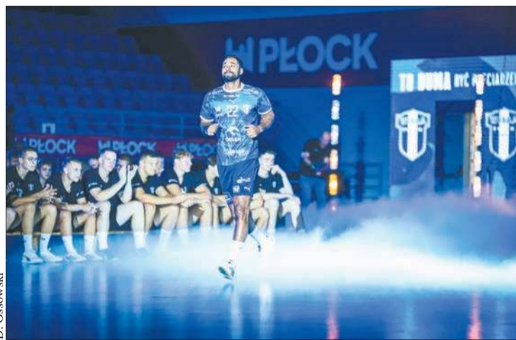
D. Ossowski Drużyna powalczy o wyjście z grupy

Odrobinę lepiej Nafciarze wystartowali w poprzednim sezonie 2024/25, pierwsze punkty wywalczyli już w czwartej kolejce. W końcówce fazy grupowej rozgrywek ORLEN Wisła nie miała problemów z zajęciem 6. miejsca w tabeli. Potem – w 1/8 finału