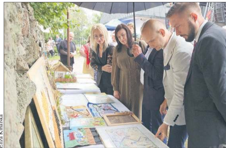
W ramach imprezy odbył się m.in. konkurs plastyczny