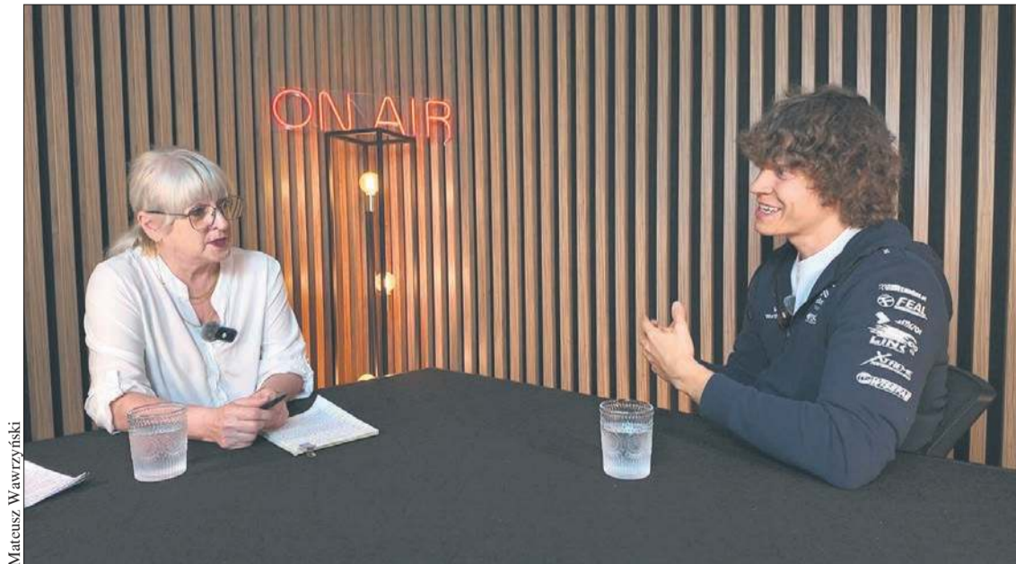
Piotr Więcek - kierowca sportowy, Mistrz Europy w driftingu

ny sportu jest już bardzo podobny na wszystkich kontynentach, we wszystkich krajach. Oczywiście są kraje, w których jest on mocniejszy, silniejszy – Polska, Irlandia, Stany Zjednoczone, Japonia. Natomiast widzimy, że informacje i pasja do driftingu rozprzestrzenia się już w sposób wręcz lawinowy i coraz więcej krajów przyłącza się do chęci organizowania zawodów. Widzimy coraz więcej zawodników z różnych nacji, którzy dołączają do