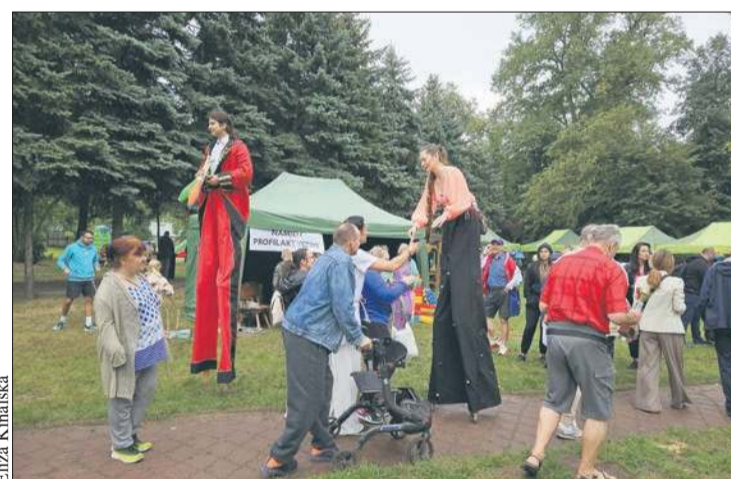
W Goślicach można było spotkać m.in. szcudlarzy