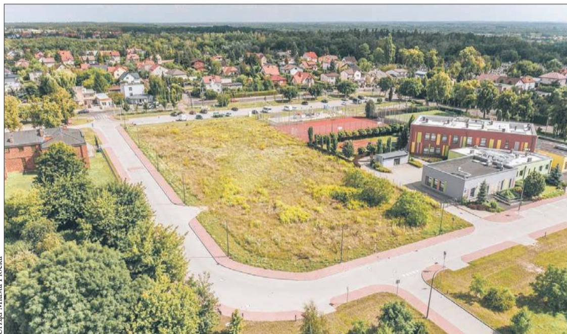
Na osiedlu Międzytorze powstanie nowy park

Nowy park, który powstanie na osiedlu Międzytorze, będzie miał powierzchnię ponad 37 tysięcy metrów kwadratowych.