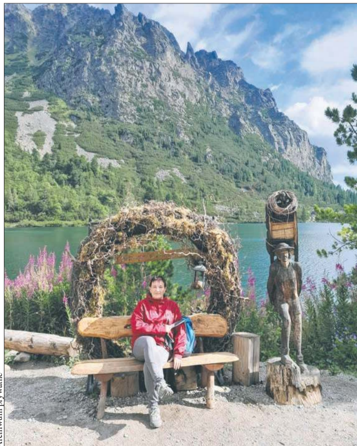
Słowackie Tatry. Odpoczynek przy Popradzkim Stawie