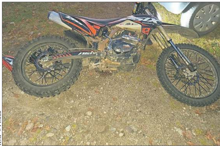
Motocykl crossowy, na którym uciekał przed policją 15-latek

- Rodzice odgrywają kluczową rolę w kształtowaniu postaw młodych osób – tłumaczą policjanci i apelują, aby od najmłodszych lat uświadamiać, jakie zagrożenia wiążą się z nieodpowiedzialnym zachowaniem na drodze. Ważne, aby młodzi ludzie korzystali z pojazdów wyłącznie zgodnie z prawem i własnymi możliwościami. BS