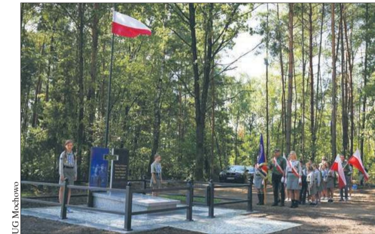
Uroczysty apel przy odnowionym pomniku w Rokiciu upamiętniającym pomordowanych w 1944 roku odbył się w rocznicę wybuchu II wojny światowej