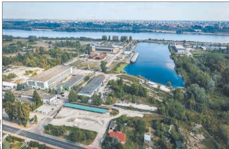
Na terenie po byłej stoczni powstanie nowoczesny kompleks mieszkaniowy

Właśnie uroczysto wmurowano kamień węgielny pod inwestycję Stocznia Residence. W jej ramach przy ulicy Popłacińskiej w Radziwiu powstanie nowoczesne osiedle nad wodą, które ma zachwycić nie tylko swoim wyglądem i funkcjonalnością, ale przede wszystkim niecodziennym położeniem i jedyną w swoim rodzaju panoramą Wzgórza Tumskiego. Łącznie w ramach całej inwestycji na terenie po byłej stoczni rzecznej ma powstać ponad 1000 mieszkań. Pierwszy etap tej szeroko zakrojonej inwestycji ma objąć budowę pięciu budynków mieszkalnych i potrwać dwa lata.