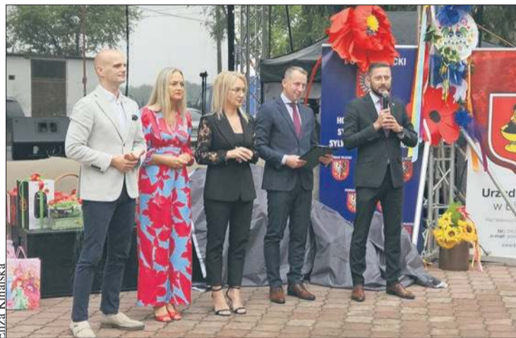
Uroczyste otwarcie 31. Dnia Pieczonego Ziemniaka