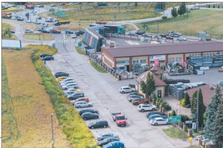
Urząd Miasta Płocka

Do zrobienia został fragment około 350 metrów – do ronda im. Stanisława Osieckiego. Przebudowa tego odcinka ulicy – z racji sąsiedztwa składu budowlanego – wymagała przygotowania takiego projektu drogi, który sprostą większym obciążeniom niż ta wcześniej zmodernizowana.