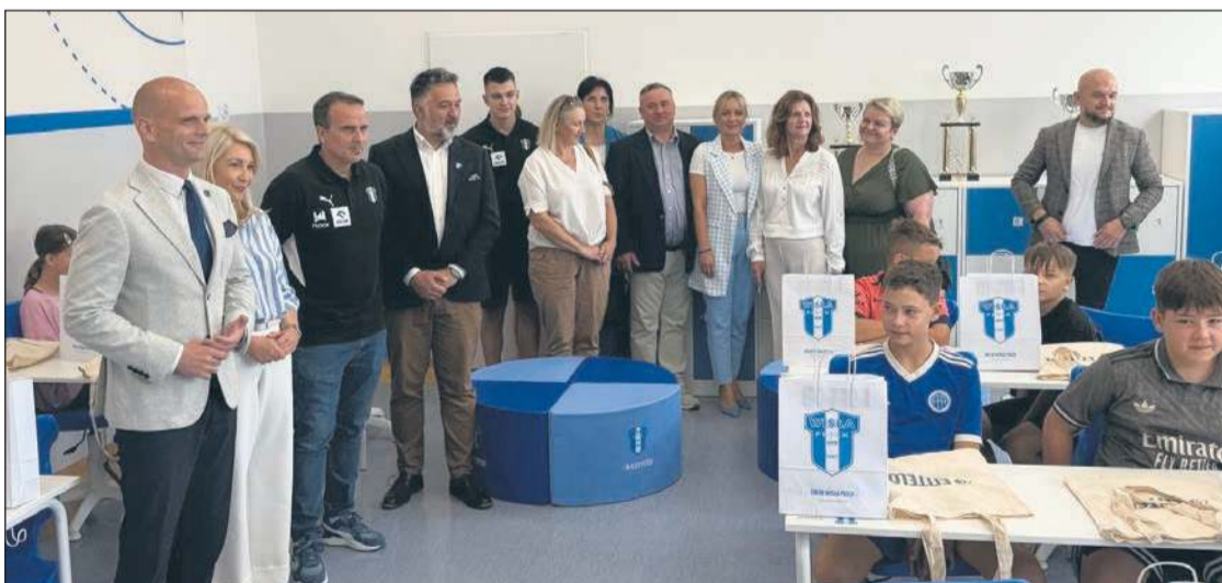
Nowoczesne meble i elementy wyposażenia z firmy Entelo są utrzymane w barwach Wisły Płock

Projekt w Łącku został zrealizowany dzięki wsparciu firmy Entelo – sponsora ORLEN Wisły Płock – która wyposaża klasę w nowoczesne meble i elementy w niebiesko-biało-niebieskim klimacie klubu. - Jesteśmy niezwykle dumni, że możemy łączyć sport z edukacją i inspirować młodzież do wszechstronnego rozwoju. Klasa w Łącku to nie tylko miejsce nauki języków obcych, ale przede wszystkim