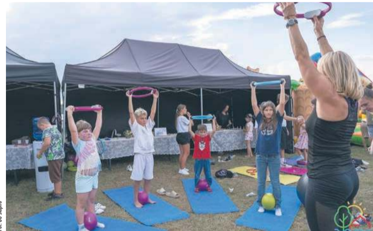
„Pożegnanie lata” obfitowało w atrakcje sportowe