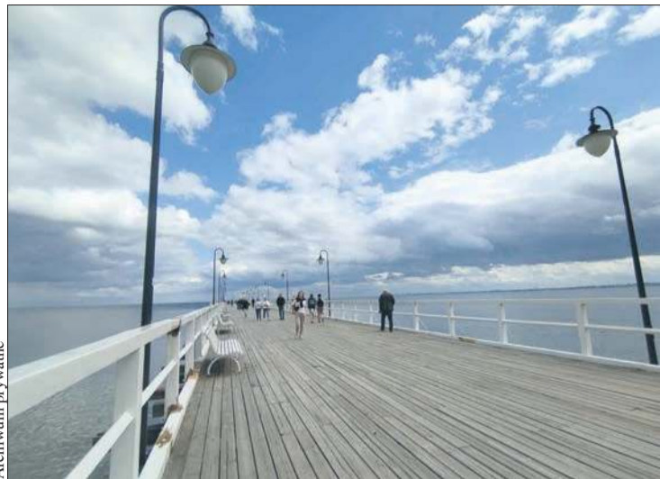
Molo w Orłowie