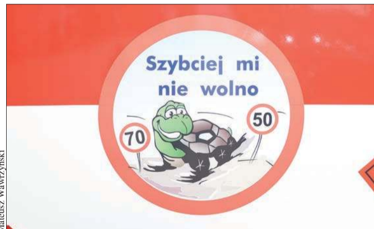
Charakterystyczną naklejkę z żółwem można znaleźć na cysternach należących do spółki ORLEN Transport