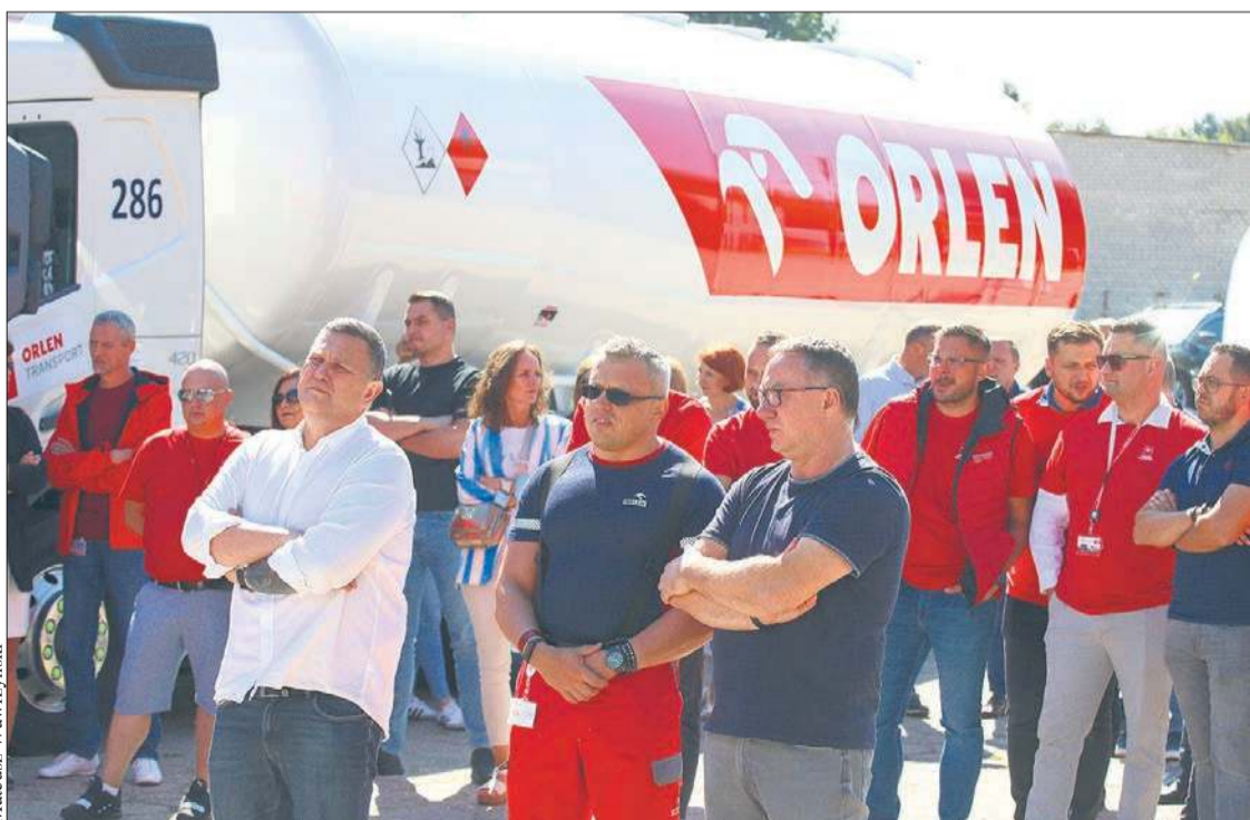
Pracownicy spółki ORLEN Transport wzięli udział w dorocznym Dniu Bezpieczeństwa