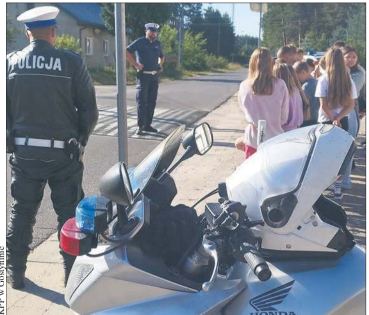
Policjanci Wydziału Ruchu Drogowego Komendy Powiatowej Policji w Gostyninie odwiedzili szkołę w Emilianowie

4 września policjanci Wydziału Ruchu Drogowego Komendy Powiatowej Policji w Gostyninie odwiedzili Szkołę Podstawową im. Bohaterów 1 grudnia 1939 r. w Emilianowie w ramach ogólnopolskiej akcji profilaktyczno-edukacyjnej „Bezpieczna droga do szkoły”, prowadzonej od 1 do 30 września 2025 r.