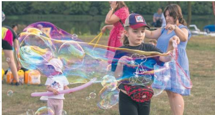
Podczas „Pożegnania lata” najmłodszy mieszkańcy gminy mogli skorzystać z licznych atrakcji

li sportowcy mogli liczyć na atrakcyjne nagrody.