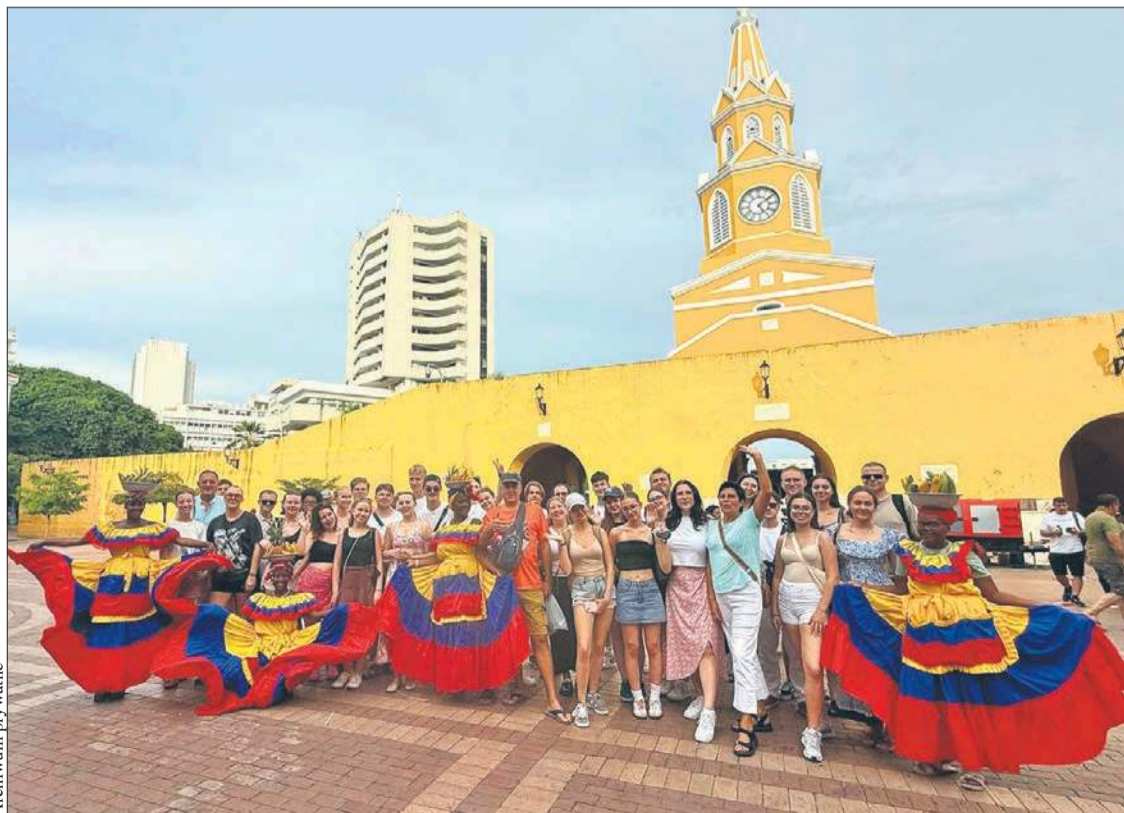
Płocki chór w Kolumbii