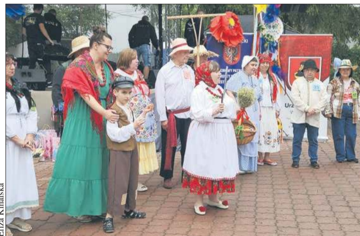
Mnóstwo pozytywnych emocji przyniósł konkurs na strój farmerski inspirowany sztuką ludową