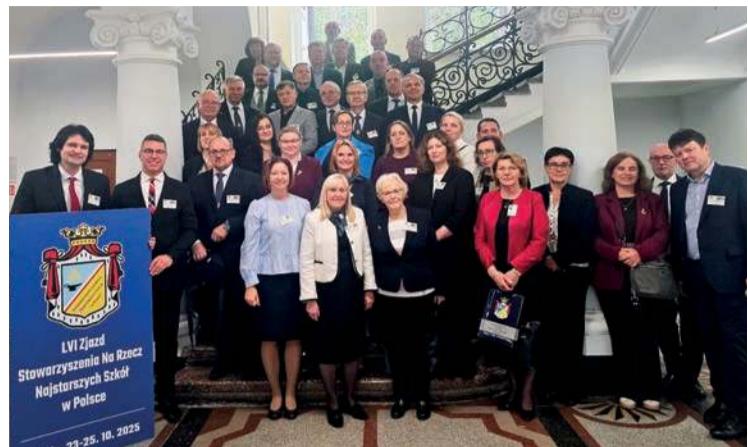
Uczestnicy 56. Zjazdu Najstarszych Szkół w Polsce

Stowarzyszenie na rzecz Najstarszych Szkół w Polsce działa od 52 lat. Jego celem jest kontynuowanie i utrwalanie tradycji szkół o długiej historii,