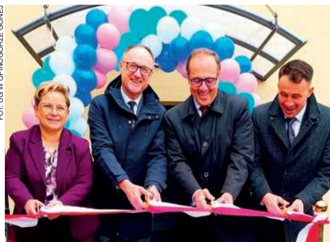
Tradycyjne przecięcie wstęgi