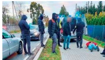
Zatrzymanie posiadaczy narkotyków

Policjanci z Wydziału Kryminalnego KPP w Makowie Mazowieckim wspólnie z policjantami Sekcji Zamiejscowej w Ciechanowie Wydziału Kryminalnego Komendy Wojewódzkiej Policji zs. w Radomiu, prowadząc działania ukierunkowane na zwalczanie przestępczości narkotykowej, zatrzymali do kontroli drogowej audi, którym kierował 40-letni mieszkaniec powiatu przasnyskiego.