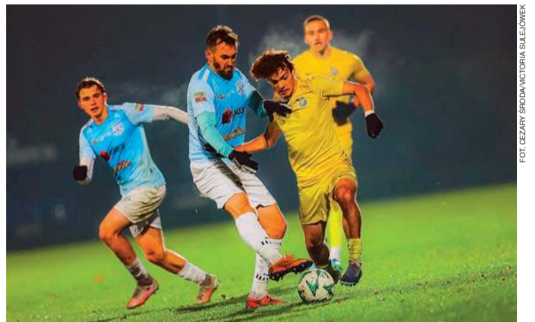
Przasnyszanie nie mieli zbyt wielu okazji w meczu z liderem

15. kolejka (8-9 listopada): Przasnysz - Ursus, Wilga - Victoria, Mazur - Mszczonowianka, Hutnik - Piaseczno, Oskar - Makowianka, Marcovia - Talent, Błonianka - Wesoło, Mazovia - Łomianki, Ożarówianka - Legionovia