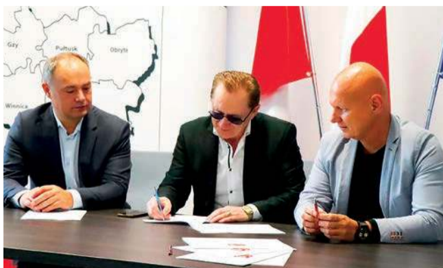
Podpisanie umowy inwestycję w miejscowości Pobyłkowie Małe wykona firma z Płońsk

Wartość dofinansowania z rezerwy subwencji Ministerstwa Infrastruktury wynosi 324 853,43 zł.