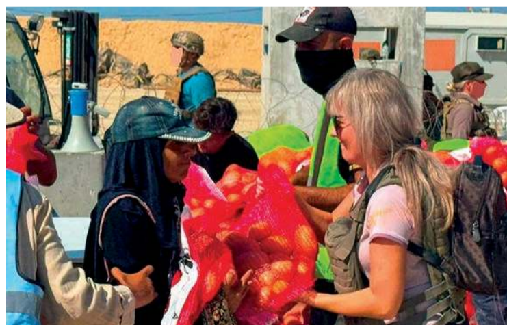
Fundacja organizuje pomoc humanitarną dla cywilnej ludności w Strefie Gazy