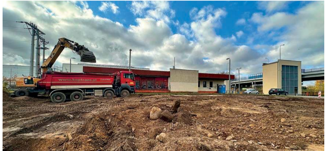
Przy dworcu kolejowym powstaje strefa park&ride

Będzie bezpieczniejszy, bardziej estetyczny i funkcjonalny. Parking główny zostanie ogrodzony, oświetlony i wyposażony w system monitoringu. Teren