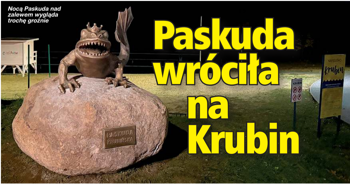
Nocą Paskuda nad zalewem wygląda trochę groźnie