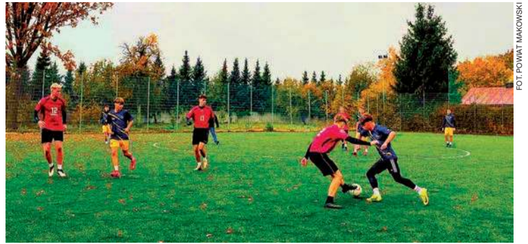
Sportowe zmagania uczniów

Do rywalizacji przystąpili chłopcy (17.10) i dziewczęta (21.10) ze szkół ponadpodstawowych powiatu makowskiego.