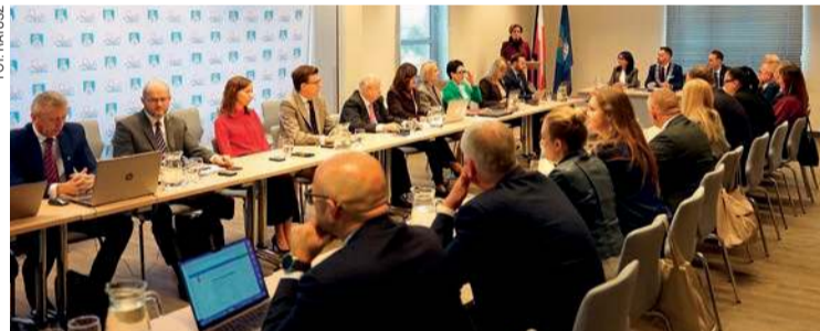
Sesja Rady Miasta Ciechanów