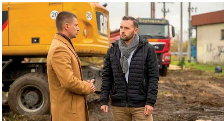
Prezydent Ciechanowa Krzysztof Kosiński na terenie nowej inwestycji drogowej miasta

– To będzie jakościowa rewolucja dla komunikacji w tym obszarze. Przystępujemy do realizacji bardzo dużego zakresu prac. Roboty obejmują nie tylko od dawna wyczekiwany remont ul. Fabrycznej, ale też budowę strefy „parkuj i jedź” oraz kolejnych kilometrów tras rowerowych. Mam satysfakcję, że możemy zrealizować ten projekt dzięki środkom unijnym, które pozyskaliśmy. Pokryją aż 85% wartości zadania – podkreśla prezydent Ciechanowa Krzysztof Kosiński.