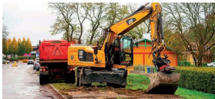
Na ulicę Fabryczną wjechały już koparki