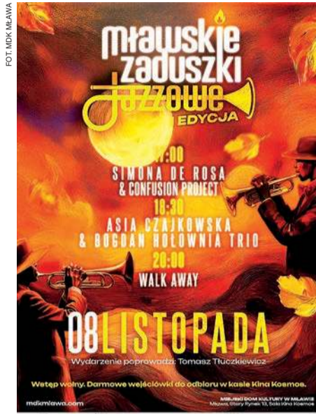
Plakat muzycznej imprezy jazzowej

Gwiazdą Zadaszek będzie zespół Walk Away. Polska legenda fusion,