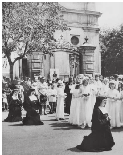
Siostry w czasie procesji Bożego Ciała (lata siedemdziesiąte)