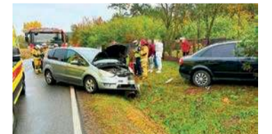
Wypadek w Zakliczewie

Policjanci wyjaśniają okoliczności i przyczynę zdarzenia drogowego, jakie miało miejsce 23 października przed godz. 11:00 w Zakliczewie (gm. Szelków) na drodze krajowej nr 57.