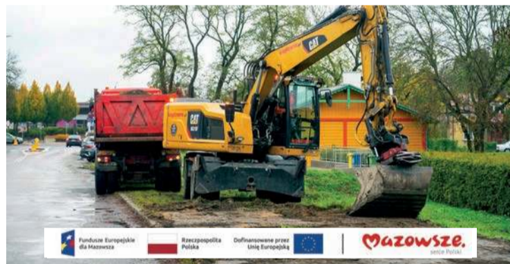
Trasa rowerowa poprowadzi od skrzyżowania ul. Fabrycznej i ul. Sienkiewicza, przy dworcu PKP Przemysłowy i dalej – do Ronda Solidarności

Nowa trasa rowerowa poprowadzi od skrzyżowania ul. Fabrycznej z ul. Sienkiewicza do dworca PKP Przemysłowy i jeszcze dalej – aż do Ronda Solidarności. Tam droga dla jednoślądów zostanie wpięta w istniejącą już infrastrukturę (ulice: Sońską i aleję Unii Europejskiej). Na odcinku między dworcem kolejowym a rondem powstanie kładka, umożliwiająca przejazd rowerem przez rzekę Łydynię.