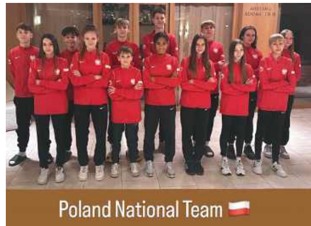
Poland National Team