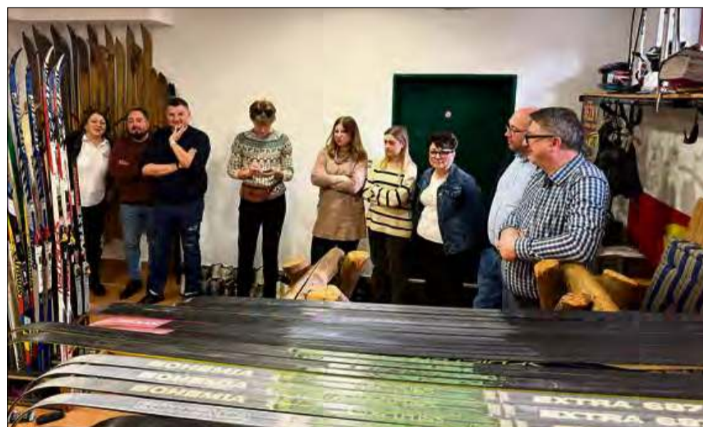
Projekt pozwala na wymianę doświadczeń, integrację społeczną i rozwój lokalnych inicjatyw.

- Impreza ta zastąpi odwołaną we wrześniu wystawę