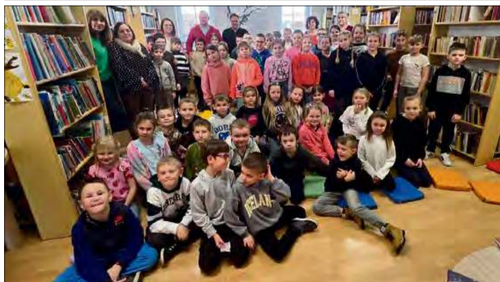
To było miłe spotkanie w bibliotece.

We wtorek 4 marca w Gminnej Bibliotece Publicznej w Strzeleczkach odbyło się spotkanie autorskie z Grzegorzem Kasdepke, jednym z najpopularniejszych współczesnych pisarzy dla dzieci w Polsce. To był bardzo miły czas.