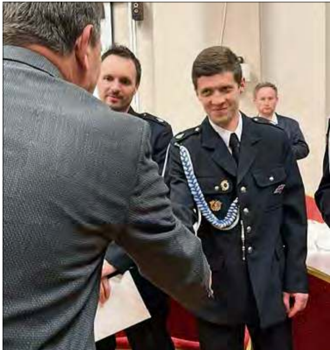
Wybrzmiały liczne gratulacje i podziękowania.

Wrzesień 2024 roku był dla gminy Strzeleccki czasem próby. Nagła powódź, która nawiedziła region, pozostawiła po sobie zniszczenia, strach i chaos, ale też ujawniła niezwykłą solidarność mieszkańców i heroiczną postawę strażaków OSP.