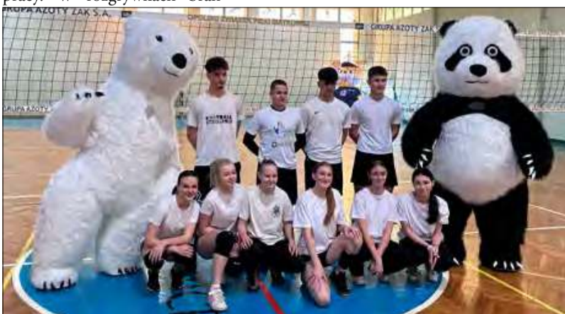
Rozgrywki siatkarskie zgromadziły najlepszych siatkarzy ze szkół ponadpodstawowych powiatu krapkowickiego.

przyszłości, więc to dobra okazja, by zainteresować ich naszą ofertą.