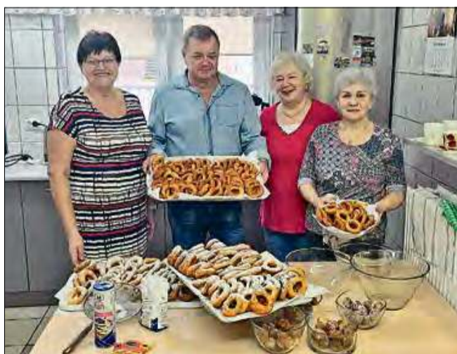
Na stole królowały własnoręcznie przygotowane pączki i oponki.

Tłusty Czwartek to święto, które nie może obyć się bez pączków, ale w „Jarzębinie” postawiono na różnorodność. Oprócz tradycyjnych pączków na stole znalazły się również oponki oraz inne słodkie przekąski. Każdy mógł znaleźć coś dla siebie, a uśmiechy na twarzach seniorów były najlepszym dowodem na to, że smakołyki były pyszne. Tego dnia nikt nie przejmował się dietą czy kaloriami.