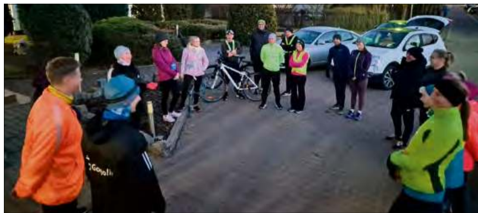
Pierwsze zajęcia biegowe już się odbyły.

Wystartowała ciekawa akcja pt. „Gogolin Chodzi”. Inicjatywa spodobała się mieszkańcom gminy. Chętnych do maszerowania i biegania nie brakuje.