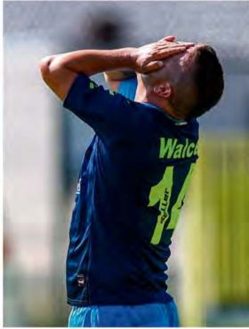
Ruch Zdzeszowice i Walce nie zdobyły nawet punktu na inaugurację ligowej wiosny.