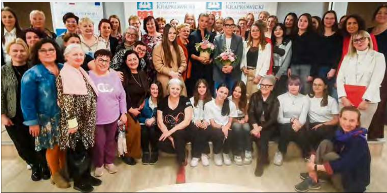
Frekwencja pokazała duże zainteresowanie tym tematem.

Spotkanie zatytułowane „Marzenia, konsekwencja, determinacja, zaangażowanie - Sukces” zgromadziło młodzież i seniorów, podkreślając, że osiągnięcie sukcesu wymaga ciężkiej pracy, determinacji i umiejętności radzenia sobie z przeciwnościami. Sukces nie jest dziełem przypadku, lecz wynikiem konsekwentnych działań i gotowości do nauki na błędach.