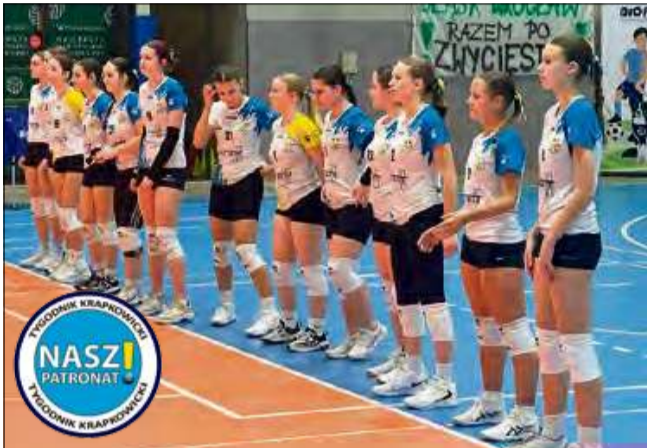
Kadetki z PV Volley Krapkowice wystąpiły w 1/8 Finału Mistrzostw Polski Juniorek Młodszych.

To były wielkie chwile dla młodzieży trenującej na co dzień w krapkowickim klubie siatkarskim PV Volley Krapkowice. Na przełomie lutego i marca kadetki rozegrały ważne mecze w ramach 1/8 Finału Mistrzostw Polski Juniorek Młodszych, zbierając istotne doświadczenie na przyszłość.