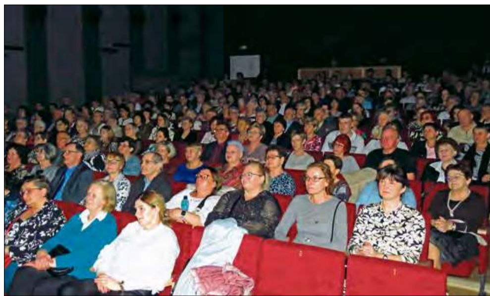
Główną atrakcją wieczoru był wyjątkowy koncert, podczas którego publiczność miała okazję przenieść się w muzyczną podróż przez dekady.

W niedzielę, 9 marca, sala widowiskowa Krapkowickiego Domu Kultury wypełniła się po brzegi, by świętować wyjątkowy dzień - Dzień Kobiet. Wydarzenie zgromadziło licznych mieszkańców miasta oraz gości, którzy wspólnie uczcili ten szczególny czas, poświęcony wszystkim paniom.