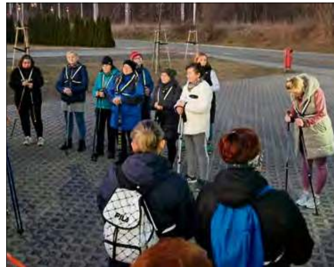
Frekwencja pozytywnie zaskoczyła organizatorów.