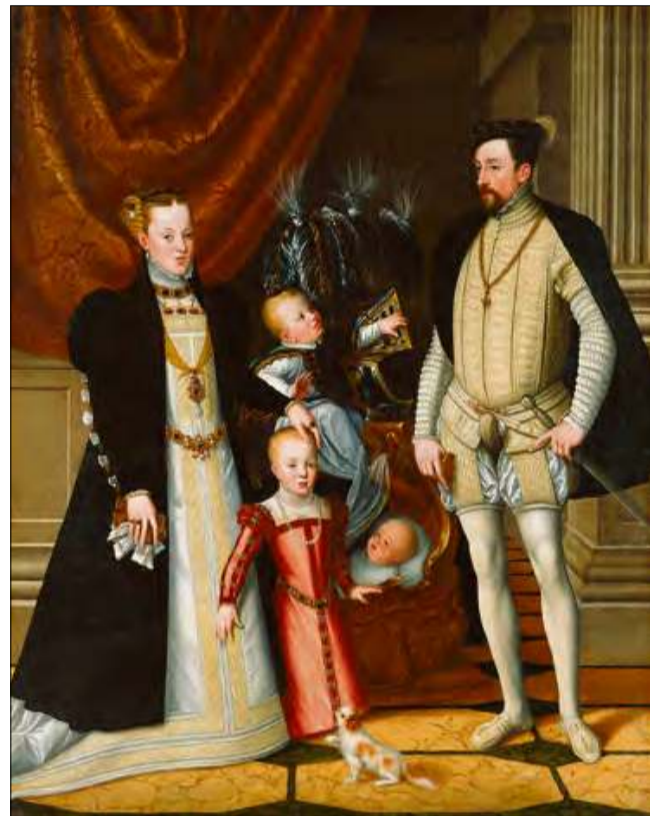
Maksymilian II Habsburg z rodziną. Obraz Giuseppe Arcimboldo wykonany około 1563 roku.

Podobnie jak w przypadku swojego ojca Ferdynanda, życie rodzinne Maksymiliana zdawało się być zaprzeczeniem burzliwej kariery politycznej. Ze swoją żoną (a zarazem kuzynką) Marią raz po raz popadał w pewne różnice zdań dotyczące polityki. Przede wszystkim ze względu na to, że Maria, jako hiszpańska księżniczka, była gorliwą katoliczką zwo-