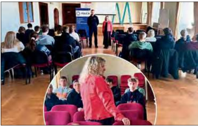
Ostatnie już spotkanie z cyklu spotkań doborowych do służby odbyło się w Zespole Szkół Zawodowych im. Piastów Opolskich w Krapkowicach.

To było ostatnie spotkanie w ramach spotkań dotyczących doboru do służby. W przyszłości na pewno będą następne skie-