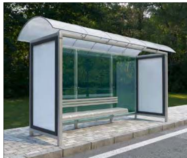
Nowe wiaty są estetyczne, ale czy bezpieczne dla ptaków?