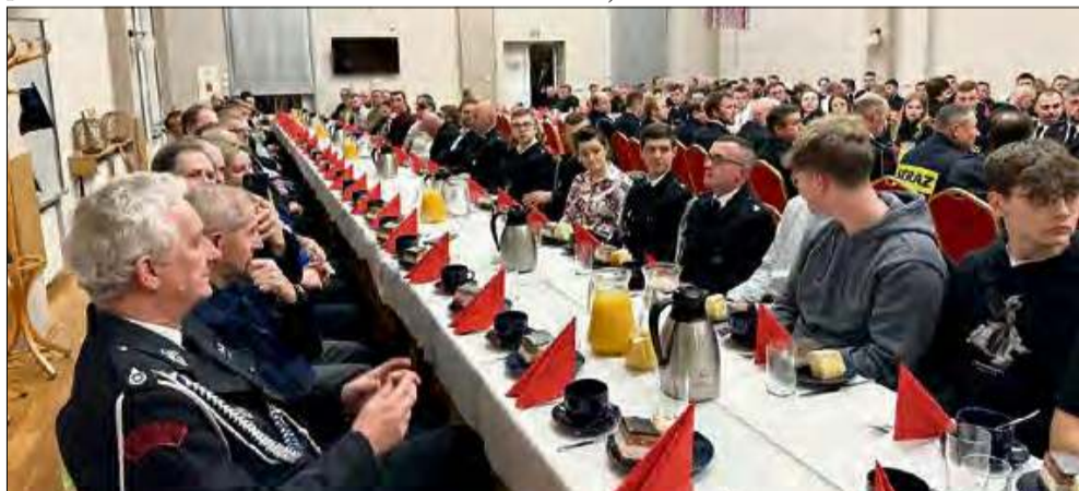
Sala GOK-u wypełniła się po brzegi.

wej Straży Pożarnej, przedsiębiorcami, mieszkańcami oraz zaproszonymi gośćmi, by wyrazić wdzięczność za ich wysiłek i poświęcenie.