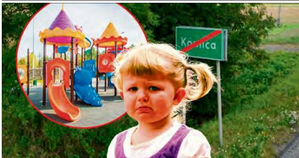
Mieszkańcy Kórnicy chcą porządnego placu zabaw dla swoich dzieci.

Mieszkańcy Kórnicy z coraz większym niezrozumieniem i frustracją patrzą na sąsiednie wioski i miasta, które mogą pochwalić się nowoczesnymi i zadbanymi placami zabaw. W ich miejscowości takiego miejsca na miarę XXI wieku brakuje, co budzi pytania i apele do lokalnych władz.