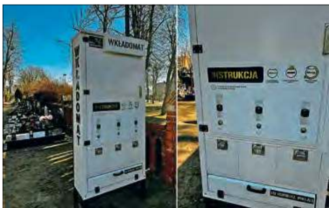
Urządzenia oferują trzy rodzaje wkładów do zniczy.

W Krapkowicach, na cmentarzu komunalnym przy ulicy Staszica, pojawiła się nowość, która z pewnością ułatwi życie odwiedzającym. Dwa wkładomaty stanęły przy bramach cmentarza - od strony ulicy Staszica oraz osiedla Powstańców Śląskich. Dzięki tym urządzeniom można w każdej chwili zaopatrzyć się we wkłady do zniczy, bez konieczności szukania sklepu czy czekania na jego otwarcie.