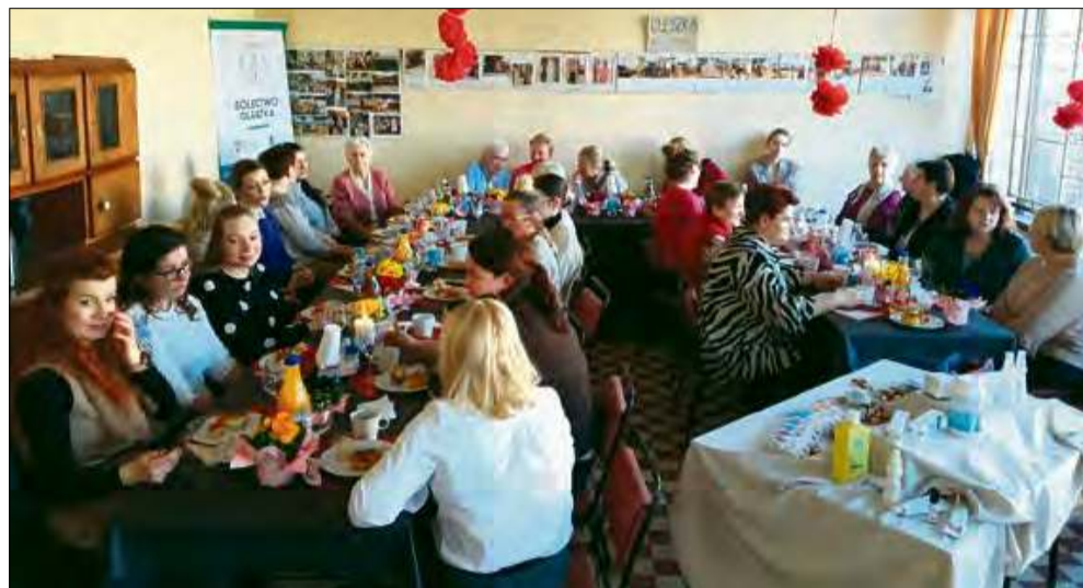
Frekwencja, jak zwykle, dopisała, a atmosfera była pełna ciepła, uśmiechów i życzliwości.

8 marca to data, która co roku przypomina nam o wyjątkowości kobiet. W Oleszce postanowiono uczcić ten dzień w sposób szczególny nieco wcześniej, organizując spotkanie, które na długo pozostanie w pamięci uczestniczek. Frekwencja, jak zwykle, dopisała, a atmosfera była pełna ciepła, uśmiechów i życzliwości.