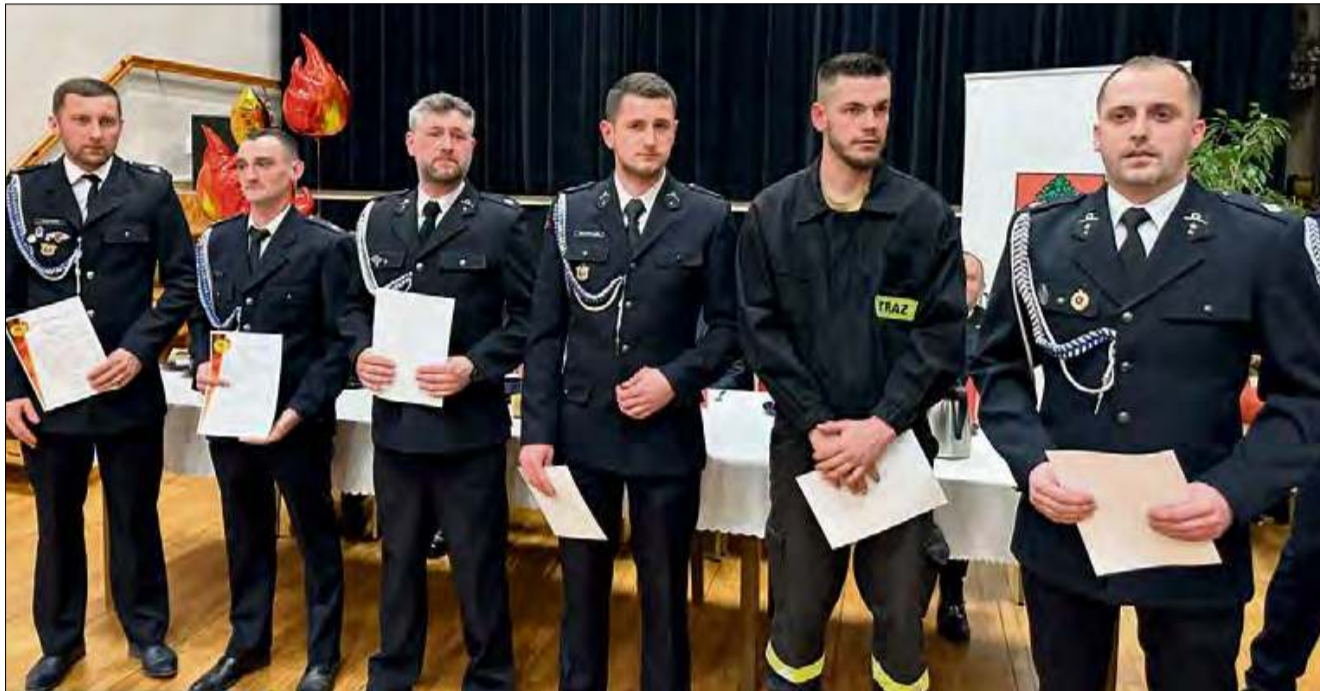
Strażacy zostali uhonorowani.