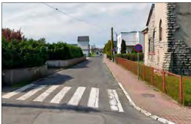
Ulica Kościelna wymaga remontu już od dawna.

Długo wyczekiwana inwestycja ma być zrealizowana w Gogolinie. Mowa o gruntownej przebudowie ulicy Kościelnej.