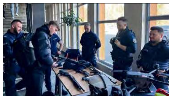
Każdy mógł zobaczyć jaki sprzęt jest wykorzystywany podczas codziennej służby oraz dowiedzieć się więcej o pracy policjantów.

Rozgrywki siatkarskie zgromadziły najlepszych siatkarzy ze szkół ponadpodstawowych powiatu krapkowickiego. Po zaciętym boju zwyciężyła drużyna z Zespołu Szkół Zawodowych im. Piastów Opolskich w Krapkowicach. Drugie miejsce zajęli uczniowie Liceum