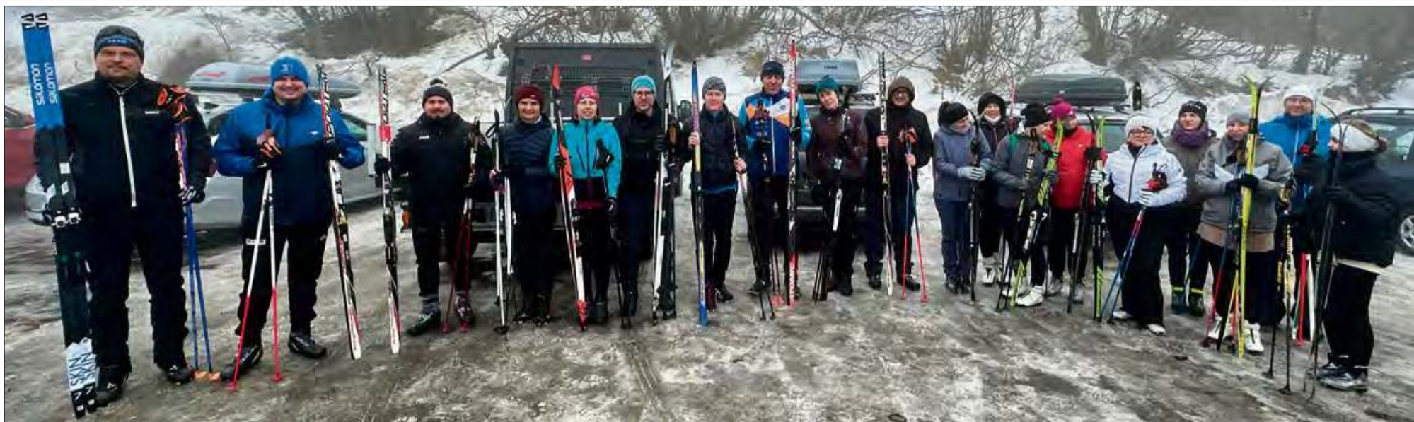
Realizacja projektu „Wspólne życie bez granic - wspólny Śląsk” nabiera tempa.

Powódź w Ceskiej Vsi zachwiała planami, ale nie złamała ducha współpracy. Po ubiegłorocznych problemach związanych z powodzią w Ceskiej Vsi projekt „Wspólne życie bez granic - wspólny Śląsk” wraca na właściwe tory. Wznowiono zajęcia językowe i sportowe, a przed mieszkańcami gmin Walce i Ceska Ves szereg wydarzeń integracyjnych.