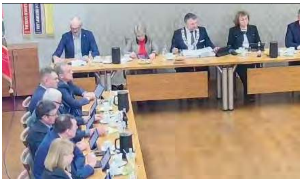
Projekt uchwały odrzucono podczas ostatniej sesji Rady Miejskiej. Obrady odbyły się pod koniec lutego.

Gogolińscy radni odrzucili projekt uchwały w sprawie ustalenia stawek procentowych opłaty adiacenckiej. Temat wywołał burzliwą dyskusję już podczas prac komisyjnych.