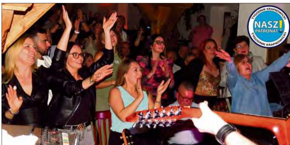
Sala Zamkowego Młyna pękała w szwach, a publiczność bawiła się przy największych hitach, takich jak „Bałkanica” czy „Całuj Mnie”.

Sobotni wieczór, 8 marca, upłynął w Krapkowicach pod znakiem występu jednego z najpopularniejszych polskich zespołów rockowych. Zespół Piersi przyjechał do stolicy powiatu krapkowickiego by zagrać przede wszystkim dla pań z okazji Dnia Kobiet. Koncert był wyjątkowy, bo akustyczny i przygotowany przez organizatorów w kameralnej atmosferze. Sala Zamkowego Młyna została wypełniona po brzegi, a z każdym przebojem atmosfera stawała się coraz bardziej gorąca.