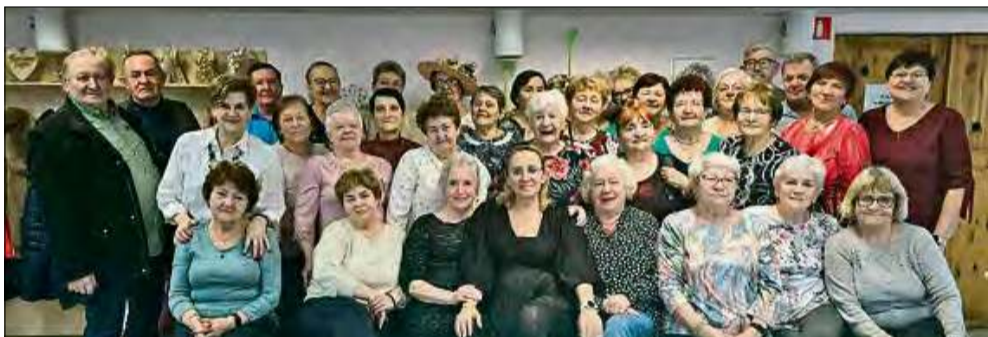
Tłusty czwartek był doskonałą okazją do spotkania seniorów.

Seniorzy z Domu Dzieńnego Pobytu „Jarzębina” w Zdieszowicach świętowali w tłusty czwartek. W tym wyjątkowym dniu na stole królowały własnoręcznie przygotowane pączki i oponki. Było słodko, radośnie i bardzo wesoło.