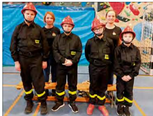
Udział w zawodach to nie tylko rywalizacja, ale również promowanie idei strażackiej służby wśród młodzieży.

Zawody były doskonałą okazją dla młodych strażaków-ochotników, aby sprawdzić swoje umiejętności, kondycję fizyczną oraz współpracę w drużynie. Mimo że drużyna z Pietnej nie stanęła na podium, jej członkowie pokazali ogromne zaangażowanie i determinację. Dla wielu z nich był to pierwszy tak duży sprawdzian, który z pewnością zapisze się w ich pamięci jako cenne doświadczenie. Choć podium tym razem nie było ich udziałem, młodzi strażacy z Pietnej nie tracą ducha. Udział w zawodach to nie tylko walka o medale, ale również nauka, rozwój i budowanie zespołowego