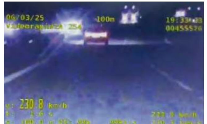
47-latek pędził samochodem 230 km/h.

W czwartkowy wieczór około godziny 19.30 na autostradzie A4 na wysokości Gogolina, policjanci Wydziału Ruchu Drogowego zatrzymali do kontroli drogowej 47-latek kierującego osobowym audi, który przekroczył dopuszczalną prędkość o 90 km/h. Kierujący za popełnione wykroczenie drogowe i przekroczenie dozwolonej prędkości, został surowo ukarany. Otrzymał mandat w wysokości 2 500 złotych, a jego konto zasilono 15 punktów karnych. Po sprawdzeniu w systemie jego historii związanej z łamaniem przepisów drogowych, okazało się, że już w 2022 roku miał przekrozoną dozwoloną ilość punktów, więc musiał