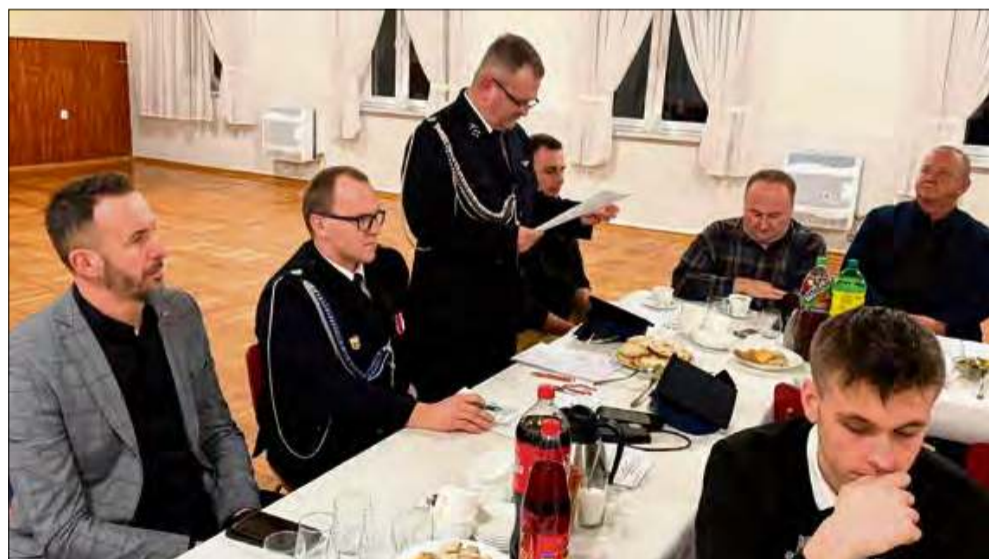
OSP KSRG Jasiona podsumowała rok i uhonorowała swoich bohaterów – służba, która zasługuje na najwyższe uznanie!

W Jasionej odbyło się walne zebranie sprawozdawcze. Podczas spotkania podsumowano miniony rok i wyróżniono zasłużonych strażaków.