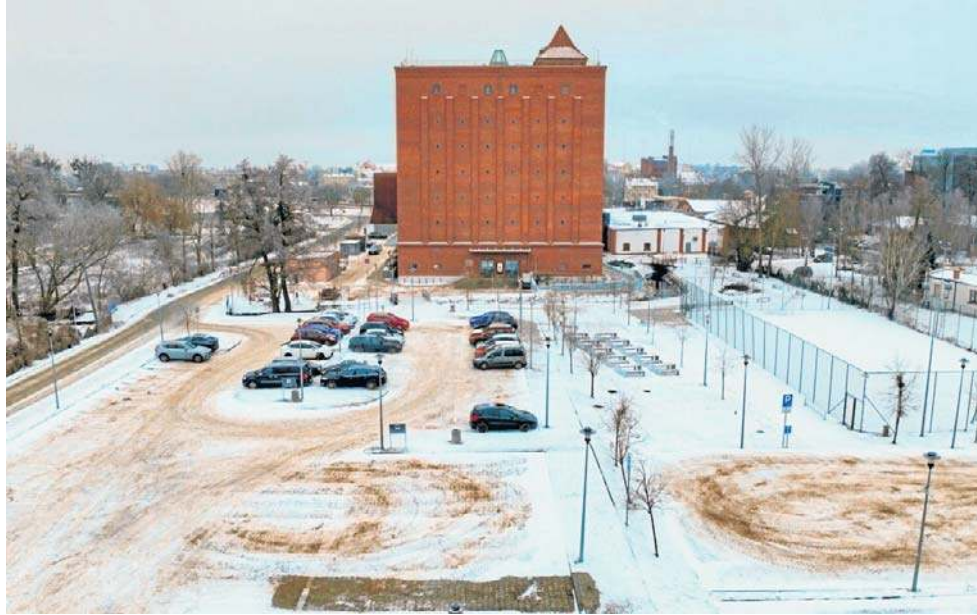
20 listopada w płytkiej wodzie w okolicach Młyna Wiedzy utonął 58-letni torunianin

Tymczasem dwa dni przed wigilią przypadkowy przechodzień znalazł niedaleko Strugi Toruńskiej rzeczy osobiste zmarłego mężczyzny. Były ustawione porządkie pod znakiem drogowym - ewidentnie tak, by ktoś je dostrzegł. Były