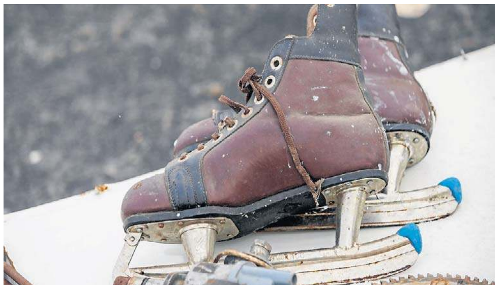
Na pchlim targu też znaleźć można sezonowe perełki. Takie hokejówki to kawał historii