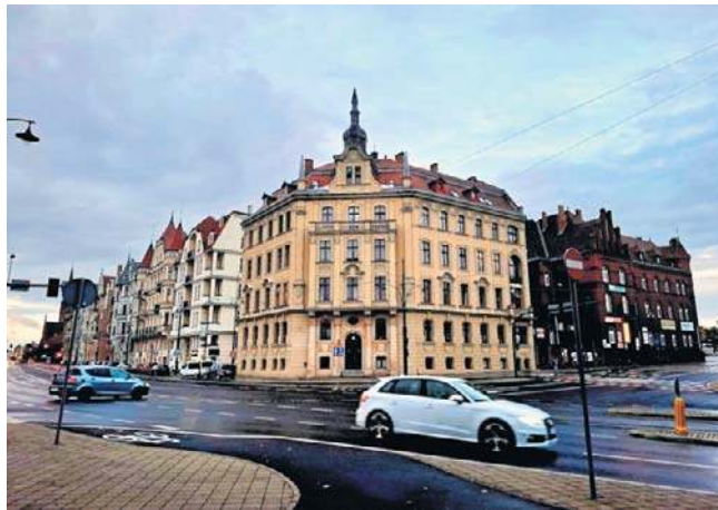
To najprawdopodobniej z okien tej kamienicy snajper strzelał z broni pneumatycznej do motocyklistów

Toruńska policja była zdezorientowana, by ująć sprawcę tych ataków na motocyklistów - o tym zapewniała i zapewnia. Niestety, wszystkie wykonane w śledztwie czynności nie do-