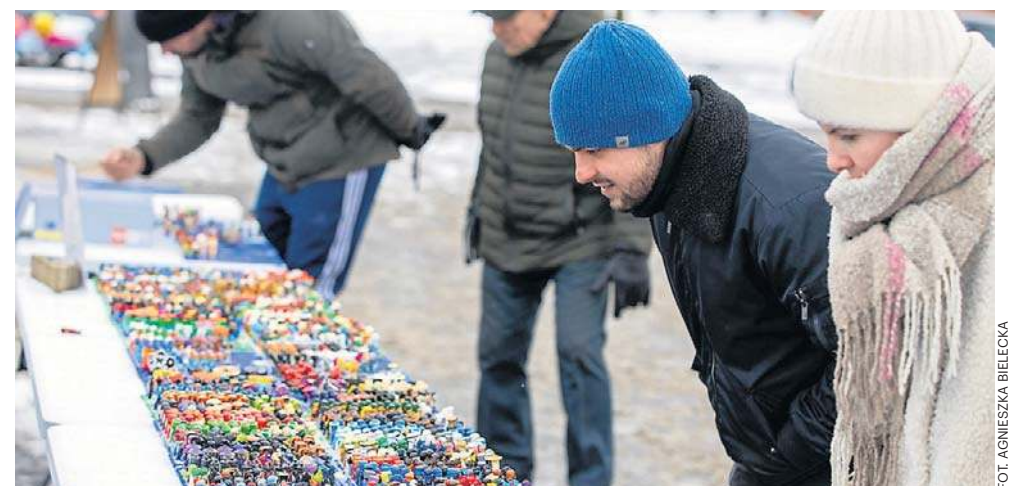
Nawet tęgie zimno nie odstraszy prawdziwych pasjonatów od sprawdzenia stoisk