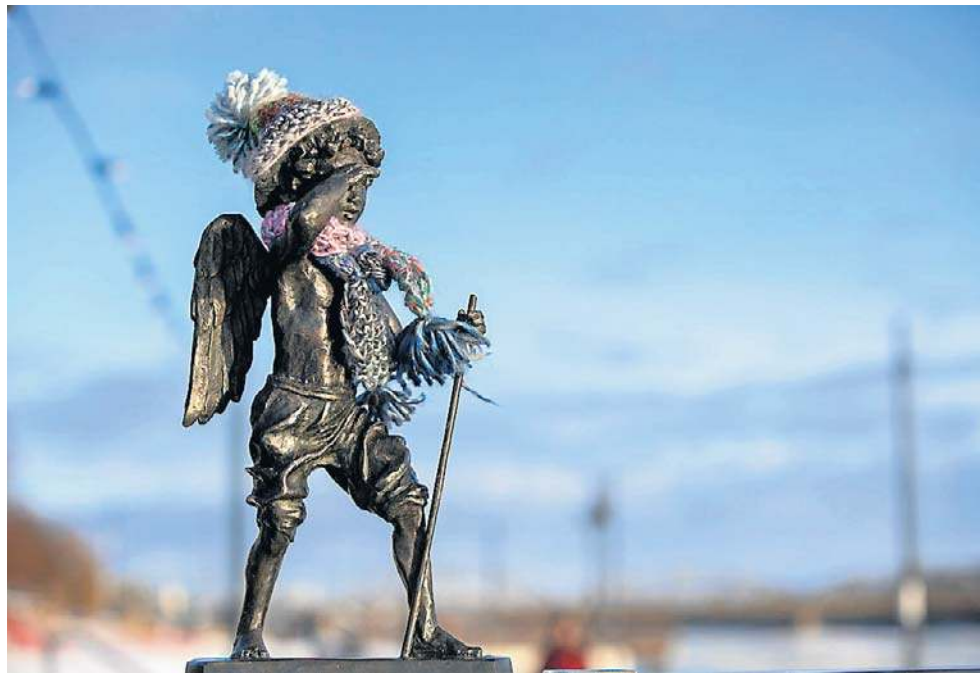
Toruński Aniołek ubrany w szalik i czapkę gotowy na dłuższą śnieżną zimę?