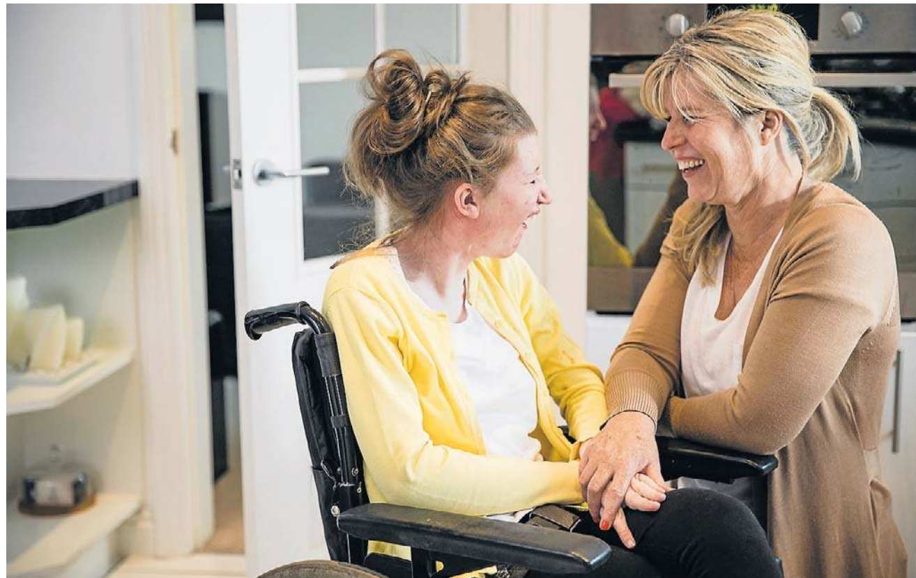
Polska wprowadza wytyczne w diagnostyce stwardnienia zanikowego bocznego i terapię celowaną. To prawdziwy przełom w leczeniu stwardnienia zanikowego bocznego

– Oczywiście, aby możliwe było jak najszybsze wykonanie badań genetycznych, pacjent musi mieć wcześniej ustalone rozpoznanie ALS. Szybka i prawidłowa diagnostyka, w tym ge-