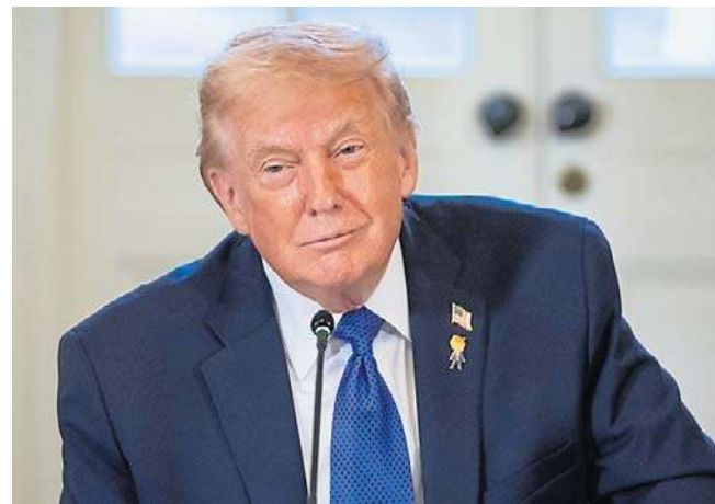
Amerykański prezydent na razie nie odniósł się do propozycji premiera Czagos

Baza ma kluczowe znaczenie strategiczne na Oceanie Indyjskim, odegrała ważną rolę między innymi podczas operacji amerykańsko-izraelskiej przeciwko Iranowi w 2025 roku. PAP