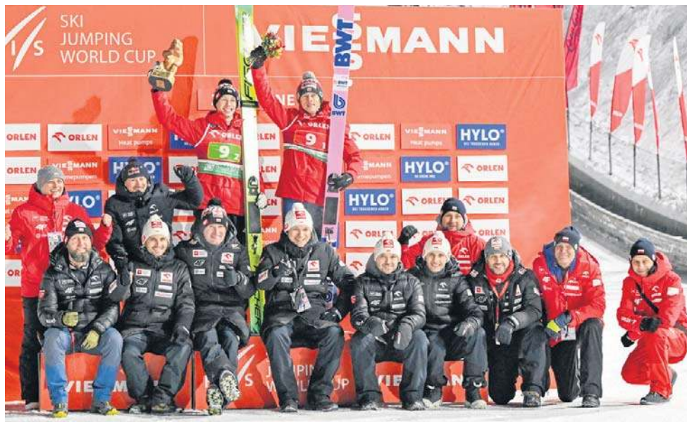
Polska ekipa skoczków narciarskich doczekała się sukcesu w Pucharze Świata

Drugi skok Kubackiego był nawet lepszy niż pierwszy i jeszcze bardziej można było mieć nadzieję na podium. Zwłaszcza że rozkręcał się Tomasiak. Po całej drugiej serii Polska była 3., z realną szansą na powalczenie z 2. Słowenią (Austria była poza zasięgiem, ostatecznie efektownie