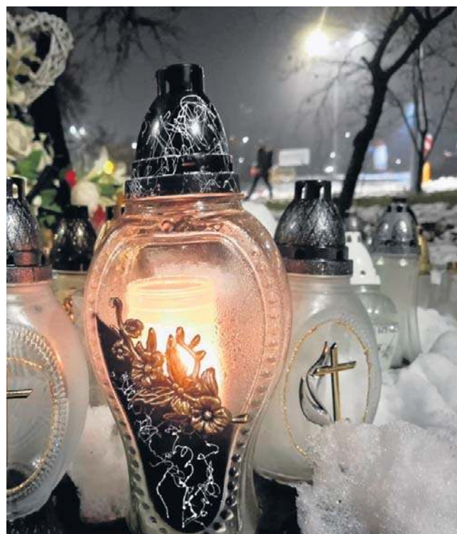
W tym miejscu w parku Glazja młody Wenezuelczyk bestialsko zaatakował 24-latkę