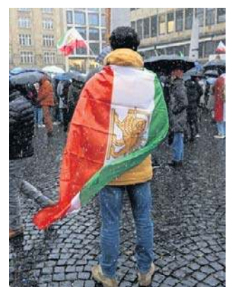
Również w Niemczech odbywają się demonstracje

Liczba ofiar trwających od 15 dni antyrządowych protestów w Iranie jest trudna do ustalenia ze względu na odcięcie przez władze dostępu do internetu. W nocy z soboty na niedzielę Agencja Informacyjna Aktywistów Praw Człowieka (HRANA), organizacja pozarządowa z siedzibą w USA, mówiła o 116 zabitych, zastrzegając jednak, że bilans ten obejmuje tylko potwierdzone zgony osób, których personalia są znane.