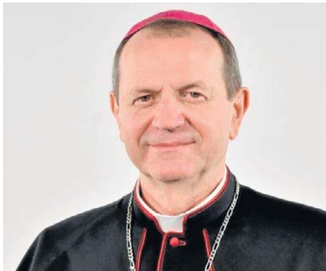
Abp Tadeusz Wojda, przewodniczący Konferencji Episkopatu Polski: - Trzeba kontynuować proces oczyszczania Kościoła z zaniedbań związanych z pedofilią

Obserwujemy dynamiczne zmiany cywilizacyjne nacechowane ogromnym relatywizmem. To powoduje, że stałe, funkcjonujące przez