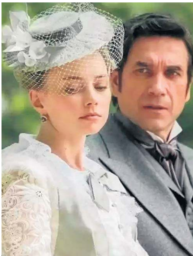
Zobaczymy aż dwie ekranizacje „Lalki” Bolesława Prusa

Kwiecień to premiera filmu „Michael” (reż. Antoine Fuqua). Opowieść o życiu i karierze Michaela Jacksona - od czasów, gdy w latach 60. i 70. XX wieku był członkiem zespołu Jackson 5, aż po ostatnie tygodnie życia