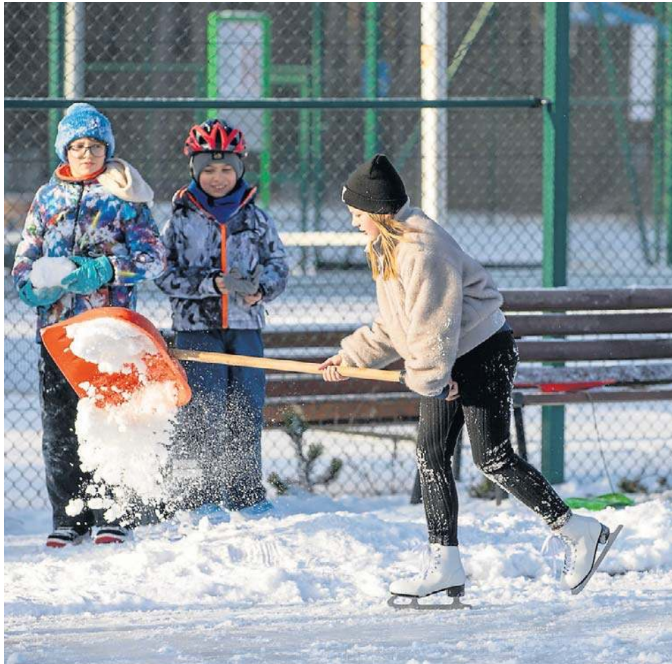
Osiedlowe lodowisko w Czerniewicach tętni życiem

W niedzielę 11 stycznia wielkiego mrozu nie było. Odpuścił dzień wcześniej. Na parking przy Grudziądzkiej zjechało kilkunastu wystawców, którzy urządzili tu swoje stoiska. Przeznaczone pod nie miejsca postojowe na parkingu musieli nieco oczyścić ze śniegu. Syzyfowa to była praca, bo jednocześnie leciał on z nieba...ale to miłośnikom pchlego targu nie przeszkadzało. Za to nad Wisłą było tego dnia było zimowo-bajecznie. ©©