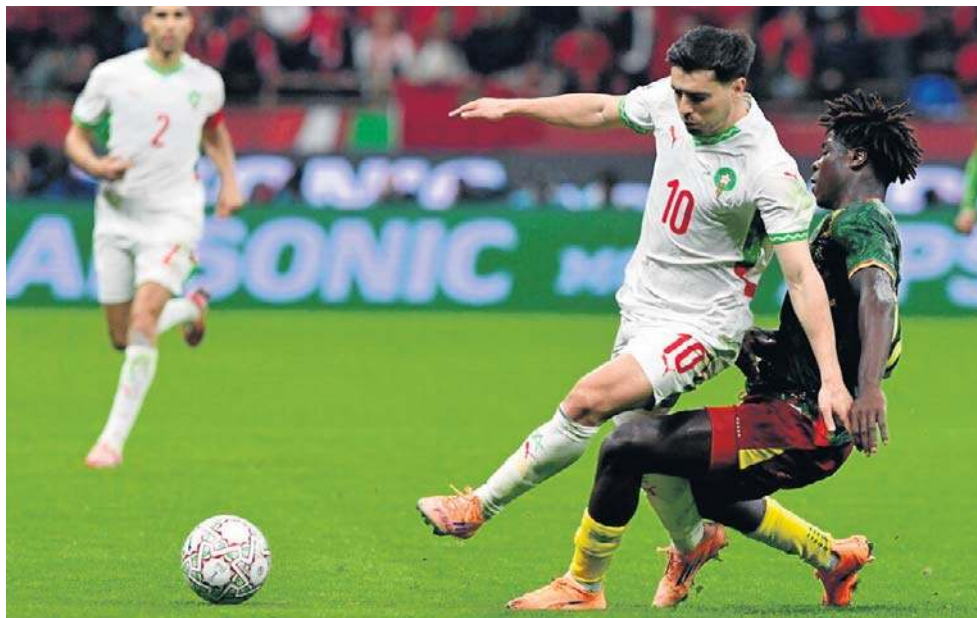
Brahim Díaz (nr 10), piłkarz reprezentacji Maroka i Realu Madryt rozgrywa życiowy turniej

Pograżona w kryzysie reprezentacja Kamerunu, nie zdołała sprawić sensacji i wyrzucić na etapie ćwierćfinału gospodarzy tegorocznego Pucharu Narodów Afryki. Brahim Diaz pierwszą bramkę dla Maroka zdobył już w 26. minucie. 26-letni skrzydłowy trafił we wszystkich pięciu meczach turnieju dla swojej reprezentacji.