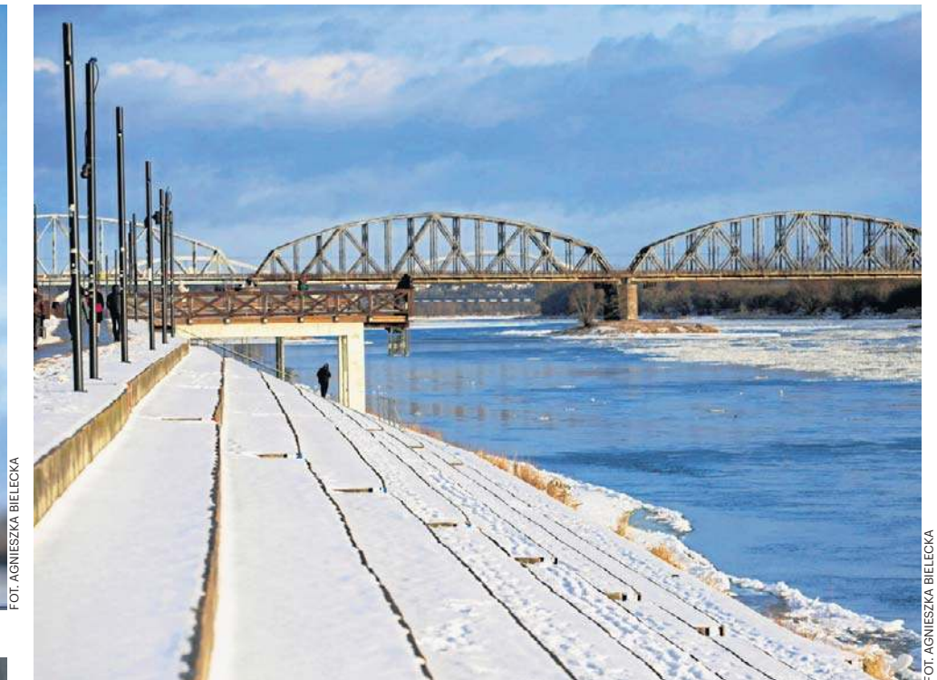
Wisła w pełnym słońcu ma zimą niepokojący urok