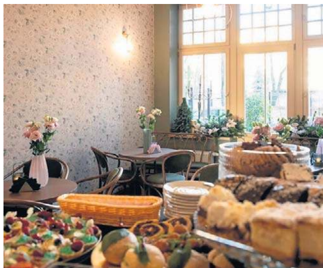
Bydgoskie Przedmieście z nową ofertą. Hostel i kawiarnia już działają w ramach ZAZ

Zakład powstał dzięki wsparciu finansowemu ze środków PFRON. Na remont i wyposażenie kamienicy przekazano 1,8 mln zł. Dysponentem środków był Samorząd Województwa Kujawsko-Pomorskiego. Organizatorem przedsięwzięcia jest Gmina Miasta Toruń. To dziesiąty Zakład Aktywności Zawodowej w regionie i pierwszy działający w Toruniu. ©