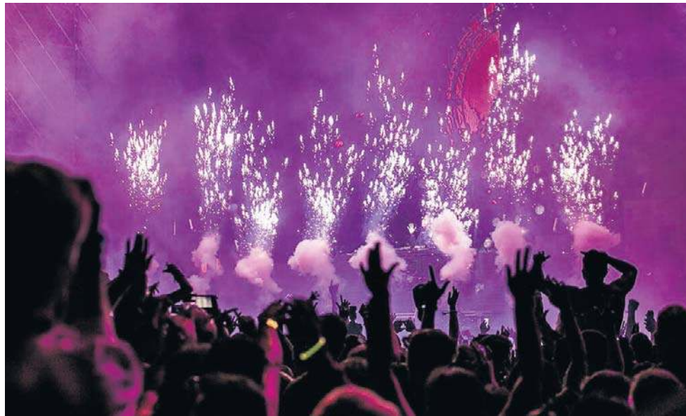
W tym roku w Toruniu szykuje się wyjątkowo ciekawy karnawał

Prędzej, bo już 17 stycznia, w Toruniu odbędzie się Legendarny Bal Prawnika. Ta impreza z długą tradycją organizowana jest przez lokalny oddział Stowarzyszenie Sędziów Polskich Iustitia. Zaprasza wszystkich