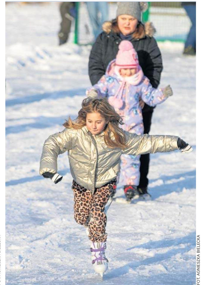
Mieszkańcy młodzi i starsi korzystają z uroków zimy