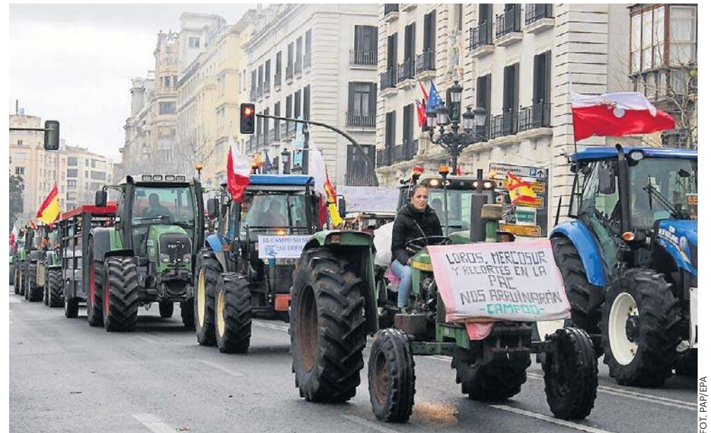
W kilku krajach europejskich, w tym w Polsce, Hiszpanii, Francji i Włoszech, miały miejsce protesty rolników przeciwko zatwierdzonej w piątek umowie

Porozumienie z Argentyną, Brazylią, Paragwajem i Urugwajem, które tworzą Mercosur, wprowadzi preferencje celne dla niektórych produktów rolnych, w tym produktów wrażliwych: wołowiny, drobiu, nabiału, cukru i etanolu. W zamian rynki tych państw otworzą się na towary przemysłowe UE, takie jak samochody, maszyny i leki.