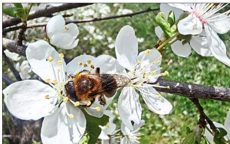
A Maja w robocie.