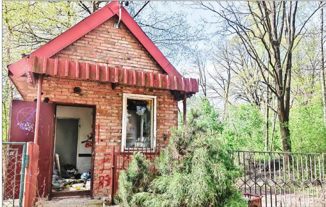
Stróżówka przy bramie stoi pusta i zdewastowana, ale wstępu broni kamera z alarmem.

Miesiąc później wyjaśniał w rozmowie z nami, że miejsce, do którego sam ma wielki sentyment, ma ogromny potencjał, który zamierza wykorzystać i rozwinąć. Nie zdradzał, jaką działalność ma zamiar prowadzić w ośrodku. Uchylił jedynie rąbka tajemnicy, mówiąc, że będzie to branża niezwiązana z tą, jaką na co dzień zajmuje się jego firma, czyli transportem. Czy pla-