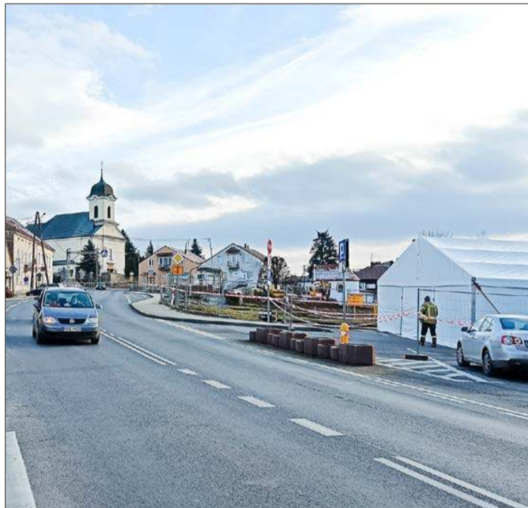
Dzięki nowej drodze z Rynku w Brzostku wyprowadzony zostanie ruch.

Sprawa trafiła najpierw do Krajowej Izby Odwoławczej, a następnie do sądu. I takiego wyroku nie spodziewał się chyba nikt. Z postępowania wyeliminowane zostały dwie najtańsze oferty – zarówno ta przedstawiona przez konsorcjum NDI, jak i Porr. W tej sytuacji najbliższej realizacji robót jest obecnie Budimex, który za wybudowanie obwodnicy chce otrzymać ok. 439 mln zł. Co prawda w grze pozostają jeszcze Mirbud, który zaproponował 464,3 mln zł, jednak to właśnie