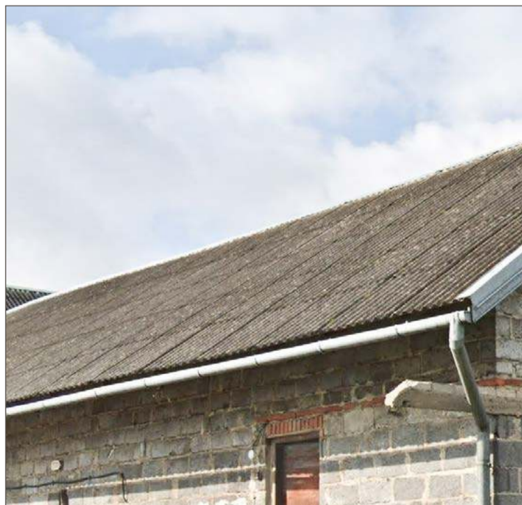
W gminie Jodłowa wciąż nie brakuje budynków, na których znajduje się eternit.