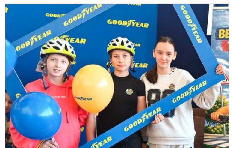
Pamiątkowe zdjęcie już w nowych kaskach.