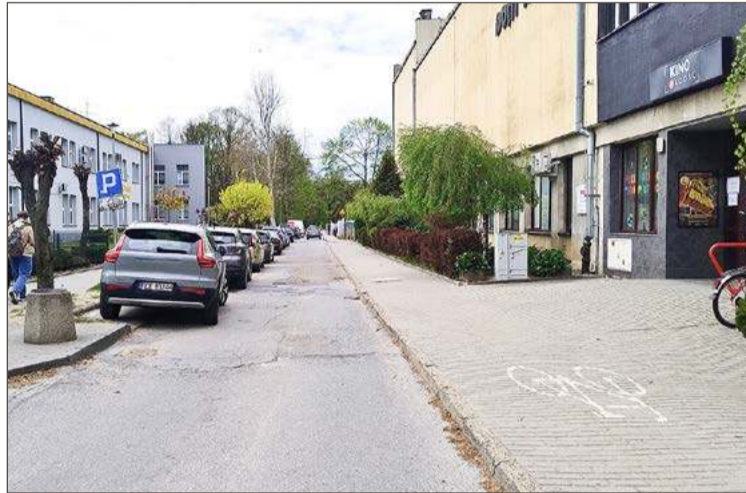
Wzdłuż ul. Lisa bardzo często stoją zaparkowane samochody.

Burmistrz twierdzi, że droga jest na tyle szeroka, że ten bez proble-