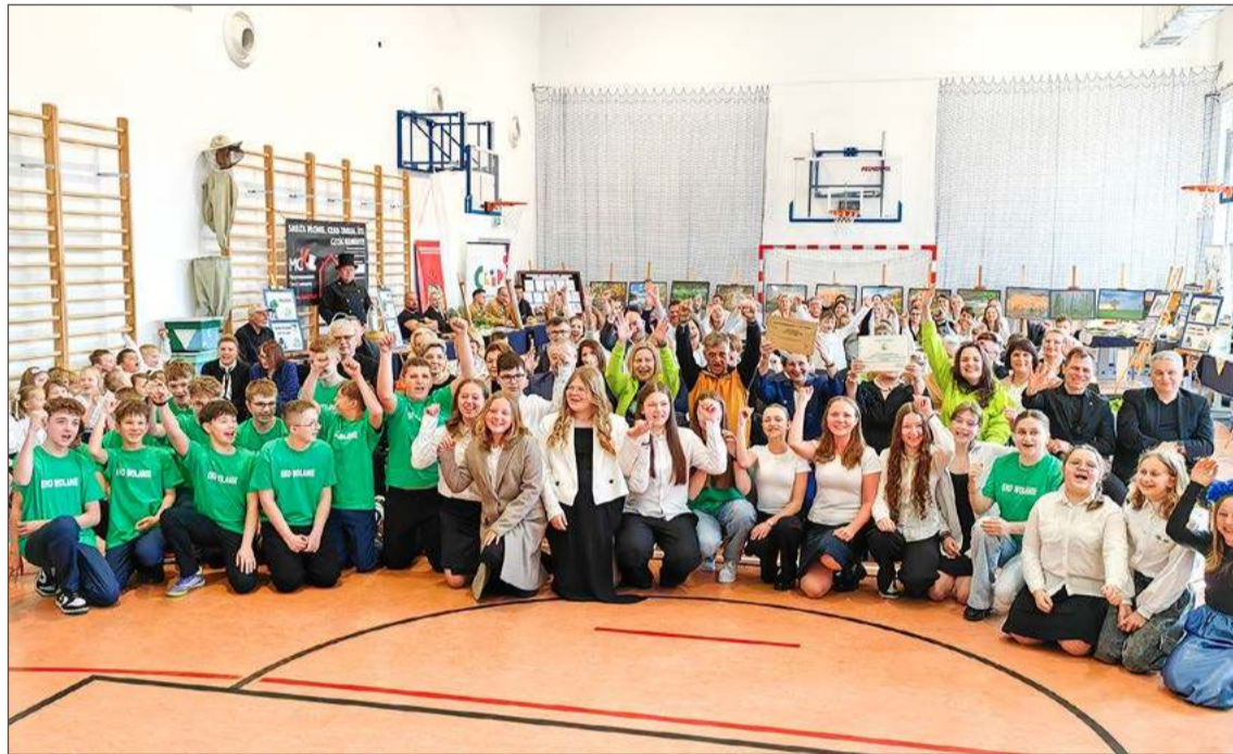
Społeczność szkoły w Woli Wielkiej wraz z gośćmi obchodów Dnia Ziemi 2026.

Szkoła, którą kieruje, z działań proekologicznych słynie od lat.