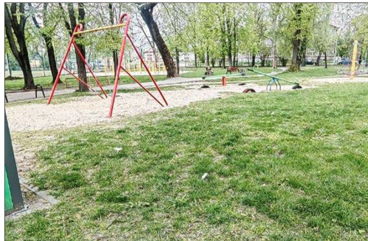
Na placu zabaw w ogródku jordanowskim po weekendzie było czysto.

– Ale, żeby nie było, że ja się chcę wymigać od odpowiedzialności, czy coś. Jeśli mieszkańcy widzą, że jest brudno, powinni dzwonić bezpośrednio do nas. Na pewno nie zostaną zlekceważeni – pod- kreśla prezes.