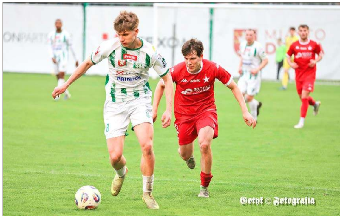
Wisłoka (biało-zielone stroje) dzięki zwycięstwu nad Wisłą II Kraków awansowała na szóste miejsce w tabeli.