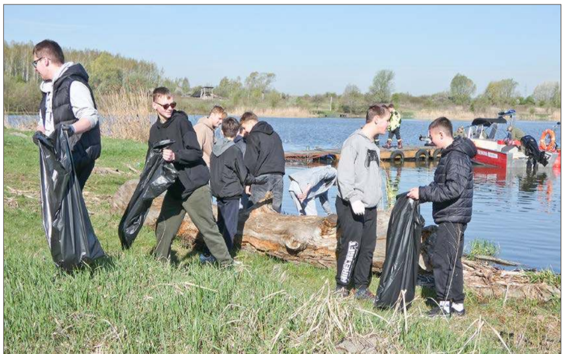
Najmłodsi uczestnicy Sprzątania Świata z SP w Strzegocicach ruszyli brzegiem w kierunku Jaworza Dolnego.

- Było bardzo dużo śmieci w tej tatarce, gdzie nie da rady się dostać z brzegu, dlatego łodzie są tak ważne. Poprosiliśmy, żeby ich było jak