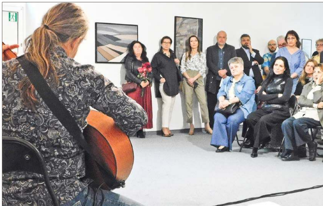
Muzyka tria, które wystąpiło podczas wernisza, również nawiązywała do tematu wystawy.

Inspiracją wystawy było ogromne dziedzictwo kulturowe Podkarpacia, ale nie tylko to, bo i folklor, czy pejzaże. Choć czasem nawet drobne, zaskakujące rzeczy.