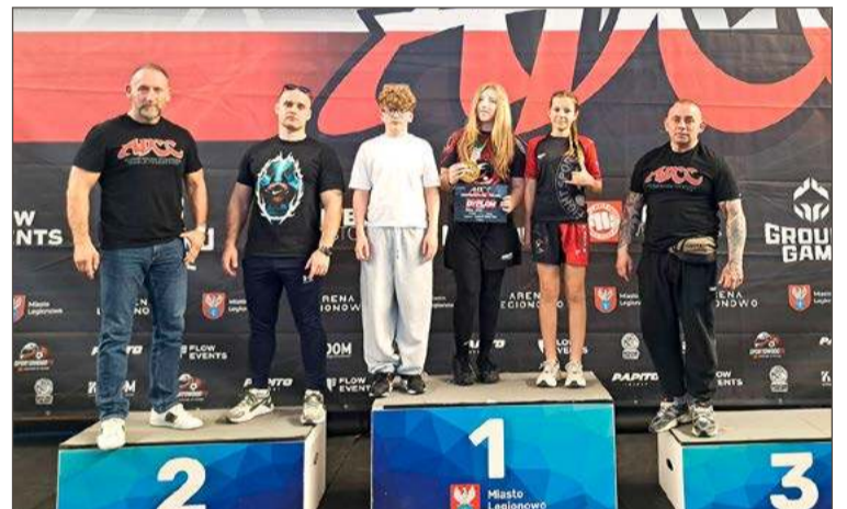
Reprezentacja klubu FightSports Dębica.

Gościem honorowym wydarzenia był olimpijczyk Józef Lipień