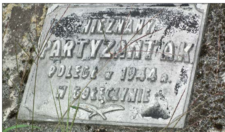
Pamiętajmy o Nich.