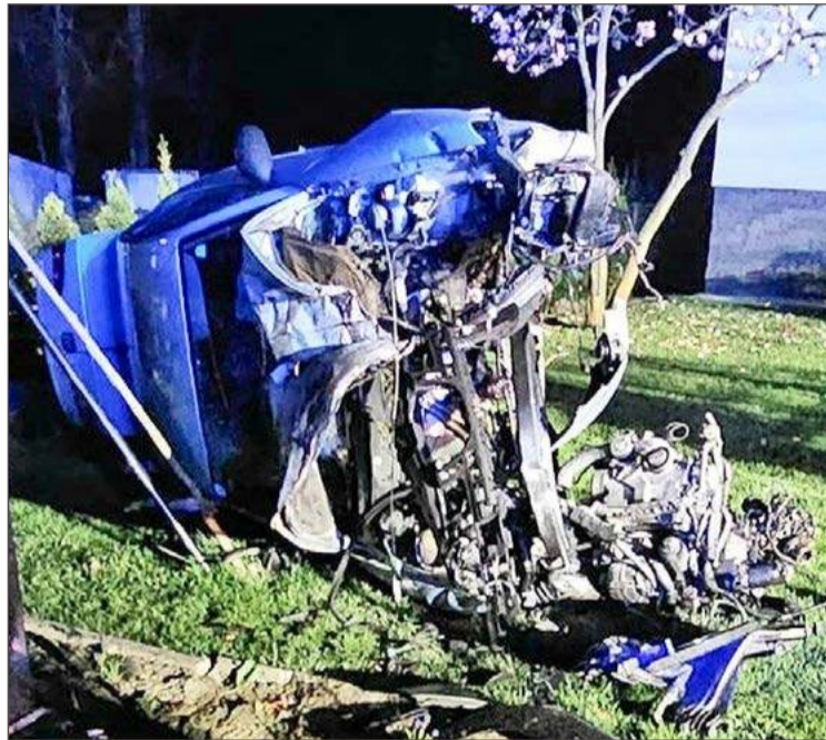
Seat Cordoba, który był prowadzony przez 32-latkę roztrzaskał się na ogrodzeniu prywatnej posesji.

- Okazało się, że 32-latek nie odniósł poważnych obrażeń i po badaniach został przewieziony do dębickiej komendy, gdzie został osadzony w areszcie - mówi podkom. Jacek Bator, rzecznik prasowy Komendy Powiatowej Policji w Dębicy.