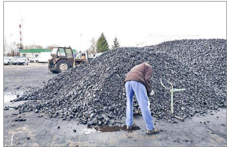
Pieniądzy na kocioł węglowy, nawet ten wysokiej klasy, nie otrzymamy.