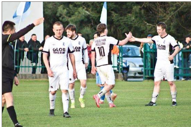
Piłkarze Paszczyniaka tym razem pokonali Pogórze Wielopole Skrzyńskie.