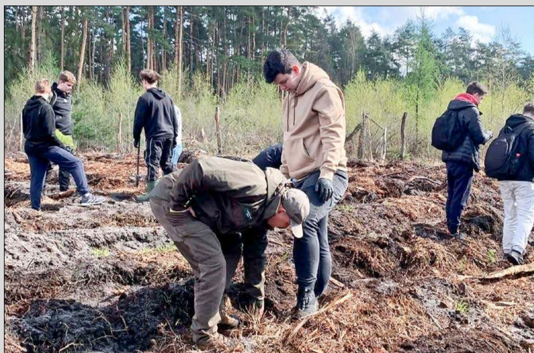
Prawie 5500 drzew iglastych zasadzili uczniowie szkół ponadpodstawowych z powiatu dębickiego podczas dwudniowej akcji zorganizowanej przez Nadleśnictwo Dębica i Starostwo Powiatowe. W dorocznej, IX edycji akcji sadzenia lasu uczestniczyło ponad 150 uczniów z opiekunami. Sosny zwyczajnie sadzili na terenie Leśnictwa Chotowa, w miejscu wyciętych wcześniej drzew.