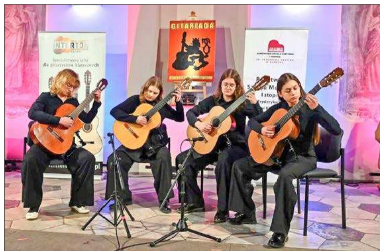
Kwartet gitarowy w Kłodzku zdobył pierwszą nagrodę.