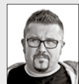
ratusznik@ol.com.pl tel. 14 670 27 80