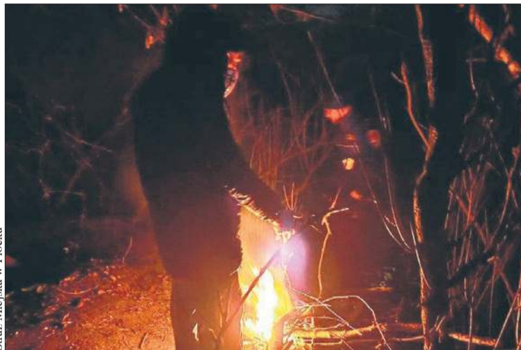
Straż Miejska w Płocku

Jak podaje, mężczyzna zarówno podczas porannej, jak i wieczornej interwencji był trzeźwy. Odmówił jakiegokolwiek pomocy.