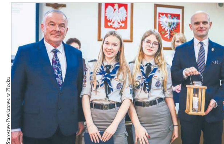
Harcerze przekazali samorządowcom Betlejemskie Światło Pokoju