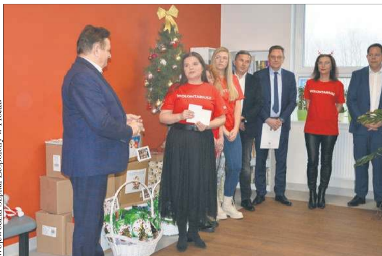
Wolontariusze Fundacji ORLEN i ORLEN Laboratorium odwiedzili pacjentów Oddziału Onkologicznego i Klinicznego Oddziału Dziecięcego Wojewódzkiego Szpitala Zespołowego w Płocku przekazując prezenty pełne serca