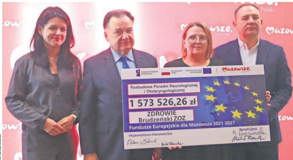
W ramach unijnego wsparcia przychodnia Zdrowie – Brudzeński Zakład Opieki Zdrowotnej otrzymała dofinansowanie w wysokości 1,5 mln zł

Marszałek Adam Struzik podkreślił, że inwestycje w zdrowie mieszkańców województwa to priorytet władz regionu. – Dzięki środkom z Unii Europejskiej możemy realnie poprawiać jakość usług medycznych,