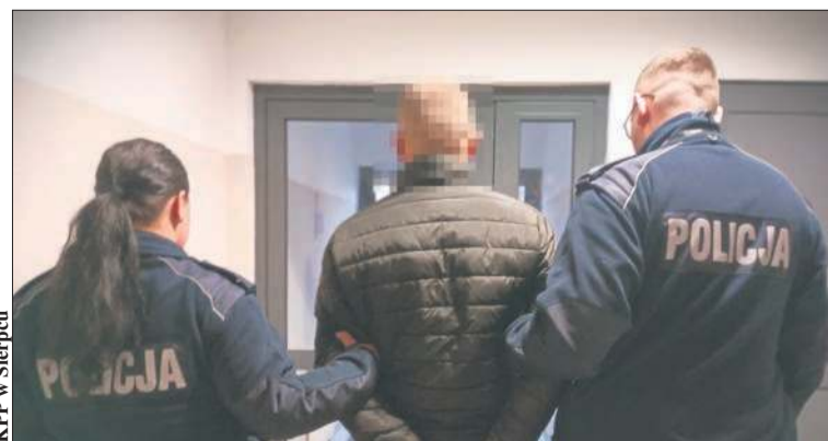
KMP w Sierpcu

Krewki 38-latek z Lelic najbliższe 3 miesiące spędzi w policyjnym areszcie