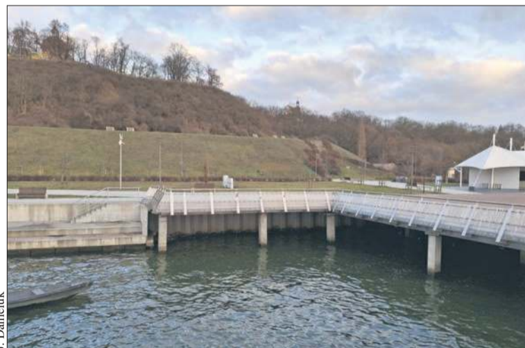
Nabrzeże w rejonie nasady moła wymaga remontu

z budową pomostu spacerowego w części nabrzeża wykonano słupy, na których wsparto konstrukcję moła, a obszar wokół słupów został umocniony warstwą betonu. Jednak w trakcie oględzin terenu stwierdzono silną destrukcję nabrzeża wiślanego – na długości około 25 metrów – u nasady pomostu na długości ok. 25 m. Górna, pozioma część utwardzenia zapadła się na głębokość dochodzącą do ponad 1 metra, a grunt sypki znajdujący się pod trylinkami został wymyty w warstwie o grubości około 1 metra, na długości 25 metrów i szerokości 2,5-3 metrów. Ponadto stwierdzono, że wody opadowe z terenu utwardzonego znajdującego się wokół wiaty gastronomicznej spływają bezpośrednio na koronę ściany oporowej wykonanej u nasady moła spacerowego, a następnie na utwardzenie nabrzeża wiślanego, które ze względu na konstrukcję, jak i ukształtowane spadki