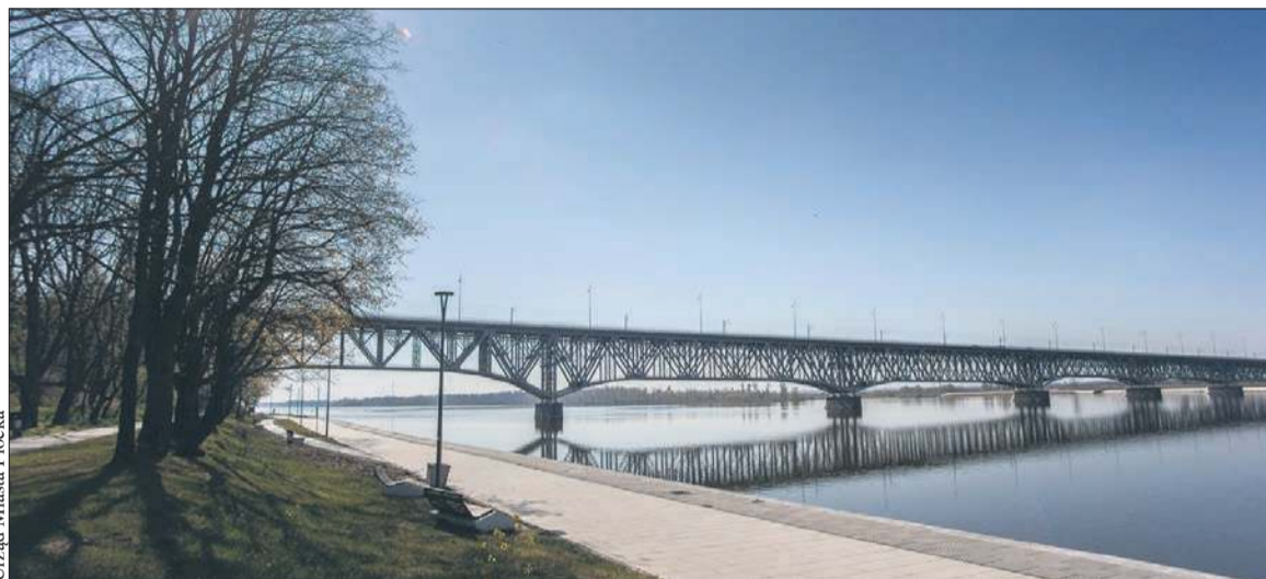
Pod starym mostem przez Wisłę w Płocku powstanie kładka dla rowerzystów

Projekt obejmuje w sumie jedenaście zadań. Najważniejsze to wspomniana już budowa kładki rowerowej połączonej z istniejącym mostem Legionów Józefa Piłsudskiego przez Wisłę w Płocku wraz z dojazdami – trasa R-21. Zakres obejmuje zaprojektowanie, a następnie wykonanie przedsięwzięcia polegającego na wybudowaniu 995 m ciągu pieszo-