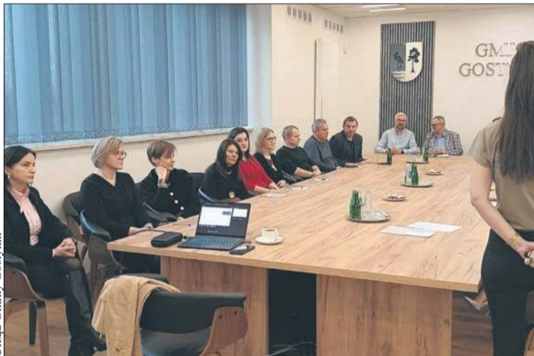
Szkolenie dla pracowników Urzędu Gminy Gostynin i radnych w zakresie ochrony ludności i obrony cywilnej

Koniec roku przyniósł w gminie Gostynin serię ważnych decyzji i działań samorządowych. Podpisano umowę na odbiór i zagospodarowanie odpadów w 2026 roku oraz umowę na świadczenie publicznego transportu zbiorowego. Odebrano także zmodernizowaną drogę powiatową i stację uzdatniania wody w Lucieniu, a pracownicy urzędu i radni wzięli udział w szkoleniu z zakresu ochrony ludności i obrony cywilnej. Wszystkie te przedsięwzięcia mają bezpośrednio przełożyć się na poprawę jakości życia mieszkańców gminy.