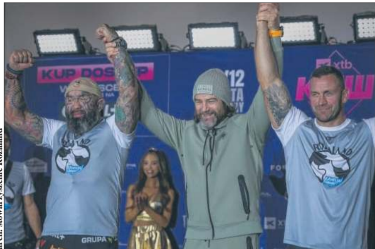
arch. stowarzyszenie Różaland

Przypomnijmy, jak wyglądała sytuacja. W ciągu dwóch miesięcy Stowarzyszenie „Pomagaj Pomagać – Różaland” było zmuszone zebrać półtora miliona złotych, by kupić teren, który od lat jest azylem dla 25 koni uratowanych z różnych życiowych opresji. To blisko 6 hektarów ziemi niedaleko Płocka, położonych w Borowiczkach-Pieńkach w gm. Słupno. Dzierżawiony od 2017 roku przez Różaland teren trafił bowiem na sprzedaż.