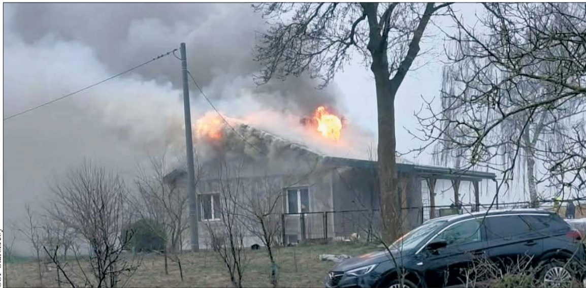
Pożar domu jednorodzinnego w Słomkowie

ognia. Mieszkańcy opuścili budynek przed przybyciem służb.