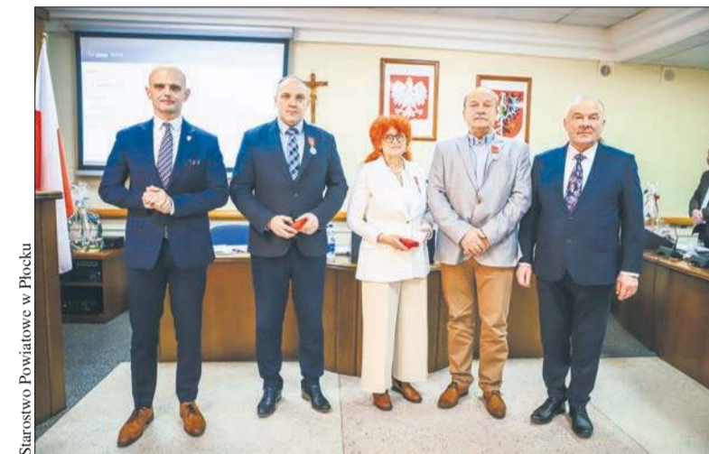
Podczas sesji trzy osoby zostały odznaczone medalem „Zasłużony dla Powiatu Płockiego”