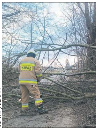
OSP Nowy Duninów

Zgłoszenie wpłynęło do dyżurnego o godzinie 8:40. Po przyjeździe na miejsce strażacy zastali drzewo tarasujące drogę, co stwarzało realne zagrożenie dla kierowców podróżujących w świąteczny poranek. Szybka i sprawna akcja pozwoliła