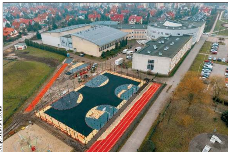
Kończy się przebudowa boiska przy Zespole Szkół nr 5 przy ul. Kutrzeby