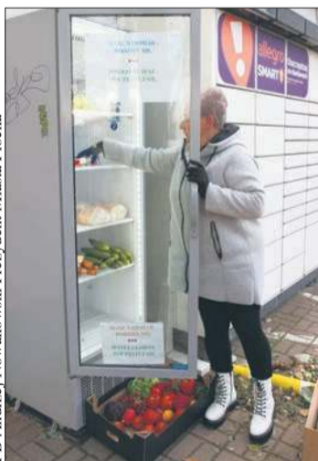
Jedna z lodówek społecznych w Płocku

cymi. W naszym mieście działa 6 lodówek społecznych, do których każdy może włożyć nadmiar potraw, produktów z długą datą przydatności do spożycia lub domowych wypieków. Zachęcam do tego prostego gestu, który innym może pomóc i sprawić radość – podał na swoim profilu w mediach społecznościowych prezydent Płocka Andrzej Nowakowski.