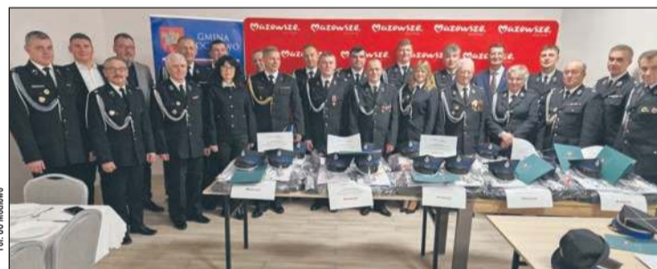
Nowe mundury wyjściowe przekazano do dziesięciu jednostek OSP z terenu gminy Mochowo

Strażacy z dziesięciu gminnych jednostek Ochotniczych Straży Pożarnych z terenu gminy Mochowo otrzymali nowe mundury wyjściowe. Zakupiono je dzięki wsparciu Samorządu Województwa Mazowieckiego w ramach programu „OSP – edycja 2025”.