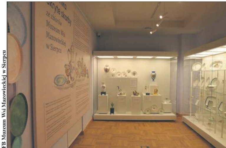
Zabytkową ceramikę ze zbiorów Muzeum Wsi Mazowieckiej w Sierpcu można oglądać w sierpeckim Ratuszu do końca 2026 roku

O tym, że warto znaleźć czas na obejrzenie tej przepięknej kolekcji, nie trzeba przekonywać. Bo znajdują się tu niezwykle, krusze skarby, które – jak podkreślano na otwarciu wystawy (15 grudnia, 2025 roku) – zostały wydobyte z magazynów oraz muzealnych kredensów i serwantek, gdzie stanowiły jedynie detale. – Dzięki wystawie zyskały rangę obiektów pierwszoplanowych, pozwalającej dostrzec i ukazać ich wyjątkowe piękno – zaznaczano podczas otwarcia wystawy.