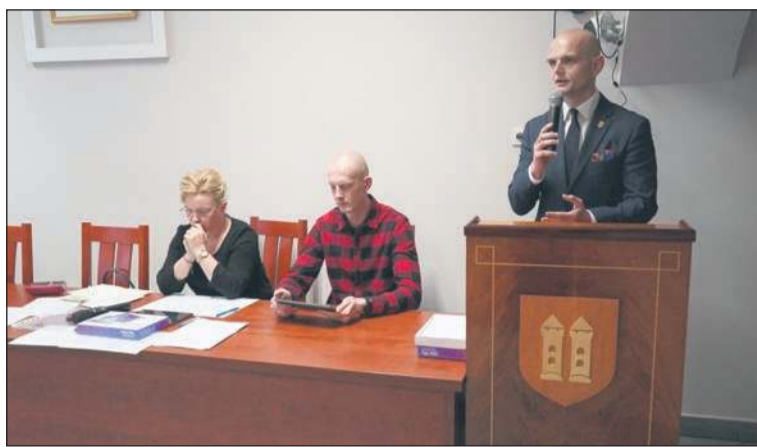
Podczas sesji w Wyszogrodzie Starosta opowiedział o działaniach samorządu powiatowego