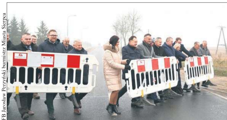
Zakończono rozbudowę drogi wojewódzkiej nr 541 w Sierpcu. Na prace prowadzone na odcinku o długości 1,3 kilometra przebiegającym przez ulicę Głowackiego w Sierpcu, przeznaczono kwotę ponad 9,3 mln zł.

wniony – powiedział marszałek Adam Struzik podczas uroczystego otwarcia zmodernizowanego odcinka ulicy Głowackiego.