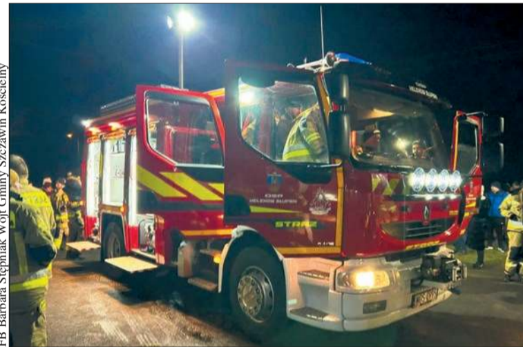
Nowy wóz zasilil jednostkę OSP Helenów Słupski

Ten pojazd zastąpił wysłużonego Jelcza na podwoziu Star – to ogromny krok naprzód dla jednostki. (kw)