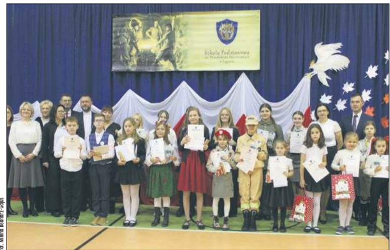
Laureaci i wyróżnieni uczniowie VIII Przeglądu Piosenki i Pieśni Patriotycznej organizowanego w Mochowie