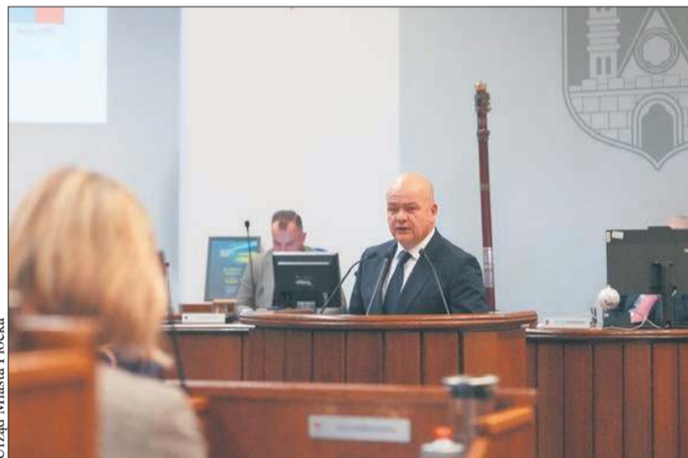
Podczas grudniowej sesji rady miasta prezydent Andrzej Nowakowski przedstawił założenia budżetu na 2026 rok. 17 z 25 radnych głosowało za przyjęciem dokumentu

W przyszłym roku zrealizowanych zostanie kilka przedsięwzięć o dużej skali finansowej, które udoskonaliły miejski układ komunikacyjny.