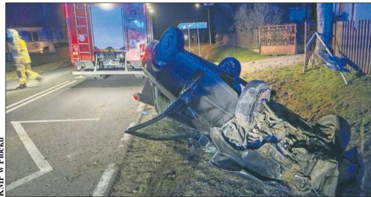
KMP w Płocku

W Rumunkach doszło w niedzielę do groźnego wypadku