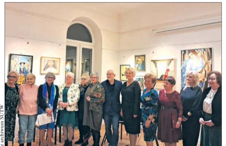
Uczestnicy wernisażu „Art déco wciąż inspiruje” w Książnicy Płockiej