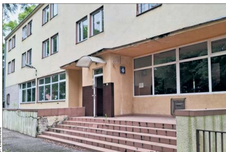
W budynku przy ul. Mościckiego 27 powstanie dedykowane seniorom Centrum Wsparcia Społecznego

Jednak budynek przy ulicy Mościckiego nie mógł stać nadal pusty. Tak narodził się pomysł stworzenia Centrum Wsparcia Społecznego. Jak już kilka miesięcy temu informowaliśmy czytelników „Tygodnika Płockiego”