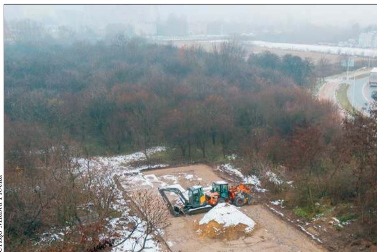
Na osiedlu Międzytorze powstaje nowy park

Co ważne, płocki samorząd pozyskał na realizację prac dofinansowanie. Pieniądze pochodzą ze środków Unii Europejskiej w ramach programu Europejskiego Funduszu Rozwoju Regionalnego w ramach Priorytetu: II „Fundusze Europejskie na zielony