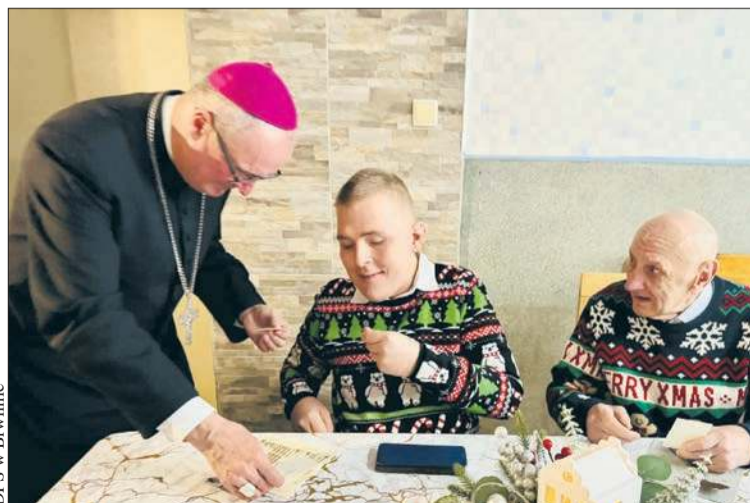
W spotkaniu wigilijnym z mieszkańcami DPS w Brwilnie wziął udział Biskup płocki Szymon Stulkowski

Spotkanie rozpoczęła uroczysta msza święta, której przewodniczył biskup płocki Szymon Stulkowski. Po