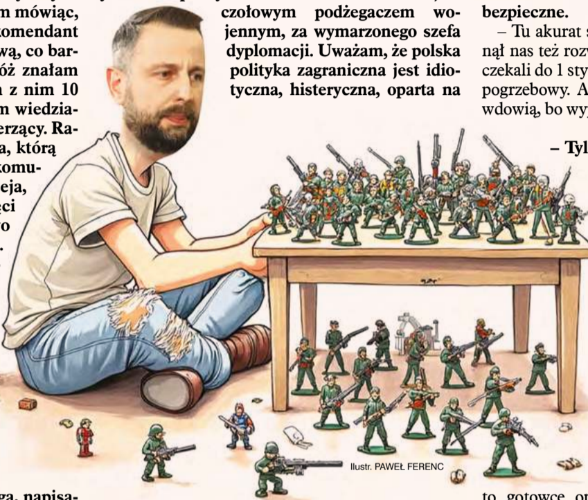
Ilustr. PAWEŁ FERENC

– O, bardzo przepraszam, mów za siebie. Ja absolutnie nie uważam faceta, który mówi i pisze wszystko, co mu przyjdzie do głowy – „Thank you USA” po wysadzeniu Nord Stream 2 – i jest czołowym podżegaczem wojennym, za wymarzonego szefa dyplomacji. Uważam, że polska polityka zagraniczna jest idiotyczna, histeryczna, oparta na