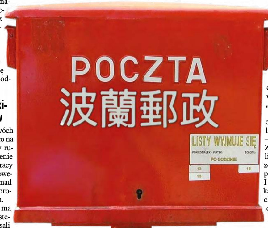
Ilustr. PAWEŁ FERENC