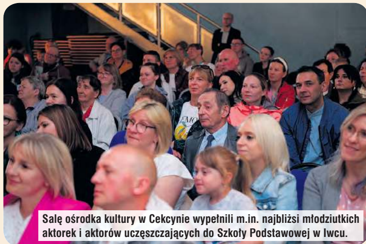
Salę ośrodka kultury w Cekcynie wypełnili m.in. najbliżsi młodziutkich aktorek i aktorów uczęszczających do Szkoły Podstawowej w Iwcu.