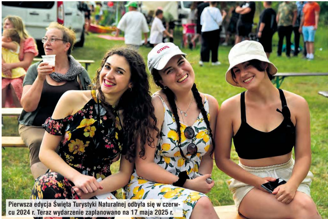
Pierwsza edycja Święta Turystyki Naturalnej odbyła się w czerwcu 2024 r. Teraz wydarzenie zaplanowano na 17 maja 2025 r.

Imprezę zaplanowano na najbliższą sobotę – 17 maja. W kilku miejscach naraz odbywać będą się przeróżne wydarzenia związane z atrakcjami turystycznymi w Borach Tucholskich. Wieczorem wszyscy spotkają się w CamperPark Woziwoda. A tam m.in. nastrojowy koncert. Sprawdź, czym jest Święto Turystyki Naturalnej!