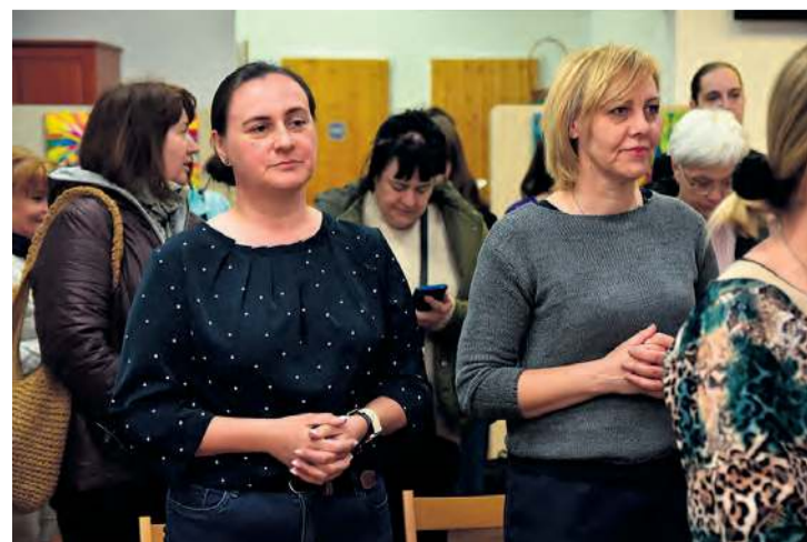
W trakcie litanii loretańskiej modlono się m.in. za nowego papieża.