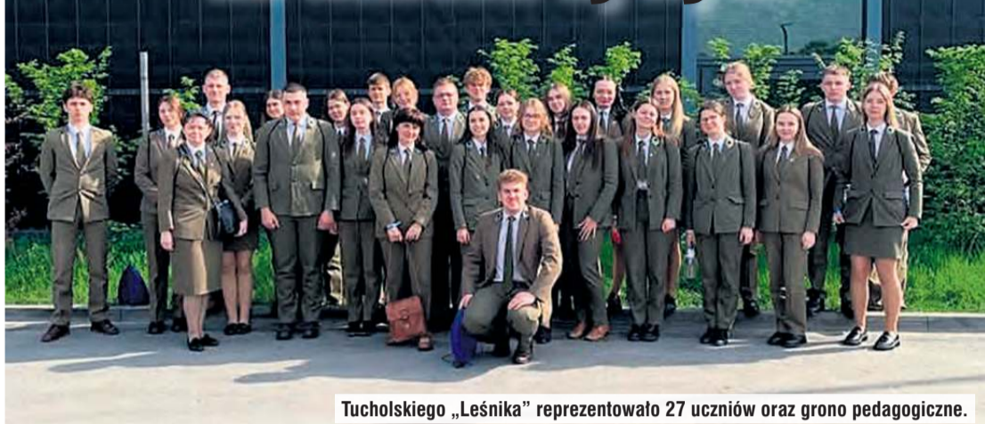
Tucholskiego „Leśnika” reprezentowało 27 uczniów oraz grono pedagogiczne.

Od 1988 roku, dzięki międzynarodowej inicjatywie organizowany jest Marsz Żywych, którego celem jest upamiętnienie ofiar Holokaustu. Wydarzenie to również okazja, aby edukować młode pokolenia o kreowaniu codziennego życia wolnego od destrukcyjnej nienawiści i sztucznych podziałów.