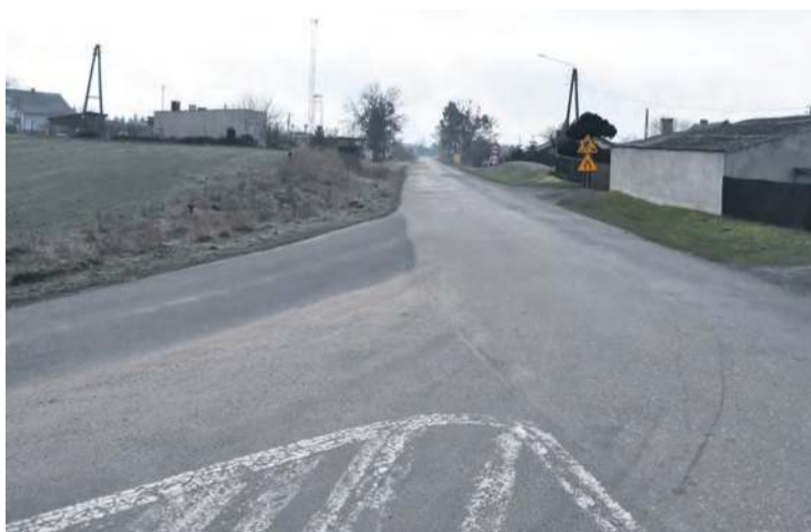
Ruszyły prace związane z przebudową drogi powiatowej pomiędzy Bystawiem a Cekcynem w miejscowości Welpin.

Powiat tucholski kontynuuje ważną inwestycję drogową, jaką jest sukcesywne przebudowywanie drogi powiatowej relacji Cekcyn – Sokole Kuźnica na odcinku pomiędzy Bystawiem a Cekcynem. Tym razem modernizowany będzie ponad 1,5-kilometrowy fragment drogi od wsi Welpin w kierunku lasu pod Cekcyn. To zadanie podzielono na trzy etapy. Szczegóły poniżej.