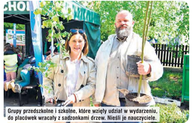
Grupy przedszkolne i szkolne, które wzięły udział w wydarzeniu, do placówek wracały z sadzonkami drzew. Nieśli je nauczyciele.

Tucholski Park Krajobrazowy wraz z partnerami zaprosił w czwartek (8.05) na wydarzenie z okazji Dnia Ziemi. Na edukacyjnych stoiskach usytuowanych przed siedzibą parku, czekało gros ciekawych informacji i zajęć. Można było m.in.: przejechać się energorowerem, zaprojektować wzór lnianej torby, wykonać pamiątkowy medal, a zużyte ubrania wymienić na miododajną roślinę.