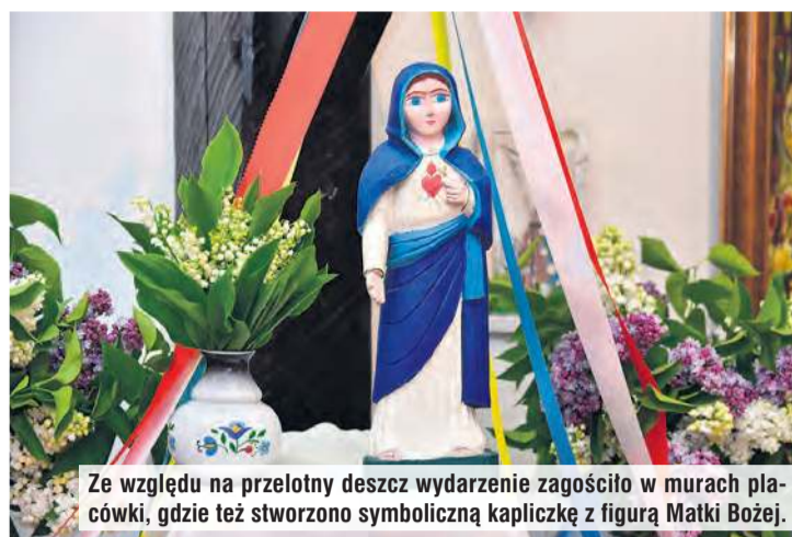
Ze względu na przelotny deszcz wydarzenie zagościło w murach placówki, gdzie też stworzono symboliczną kapliczkę z figurą Matki Bożej.

– Znalazła się tam dla uczczenia powrotu Polski na mapę Europy, chociaż Tuchola była wówczas jeszcze pod panowaniem pruskim – oznajmiła regionalistka, która też przytoczyła historię figury.