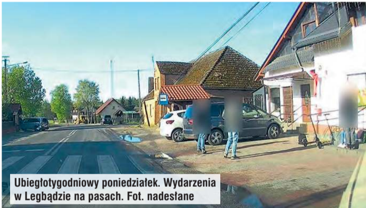
Ubiegłotygodniowy poniedziałek. Wypadki w Legbądzie na pasach.