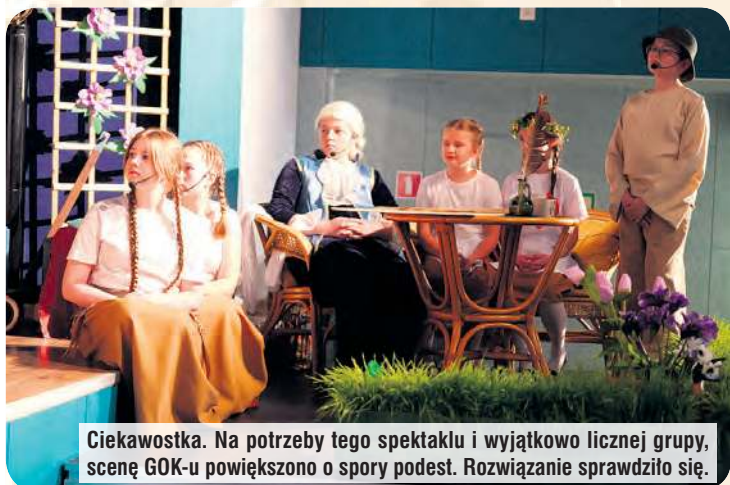
Ciekawostka. Na potrzeby tego spektaklu i wyjątkowo licznej grupy, scenę GOK-u powiększono o spory podest. Rozwiązanie sprawdziło się.