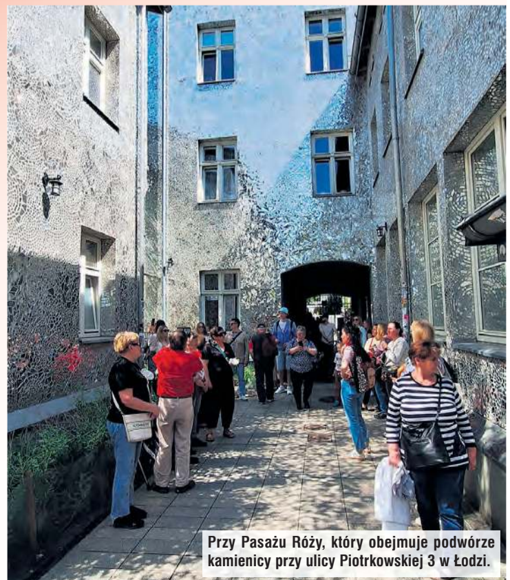
Przy Pasażu Róży, który obejmuje podwórze kamienicy przy ulicy Piotrkowskiej 3 w Łodzi.