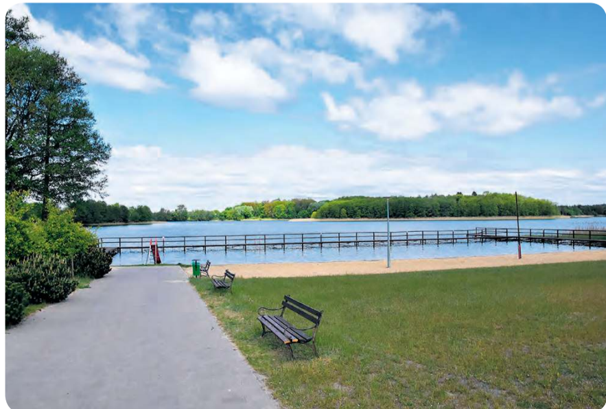
Plaża w Bysławiu cieszy się dużym zainteresowaniem ze strony lokalnych mieszkańców i turystów. Na brzegu znajduje się dużo wolnej przestrzeni do aktywnego spędzania czasu. Atutem są również pomosty.

ZATRUDNIMY pracowników do pracy w Niemczech w ogrodnictwie