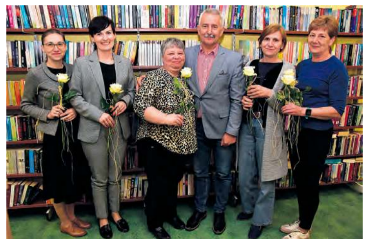
Jako, że ogłoszenie wyników konkursu miało miejsce w Tygodniu Bibliotek, burmistrz Tucholi miał dla każdej z bibliotekarek po białej różę.