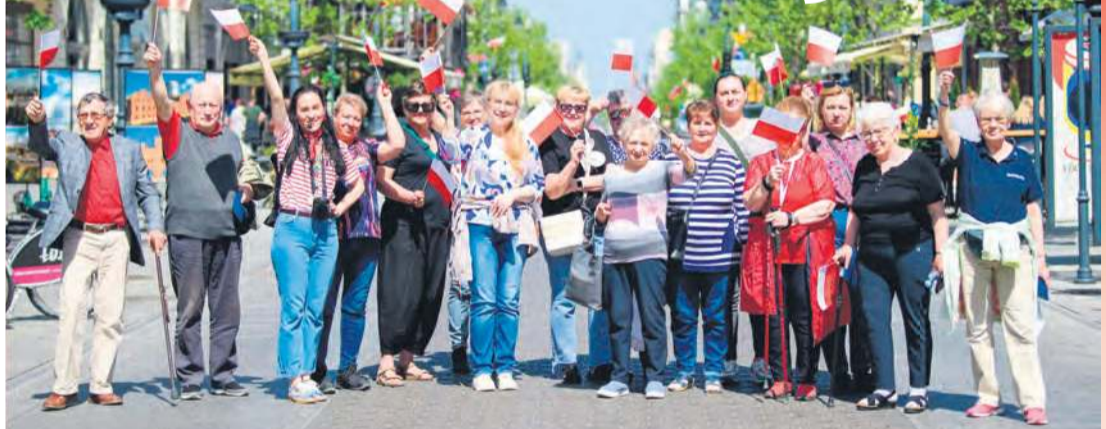
Członkowie BTK podczas zwiedzania Łodzi włączyli się do świętowania Biało – Czerwonej wspólnie z łodzianami. Pochód wyruszył z pasażu Schillera do Manufaktury, gdzie odbył się uroczysty finał święta. Grupę z Tucholi uwieczniło Radio Łódź.

Za cel uczestnicy wycieczki obrali sobie zwiedzenie miejsc historycznych na Ziemi Łódzkiej, związanych z początkami Królestwa Polskiego i Patronką Tucholi – św. Małgorzatą oraz miejsc i obiektów ważnych dla historii miasta Łodzi.