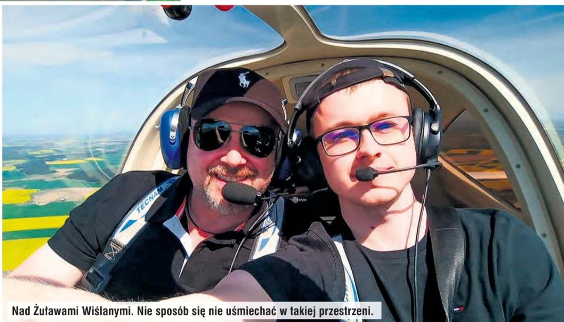
Nad Żuławami Wiślany. Nie sposób się nie uśmiechać w takiej przestrzeni.

Na lotnisku trzeba pojawić się odpowiednio wcześniej, by dopełnić formalności, przy-