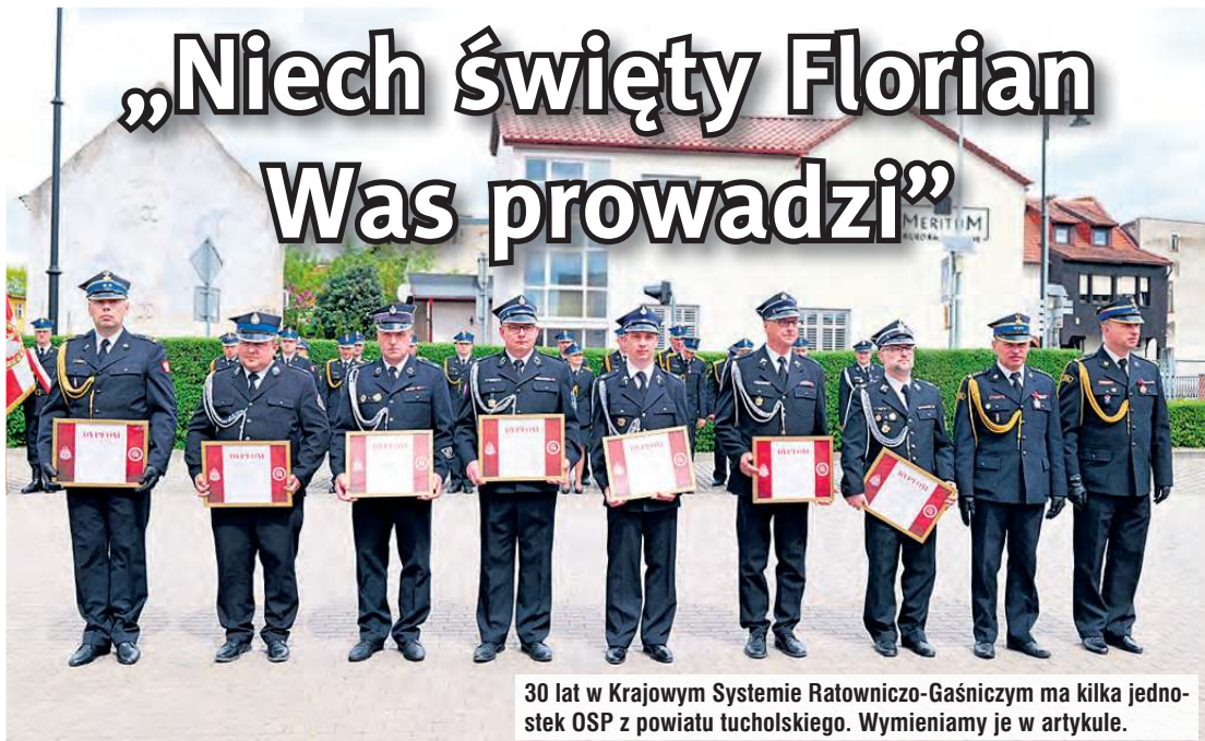
30 lat w Krajowym Systemie Ratowniczo-Gaśniczym ma kilka jednostek OSP z powiatu tucholskiego. Wymieniamy je w artykule.

Dzień Strażaka uczciła Komenda Powiatowa Państwowej Straży Pożarnej w Tucholi. Uroczystość, w której programie tradycyjnie zawarły się strażackie odznaczenia, odbyła się w piątek 9 maja na dziedzińcu komendy. Dodatkowy punkt to uczczenie jubileuszy jednostek OSP, które należą do Krajowego Systemu Ratowniczo-Gaśniczego od 30 lat.