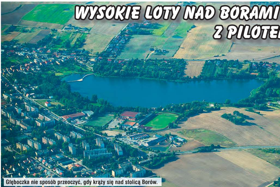
Głębozka nie sposób przeoczyć, gdy krąży się nad stolicą Borów.