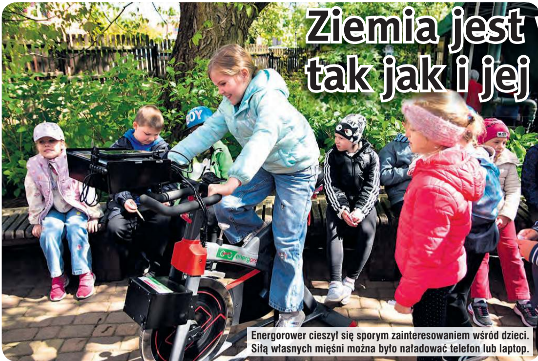
Energorower cieszył się sporym zainteresowaniem wśród dzieci. Siłą własnych mięśni można było naładować telefon lub laptop.