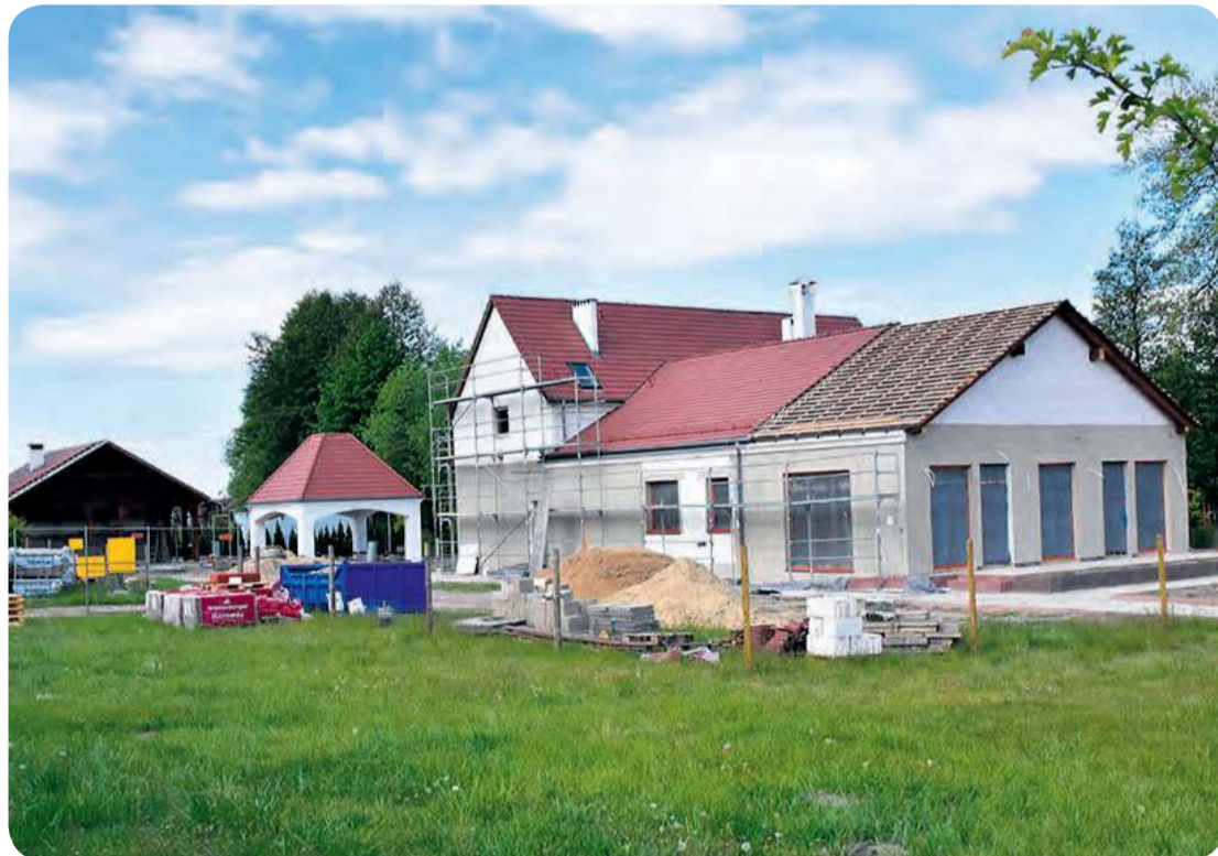
Najważniejszym elementem infrastruktury na plaży w Bysławiu będzie całoroczny budynek gastronomiczny.