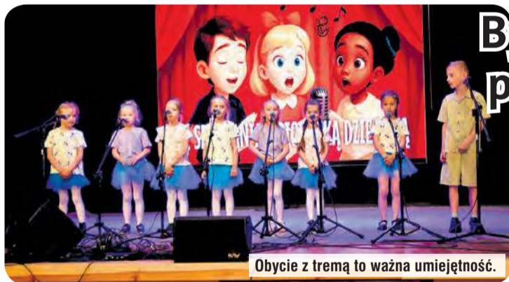
Obycie z tremą to ważna umiejętność.

Ideą 47. Spotkań z Piosenką Dziecięcą było zaprezentowanie dorobku artystycznego solistów i dziecięcych zespołów wokalnych. Nie bez znaczenia była promocja talentu dzieci i młodzieży, a także wyłonienie spośród nich najbardziej utalentowanych osób. Wartością nadrzędną przesłuchania