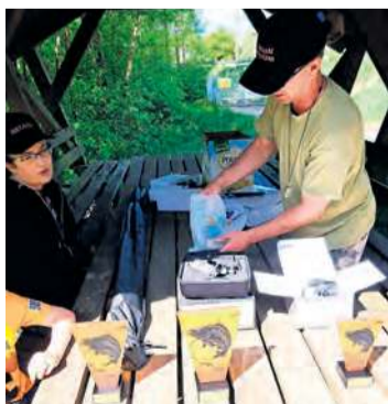
Przygotowania do dekoracji. Na najlepszych czekają statuetki.