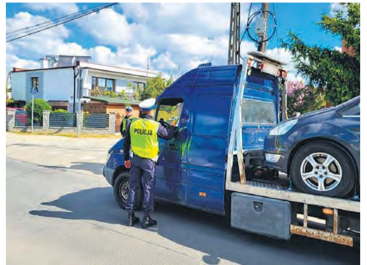
Drogówka prowadziła kontrole na głównych ciągach komunikacyjnych oraz na lokalnych drogach.