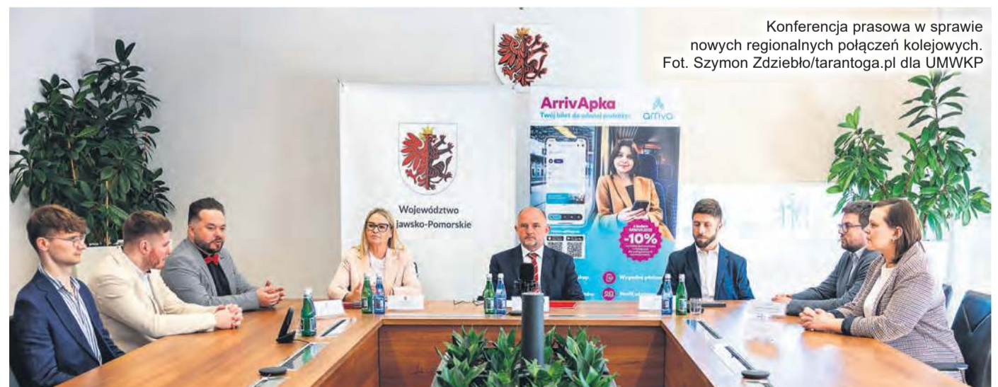
Konferencja prasowa w sprawie nowych regionalnych połączeń kolejowych.

Wysokość dotychczasowych inwestycji samorządu województwa kujawsko-pomorskiego w tabor (po uwzględnieniu inflacji) wyniósł ponad 571,4 milionów złotych.