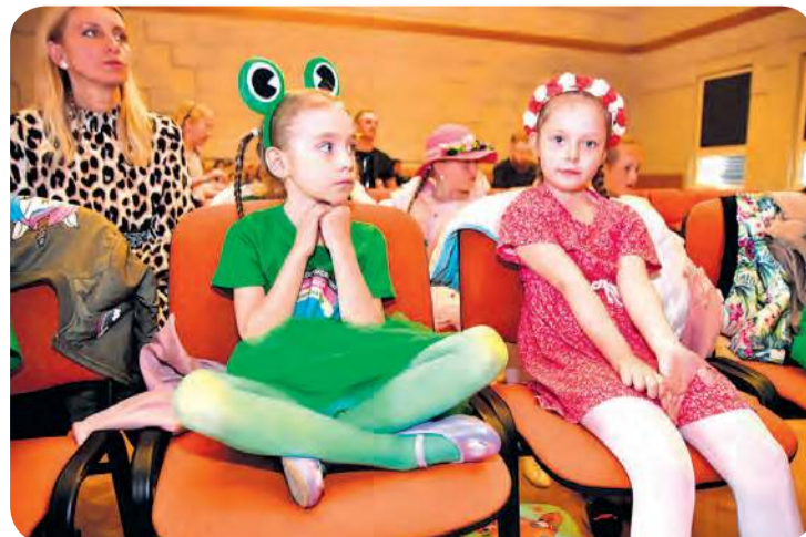
Występy wokalne uzupełniały starannie dobrane stroje.