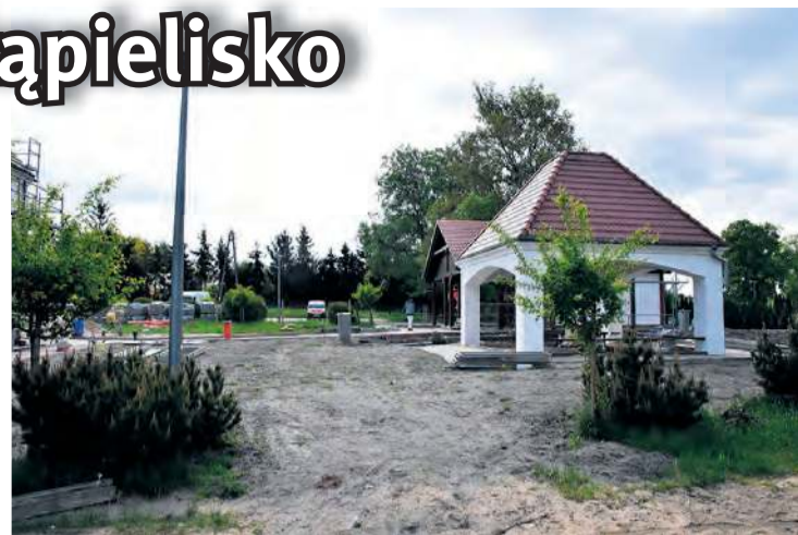
Prace przy obiektach położonych po lewej stronie bysławskiej plaży powinny zakończyć się w ciągu dwóch miesięcy.

przyjęto uchwałę, na mocy której sezon kąpielowy nad Jeziorem Bysławskim rozpocznie się od początku wakacji, tj. 28 czerwca. Okazuje się jednak, że z powodu inwestycji trwającej po lewej stronie plaży korzystający