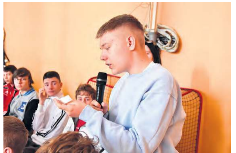
Uczniowie SP nr 1 zadawali pytania przedstawicielom MRPT. Byli zainteresowani tym, co mogą otrzymać od starszych kolegów i koleżanek.

Przedstawiciele MRPT wymienili swoje dotychczasowe pomysły i tematy, o których nie boją się mówić głośno. Takim bez wątpienia w ostatnim czasie jest zwrócenie uwagi na dostępność do komunikacji autobusowej. Zachęcali swoich młodszych kolegów do wzięcia udziału w organizowanych przez nich warsztatach z samobrony, które odbędą się