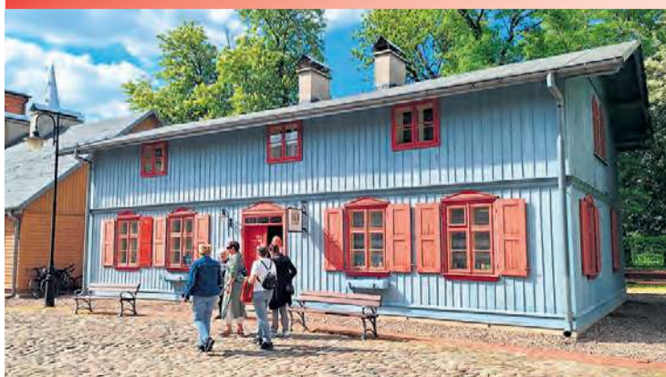
Borowiacy zwiedzili także Skansen Łódzkiej Architektury Drewnianej.

Za cel uczestnicy wycieczki obrali sobie zwiedzenie miejsc historycznych na Ziemi Łódzkiej, związanych z początkami Królestwa Polskiego i Patronką Tucholi – św. Małgorzatą oraz miejsc i obiektów ważnych dla historii miasta Łodzi.