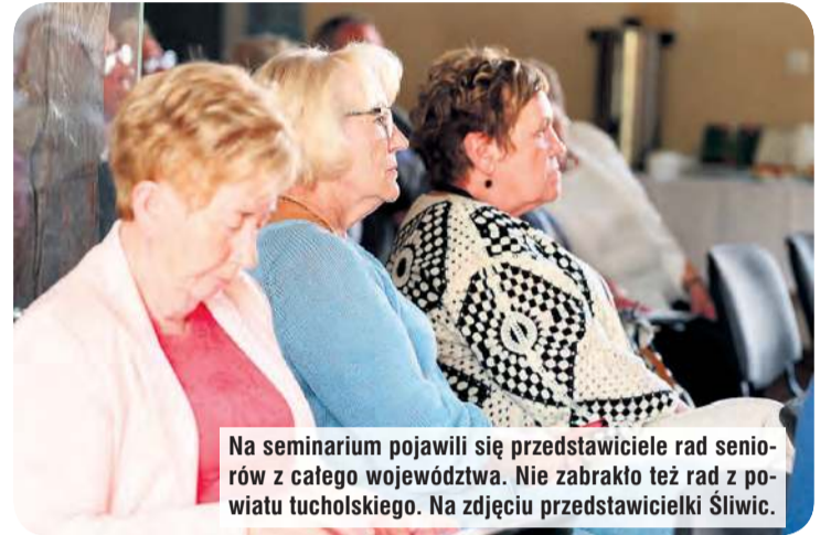
Na seminarium pojawili się przedstawiciele rad seniorów z całego województwa. Nie zabrakło też rad z powiatu tucholskiego. Na zdjęciu przedstawicielki Śliwic.

– To ogromnie ważny instrument, bo opieka nad seniorem najczęściej spada na osobę w średnim wieku, która pracuje, a do tego później wspiera swoich rodziców albo dziadków – mówili przedstawiciele rady. Zaznaczymy, że w ostatecznej formie bonu senioralnego mogą zająć jeszcze zmiany, ale teraz już mówi się o konkretnych kwotach. Bon miałby dotyczyć osób powyżej 75. roku życia i ich pracujących rodzin. Ministerstwo już dzieli się założeniami programu. Najważniejsze elementy publikujemy przy artykule.