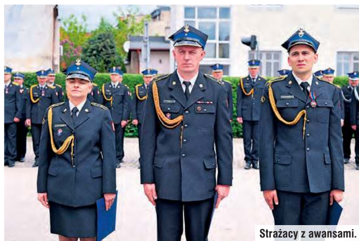
Strażacy z awansami.

licznie uświetnili piątkową okazję przy komendzie powiatowej.