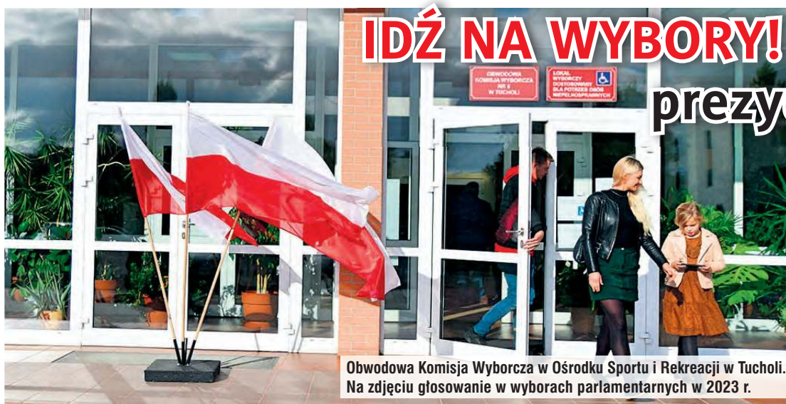
Obwodowa Komisja Wyborcza w Ośrodku Sportu i Rekreacji w Tucholi. Na zdjęciu głosowanie w wyborach parlamentarnych w 2023 r.