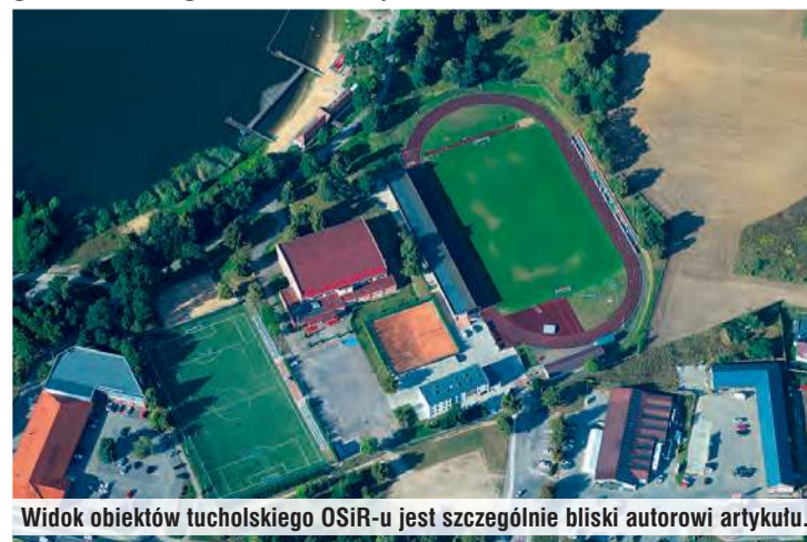
Widok obiektów tucholskiego OSiR-u jest szczególnie bliski autorowi artykułu.