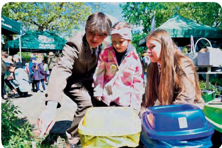
Uczniowie z Technikum Leśnego im. Adama Loreta w Tucholi wyjaśniali, jak prawidłowo segregować śmieci, a kiedy nadarzyła się okazja, przybliżali najmłodszym także świat owadów.

– Pokazujemy drzewo jako zieloną wyspę, na której żyje mnóstwo różnych organizmów. Ich byt jest często uzależniony od drzewa, a to, nawet kiedy się starzeje i powoli staje się martwą kłodą, stanowi środowisko dla wielu organizmów. Tam jest wciąż życie. Dlatego też powinniśmy bardziej rozsądnie podchodzić do sadzenia drzew i ich wycinki. Zanim