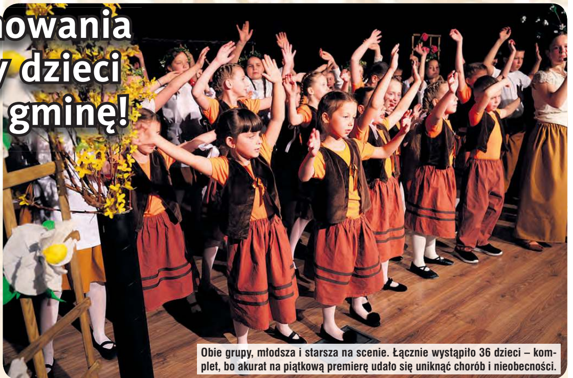
Obie grupy, młodsza i starsza na scenie. Łącznie wystąpiło 36 dzieci – komplet, bo akurat na piątkową premierę udało się uniknąć chorób i nieobecności.

Prawie 40 dzieci (grupy Krasnale i Krasno-lud), które działają przy szkole w Iwcu, zawładnęły cekcyńską sceną premierowo prezentując spektakl „Majówka u mistrza Ignacego”. Fabuła nawiązywała do motywów bajek Ignacego Krasickiego. Cechowały ją akcenty patriotyczne i folklorystyczne. Dialogi przeplatały