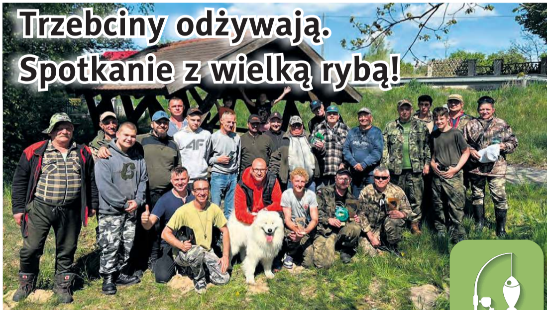
To były udane, pierwsze zawody. Dopisała frekwencja, ryby brały, pogoda też jak na zamówienie.

Nietrudno się domyślić, że największymi okazami wyciągniętymi z toni były karpie. I tutaj ciekawostka: największa ryba tego dnia ważyła tylko 100 gramów więcej od kolej-