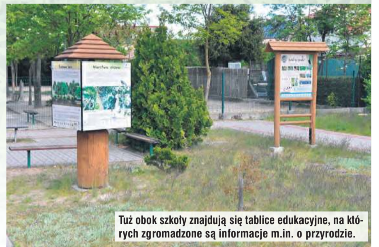
Tuż obok szkoły znajdują się tablice edukacyjne, na których zgromadzone są informacje m.in. o przyrodzie.