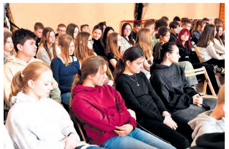
Młodzieżowi radni spotkali się z uczniami klas 7 i 8 tucholskiej „Jedynki”.

jeszcze w maju. Namawiali również do obserwowania ich profili w social mediach, aby na bieżąco śledzić poczynania młodzieżowych radnych. To może nawet przekonać ich do startu w wyborach w następnej kadencji. Nastoletni radni wielokrotnie podkreślali,