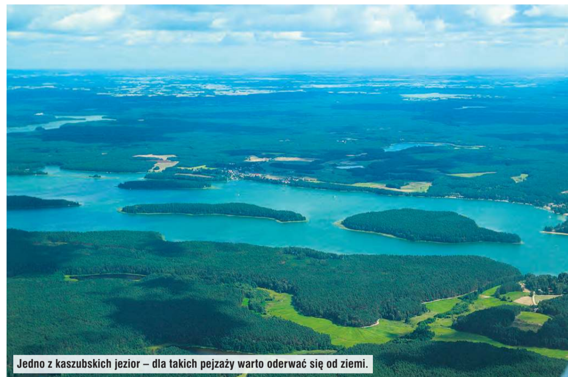
Jedno z kaszubskich jezior – dla takich pejzaży warto oderwać się od ziemi.

i startów z lotnisk komunikacyjnych. W Watorowie koło Chełmna zlokalizowana jest szkoła latania, gdzie każdy chętny może szkolić się w zakresie zasiadania za sterami.