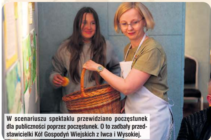
W scenariuszu spektaklu przewidziano poczęstunek dla publiczności poprzez poczęstunek. O to zadbały przedstawicielki Kół Gospodyń Wiejskich z Iwca i Wysokiej.