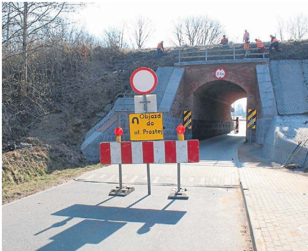
To czasowe zamknięcie będzie obowiązywać jeszcze tylko dzisiaj we wtorek, 24 marca. Jutro, w środę, ruch samochodowy będzie się już odbywał bez ograniczeń

Jakiś czas temu ruszyły tutaj prace remontowe realizowane przez Polskie Koleje Państwowe, co wiązało się z utrudnieniami dla kierowców. Ich największe natężenie nastąpiło od 6 marca, gdy przejazd był zamykany w godzinach od 9 do 15, również w weekendy. - Ale ten