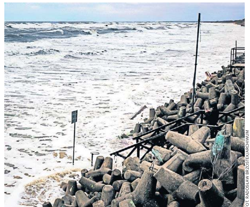
Silne sztormy na Bałtyku, występujące najczęściej jesienią i zimą, powodują zniszczenia na wybrzeżu