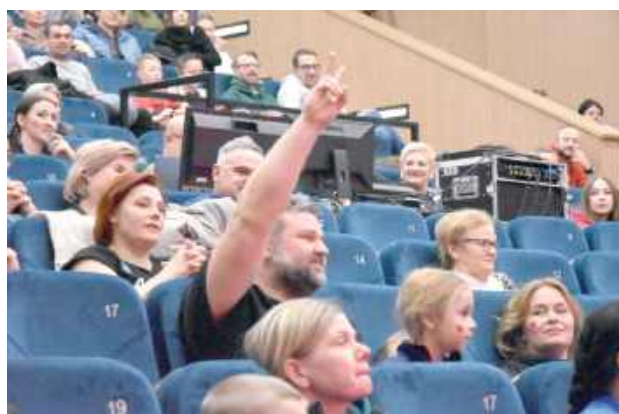
Podczas aukcji licytowano wiele ciekawych fantów, m.in.: dzień w fotelu wicestarosty, pluszowego bociana czy ciasto

Warto przypomnieć, że 34. Finał w naszym mieście to nie tylko niedziela. Imprezy towarzyszące trwały już od połowy stycznia. Mieszkańcy aktywnie wzięli udział w biegu „Policz się z cukrzycą” nad Międzyrzeczkimi Jeziorkami,