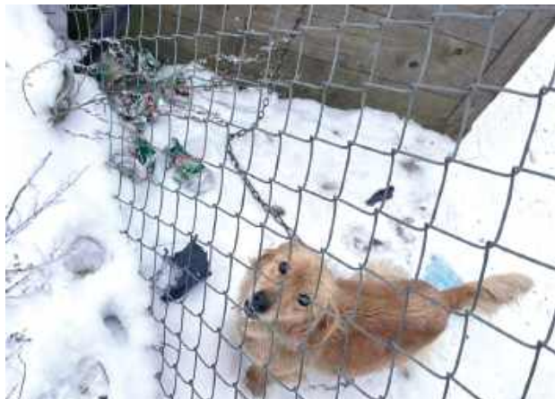
Bardzo wychudzony, jeszcze żywy pies na łańcuchu czekał na ratunek

- Czemu pan nie wrzucił do budy słomy? – pytał właściciela gospodarstwa.