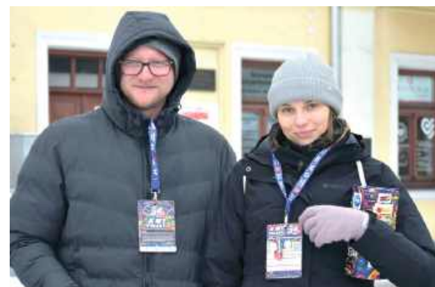
Już od wczesnych godzin porannych ulice Międzyrzecza wypełnili wolontariusze z charakterystycznymi, kolorowymi puszkami

bawili się na koncercie w Pałacu Potockich oraz rywalizowali w turnieju piłki nożnej z KS Huragan Międzyrzec. W sobo-