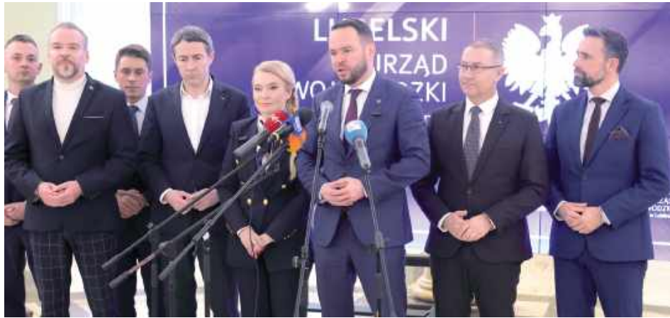
O przyspieszeniu inwestycji poinformowano podczas konferencji europarlamentarzystki, wojewodów, prezesów, prezydenta i radnego

W styczniu przyspieszyła sprawa rozbudowy portu przeładunkowego w Małaszewiczach. PKP Polskie Linie Kolejowe już przejęły spółkę Cargotor, a Rada Ministrów zapewniła o finansowaniu inwestycji. Chodzi o likwidację wąskiego gardła, jakim jest możliwość przyjęcia i odprawienia pociągów głównie z Chin.