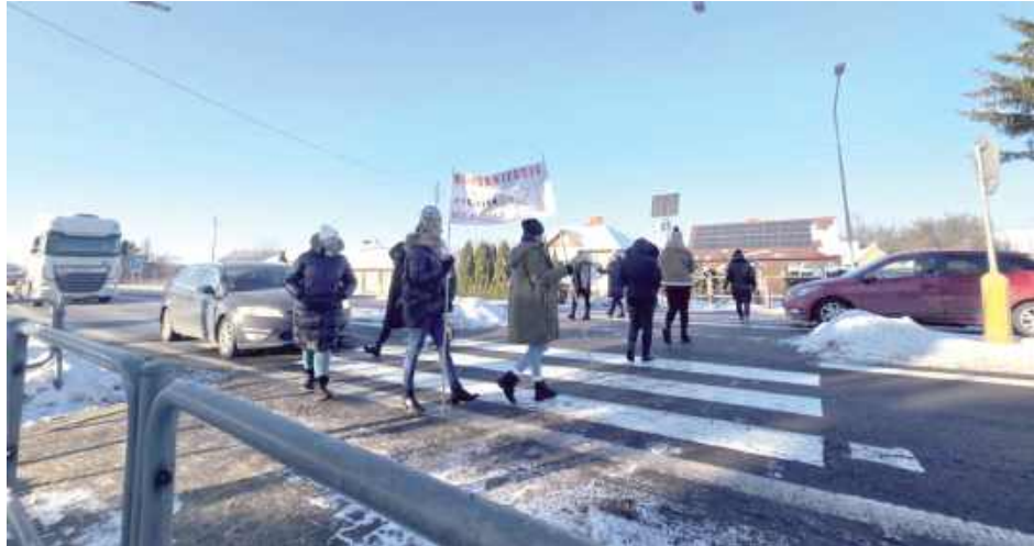
Rodzice są zdeterminowani do walki o utrzymanie nauczania we wszystkich oddziałach SP w Wólce Dobryńskiej. Potwierdziła to ich manifestacja w miniony wtorek

Jak informowaliśmy wcześniej, pod koniec listopada wójt gminy Zalesie, Tomasz Szewczyk, poinformował nauczy-