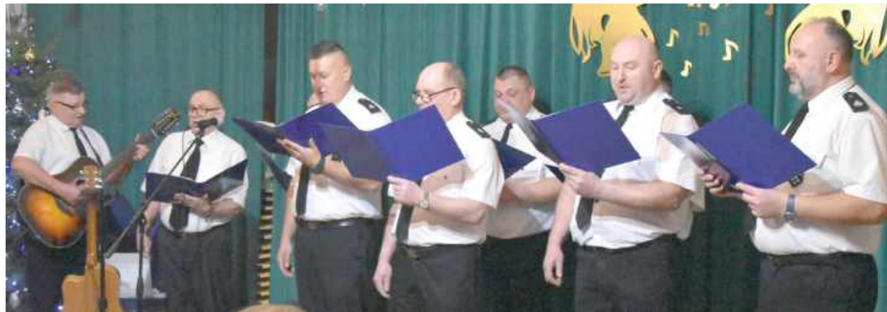
Gospodarzem wieczoru byli panowie z Chóru Strażaków z OSP Tłuściec

Pełen ciepła i świątecznej atmosfery wieczór koled pod hasłem „Zaśpiewajmy koledę” zorganizowano 18 stycznia w remizie Ochotniczej Straży Pożarnej w Tłuściecu.