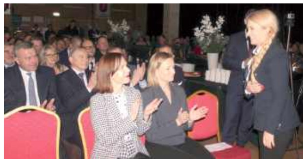
Niektórzy politycy wiedzą jak działa czar gal...

Europosłanka Marta Wcisło przybyła na styczniową galę w białskim starostwie z dużym spóźnieniem, tuż przed zakończeniem części oficjalnej imprezy.