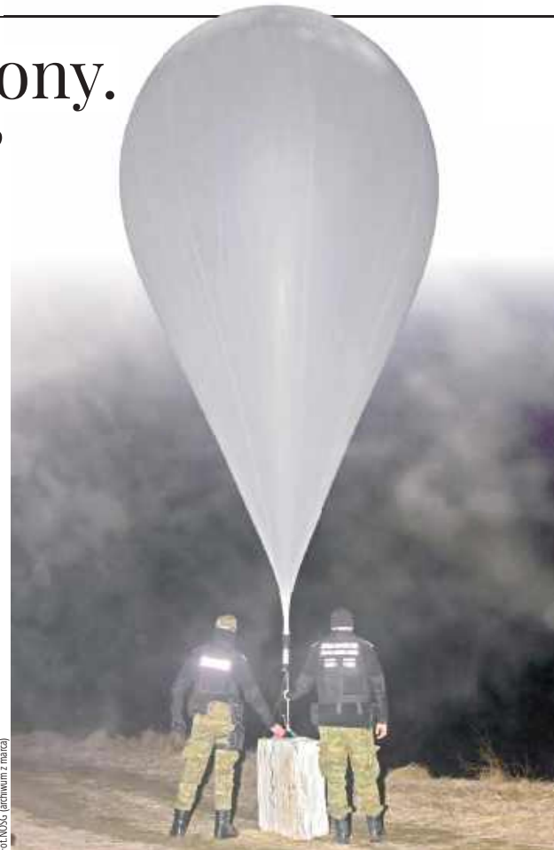
Przechwycony przez Straż Graniczną balon z przemytem