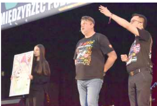
Licytacje przyniosły rekord – zebrano 42 460 zł

bawili się na koncercie w Pałacu Potockich oraz rywalizowali w turnieju piłki nożnej z KS Huragan Międzyrzec. W sobo-