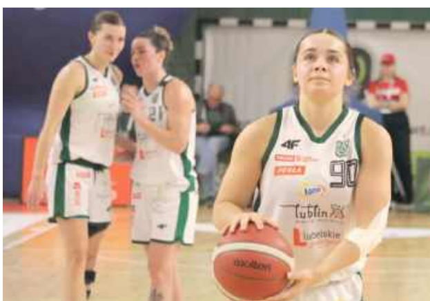
Lubelskie koszykarki przeszły do historii!