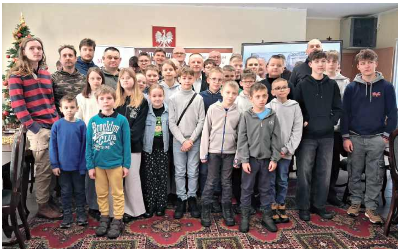
Terespol może się szczycić dużą grupą młodych szachistów, którzy wystartowali w styczniowym turnieju

Przy szachownicach zasiadli zawodnicy od wieku lat 8 do 85. W całym turnieju zwyciężył