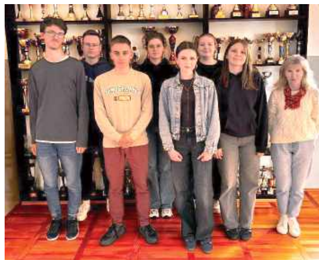
Uczestnicy olimpiady z II LO

- W pierwszym etapie Akademii ich zadaniem było uczestnictwo w takich formach nauki jak wykłady tematyczne czy warsztaty edukacyjne dotyczące przedsiębiorczości. Aby ukończyć tę część, uczniowie musieli osiągnąć pozytywny wynik testu z wiedzy o przedsiębiorczości-