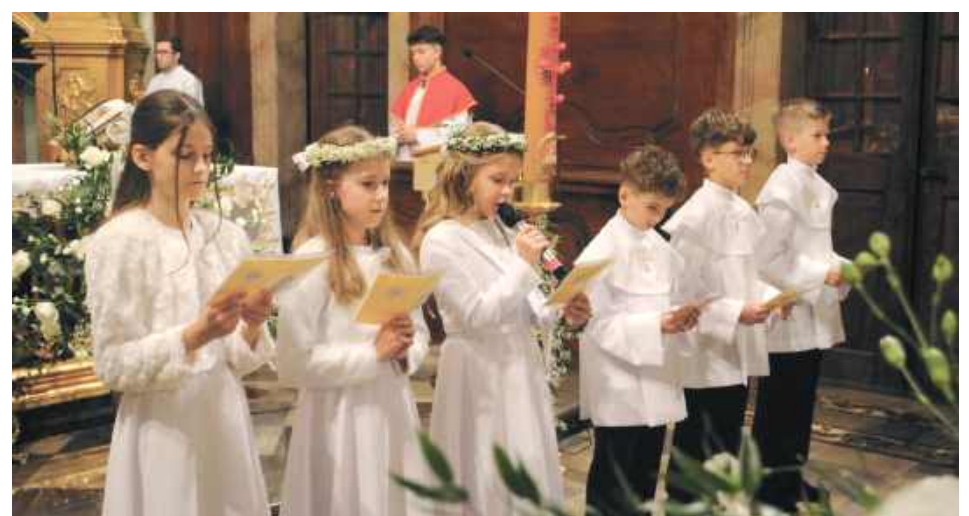
Dzieci z I grupy w modlitwie wiernych