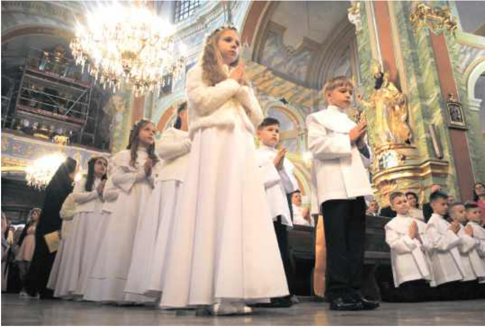
Za chwilę najważniejszy moment - dzieci z II grupy tuż przed przyjęciem komunii