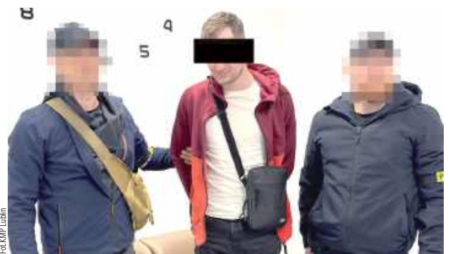
Na wniosek śledczych został tymczasowo aresztowany na trzy miesiące

- Operacyjni od razu postanowili zweryfikować zgłoszenie i zaplanowali zatrzymanie. W czasie obserwacji zauważyli samochód marki Audi, którym miał poruszać się 28-latek. W okolicy miejsca zamieszkania mężczyzny zdecydowali o zatrzymaniu. Mieszkaniec Beżyc był kompletnie zaskoczony. Nie spodziewał się interwencji