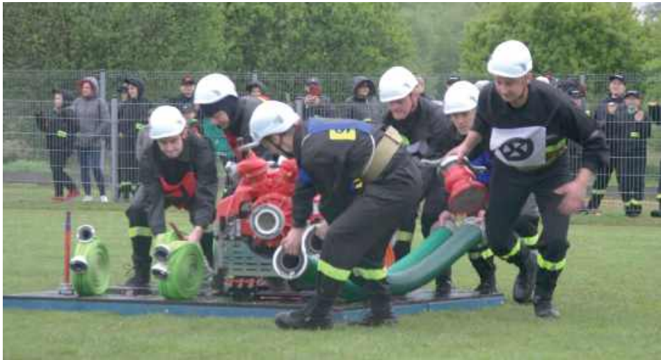
Skuteczność akcji w dużej mierze zależy od szybkości działania