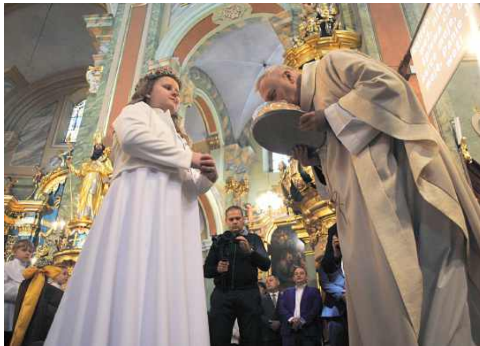
Wśród darów ołtarza wręczonych przez dzieci był chleb