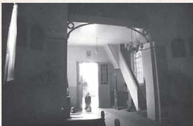
Wnętrze kościoła Opieki św. Józefa ok. 1968 r., kiedy jeszcze odbywały się tu nabożeństwa. W trakcie inwentaryzacji konserwatorskiej jego stan określono wtedy jako bardzo dobry. Odnotowano, że w ołtarzu głównym znajduje się obraz Matki Boskiej, w bocznych św. Józefa i Matki Boskiej. Nad łukiem nad prezbiterium polichromia z Niewiastami opiekującymi Chrystusa

W takiej sytuacji nowi gospodarze przyjmowali różne strategie odniesienia się do wschodniej (w tym także grekokatolickiej!) przeszłości. Zwłaszcza na Południowym Podlasiu przejmowano je jako mienie pounickie, zgodnie z zasadą, że skoro dawni unicy zapisali się do parafii łacińskich to i ich świątynie oraz przynależne grunty powinny pójść tą drogą. Nawet jeśli w konkretnych przypadkach przesłanki faktyczne i prawne były dość wątpliwe, nikt się tym zanadto nie przejmował. Żeby uniknąć wszelkich nieporo-