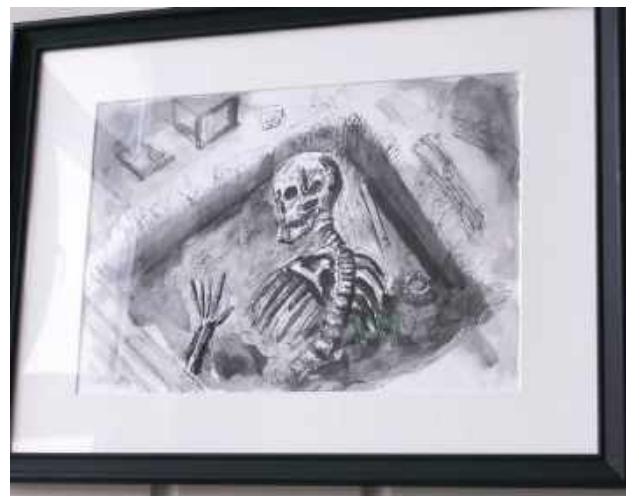
Ilustracje pełne grozy zawisły na korytarzu lubartowskiej biblioteki

- Strach jest to instynkt pierwotny, który mamy w sobie zakorzeniony. Nasi przodkowie zawsze się czegoś bali. Strach jest