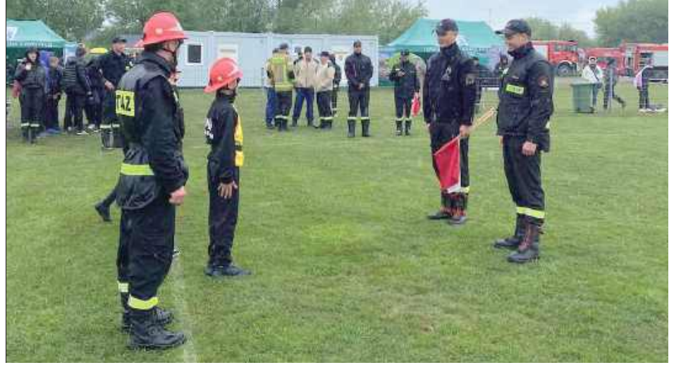
W zawodach uczestniczyli także najmłodszy adepci OSP

Boisko Neptuna Świdniczanka w Świdniku Dużym było areną zmagania jednostek Ochotniczych Straży Pożarnych z terenów gminy Niemce i Wólki. Gminne zawody sportowo-pożarnicze dostarczyły wielu emocji, chociaż toczyły się przy mało sprzyjającej pogodzie. Padający deszcz i chłód oczywiście nie pomagały strażakom ochotnikom, którzy i tak zademonstrowali wysoką sprawność i organizację.