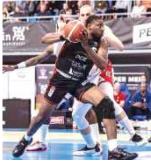
Koszykarze Startu Lublin blisko półfinału

PGE Start Lublin rozpoczął rywalizację w fazie play-off Orlen Basket Ligi. „Startowcy” rozegrali w hali Globus dwa spotkania z Czarnymi Słupski i nie tylko zapewнили kibicom mnóstwo emocji, ale również jada do rywali ze sporą przewagą.