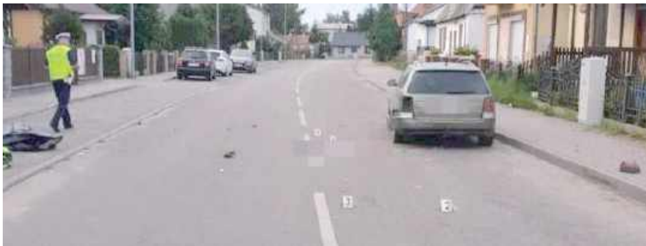
Oględziny na miejscu wypadku. Przed przybyciem służb ktoś zabrak motocykl...

24-latek był pijany, miał ponad 2,5 promila alkoholu w organizmie. Został zatrzy-