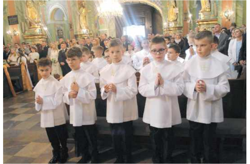
W oczekiwaniu na przyjęcie Ciała Chrystusa - chłopcy z I grupy

Papież Leon XIV w niedzielę, 18 maja, odbywał swój ingres. W tym samym dniu do Pierwszej Komunii Świętej przystępowały dzieci ze Szkoły Podstawowej nr 1 w Lubartowie. Na zakończenie mszy świętych - dzieci przystępowały do komunii w dwóch grupach, o godz. 10.30 i o godz.