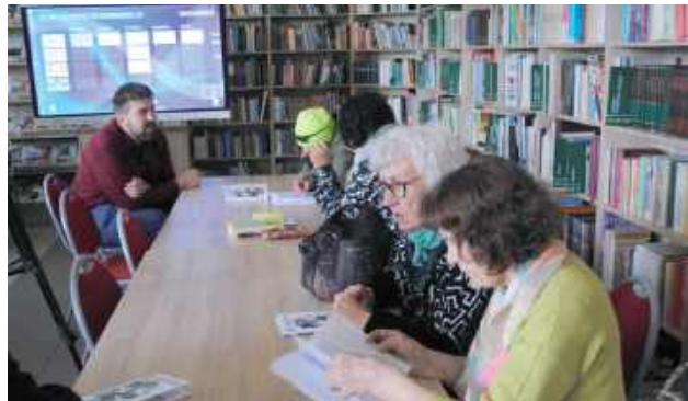
Uczestnicy dyskusji i literaturze grozy

Upiorne ilustracje na korytarzu biblioteki i dyskusje o literaturze grozy składają się na festiwal Wiosna ze Wschodami Grozy.