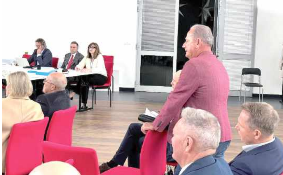
Swoje uwagi wnoszą byli włodarze gminy Niemce