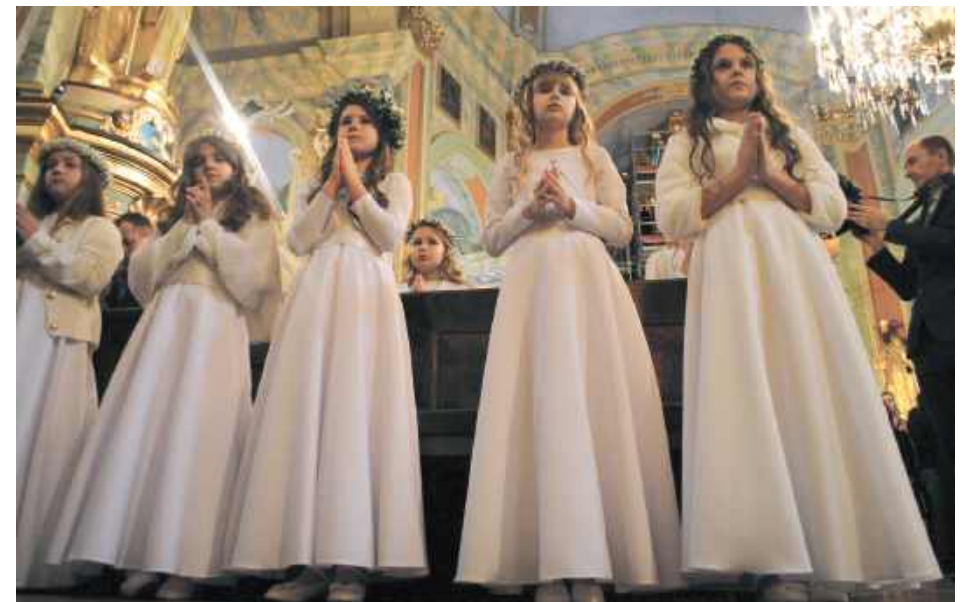
Dziewczynki tradycyjnie wystąpiły w białych sukienkach - na zdjęciu dzieci z I grupy