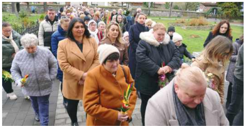
Uroczyste wejście z palmami do kościoła parafialnego