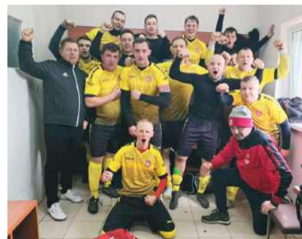
Radość zawodników Ogniska po zwycięstwie