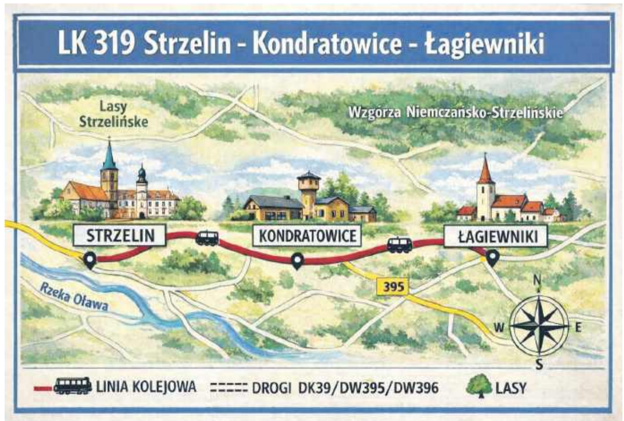
Linia Kolejowa 319 oznacza płynny transport publiczny między trzema gminami na południe od Wrocławia