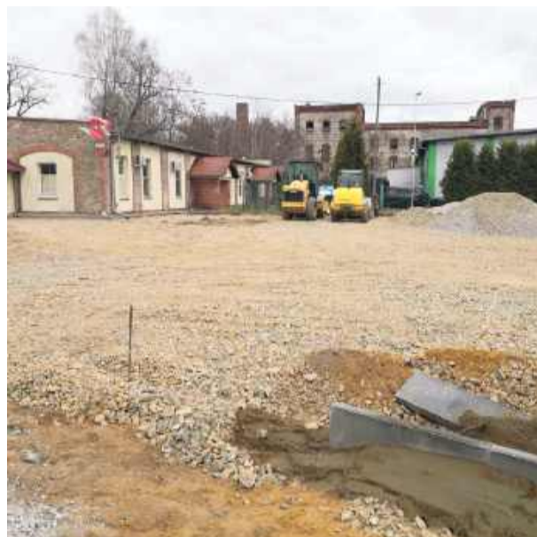
Trwają prace związane z zagospodarowaniem terenu przed GOK-iem w Kondratowicach

związane z zagospodarowaniem terenu. Umowa z wykonawcą – firmą „JAR-BRUK” z Grzegorzowa została podpisana