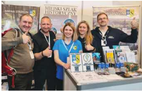
Pamiątkowe zdjęcie na stoisku Strzelina

Podobnie jak w latach minionych odwiedziliśmy strzelińskie stoisko i z obsługującymi je pracow-