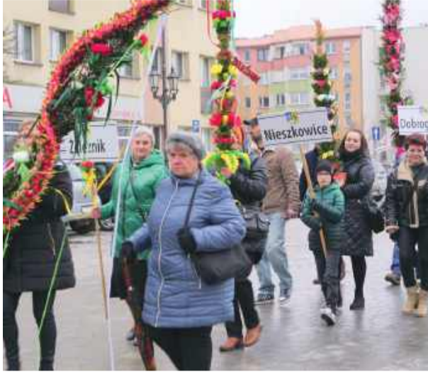
Tradycyjnie przez strzeliński rynek przeszedł korowód palm wielkanocnych

Barwne palmy, stoiska z lokalnymi produktami i wiele atrakcji dla mieszkańców – tak wyglądał dwunasty jarmark wielkanocny w Strzelinie. Nie brakowało zapachu domowych wypieków i przedświątecznej atmosfery, która – mimo chłodnej pogody – zachęcała wiele osób do odwiedzenia strzelińskiego rynku.