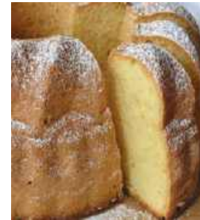
Babka majonezowa to klasyk, którego nie może zabraknąć na świątecznym stole. Fot. ilustracyjne