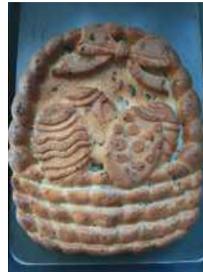
Świąteczny keks uciesty wyglądem i zachwyca smakiem.

Sposób przygotowania: Mieszmą twaróg, budyń, cukier, jajka, 100 ml śmietanki i aromat waniliowy. Przekładamy masę do foremek. Pieczemy 50-60 minut w 130°C. Następnie zostawiamy w zamkniętym piekarniku do wystygnięcia ok. 20 minut.