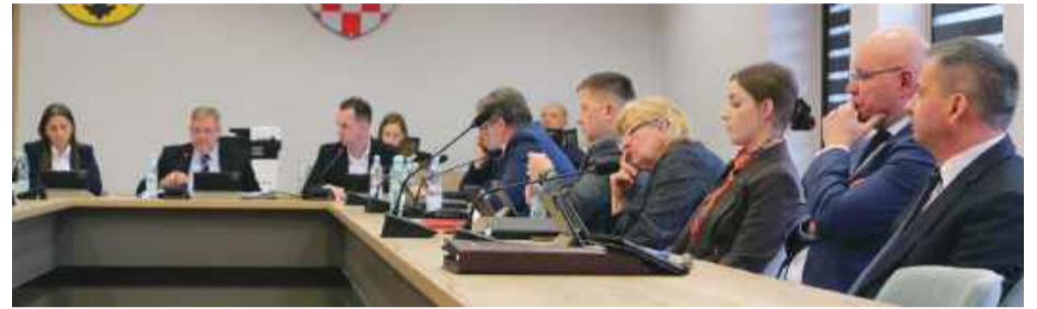
Wnioskodawcami uchwały o zmianie wynagrodzenia była grupa radnych