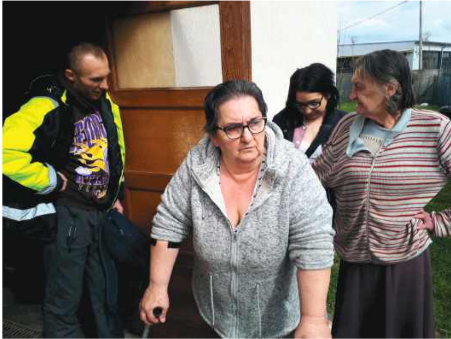
– W jakim wieku żyjemy? Gdzie są nasi radni? Co będzie, kiedy temperatura na zewnątrz spadnie do zera? – pytają lokatorzy

Ratujcie nas! Od trzech tygodni nie mamy ciepłej wody! Umieramy z zimna – zaalarmowali nas mieszkańcy bloku przy ulicy Skawińskiej 2 w Strzelinie. Wszystko z powodu starego bojlera, który ma zostać wymieniony na nowy.