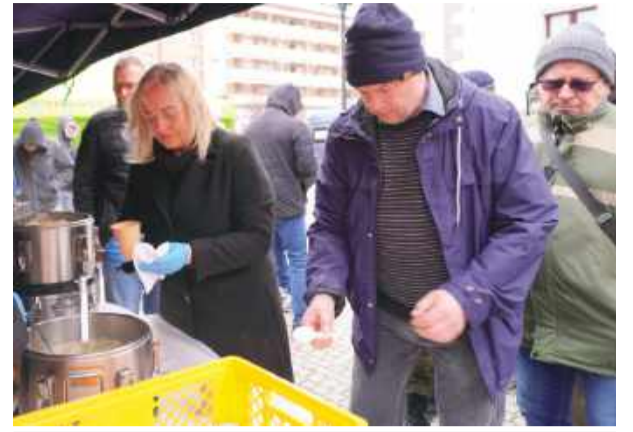
Na odwiedzających czekała niespodzianka - żurek i mazurek

Mieszkańcy odwiedzali jarmark z wielu powodów – z zamiarem kupna produktów na święta, dekoracji lub ciasta do popołudniowej kawy. Co sądzą o organizacji takich wydarzeń? – Jarmark jest bardzo dobry,