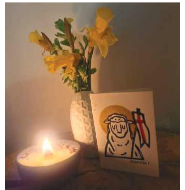
„Chrystus Pan Zmartwychwstał! Alleluja!”

ciw olbrzymowi. Gdyby nie Bóg, nie miałabym absolutnie żadnych szans, bo wielokrotnie upadam. A ile szans można dać komuś, kto rani i krzywdzi? Ile razy wybaczać to, co złe? Ile razy wyciągać rękę do tego, kto błądzi? On to robi. Raz za razem. Pozwala włożyć koronę ciemnową na głowę swojego Syna, przybić jego ciało do krzyża za popełnione przez nas grzechy, po to żeby odkupić moje i Twoje życie. Robi to z miłości, którą trudno pojąć. Na którą nie można zasłużyć. To nie wymiana. To dar, który jest