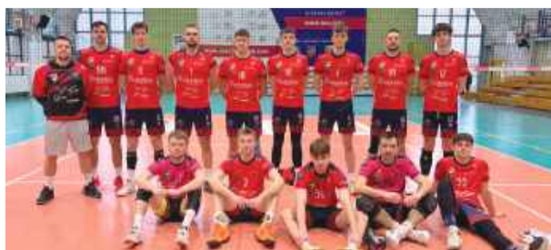
Siatkarze ze Strzelina zakończyli sezon