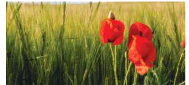
Letni pejzaż z makami autorstwa Adriana

czynienia z generowaniem zdjęć przez sztuczną inteligencję, które wyglądają jak te zrobione przez człowieka. – Generowanie zdjęć przez AI szkodzi fotografom, bo wypiera ich z rynku. Proble-