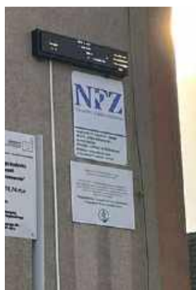
Tablica na bieżąco pokazuje podstawowe parametry, takie jak poziom pyłów PM2.5 i PM10, temperaturę, wilgotność oraz ciśnienie

Nowe urządzenie ma pomóc mieszkańcom w codziennym dbaniu o zdrowie. Informacje o stanie powietrza są szczególnie istotne dla osób starszych, dzieci oraz pacjentów z chorobami układu oddechowego.