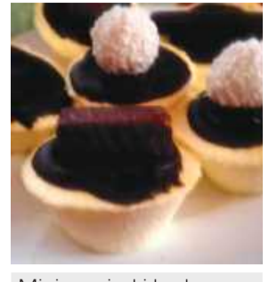
Mini serniczki będą świetnym deserem dla każdego

Czekoladę rozpuszczamy w rondelku, wyłączamy i dodajemy 2 łyżki śmietanki. Mieszmą na gładką masę. Serniczki wyjmujemy z foremki, dekorujemy przestygniętą polewą i pralinami na wierzchu. Wkładamy na 2 godz. do lodówki.