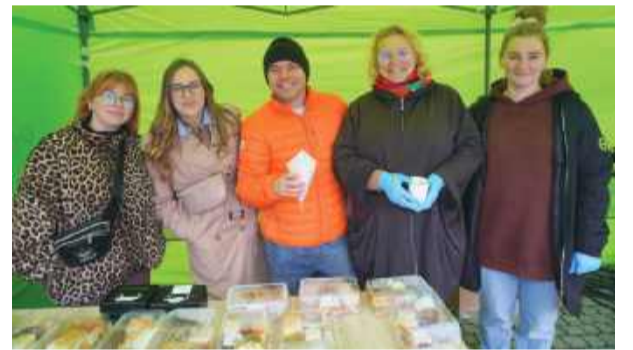
Swoje stoiska mieli przedstawiciele szkół i przedszkoli