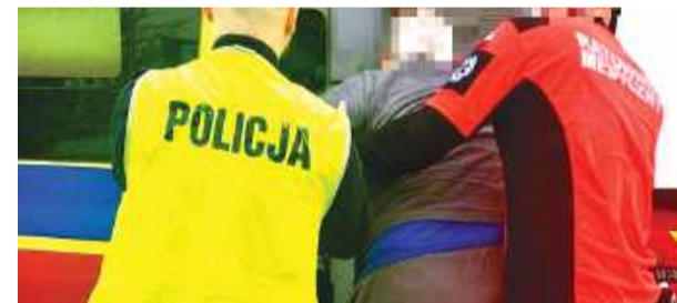
Senior nie miał biletu, dokumentów, pieniędzy i jechał w kapciach. Wcześniej samowolnie opuścił szpital