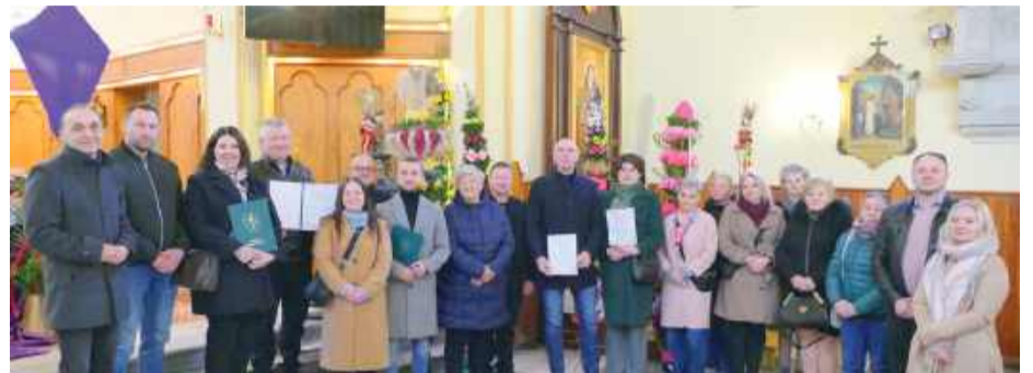
Laureaci i uczestnicy konkursu na pamiątkowym zdjęciu