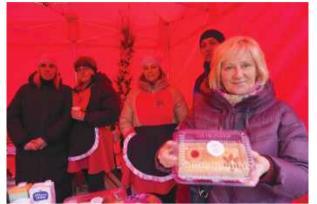
Wystawcy sprzedawali rękodzieło i produkty lokalne