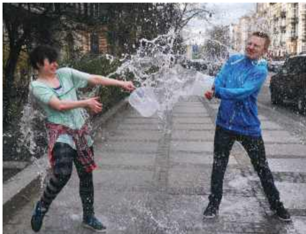
Dawniej ludzie polewali się wodą z wiader, misek, kubków i wszystkiego, co było pod ręką.

– Trzeba było uważać na dowcipnisiów, którzy z czwartego piętra rzucali