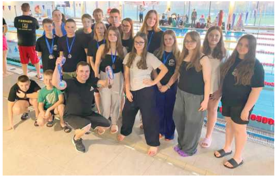
Reprezentanci sekcji pływackiej ze Strzelina

srebrny i brązowy medal oraz zajął czwarte miejsce, będąc jednocześnie najstarszym uczestnikiem zawodów. Pozostali zawodnicy również zaprezentowali się bardzo dobrze, wielokrotnie kończąc swoje wyścigi tuż za podium. To pokazuje, że sekcja pływacka Aquapark Strzelin dynamicznie się rozwija i coraz śmieiej zaznacza swoją obecność na arenie ogólnopolskiej. Przed zawodnikami kolejne wyzwanie – już 11 kwietnia wystartują w XVI Ogólnopolskich Zawodach Pływackich w Sprincie o Puchar Klubu Kibica w Świebodzicach. Patrząc na obecną formę strzeleńskich pływa-