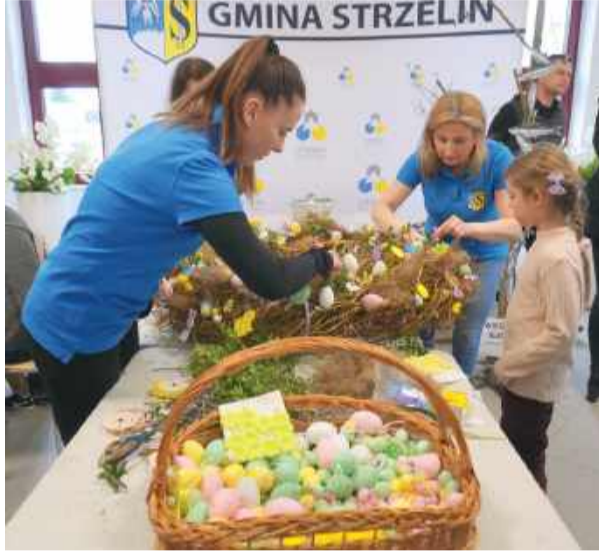
Na najmłodszych czekał kącik artystyczny