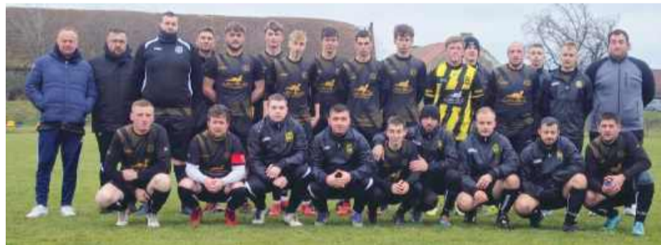
Drużyna KS Kurów

nych zwycięstw i popisów strzeleckich. Najbardziej imponujące zwycięstwo odniosło Ognisko Przeworno, które rozgromiło