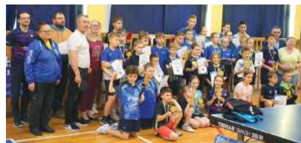
Uczestnicy sobotniego turnieju

len. Jego obiecującą karierę przerwał tragiczny wypadek samochodowy – zmarł