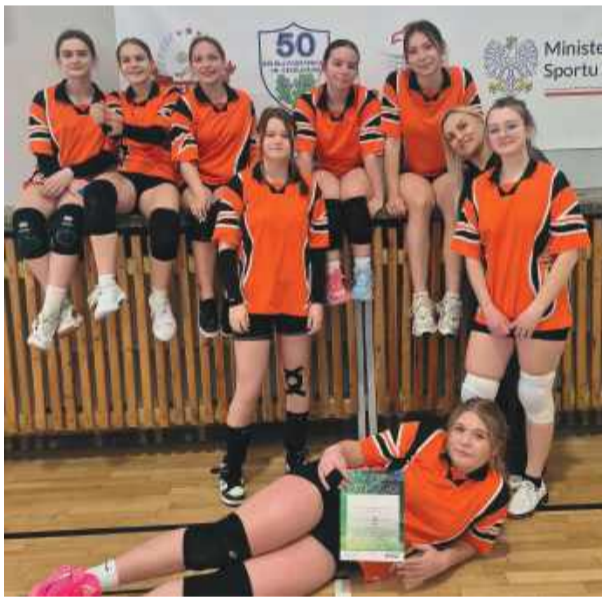
Drużyna strzeleńskiej „piątki”

Uczniowie Szkoły Podstawowej nr 5 w Strzelinie z powodzeniem reprezentowali powiat strzeleński w półfinałach wojewódzkich Igrzysk Młodzieży Szkolnej w piłce siatkowej, które odbyły się w marcu. Zarówno drużyna chłopców, jak i dziewcząt zaprezentowała wysoki poziom sportowy, walcząc z wymagającymi rywalami. 16 marca rozegrano półfinał wojewódzki chłopców. Zawody odbywały się w czterech grupach, a stawką był awans do finału. Reprezentanci strzeleńskiej „piątki” zmierzyli się z drużynami Szkoły Podstawowej nr 3