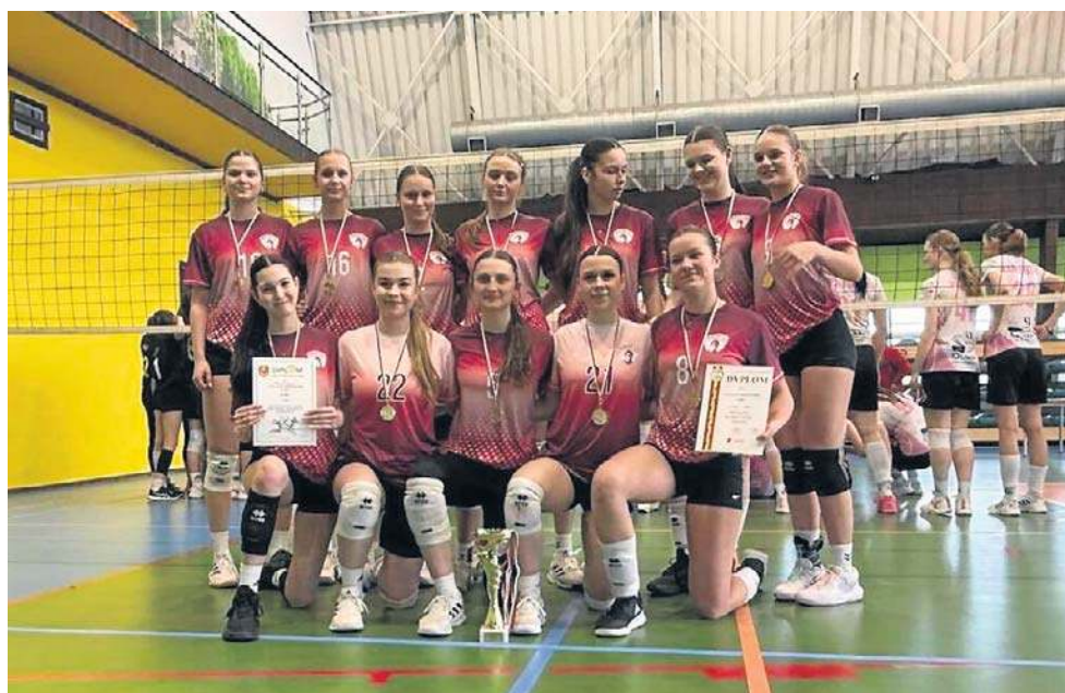
Siatkarska reprezentacja XXVI LO w Łodzi została mistrzem naszego województwa

Rozegrano natomiast półfinałowe turniej mistrzostw Polski