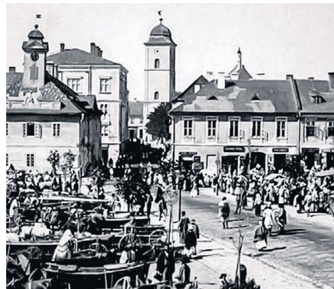
Rynek w Rzeszowie. Na początku lat 30. XX wieku ponad 70 proc. placówek handlowych należało do Żydów