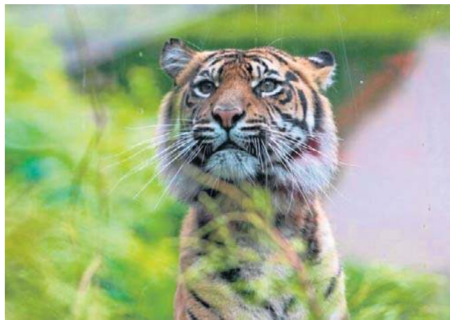
Łódzkie zoo jest jednym z niewielu ogrodów, w którym są te wielkie koty

Tygrys sumatrański to najmniejszy podgatunek tygrysa. Występuje wyłącznie na indonezyjskiej wyspie Sumatra. Należy do gatunków zagrożonych wyginięciem.