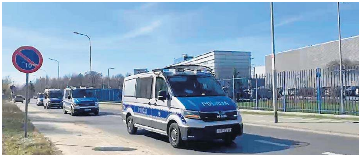
Ulicę Nowy Józefów zamknięto dla ruchu, pozostawiając ją tylko dla policji i innych służb