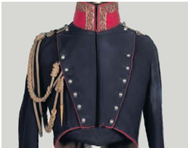
Konserwację kurtki Kozietulskiego ukończono w 2016 roku w Pracowni Konserwacji Tkanin Muzeum Wojska Polskiego

Jak piszą znawcy epoki napoleońskiej, Kozietulski był ranny wielokrotnie: pod Samosierrą w nogę, pod Wagram i pod Smoleńskiem w głowę. Ale to rana odniesiona w obronie Napoleona była dlań do końca życia powodem do dumy. Kozietulski zmarł 3 lutego 1821 r. – trzy miesiące przed swoim cesarzem.