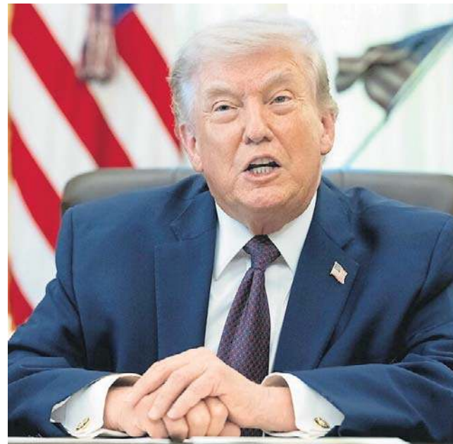
Prezydent USA nazwał sojusz „papierowym tygrysem”

Zapytano Trumpa, czy po konflikcie rozważyłby ponowne rozpatrzenie kwestii członkostwa USA w NATO. Odpowiedział: „Powiedziałbym, że nie ma sensu tego rozważać. Nigdy nie dałem się przekonać NATO. Zawsze wiedziałem, że to papierowy tygrys, i Putin też o tym wie, nawiasem mówiąc”.