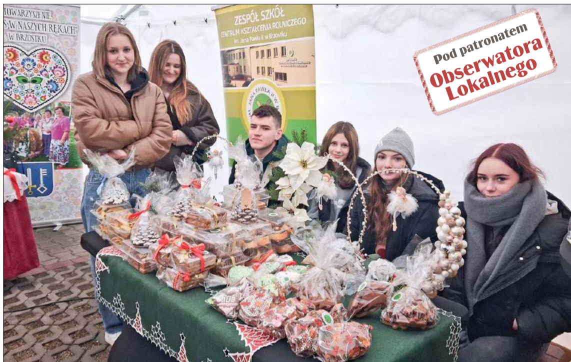
Swoje stoisko rozłożyli również uczniowie Zespołu Szkół Centrum Kształcenia Rolniczego z Brzostku.

Nad bezpieczeństwem uczestników czuwali pracownicy ochrony,