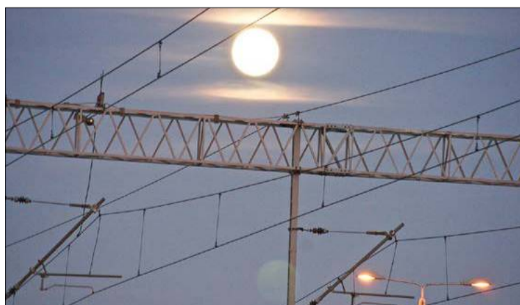
Superpełnia nad dębickim dworcem PKP.