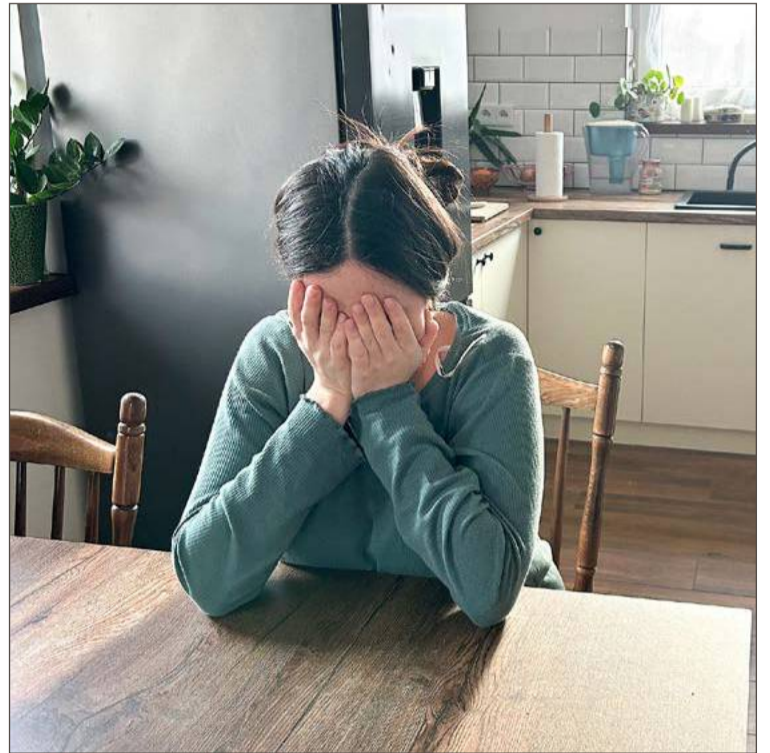
Przemoc rówieśnicza to za każdym razem trauma dla ofiary.

- Nauczyciele systematycznie uczestniczą w szkoleniach - dodaje Dorota Piękoś.