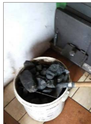
Kontrolowane będą gospodarstwa z kotłami na paliwa stałe.

Gmina Brzostek planuje przeprowadzenie co najmniej 40 kontroli w okresie do kwietnia 2026 r., a później od października. Ich lic-