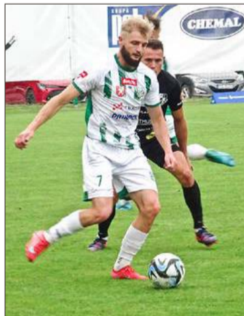
Wisłoka już za kilka dni rozpocznie przygotowania do wiosny.