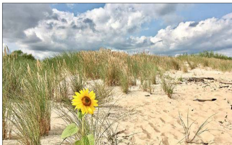
W słonecznika blasku.