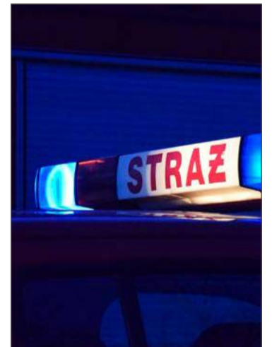
Strażacy ruszyli na pomoc 35-latkowi z Bobrowej Woli.