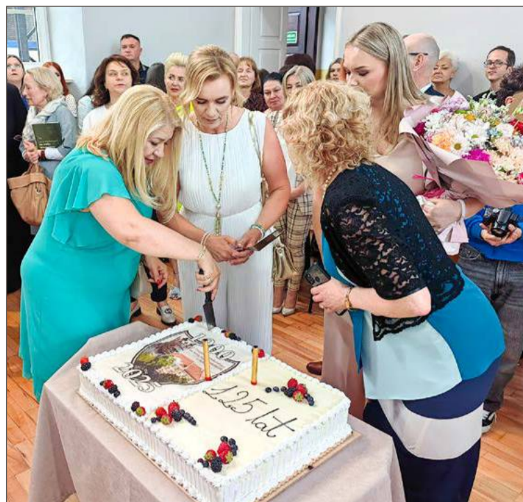
I Liceum Ogólnokształcące w Dębicy ma 125 lat!