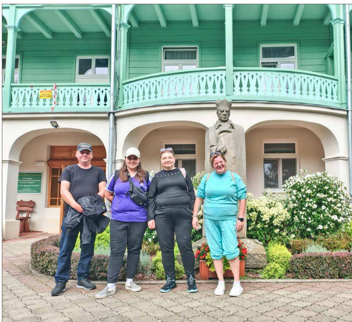
Zwiedzanie uzdrowiska w Iwoniczu-Zdroju.