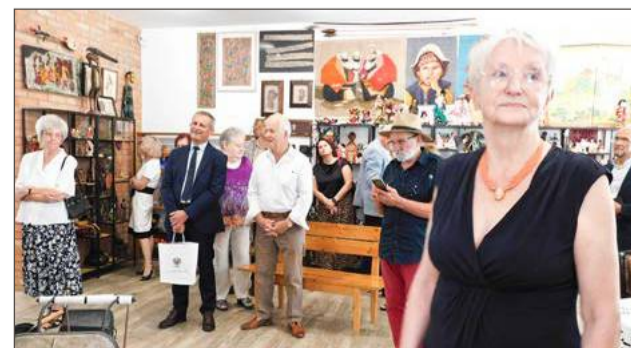
Muzeum Lalek mieści się już nie w Pilźnie, ale w Lipinach.