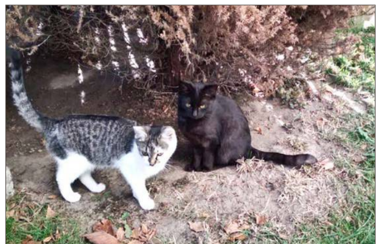
Te koty z Paszczyny już udało się odłowić.