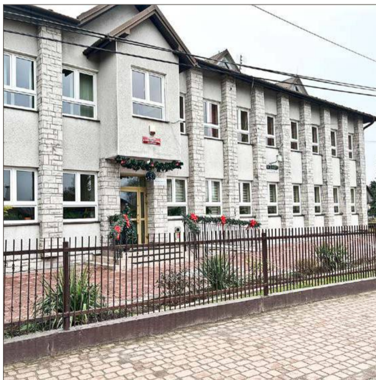
Budynek będzie od września 2026 r. drugą siedzibą SP w Starej Jastrzębce.

Wójt tłumaczy, że nie chciał przenosić tego oddziału do innej