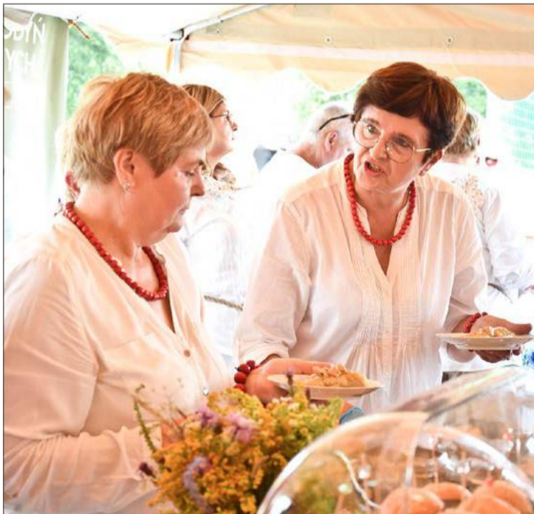
Jużyna w Dzwonowej to święto gospodyń z całego powiatu.