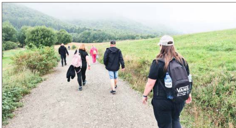
Podczas pieszej przechadzki po bieszczadzkich szlakach.