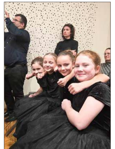
Kwartet I w dur i w mol ma powody do zadowolenia.

Uczniowie dębickiej szkoły muzycznej mogą pochwalić się kolejnymi sukcesami.