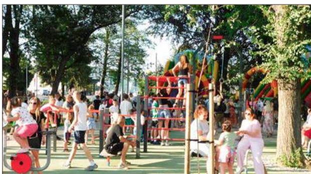
Park Słoneczny w końcu doczekał się otwarcia.