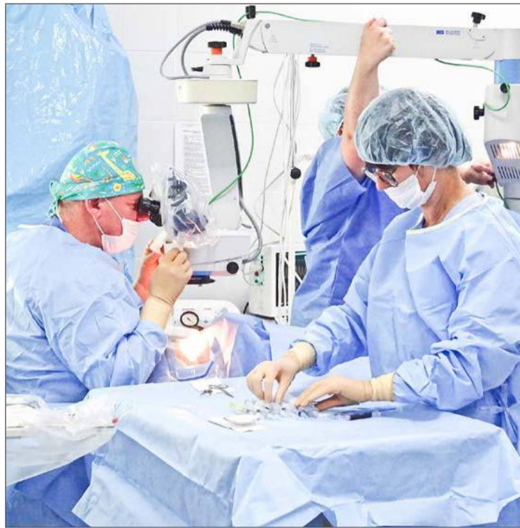
Limity mają dotyczyć m.in. zabiegów operacyjnych zaćmy.

Szpital będzie musiał ograniczyć m.in. zadania polegające na diagnostyce obrazowej wysokozaawansowanej, czyli badania tomografem, czy rezonansem magnetycznym. Limity mają też zostać wprowadzone