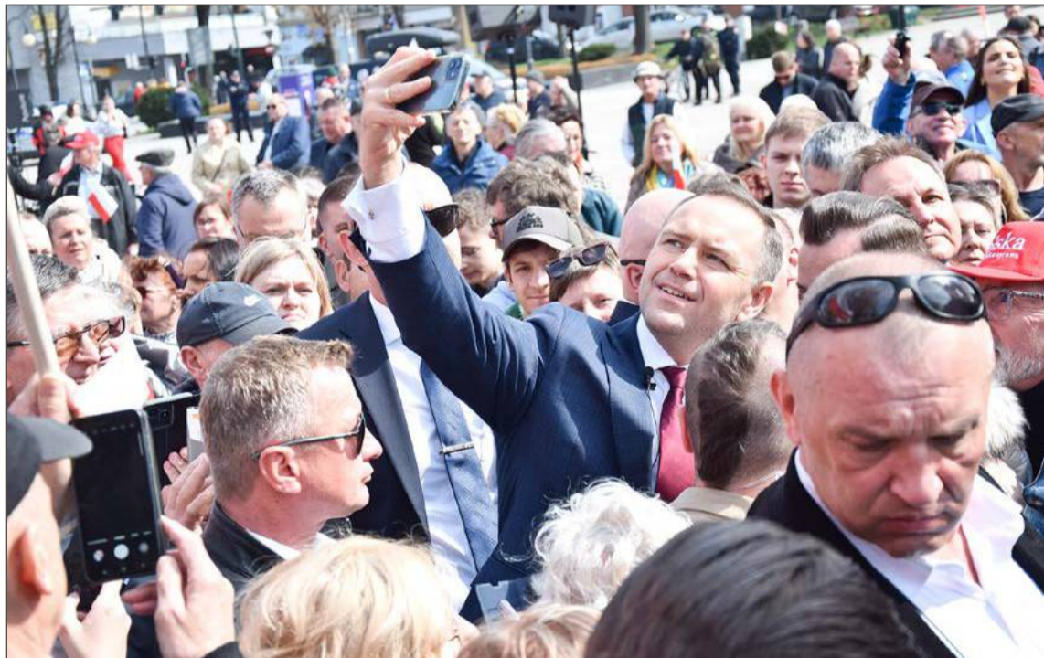
Karol Nawrocki, jeszcze jako kandydat na prezydenta RP, spotkał się z mieszkańcami Dębicy i Jodłowej.