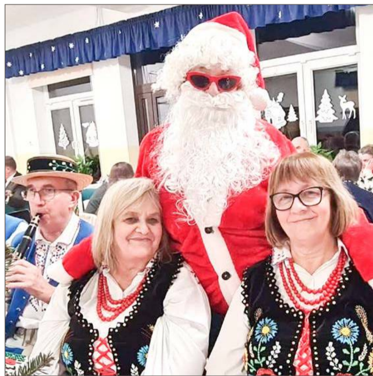
W wigilii udział wzięła również Kapela Jodłowanie.

- Ta chwila była przepiękna życzliwością spokojem i wzajemną