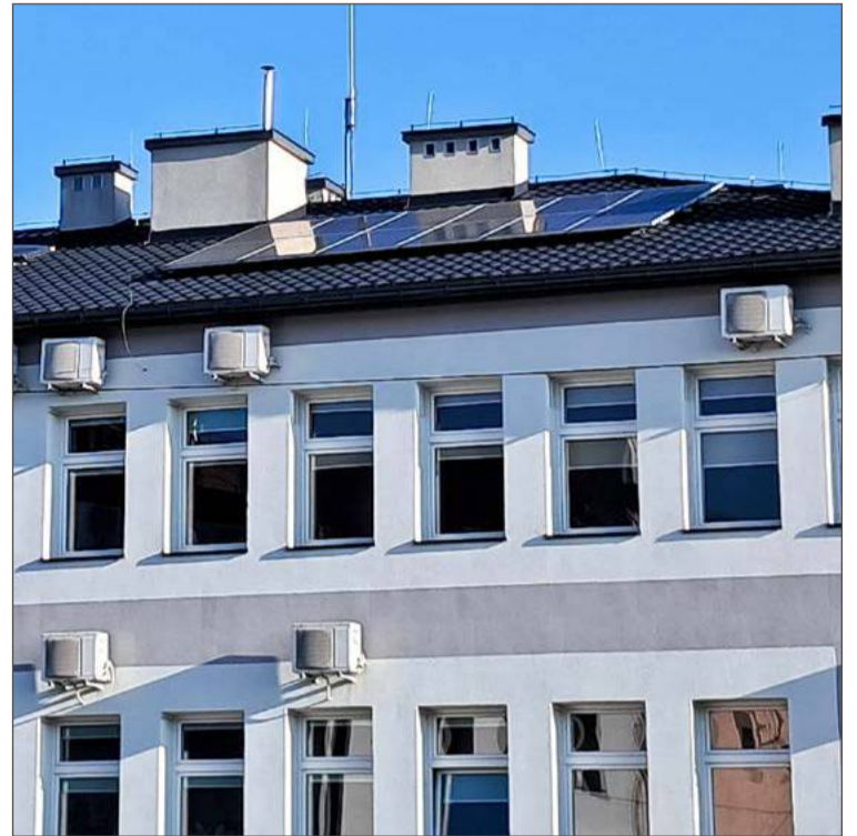
Na budynku Urzędu Gminy w Żyrakowie instalacja fotowoltaiczna już jest.