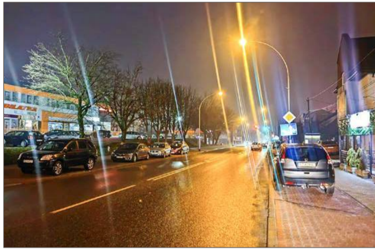
Od 19 grudnia w Dębicy nocą nie jest już ciemno.

- Nie ma znaczenia, czy to droga gminna, powiatowa, czy krajowa -