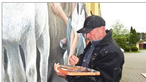
Mural na szkole w Łękach Górnych stworzył Ryszard Paprocki.