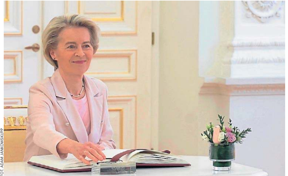
W liście do przywódców UE von der Leyen wskazała pięć kluczowych obszarów działań, przed którymi stanie Unia Europejska

Pierwszym z nich jest deregulacja i uproszczenie prawa unijnego. KE zapowiedziała dalsze pakiety „Omnibus” (uprosz-