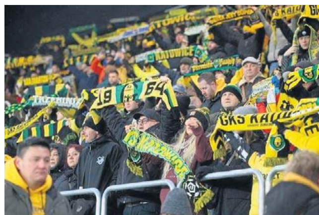
Mecz z Legią jest jednym z tych, na które kibice GKS-u czekają szczególnie. W piątek też wypełnią Nową Bukowę