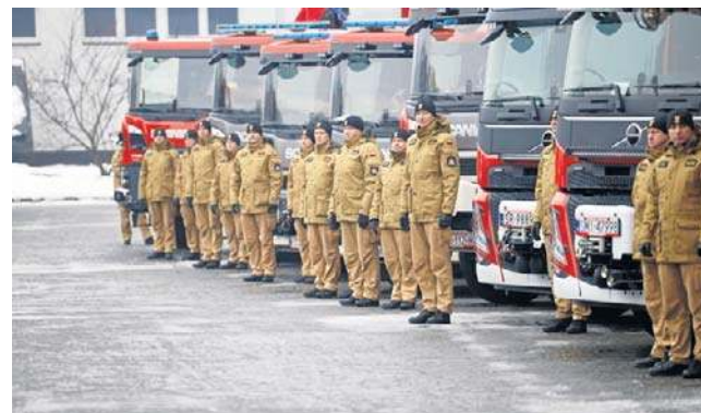
Nowy sprzęt trafił do kluczowych jednostek w regionie

Dla strażaków z Zawiercia nowy pojazd to przede wszystkim usprawnienie logistyki na trudnym, jurajskim terenie.