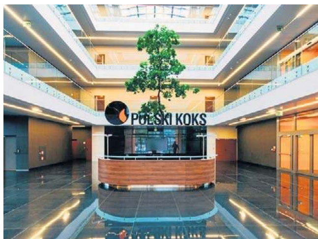
JSW jest w bardzo trudnej sytuacji i ratuje się m.in. przez sprzedaż nieruchomości

Lokalizacja to osiedle Paderewskiego-Muchowiec w Katowicach. Budynek ma cztery piętra. Jest z 2013 roku. Został zaprojektowany przez Archas Design. Jak podkreślają jego projektanci, obiekt jest doskonale eksponowany z każdej strony. Posiada liczne przeszklenia, z widokiem na sąsiadującą Dolinę Trzech Stawów.