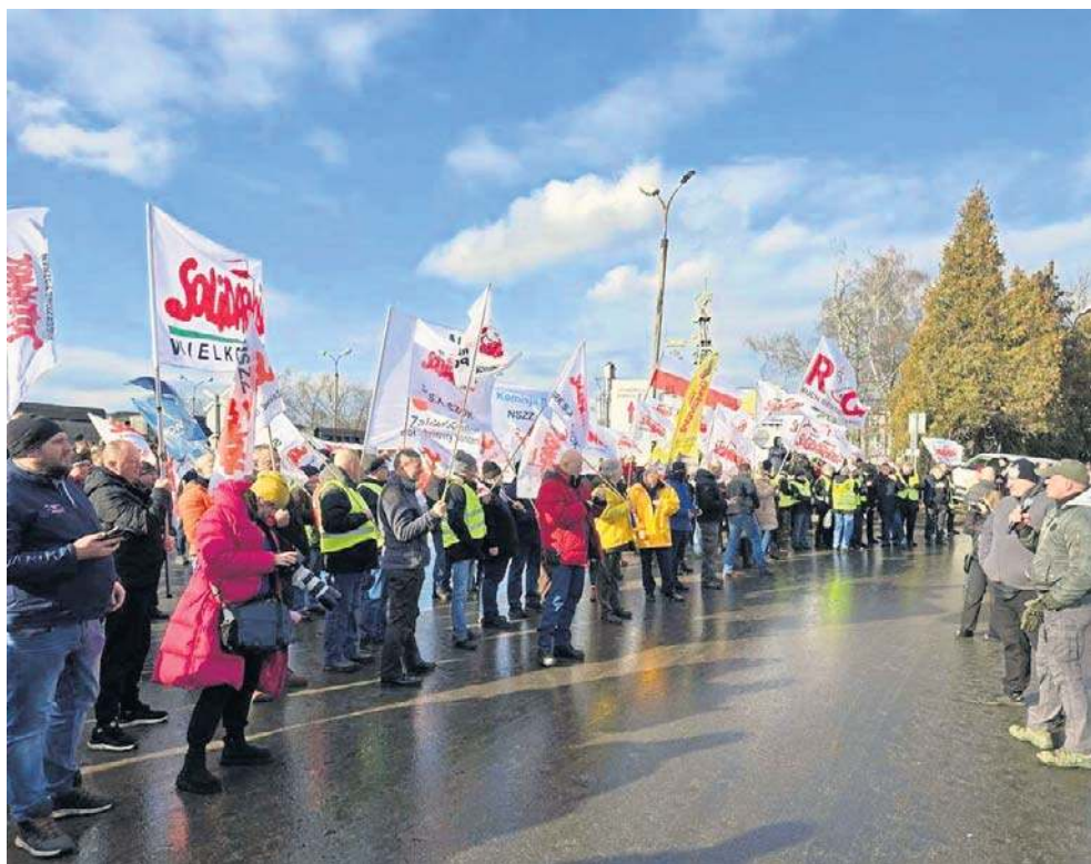
Związkowcy protestowali przed bramą PG „Silesia”

Zarządca sądowy miał przekazać, że wszystkie kroki podejmuje zgodnie z prawem. - Jako przyczynę zwolnień miał określić korektą zatrudnienia w celu dostosowania do obowiązującego planu techniczno-