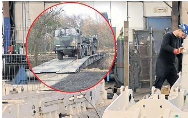
Zakład należący do PGG może produkować elementy do produkcji mobilnych mostów dla Wojska Polskiego

- Możemy produkować różnego rodzaju spawane konstrukcje stalowe. Przypomnę, że ZPR produkuje sekcje obudowy zme-