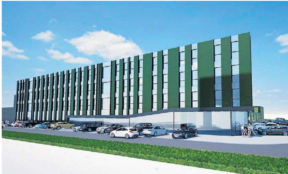
Nowoczesny kompleks biurowo-przemysłowy dla firmy Kolba wybuduje SKB LDR, specjalista w budownictwie przemysłowym. Inwestycja ma być gotowa za 1,5 roku

- To dla nas wyjątkowy projekt. Po latach doświadczeń w budownictwie przemysłowym i logistycznym wchodzimy w realizację obiektu dedykowanego sektorowi obronemu. Współpraca z firmą Kolba pozwala nam połączyć nasze kompetencje w konstrukcjach stalowych i nowoczesnym budownictwie z wymogami bezpieczeństwa i funkcjonalności, jakie stawia infrastruktura strzelecka i magazynowa - mówi Miłosz Adamczyk, wiceprezes zarządu SKB LDR.