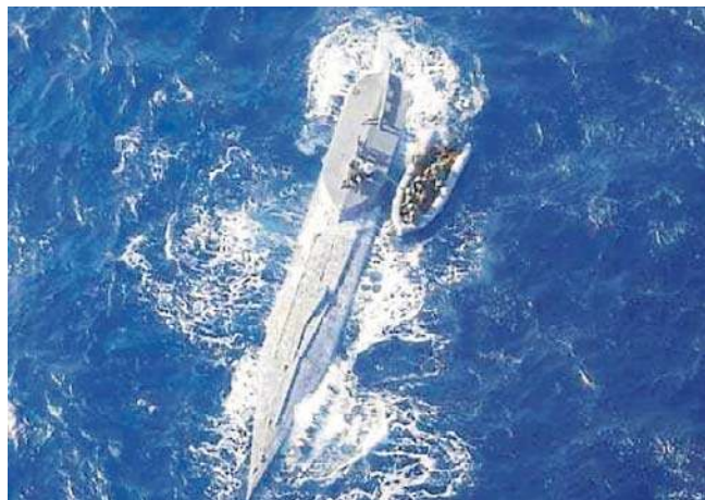
Zdjęcie z przejęcia łodzi podwodnej pełnej kokainy wartej 441 milionów dolarów