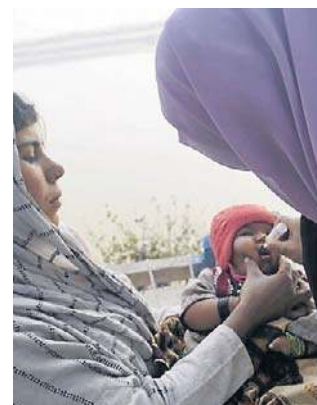
Kampania szczepień w Pakistanie

- Najczęściej ekipa medyczna nie zastała dziecka w domu. W innych przypadkach pracownikom nie udało się dotrzeć na miejsce z powodu problemów z bezpieczeństwem lub trudnych warunków atmosferycznych - powiedział dzien-