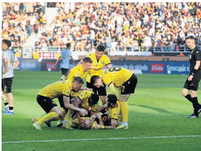
Radość piłkarzy GKS Katowice w Szczecinie była w pełni uzasadniona. Po 25 latach klub wraca do Europy