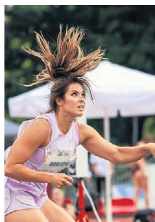
Maria Andrejczyk udanie rozpoczęła sezon 2026