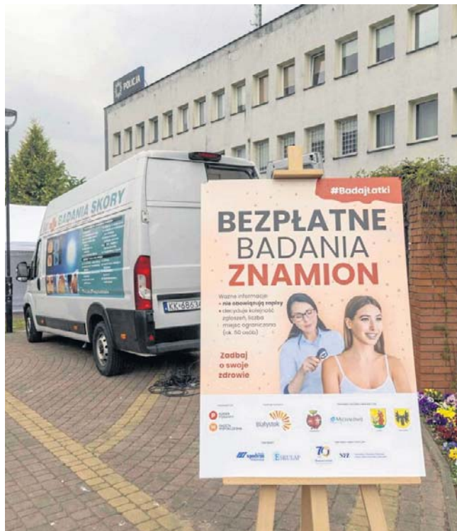
Mobilny dermobus odwiedził Choroszcz, Mońki, Michałowo, Wasilków oraz Białystok, umożliwiając wykonanie bezpłatnych badań dermatologicznych

- Choroszcz uczestniczy w różnych akcjach prozdrowotnych, bo zawsze zależy nam na tym, żeby nasi mieszkańcy