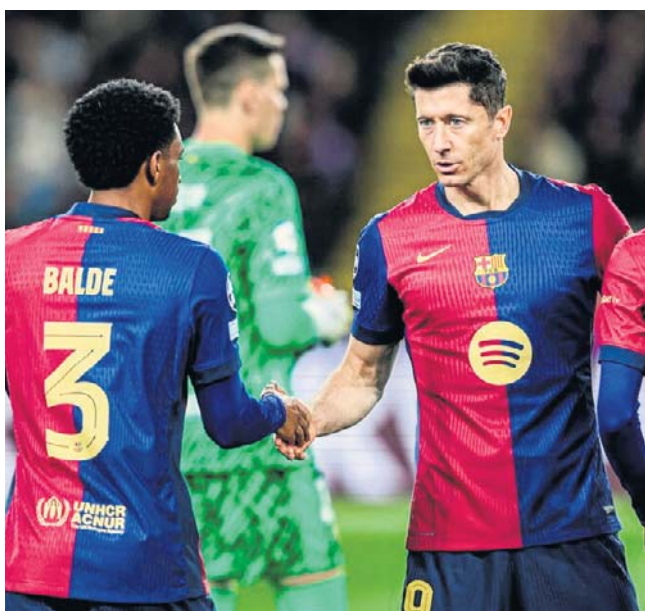
- Świetny piłkarz pożegnał się z ligą hiszpańską tak jak chciał, czyli strzelając ostatniego gola - napisał „Sport”

Zupełnie inaczej ostatnią kolejkę ligowych rozgrywek będzie wspominał Zieliński. Inter Mediolan zremisowała w „polskim” meczu 3:3 z FC Bologną, której bramkarzem jest Łukasz Skorupski.