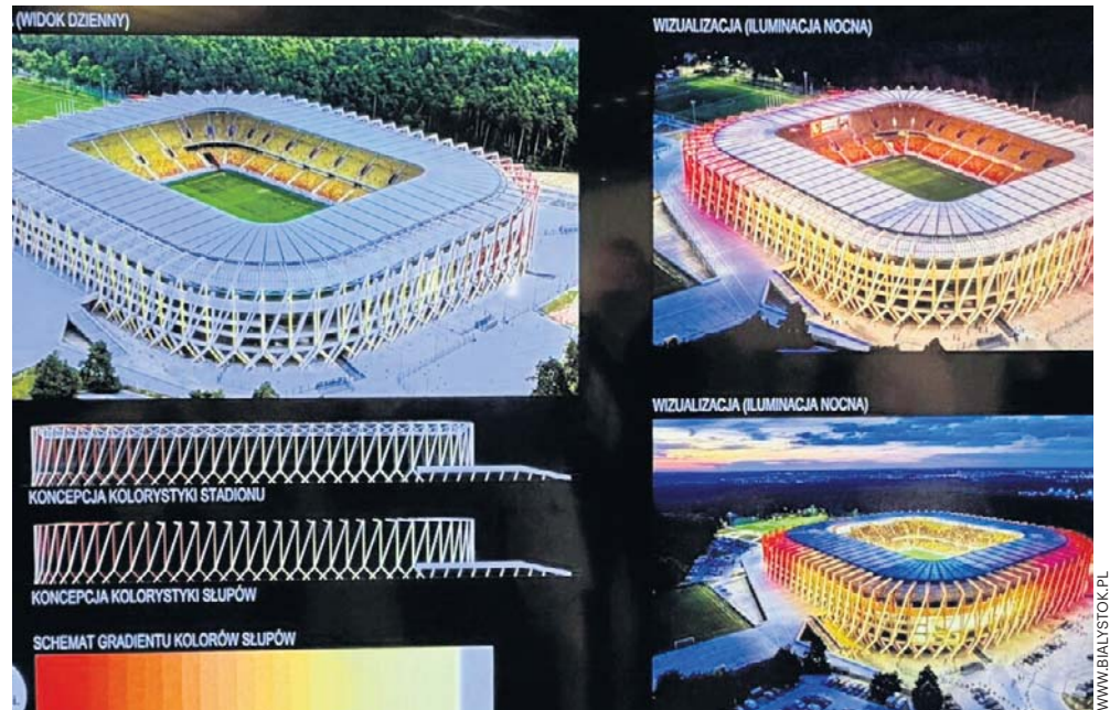
Koncepcja nowej kolorystyki Chorten Areny

- Chcieliśmy uniknąć dosłownego cytowania kolorów. Mogłoby sprawiać, że obiekt