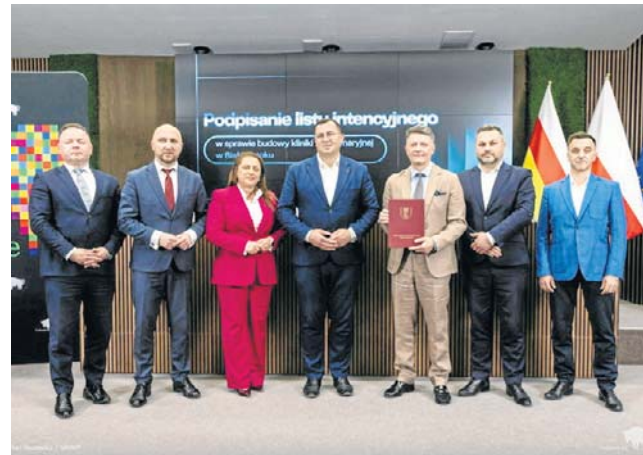
List intencyjny w sprawie budowy kliniki weterynaryjnej w Białymstoku został podpisany w piątek

UwB to największa uczelnia w Podlaskiem, na 15 kierunkach kształci się ponad 8,5 tys. studentów.