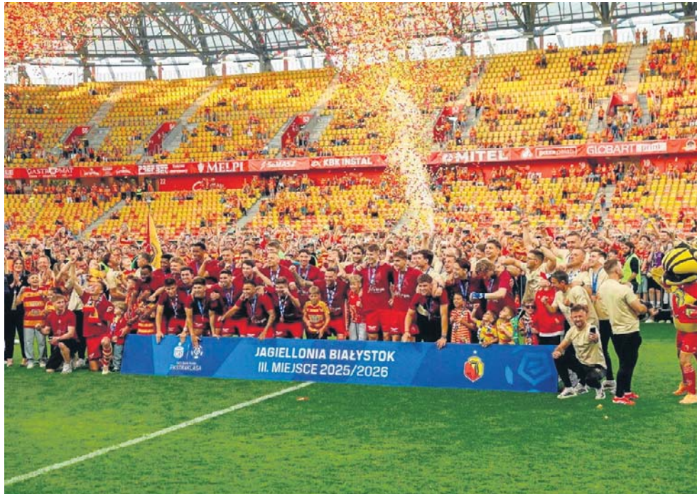
Piłkarze Jagiellonii Białystok drugi raz z rzędu wywalczyli brązowe medale mistrzostw Polski, a trzeci raz z rzędu stanęli na podium