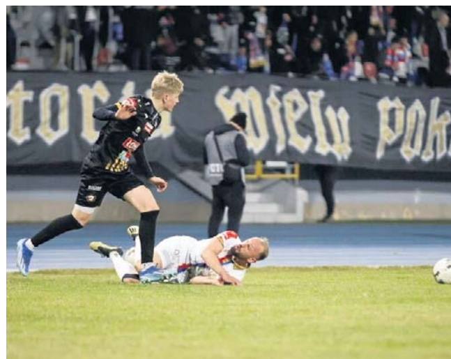
Piłkarze ŁKS Łomża są już bardzo blisko baraży o II ligę