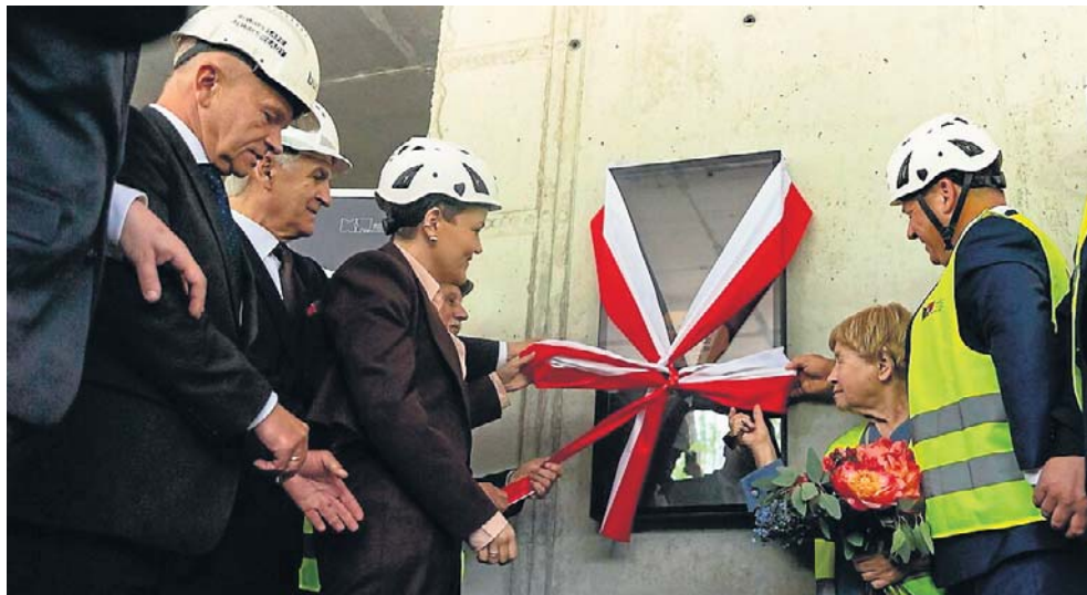
Kamień węgielny wmurowany w przezroczystą gablotę będzie widoczny dla zwiedzających muzeum w Okopach

W październiku 2027 roku, na 42. rocznicę męczeńskiej śmierci bł. ks. Jerzego Popiełuszki ma być gotowe muzeum jego pamięci, które powstaje w Okopach. Choć gmach już w części jest gotowy, w piątek odbył się tam uroczysty akt wmurowania kamienia węgielnego. Kilka miesięcy temu w Watykanie osobiście poświęcił go papież Leon XIV. W muzeum kamień został umieszczony w gablocie widocznej dla zwiedzających.