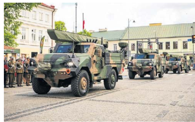
FOT. 14. SUWAŁSKI PUŁK PRZECIWPANCERNY

Żołnierze 14. Suwałskiego Pułku Przeciwpancernej im. Marszałka Józefa Piłsudskiego świętowali w piątek w centrum Suwałk siódmą rocznicę powstania jednostki. Była defilada sprzętu wojskowego, uroczysty apel i piknik dla mieszkańców miasta.