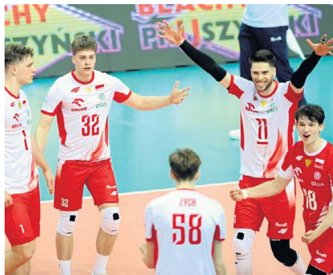
Radość siatkarzy reprezentacji Polski podczas sobotniego meczu Silesia Cup z Bułgarią w Katowicach

Kolejnym przystankiem Polaków będzie chińskie Liny, gdzie 10 czerwca rozpocznie walkę w Lidze Narodów.