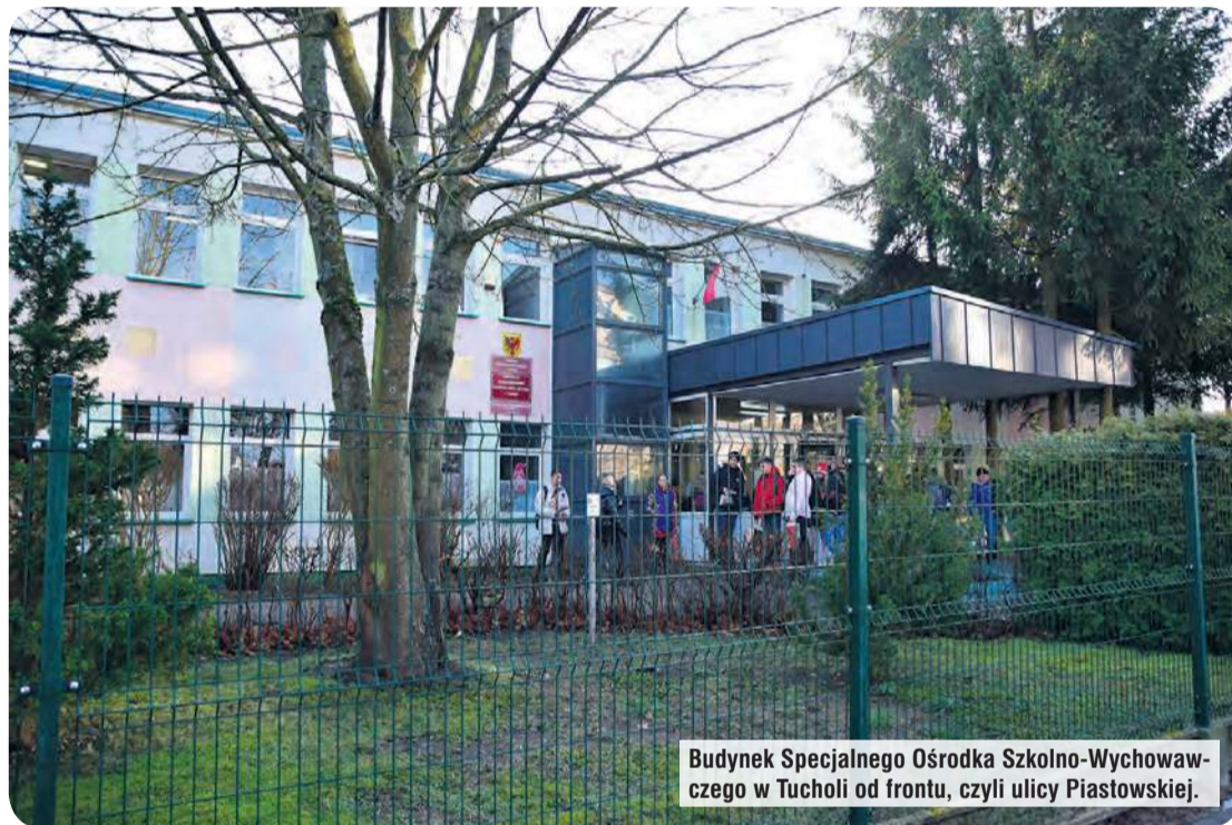
Budynek Specjalnego Ośrodka Szkolno-Wychowawczego w Tucholi od frontu, czyli ulicy Piastowskiej.

– Ja już nieco żartobliwie mówię, że mamy duże boisko, więc może tam postawimy ogrzewane