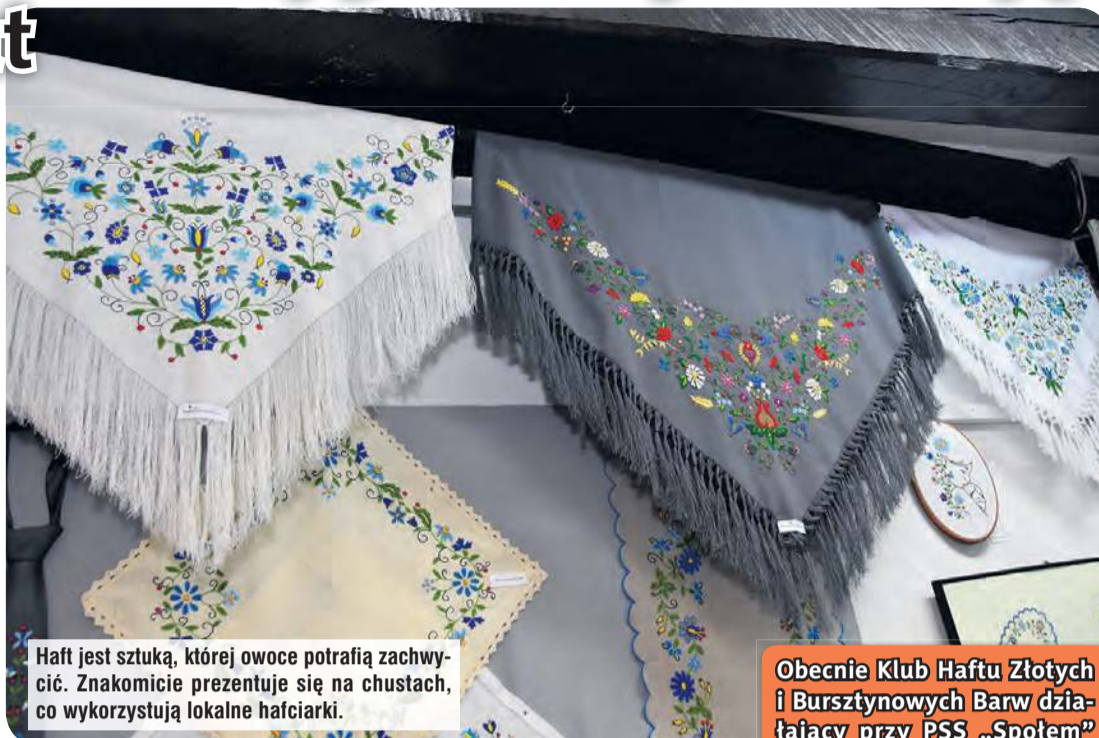
Haft jest sztuką, której owoce potrafią zachwycać. Znakomicie prezentuje się na chustach, co wykorzystują lokalne hafciarki.

Hafciarskie – i nie tylko – dzieła można zobaczyć samemu w ra-