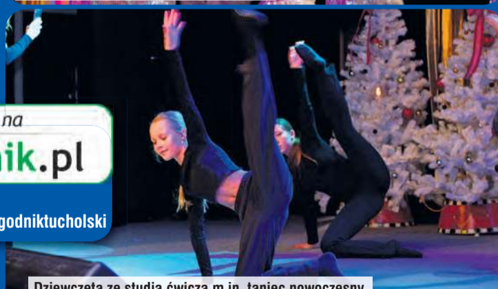
Dziewczęta ze studia ćwiczą m.in. taniec nowoczesny.