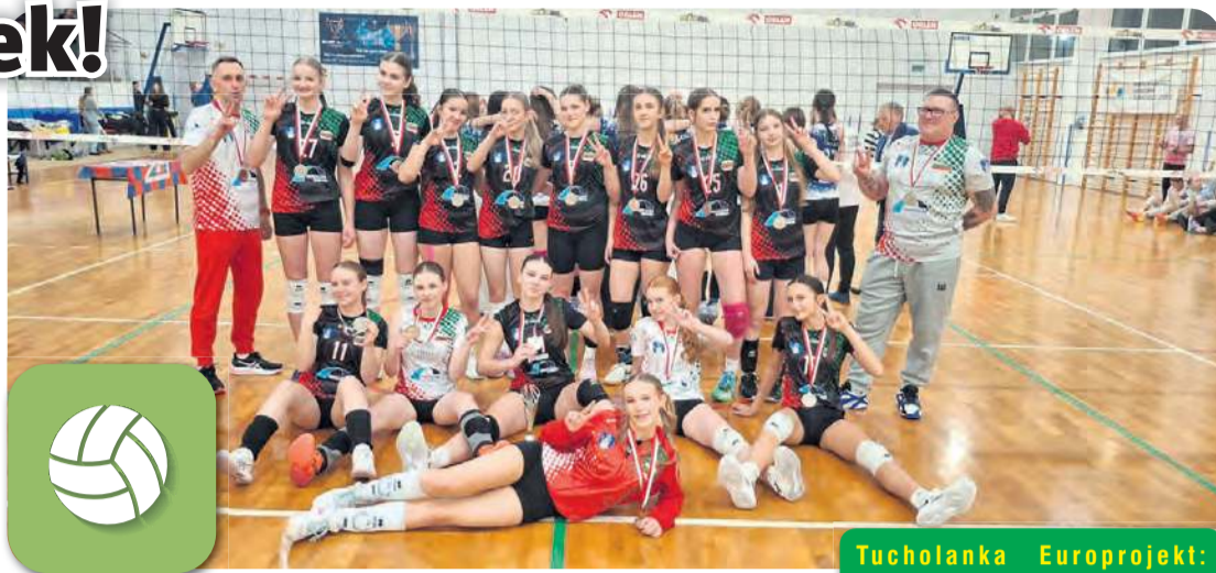
To zdjęcie to podsumowanie ważnego występu Tucholanek w Bydgoszczy.

Kluczem do zwycięstwa w pierwszym secie była potężna i dokładna zagrywka, która odrzuciła rywalki od siatki. Siatkarki znad Wisły nie rezygnowały i umiały odrobić straty, gdy Tucholanki wypracowały przewa-