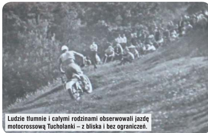
Ludzie tłumnie i całymi rodzinami obserwowali jazdę motocrossową Tucholanki – z bliska i bez ograniczeń.

Ciekawa jest też historia pozyskiwania opon. Wiadomo, że w tamtych czasach nie było różowo ze sprzętem, zatem trzeba było dwoić się i troić, by zdobyć coś niezbędnego. Nie do wiary, ale Tucholanie byli na tyle obrotni, że do gokartów pozyskiwali charakterystyczne, małe kółka z warsztatów lotniczych, a pochodziły one z samolotów, z przedniego ich podwozia. Takich i innych cudów do-