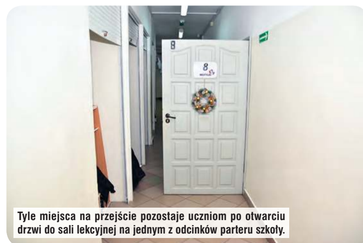
Tyle miejsca na przejście pozostaje uczniom po otwarciu drzwi do sali lekcyjnej na jednym z odcinków parteru szkoły.