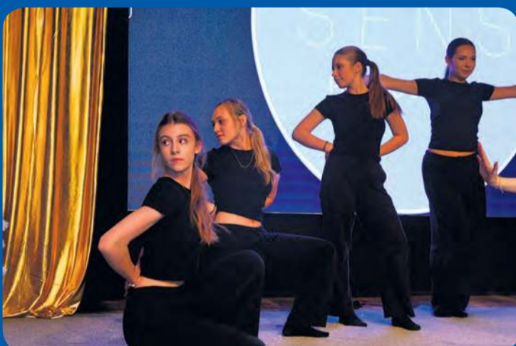
Dziewczęta wystąpiły w tańcu modern dance. To najstarsza grupa, która podczas gali pojawiła się na scenie Tucholskiego Ośrodka Kultury.