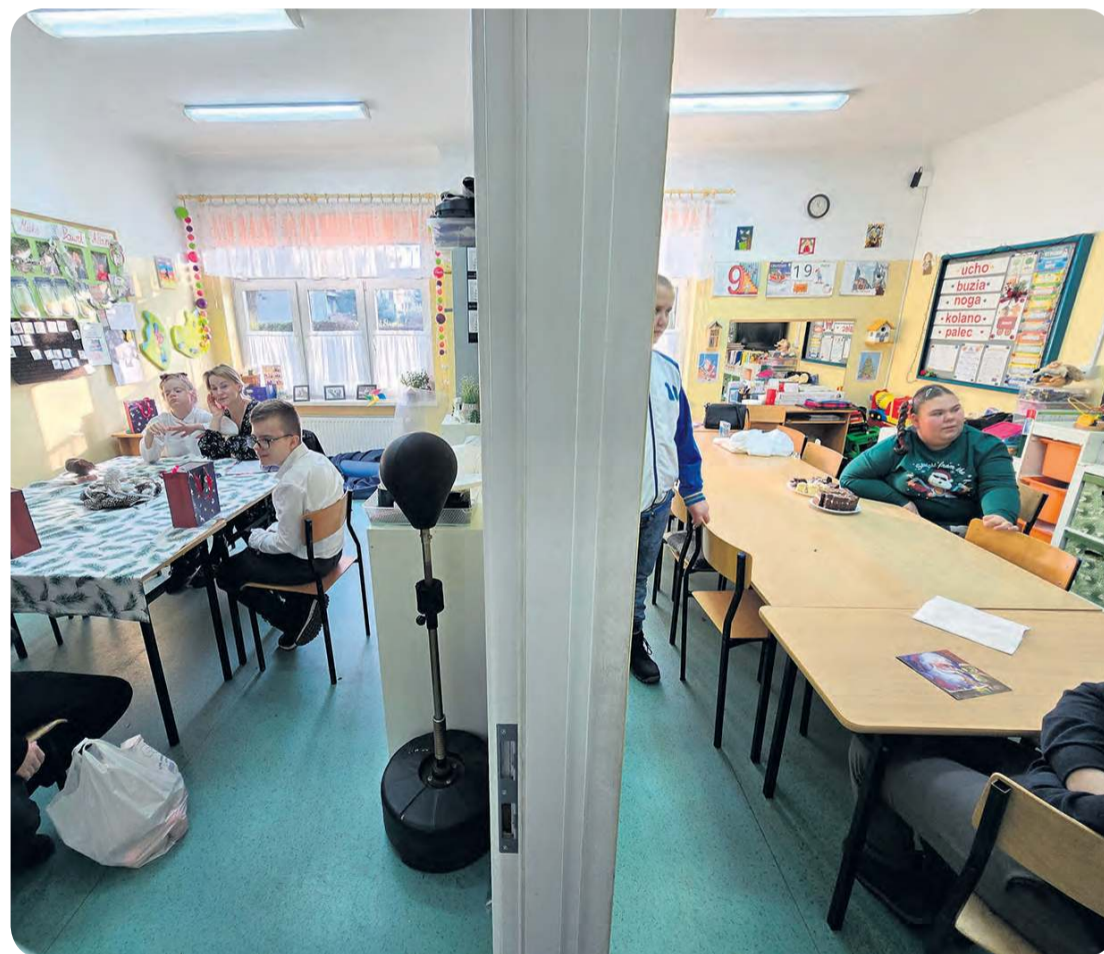
Dwie sale z jednej? W szkole specjalnej wdrożono i takie rozwiązania.