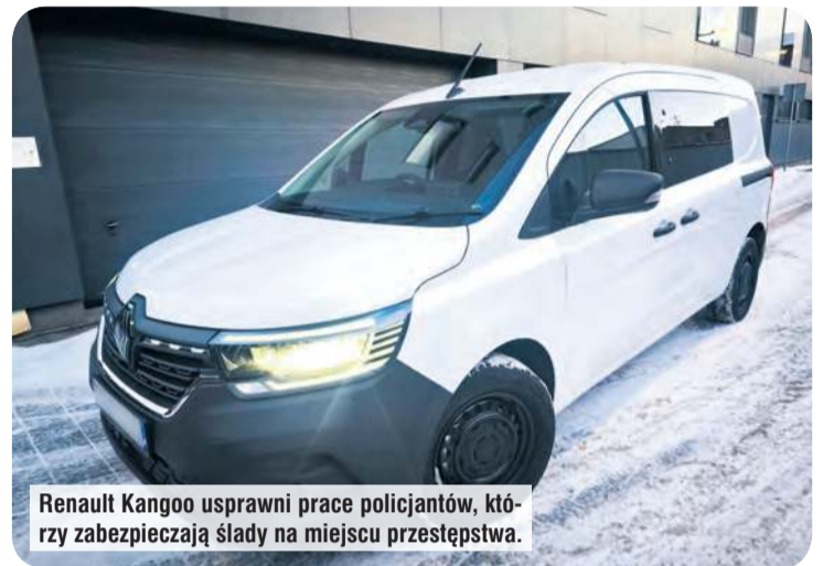
Renault Kangoo usprawni prace policjantów, którzy zabezpieczają ślady na miejscu przestępstwa.