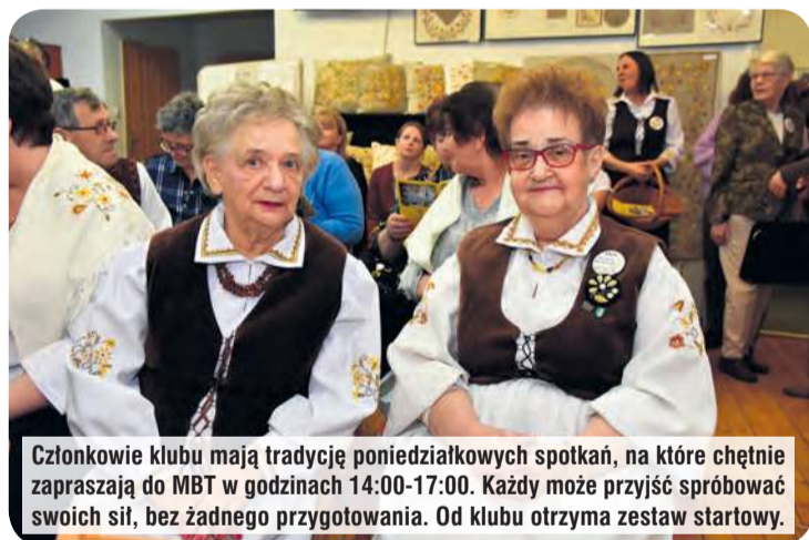
Członkowie klubu mają tradycję poniedziałkowych spotkań, na które chętnie zapraszają do MBT w godzinach 14:00-17:00. Każdy może przyjść spróbować swoich sił, bez żadnego przygotowania. Od klubu otrzyma zestaw startowy.