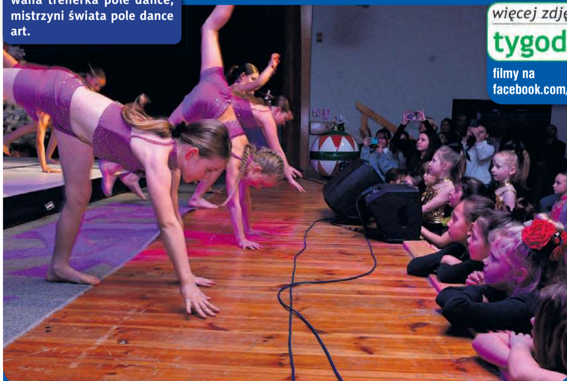
Wzajemne podglądanie i wspólny doping. To cecha charakterystyczna gali, która odbyła się w niedzielę.