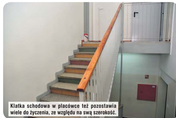
Klatka schodowa w placówce też pozostawia wiele do życzenia, ze względu na swą szerokość.

„Podczas przerw śródlekcyjnych na korytarzach panuje tłok. Nie ma możliwości realizowania przez dzieci specjalistycznych zajęć zgodnie z ich potrzebami edukacyjnymi i społecznymi zwanymi w potrzebach kształcenia specjalnego. Dzieci również pragną, mimo swoich niepełnosprawności, rozwijać swoje pasje,