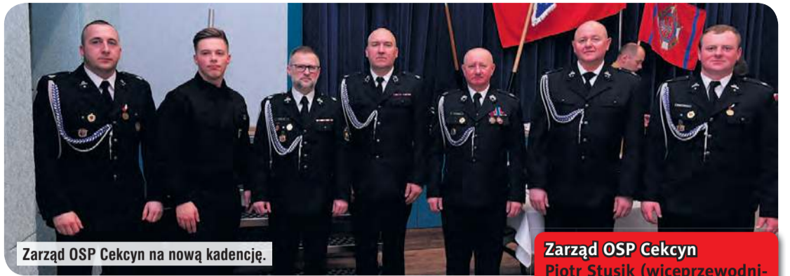
Zarząd OSP Cekcyn na nową kadencję.