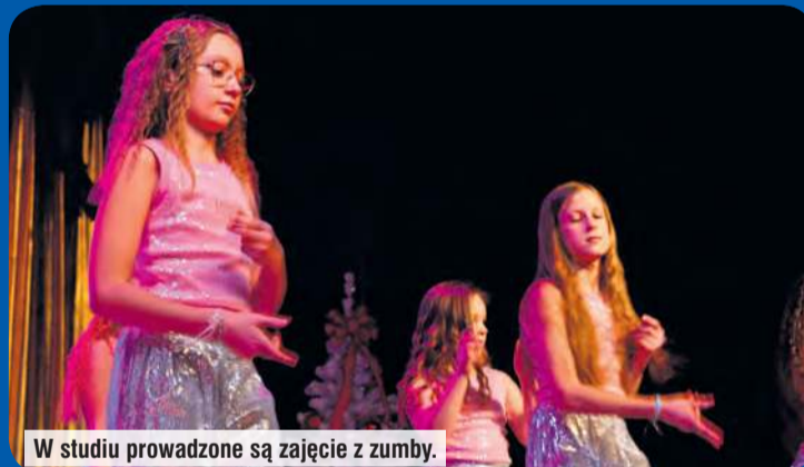
W studiu prowadzone są zajęcia z zumby.