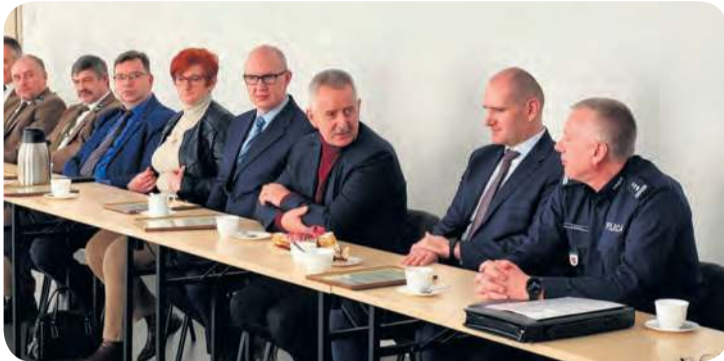
W odprawie uczestniczyli m.in. samorządowcy z terenu powiatu tucholskiego.

– Auto posiada jednostkę napędową o mocy 180 KM. Samochód został wyposażony