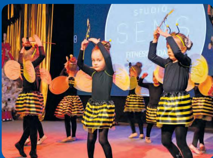
Najmłodsza grupa studia tutaj w roli „pszczołek”. Dziewczynki stawiają pierwsze sceniczne kroki i dlatego też wzbudzają wielki entuzjazm u swoich bliskich.