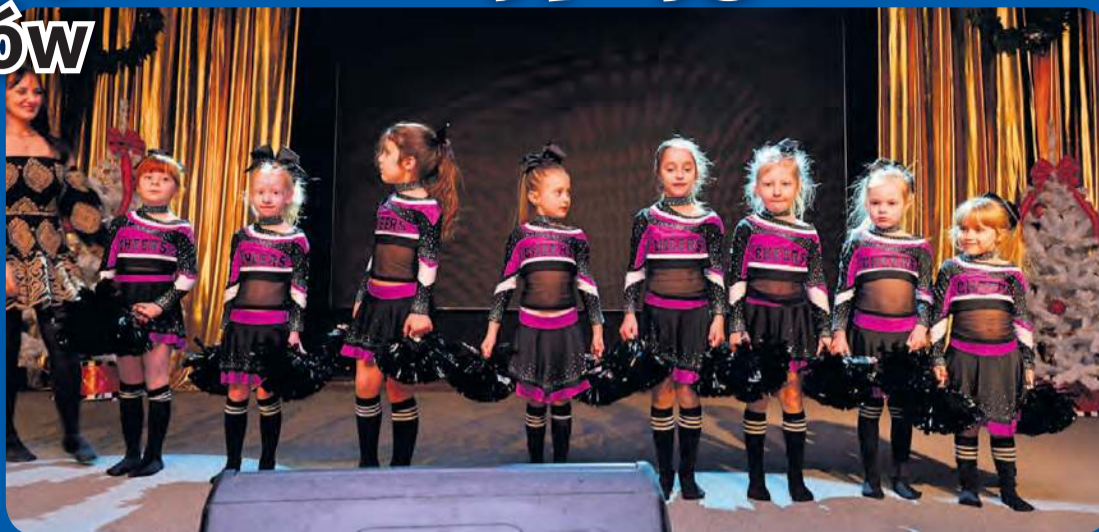
Grupa cheerleaderek regularnie zagląda na konkursy organizowane w regionie.