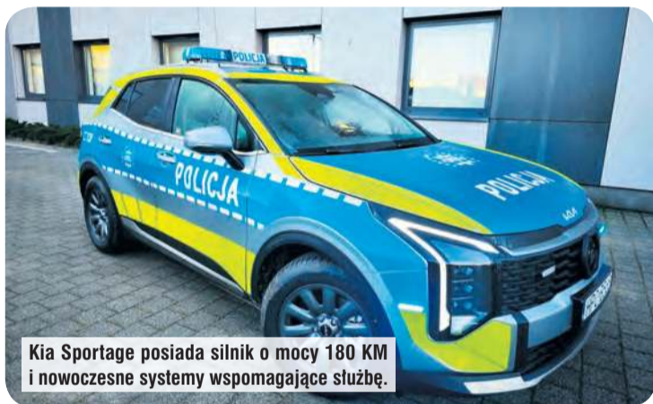
Kia Sportage posiada silnik o mocy 180 KM i nowoczesne systemy wspomagające służbę.