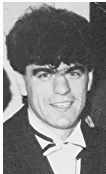
Diabeł za młodu

bym były znamienite kluby takie jak Górnik Wałbrzych, Bałtyk