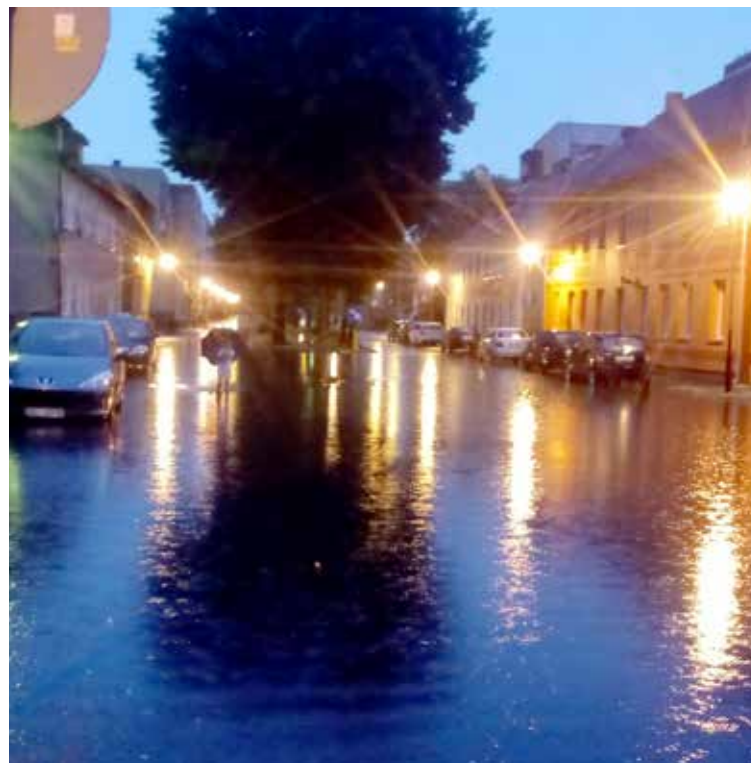
Po ulewach ulice zamieniają się w rzeki

Teraz jednak pojawiła się nadzieja na poprawę sytuacji. Gmina Goleniów rozpoczęła postępowanie przetargowe