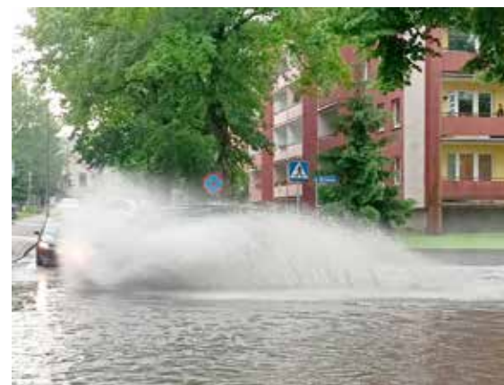
Deszczówka zalewa ulice