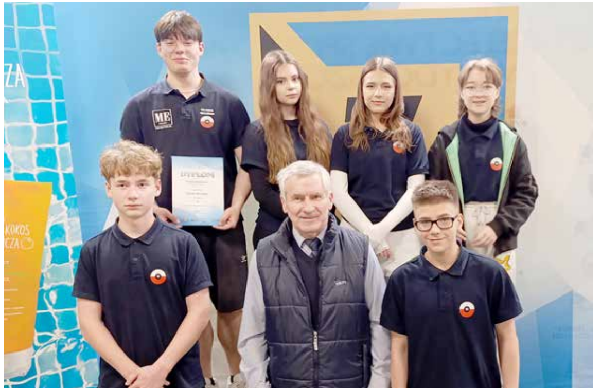
Trener z zawodnikami

kurencji 25 m Pistolet szybkostrzelny 2x30 strzałów (serie 8 sek i 6 sek) zajął szesnaste miejsce, w konkurencji 10 m Pistolet pneumatyczny 40 strzałów zajął