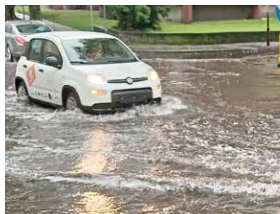
Problem powtarza się regularnie