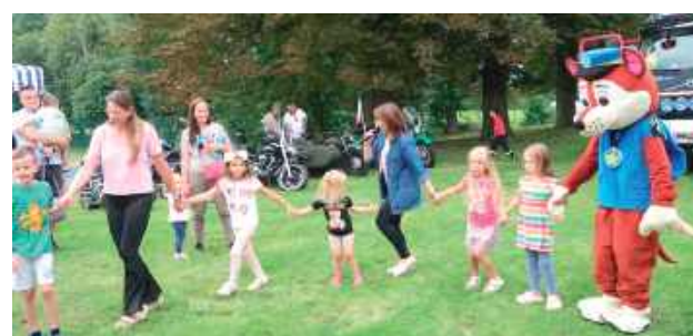
III edycja Pikniku W.P.A.R.K. 2025