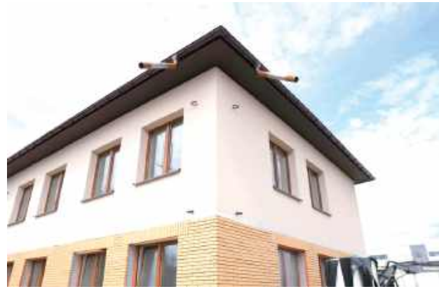
W nowym bloku powstanie 12 mieszkań przeznaczonych dla osób o niskich dochodach lub znajdujących się w trudnej sytuacji życiowej

schronienie tymczasowe w sytuacjach nagłych lub awaryjnych.