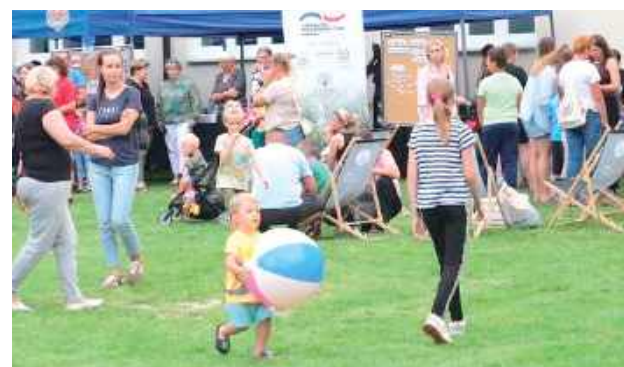
III edycja Pikniku W.P.A.R.K. 2025