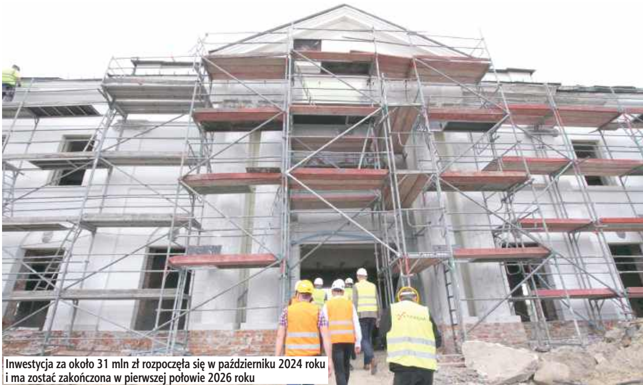
Inwestycja za około 31 mln zł rozpoczęła się w październiku 2024 roku i ma zostać zakończona w pierwszej połowie 2026 roku

Zabytkowy dworzec kolejowy w Łukowie, wzniesiony w 1866 roku i przebudowany po I wojnie światowej w latach 1919-1921, przechodzi kompleksową modernizację.