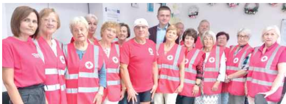
Pierwszym przystankiem na trasie był Łuków. W Klubie Seniora PCK spotkał się z jego członkami, którzy wysłuchali relacji z wcześniejszych wypraw i planów na tegoroczną trasę

Celem wyprawy jest promowanie działalności Polskiego Czerwonego Krzyża, idei wolontaria-