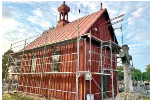
W ramach inwestycji prowadzone są roboty budowlane przy kaplicy cmentarnej oraz modernizacja ogrodzenia

Ruszyły prace przy kaplicy cmentarnej oraz ogrodzeniu nekropolii parafialnej w Tuchowiczu.