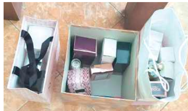
Łukowscy kryminalni namierzyli 45-letnią mieszkankę gminy Łuków, która wystawiła na sprzedaż perfumy odpowiadające tym skradzionym

- Chcąc je uchronić przed upałem, wyniosła je do chłodniejszego pomieszczenia gospodarczego. Zapakowane w ozdobne pudełka ponad 180 flakoników perfum kobieta zostawiła na półce regału. Po kilku dniach zorientowała się, że ktoś włamał się do tego pomieszczenia i ukradł stamtąd wszystkie pudełka z flakonikami perfum i dodatkowo jeszcze jej obuwie. Zawiadamiając policjantów o kradzieży z włama-