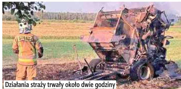
Działania straży trwały około dwie godziny

Ogień objął zarówno maszynę rolniczą, jak i ściernisko, na którym pracowała. Na miejsce zadysponowano zastępy z OSP Jamielne, OSP Stoczek Łukowski oraz PSP Łuków. Strażacy szybko przystąpili do działań gaśniczych, które trwały blisko dwie godziny.