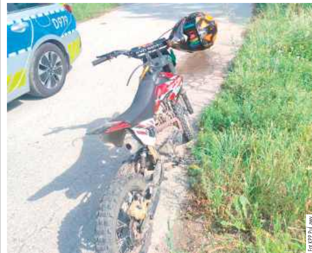
Młody kierowca niejedno miał na sumieniu. Nie dość, że jechał pojazdem niedopuszczonym do ruchu, to w dodatku był pod wpływem alkoholu

Motocykl bez tablic rejestracyjnych zatrzymali policjanci z puławskiej drogówki w Górach w gminie Markuszów. Kierowca nie tylko to miał na sumieniu.