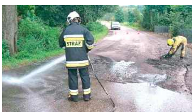
Strażacy oczyścili drogę i zmyli zanieczyszczenia wodą

Działania miały na celu przywrócenie bezpieczeństwa na drodze po tym, jak zalegające na