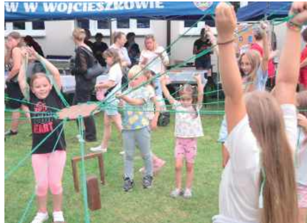
III edycja Pikniku W.P.A.R.K. 2025