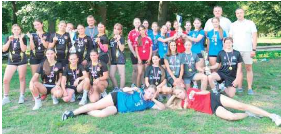
III edycja Pikniku W.P.A.R.K. 2025