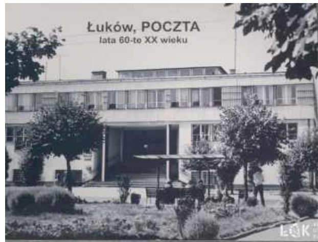
Poczta w Łukowie, lata 60.

Jak co miesiąc w trakcie giełdy można było kupić, sprzedać, wymienić lub po prostu obejrzeć bogaty wybór kolekcjonerskich okazów.