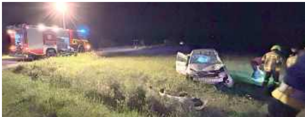
Ratownicy przy pomocy wyciągarki ustawili pojazd na kołach

W nocy z 7 na 8 sierpnia o godzinie 23.31 służby ratownicze zostały zadysponowane do zdarzenia drogowego na drodze wojewódzkiej nr 76.