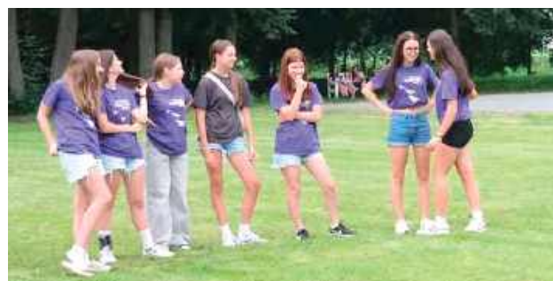
III edycja Pikniku W.P.A.R.K. 2025