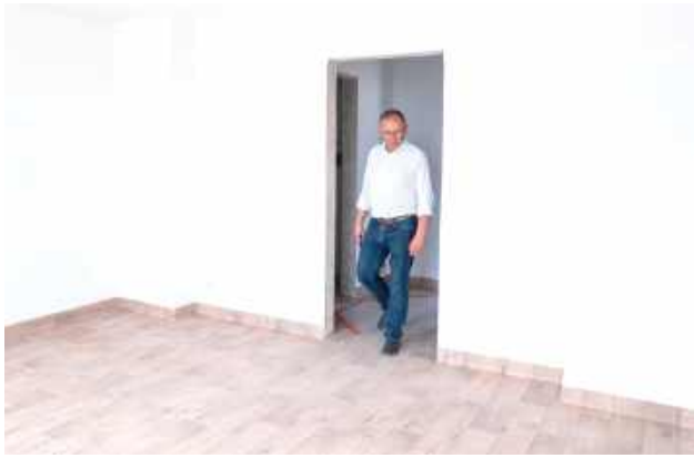
Powstający blok będzie częścią miejskiego zasobu mieszkaniowego i ma stanowić wsparcie dla najbardziej potrzebujących mieszkańców

Oprócz głównego budynku planowana jest także budowa pięciu kontenerów mieszkalnych. Mają one służyć jako