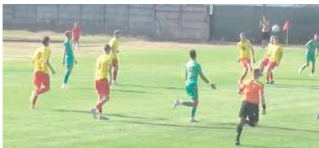
Beniaminek z Łukowa musiał pogodzić się z porażką z Hetmanem

- Byliśmy zmuszeni do gry w obronie niskiej. Przyjechał do nas jeden z faworytów do wy-