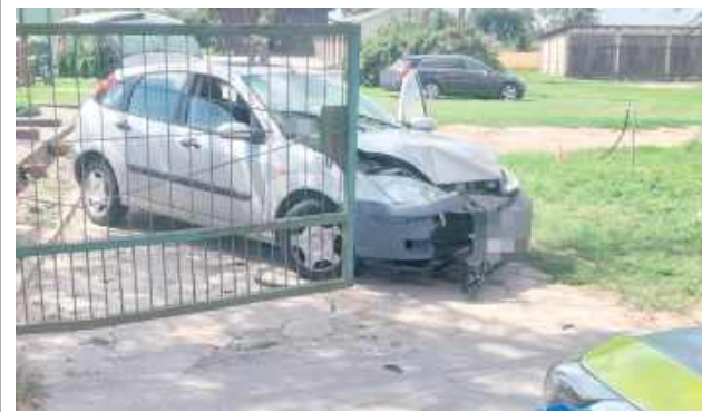
Kierowca Forda wydmuchał 3 promile

Wszystko działo się w piątkowe popołudnie (1 sierpnia), około godz. 14 w Końskowoli. Właściciel jednej z tamtejszych posesji nagle usłyszał huk. Gdy poszedł zobaczyć, co się stało, na bramie zobaczył osobowego Forda.