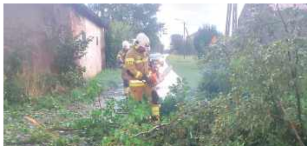
an Strażacy przy pomocy pił usuwali powalone drzewa i konary

Działania straży pożarnej trwały od godziny 18.44 do 20.07. Na miejscu pracowali druhowie z OSP Burzec oraz zastęp z JRG Łuków wyposażony w podnośnik.