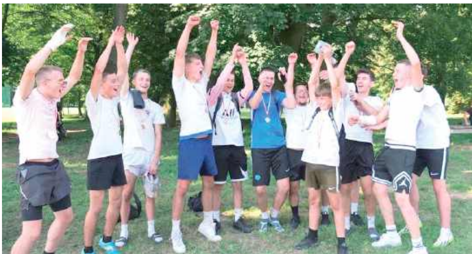
III edycja Pikniku W.P.A.R.K. 2025