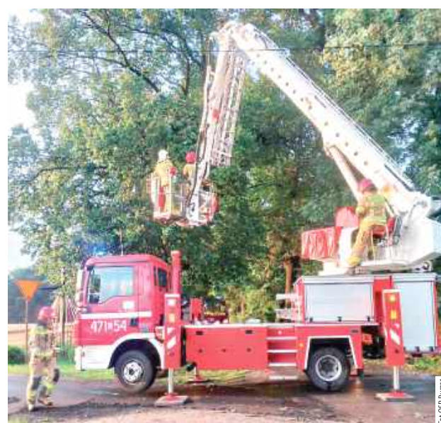
Na miejsce zadysponowano zastęp z JRG Łuków z podnośnikiem