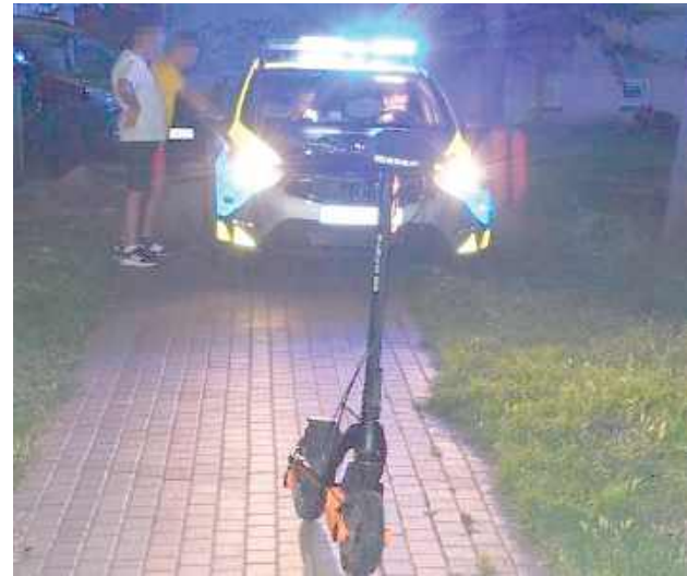
Chłopiec trafił do szpitala, jego obrażenia na szczęście nie były poważne

- Mundurowi, którzy przyjechali we wskazane miejsce,