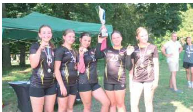
III edycja Pikniku W.P.A.R.K. 2025

W piątek, 8 sierpnia odbyła się III edycja Pikniku W.P.A.R.K., podczas której park tętnił życiem. Uczestnicy mogli skorzystać z dmuchańców, wziąć udział w animacjach i konkursach, a także w warsztatach kulinarnych oraz pokazach motoryzacyjnych. Wieczór zwieńczyło kino plenerowe, które przyciągnęło widzów spragnionych filmowych emocji pod gołym niebem.