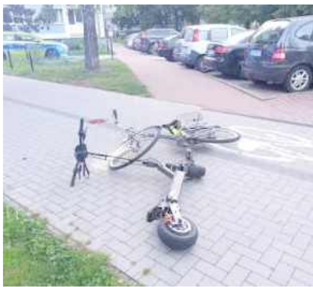
Rowerzystka i kierujący hulajnogą jechali w przeciwnych kierunkach i podczas wymijania zderzyli się czołowo

- Skierowani na miejsce policjanci ustalili, że podczas wykonywania manewru wymijania oboje uczestnicy nie zachowali