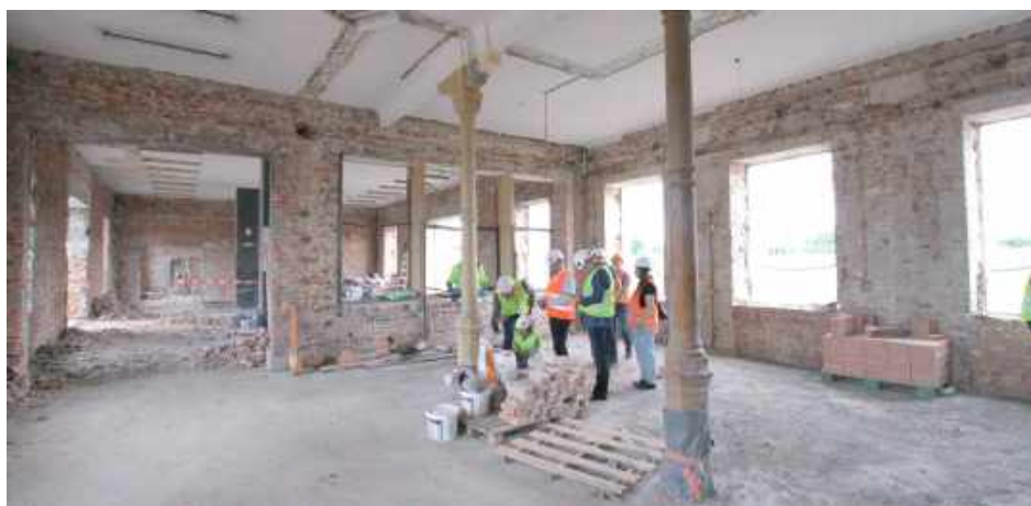
Wnętrze budynku zyskuje nową funkcję: hol główny zostanie zaaranżowany z poczekalnią, toaletami, przestrzenią usługową oraz elektronicznymi tablicami odjazdów i rozkładów jazdy

Wnętrze budynku zyskuje nową funkcję: hol główny zostanie zaaranżowany z poczekalnią, toaletami, przestrzenią usługową oraz elektronicznymi tablicami odjazdów i rozkładów jazdy. W planach jest także stacja ładowania urządzeń mobilnych, defibrylator oraz strefa wypoczynkowa dla podróżnych. Architektoniczne detale, w tym boazeria i posadzki w klasyczny