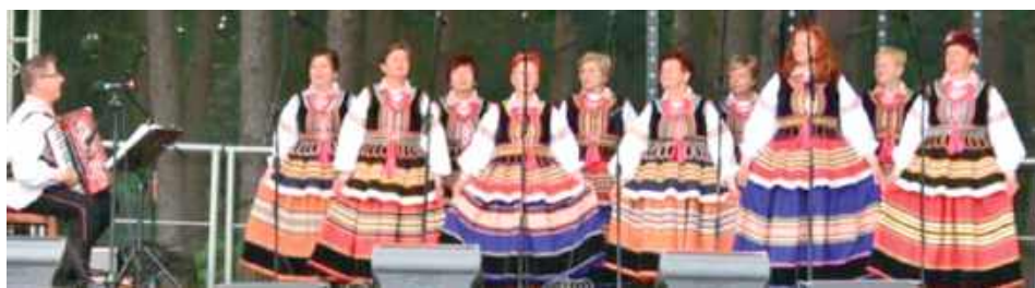
Za swój występ zespół „Niezapominajki” otrzymał wyróżnienie

„Niezapominajki” z Dminina działają przy Gminnym