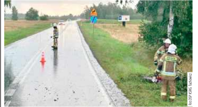
W czasie działań straży ruch na drodze był chwilowo utrudniony

3 sierpnia o godzinie 14.56 strażacy z jednostki OSP KSRG Tuchowicz zostali zadysponowani do usunięcia powalonego drzewa w miejscowości Wólka Zastawska.