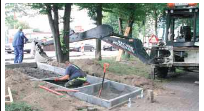
Zakończenie prac zaplanowano na połowę sierpnia

Łuków: Zarząd Dróg Miejskich prowadzi prace przy przebudowie parkingu zlokalizowanego przy ul. Rogalińskiego, naprzeciwko stadionu miejskiego.