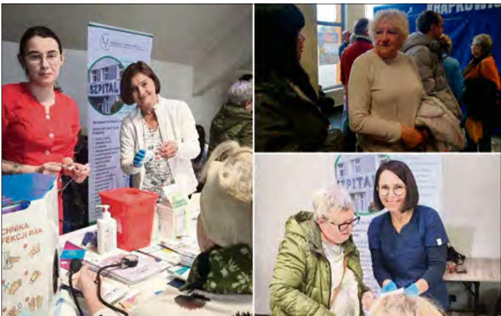
Organizatorzy stworzyli możliwość wykonania wielu bezpłatnych badań.

Gro mieszkańców skorzystało z bezpłatnych badań profilaktycznych podczas Marszałkowskich Dni Dla Zdrowia. Wydarzenie, które odbyło się w Hali Widowiskowo-Sportowej, było doskonałą okazją, by kompleksowo zadbać o swój stan zdrowia.