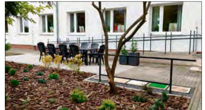
Tak prezentuje się nowa strefa sensoryczna. Zadanie zostało zrealizowane dzięki fundacji Górażdzie Aktywni w Regionie.

W połowie listopada zakończono projekt realizowany dzięki fundacji Górażdzie Aktywni w Regionie. Inicjatywa miała na celu stworzenie w ogrodzie strefy sensorycznej przy Domu Spokojnej Starości w Kamionku.