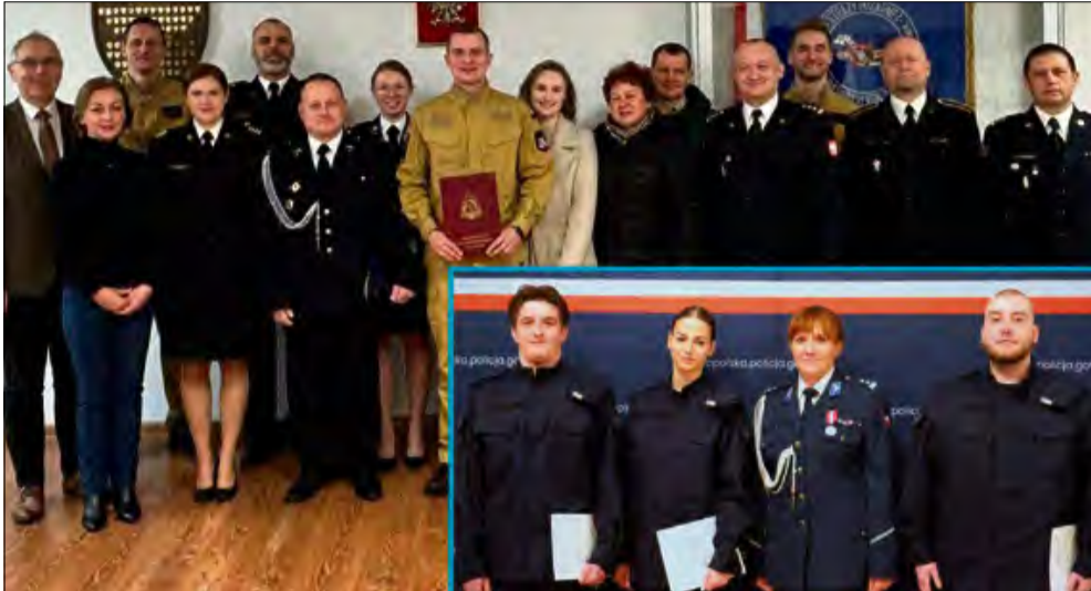
Gmina Krapkowice zyskała nowych mundurowych.

W ostatnich dniach szeregi służb mundurowych w powiecie krapkowickim zasilono czterech nowych funkcjonariuszy. Trójka policjantów oraz jeden strażak złożyli uroczyste ślubowania w obecności przełożonych, władz lokalnych i bliskich.