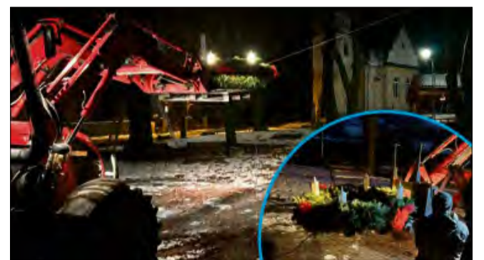
Inicjatywa z Oleszki pokazuje, że lokalne tradycje można kultywować w nowoczesny i angażujący sposób.

Jej słowa odzwierciedlają prawdziwie społeczny charakter całego przedsięwzięcia. W tym roku społeczność poszła o krok dalej, łącząc tradycję z nowoczesnością. Cztery świece na wieniec nie są bowiem standardowe – zostały wykonane na drukarce 3D. To innowacyjne rozwiązanie budzi zaintereso-