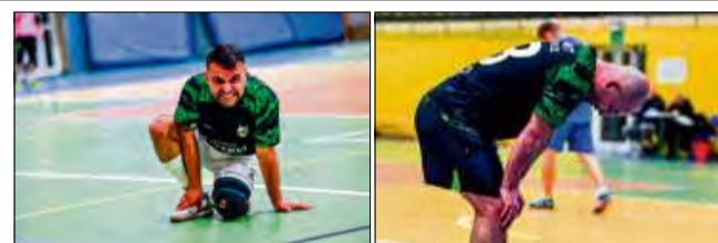
Zawodnicy Tawerny nie mieli lekkiego życia w pojedynku z Szew Budem.

Z góry na resztę ligowej stawki – przynajmniej przez najbliższy tydzień – będą patrzeć piłkarze Hestii.