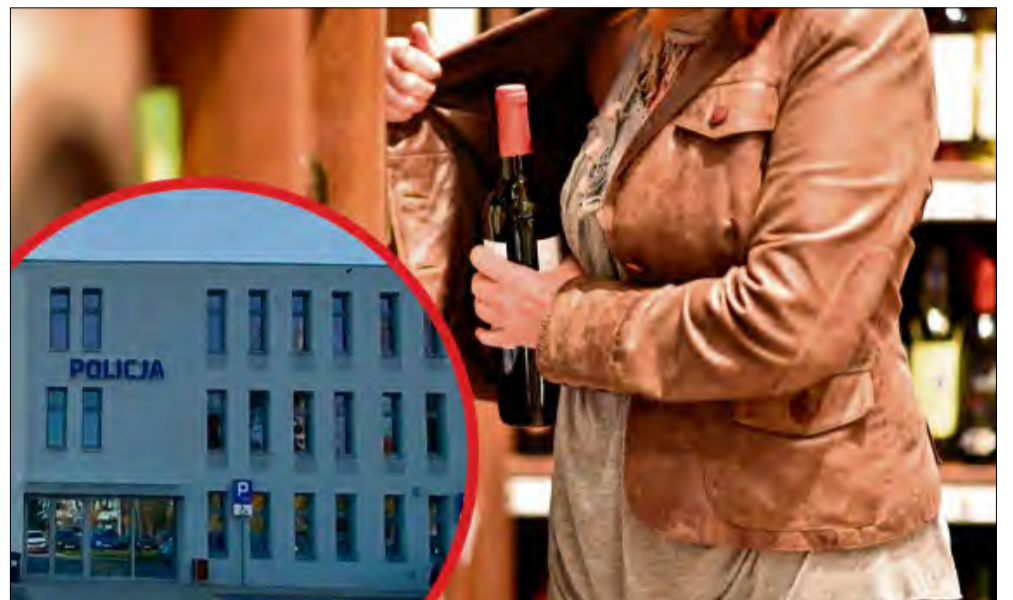
Funkcjonariusze z Krapkowic zatrzymali 28-latkę i 43-latkę podczas kradzieży.

Dwie mieszkanki powiatu głubczyckiego, w wieku 28 i 43 lat, zostały zatrzymane na gorącym uczynku w jednym ze sklepów w Krapkowicach. Policja ustaliła, że kobiety od dłuższego czasu okradają markety, a łączna wartość strat tylko w tym jednym punkcie przekroczyła 2 tysiące złotych.