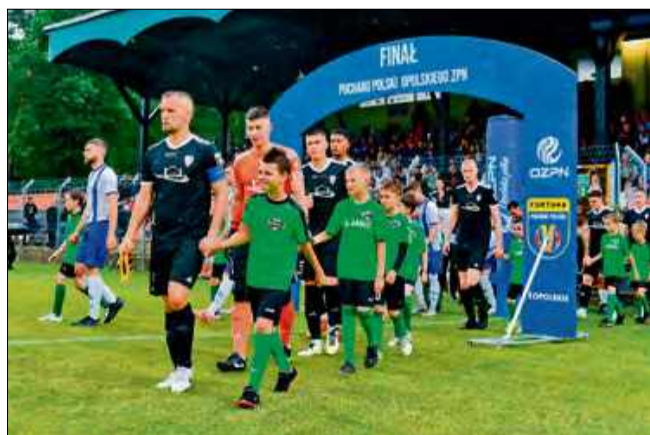
W lutym przyszłego roku na stadionie przy Rozwadowskiej dojdzie do rewanżu za finał PP OZPN z 2024 roku.

Zwycięzca ćwierćfinałowej potyczki w półfinale zagra z lepszym z pary Odra II Opole – Starowice Dolne. – Tra-