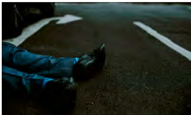
Poszkodowany doznał urazów nóg.

Jak informują policjanci, pieszy miał wejść pod maskę pojazdu. Według wstępnych ustaleń mężczyzna poruszał się niewłaściwą stroną jezdni, pozbawiony elementów odbłaskowych. Kierowca fiata nie miał zatem możliwości uniknięcia potrącenia.