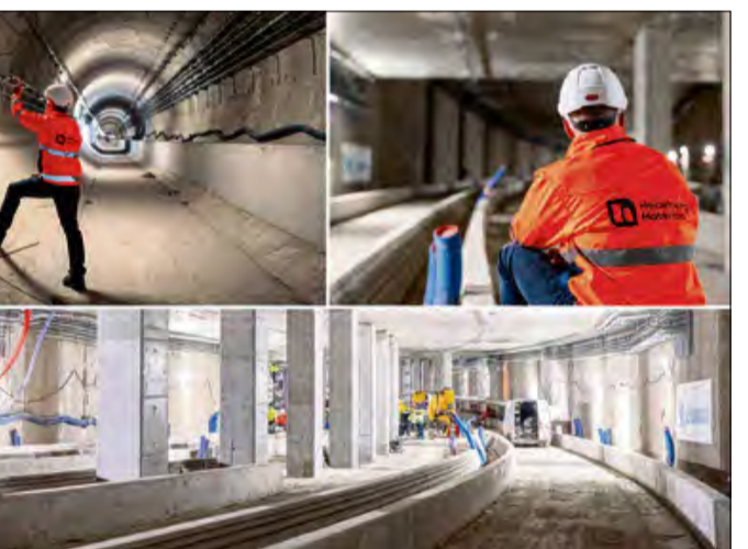
Realizowana z wykorzystaniem materiałów budowlanych firmy Heidelberg Materials Polska inwestycja jest największym tego typu zapleczem w historii warszawskiego metra.

Zakres prac budowlanych i wyposażeniowych jest bardzo szeroki. Wśród kluczowych obiektów wymienić można halę taboru pomocniczego, wyposażoną w dziewięć torów oraz suwnice. Kolejnym istotnym elementem jest elektrowozownia,