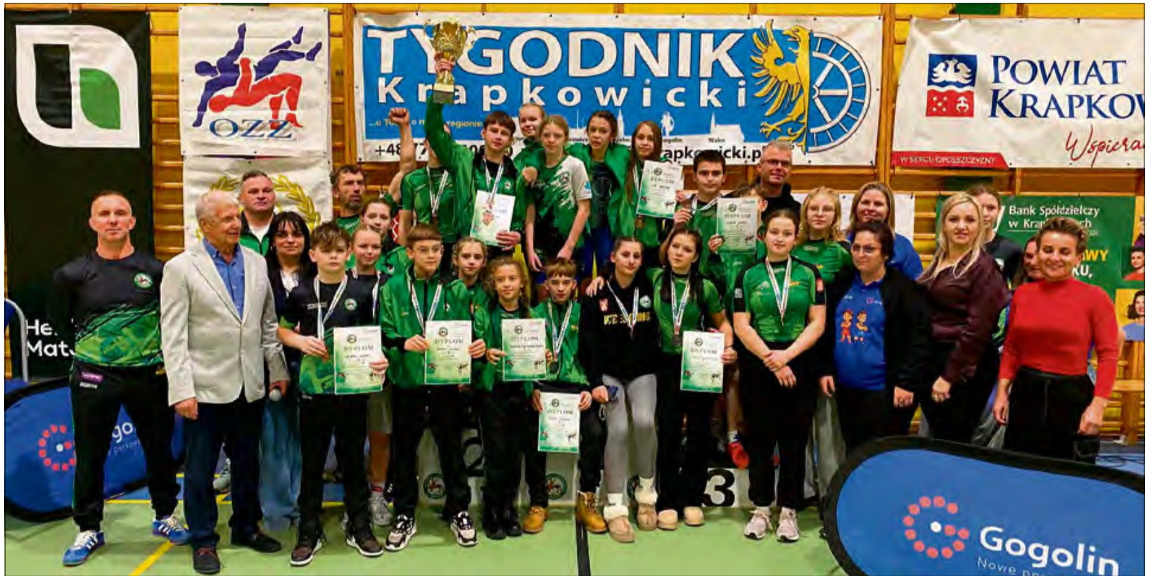
W memoriale Henryka Wołoszyna młodzi gogolinianie mieli sporo okazji do zaprezentowania swoich umiejętności na macie.