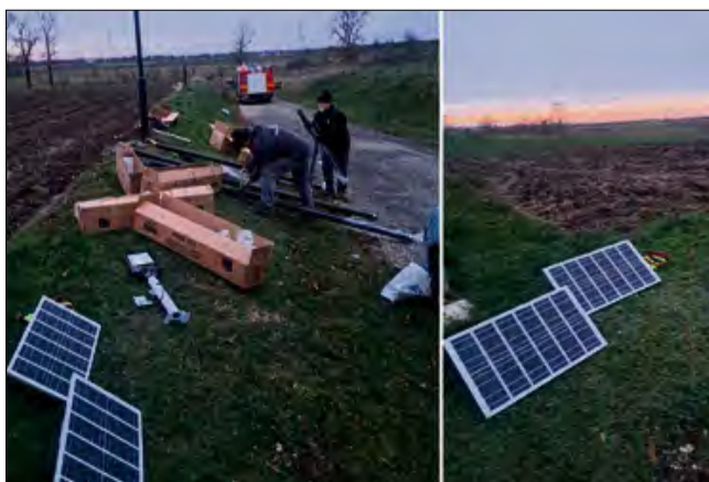
Stowarzyszenie Rozwoju Wsi Ściborowice poprawiło bezpieczeństwo miejscowości.

(matt), fot. Stowarzyszenie Rozwoju Wsi Ściborowice