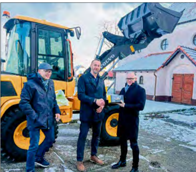
Sprzęt zasilił gminny system reagowania kryzysowego i będzie wykorzystywany podczas wszystkich działań związanych z usuwaniem zagrożeń.

Gmina Zdzeszowice wzbogaciła się o nowy, strategiczny sprzęt zwiększający bezpieczeństwo mieszkańców. To ładowarka zakupiona z dotacji rządowego programu Ochrony Ludności i Obrony Cywilnej (OLiOC), która ma wspierać działania w sytuacjach zagrożeń i klęsk żywiołowych.