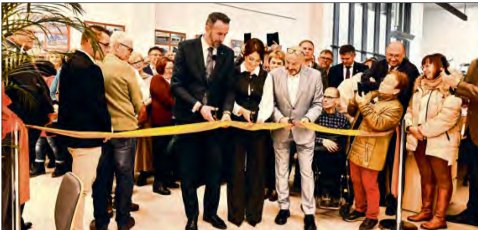
Uroczyste otwarcie biblioteki w Zdzeszowicach odbyło się 2 grudnia.

Po długim okresie przygotowań w Zdzeszowicach oficjalnie rozpoczął działalność nowoczesny obiekt kulturalny. We wtorek 2 grudnia o godzinie 12.00 przy ulicy Bolesława Chrobrego 18 nastąpiło uroczyste otwarcie nowej biblioteki. To wydarzenie, na które społeczność czekała z nadzieją, to nie tylko oddanie do użytku przestrzeni z księgozbiorem, ale także stworzenie przyjaznego, lokalnego centrum spotkań i dostępu do kultury.