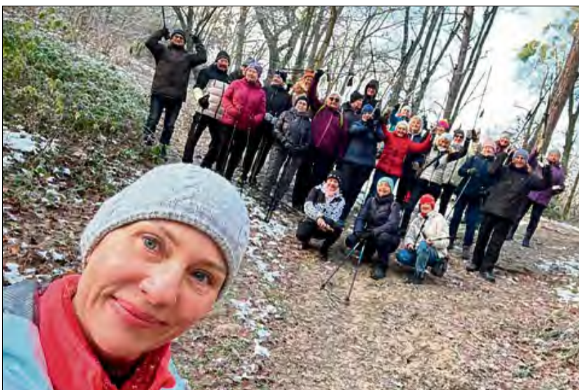
W planie dnia były gimnastyka na świeżym powietrzu, marsz dla zdrowia z najlepszą na świecie grupą przyjaciół i znajomych.

Pomysł na aktywne zakończenie wydarzenia zrealizowano w trzech odsłonach. Rozpoczęło je ożywcze spotkanie z gimnastyką na świeżym powietrzu. Następnie miłośnicy spacerów z kijkami wyruszyli na marsz dla zdrowia, ciesząc się towarzystwem – jak to sami określili – najlepszej na świecie grupy przyjaciół i znajomych. Kulminacyjnym punktem dnia było uroczyste podsumowanie całego cyklu działań, które miało miejsce w gościnnych progach Miejskiej i Gminnej Biblioteki Publicznej w Krapkowicach.