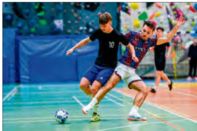
FC Young Boys (czarne koszulki) nie dało rady „Są Żermenom”.