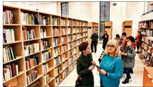
Otwarcie biblioteki w Zdzeszowicach to ważny krok w rozwoju lokalnej infrastruktury kulturalnej i spełnienie marzeń wielu mieszkańców o własnym, nowoczesnym „domu dla książek”.