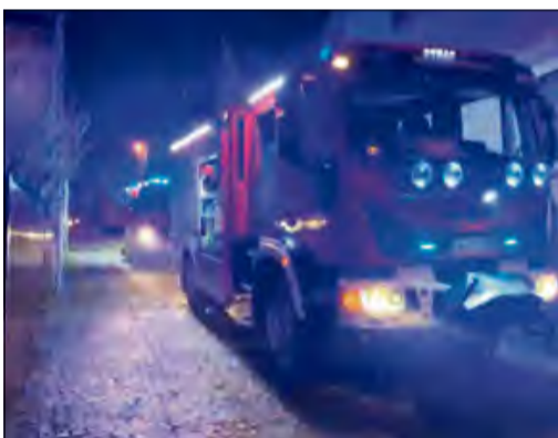
Na miejsce wezwano dwie jednostki z Ochotniczej Straży Pożarnej w Strzeleczkach.

Do zdarzenia doszło krótko po godzinie 20.45. Na miejsce wezwano dwie jednostki z Ochotniczej Straży Pożarnej w Strzeleczkach. Gdy strażacy dotarli do posesji, okna na parterze były już otwarte, a pomieszczenia częściowo przewietrzone. Kontrola wykazała jednak, że na piętrze wciąż utrzymywały się śladowe ilości tlenu