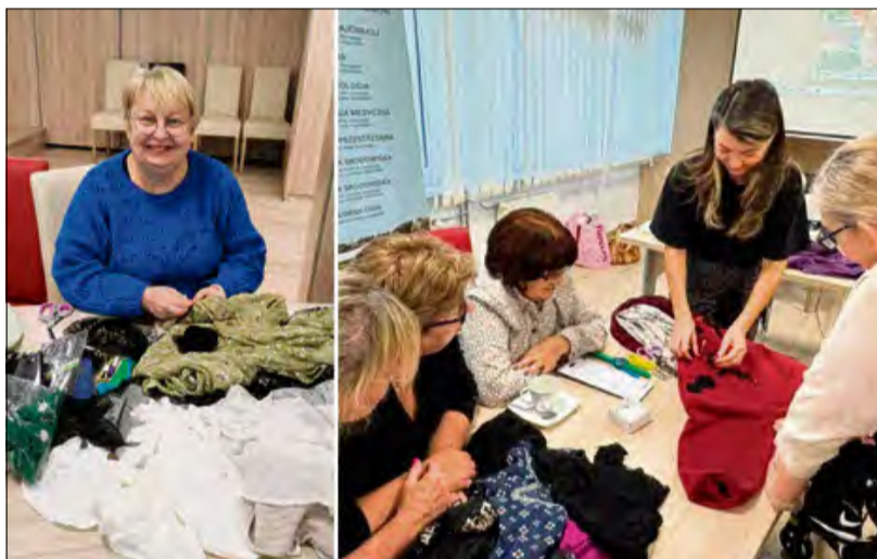
Inicjatywa pokazała, że ekologia to nie tylko teoria, ale także kreatywność i dobra zabawa, które nie mają granic wiekowych.

Niezwykle połączenie mody, ekologii i praktycznych umiejętności. Uczestnicy Uniwersytetu III Wieku w Krapkowicach wzięli udział w warsztatach „Eko Glow UP”, podczas których stare, nieużywane ubrania zyskały zupełnie nowy blask i funkcję. Pod okiem projektantki mody stworzyli unikatową odzież, dając tym samym konkretny wyraz swojej postawie proekologicznej.