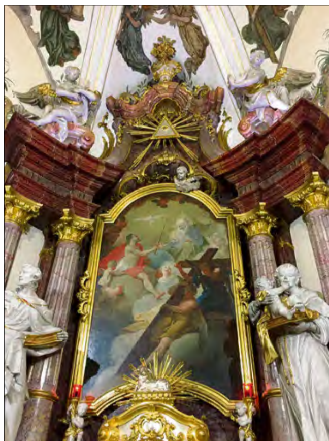
W kościele w Kujawach znajduje się jeden z najcenniejszych obrazów olejnych autorstwa Sebastiniego, datowany na 1776 rok.

Obraz umieszczony jest w bogatej, złożonej ramie o skomplikowanym, uskokowym profilu, zdobionej ornamentem i motywami rocaille (motyw dekoracyjny w postaci ornamentu charakterystyczny dla zdobnictwa architektury rokokowej. Pojawił się około 1730 i wyglądem naśladuje muszle). Można powiedzieć, że kompozycja z Kujaw jest niezwykle dynamiczna. Nieco z lewej strony, ukośnie, dwóch aniołów – jeden w