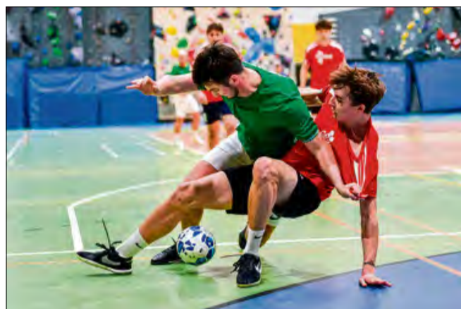
W starciu Gruszki Bruk z Hestią „iskrzyło” od początku.