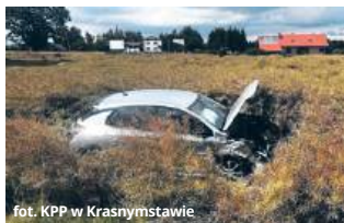
fol. KPP w Krasnymstawie

już po badaniach został zwolniony do domu. Nie miał poważnych obrażeń.