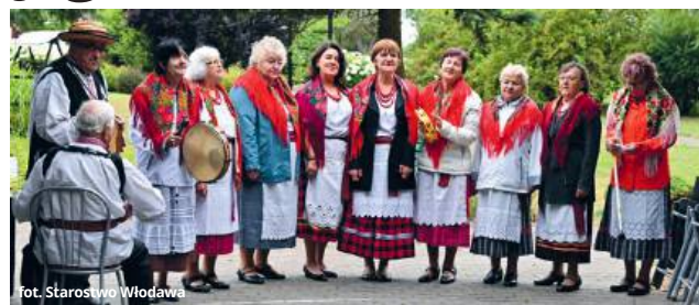
fol. Starostwo Włodawa

- Takie spotkania pokazują, jak ważna jest bliskość i wspólnota. Polityka senioralna to nie tylko liczby i inwestycje, ale przede wszystkim ludzie - powiedział starosta, dziękując