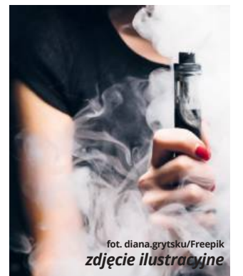
zdjęcie ilustracyjne

wana jest osobą niepełnoletnią, sprawa zostanie przekazana do sądu rodzinnego.