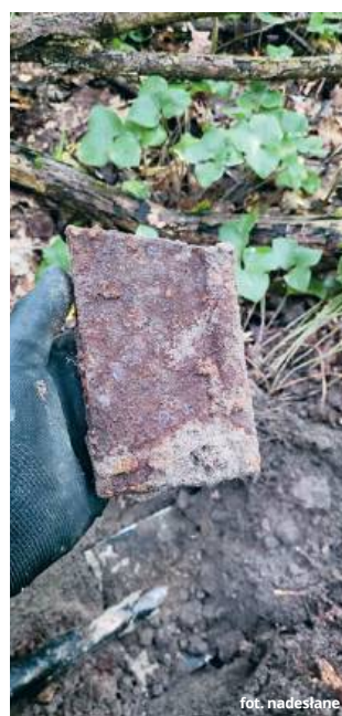
Magazynek z karabinu maszynowego Browning