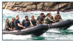
19.55 Uncharted - film przygodowy, USA, Hiszpania, 2022, reż. Ruben Fleisher, wyk. Tom Holland, Mark Wahlberg, Antonio Banderas, Sophia Ali, Tati Gabrielle, Steven Waddington