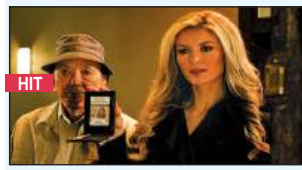
22.20 R.I.P.D. - Agenci z zaświatów - komedia sensacyjna, USA, 2013, reż. Robert Schwentke, wyk. Ryan Reynolds, Jeff Bridges, Mary Louise Parker, Kevin Bacon