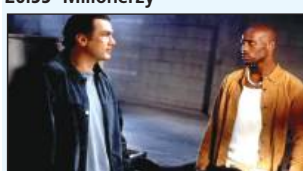
21.35 Mroczna dzielnica - film sensacyjny, USA 2001, reż. Andrzej Bartkowiak, wyk. Steven Seagal, DMX, Isaiah Washington, Anthony Anderson, Michael Jai White, Bill Duke