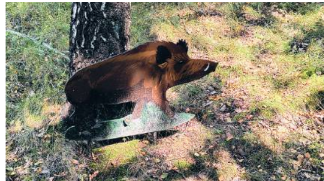
Leśną galerię udało się zorganizować w ramie starego okna

- Trzeba ocalać to, co jeszcze można ocalić. I nie mam tutaj na myśli tylko i wyłącznie przedmiotów, takich niemych świadków historii. Chciałabym ocalić coś, co ja pamiętam z życia tej wsi. Z ludzkich postaw, sposobu bycia. Wie pan, nieopodal odkopaliśmy po wielu latach taką starą studnię. Liczy 33 metry. Próbowaliśmy ją uruchomić, ale wymaga to bardziej skomplikowanych zabiegów. Pamiętam jednak, że kiedyś w Majdanie funkcjonowało siedem takich studni, a z jednej korzystało prawie dwudziestu gospodarzy. Kobieta, która przychodziła do studni po wodę, a nosiła się ją przy pomocy specjalnych nosideł na plecach, musiała iść póź-