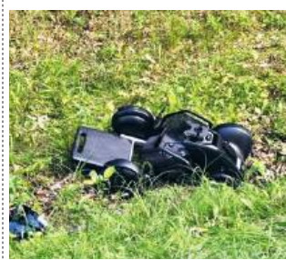
fol. KPP we Włodawie

- Na miejscu policjanci ustalili, że 22-latek z gminy Strzyżewice, kierując samochodem marki BMW, najechał na tył wózka inwalidzkiego, którym poruszał się 50-latek z gminy Cyców. Mężczyzna z obrażeniami ciała został przetransportowany do szpitala. Na szczęście nie doznał poważnych obrażeń. (apm)