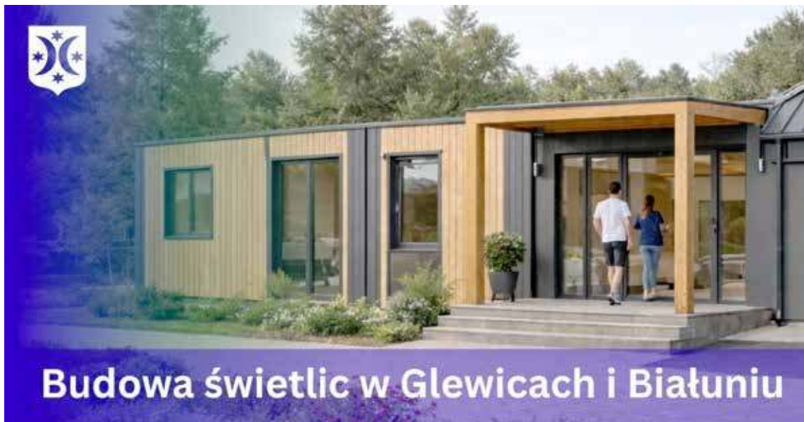
Budowa świetlic w Glewicach i Białuniu