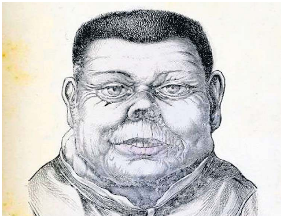
Ryciny, przedstawiające idiotów, kretynów i imbecyli były elementem podręczników akademickich. Miały pomóc m.in. nauczycielom w rozpoznawaniu rodzaju zaburzeń. Wizerunek powyżej to ilustracja AI na podstawie XIX-wiecznych grafik.