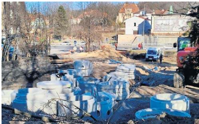
- Prace przy urządzeniu nowego parkingu powinny się zakończyć latem tego roku - zapowiedział wiceprezydent.