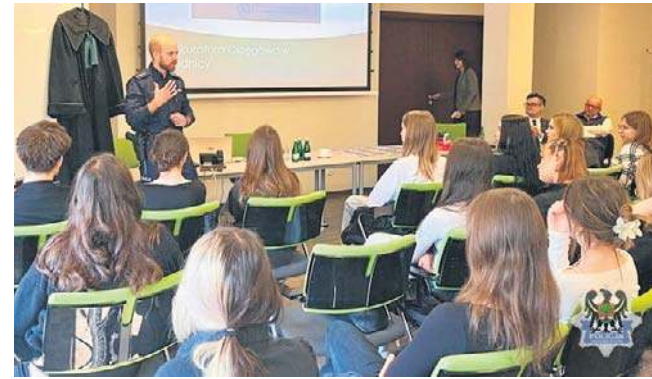
Uczniowie dowiedzieli się, jakie zadania wykonują: sędzia, prokurator, policjant oraz kurator sądowy.

Uczestniczył w nim także policjant z Komendy Miejskiej Policji w Wałbrzychu oraz trzech sędziów - z wydziału karnego i cywilnego - a także kurator sądowy do spraw nieletnich i prokurator.