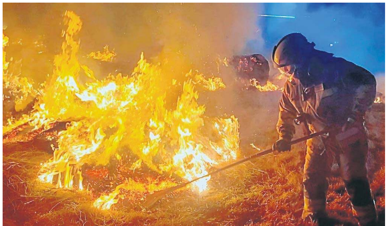
Ogień pojawia się wieczorem. Druhowie z OSP Borówno interweniowali od godz. 20.00, a z OSP Marciszów - od 19.00.