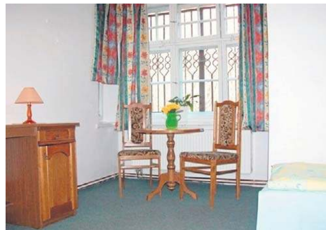
W domku wynajmowano siedem pokoi na dwóch piętrach. Można było korzystać z kuchni i ogrodu z grillem.

pem do wody i doprowadzeniem do domku rurociągu. Nie wykluczone, że trzeba będzie kuć w skale.