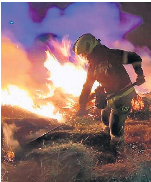
Strażacy wciąż apelują: - Wypalanie traw i ściernisk jest nielegalne, a przy tym stanowi ogromne zagrożenie!