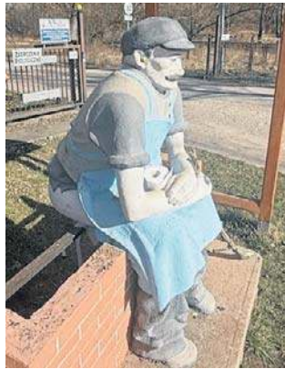
Srający Chłopek z Zawiszowa to europejski unikat.