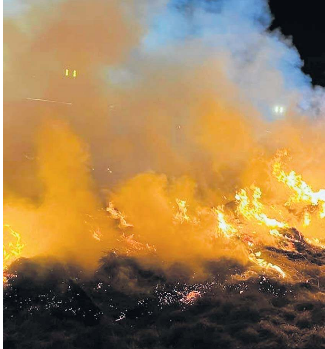
Wojewoda dolnośląska Anna Żabska bije na alarm. Od początku bieżącego roku w naszym woj