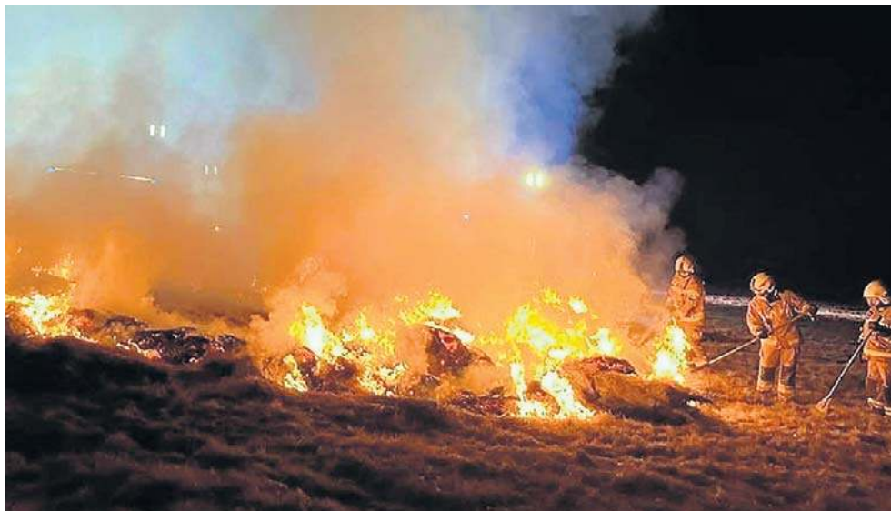
W ubiegłą sobotę z pożarami traw walczyli między innymi drzewie z OSP Borówno.