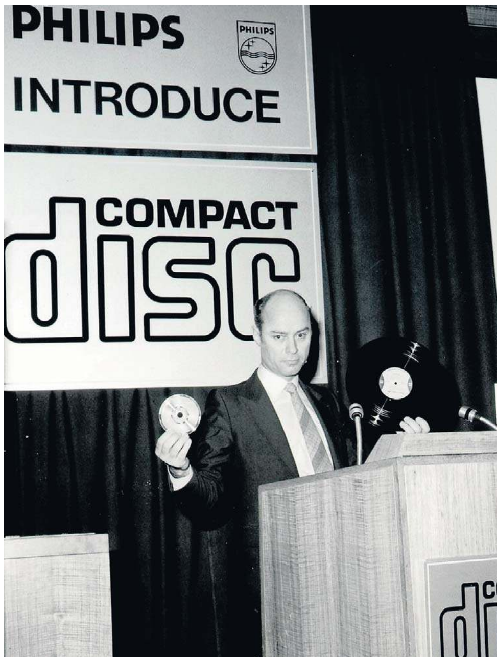
Producenci nie ukrywali, że wprowadzając na rynek odtwarzacz CD chcą zastąpić gramofon analogowy i kasetę magnetofonowe.

Na rynku USA pierwsze albumy CD kosztowały 15 dolarów (dziś to równowartość