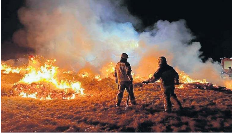
Płonące trawy są bardzo niebezpieczne. 14 marca pożary sparaliżowały ruch pociągów.