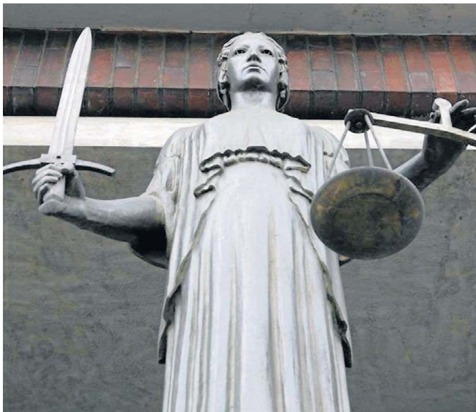
Centrum Kultury w Jedlinie-Zdroju musi zapłacić za mobbing i zwolnienie kadrowej.

- Wie pani, ja bardzo lubiłam tę pracę. Do czasu, aż pojawił się nowy dyrektor. Choć początkowo był miły, to jednak po tym, jak poszłam na zwolnienie lekarskie, bo zachorowałam na covid-19, wszystko się zmieniło. Zaczęłam na mnie krzyżać, krytykował wszystko, co