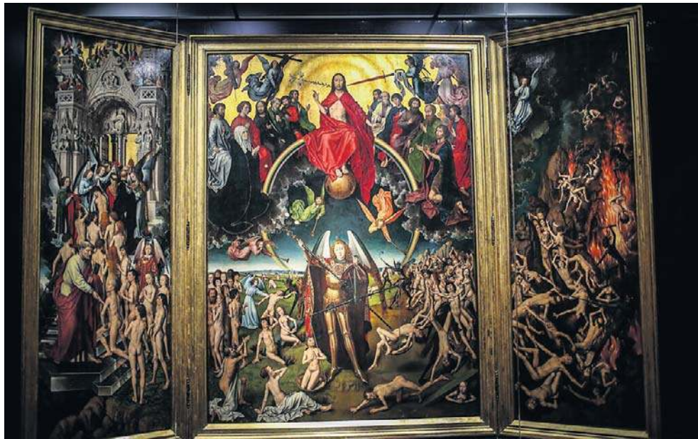
„Sąd Ostateczny” zniknął z wystawy w 2025 roku i przechodzi szczegółowe badania oraz zabiegi konserwatorskie.

Przypomnijmy: „Sąd Ostateczny” Hansa Memlinga to tryptyk tzw. ołtarzowy, namalowany na desce między 1467 a 1471 r. Obraz miał popłynąć do Florencji, ale podczas rejsu zrabowali go korsarze pod dowództwem gdańskiego kapra Pawła Beneke