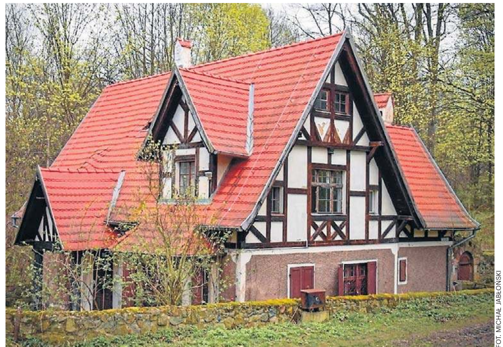
Właściciele zapewniają: - Domek nad stawem w zamku Książ znowu będzie pensjonatem.

Z tego, co ustaliliśmy nieoficjalnie, problem jest z dostę-