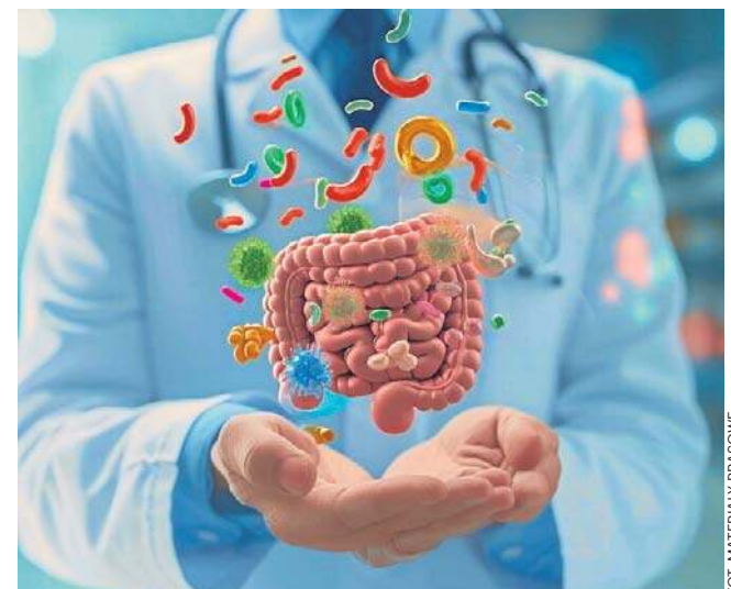
Mikrobiota jelitowa jako element układanki w leczeniu otyłości.

Poprzez popularyzację badań, szkolenia i działania medialne Instytut zachęca do refleksji nad wpływem leków na mikrobiom, promując przy tym podejście One Health oraz globalną współpracę w przeciwdziałaniu oporności na antybiotyki. ©