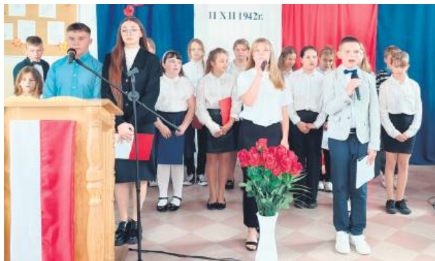
Uczniowie, absolwenci oraz nauczyciele, którzy z nimi pracowali, zebrali gromkie brawa za zaprezentowaną część artystyczną.

Pomysł nadania szkole imienia narodził się z okazji 55-lecia jej istnienia. W październiku 2024 roku Rada Pedagogiczna jednogłośnie poparła inicjatywę dyrekcji, a po konsultacjach z uczniami, rodzicami i mieszkańcami wskazano Ofiary Pacyfikacji Kitowa jako patrona szkoły.