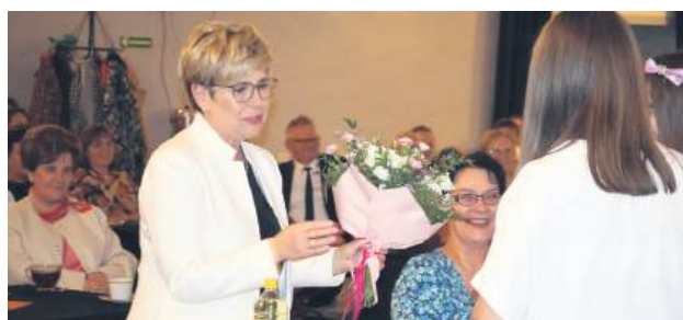
Nagrody wójta Gminy Werbkowice za szczególne osiągnięcia w oświacie otrzymały: dyrektor Szkoły Podstawowej w Werbkowicach, nauczycielka z tej samej szkoły, dyrektor Szkoły Podstawowej w Sahryniu oraz nauczycielka z Przedszkola Samorządowego „Bajka” w Werbkowicach.

Uroczystość była okazją do wyrażenia wdzięczności