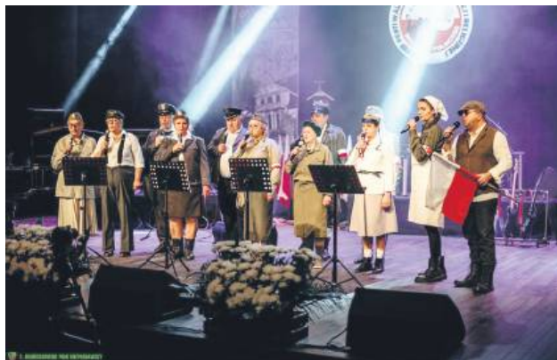
Koncert galowy ubiegłorocznej edycji festiwalu.

Program festiwalu obejmuje intensywne koncerty konkursowe (w piątek 14.11 o godz. 18:00 oraz w sobotę