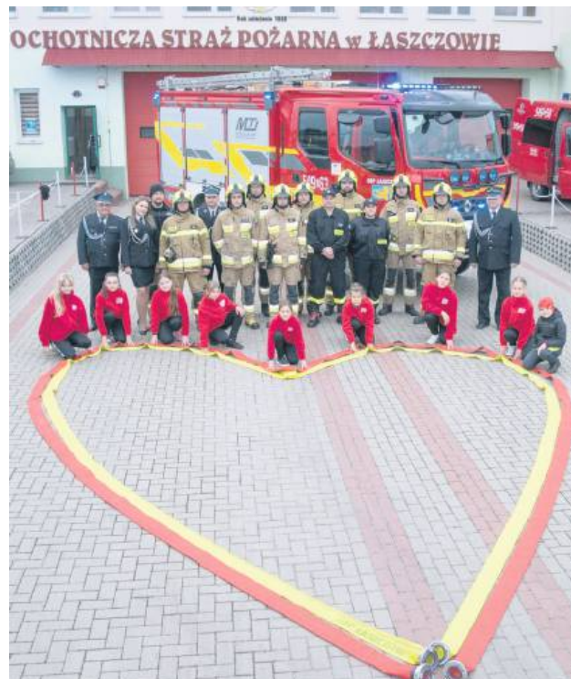
Na apel odpowiedzieli m.in. strażacy z OSP w Łaszczowie i nominowali kolejne jednostki: OSP Huta Dzierżyńska, OSP Telatyn i OSP Gródek.

jestemy z Tobą – walcz dzielnie, bo nie jesteś sama! – napisali.