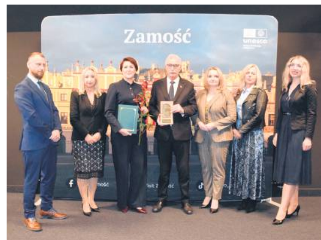
Nagroda „Roztoczan 2025” trafiła do Starostwa Powiatowego w Zamościu.

Oficjalne podsumowanie sezonu turystycznego odbyło się 15 października. Wręczono wówczas nagrodę „Roztoczan 2025”, która trafiła do Starostwa Powiatowego w Zamościu za renowację zabytkowego pałacu, w którym mieści się Sanatorium Rehabilitacyjne im. Janusza Korczaka w Krasnobrodzie oraz rozbudowę istniejącej infrastruktury.