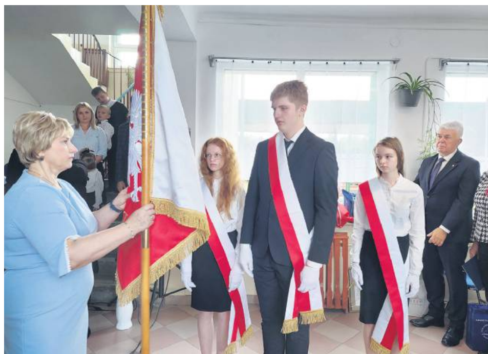
Dyrektor szkoły w Tworyczowie przekazała uczniom poświęcony wcześniej w kościele sztandar.

„Dzisiejsze święto to również radość i wzruszenie płynące z 55 lat wspólnego budowania