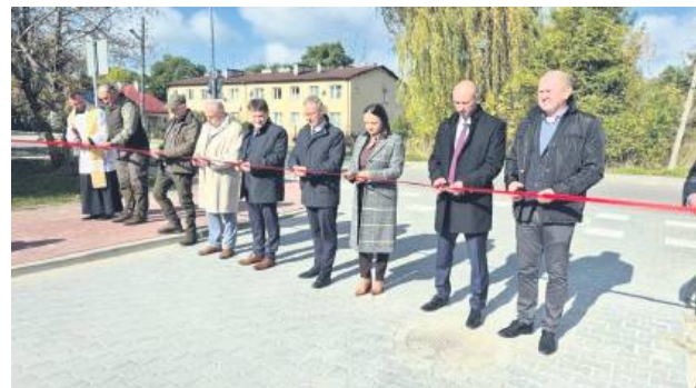
Oficjalne otwarcie nowej drogi odbyło się 15 października.