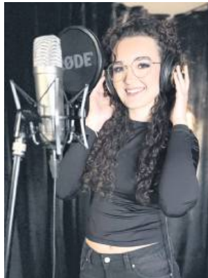
Pieśń „Był sobie król” jest już nagrana. Premiera teledysku odbędzie się w listopadzie.

P ieśń Pokoleń – warsztaty wokально-studyjne zorganizowało tomaszowskie Stowarzyszenie TRYTON. Od czterech lat wspiera ono w rozwoju artystycznym dzieci i młodzież poprzez organizację przedsięwzięć kulturalnych: warsztatów twórczych, koncertów muzycznych, a także konkursów i festiwałów. Ostatnie warsztaty Stowarzyszenia sfinansował Narodowy Instytut Wolności – Centrum Rozwoju Społeczeństwa Obywatelskiego w ramach Rządowego Programu Wspierania Organizacji Pozarządowych „Moc małych społeczności”. Odbywały się one w weekendy: 4-5 października i 11-12 października. Wśród uczestników byli zarówno najmłodsi, jak i dorośli – łącznie