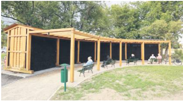
Dzięki głosom mieszkańców w ubiegłorocznym budżecie obywatelskim, w Parku Miejskim powstała tężnia solankowa.

Na osiedlu Powiatowa wygrał projekt zakładający przebudowę