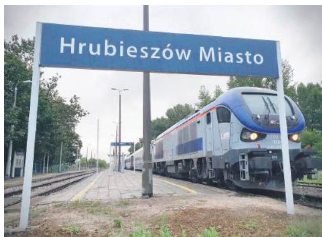
Od 2 listopada pociągi InterCity „Hetman” oraz TLK „Kasztelan” relacji Hrubieszów – Kraków pojedą zmienioną trasą, przez Leżajsk i Rzeszów.

Od 2 listopada pociągi relacji Hrubieszów – Kraków (na odcinku między Stalową Wolą a Dębicą) pojedą objazdem. Powodem wprowadzenia takiego rozwiązania jest modernizacja odcinka linii kolejowej na trasie Stalowa Wola Rozwadów – Tarnobrzeg – Padew (koło Mielca). Pociągi InterCity „Hetman” oraz TLK „Kasztelan” po wprowadzeniu tych zmian pojedą przez Leżajsk i Rzeszów, a nie przez Tarnobrzeg i Mielec, jak do tej pory. Objazd przez Leżajsk i Rzeszów skutkuje wydłuże-