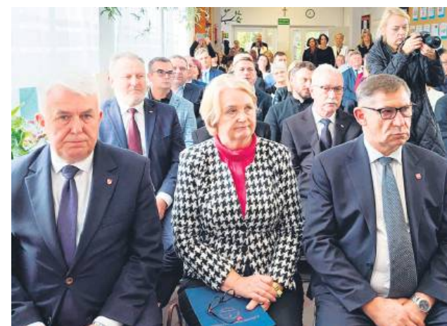
W murach szkoły zgromadzili się zaproszeni goście: przedstawiciele władz samorządowych, duchowieństwo, dyrektorzy szkół z gminy Sułów, instytucji i organizacji społecznych, absolwenci, rodzice oraz mieszkańcy.

Ostatnią częścią wydarzenia były przemówienia zaproszonych gości. Poseł na Sejm RP