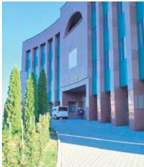
Akt oskarżenia trafił do Sądu Rejonowego w Zamościu.

24-letnia działaczka Młodzieży Wszechpolskiej w Zamościu stanie przed sądem za nawoływanie do nienawiści na tle różnic rasowych i wyznaniowych. 15 października Prokuratura Rejonowa w Hrubieszowie skierowała do Sądu Rejonowego w Zamościu akt oskarżenia. Oliwii O. grozi do 3 lat pozbawienia wolności.