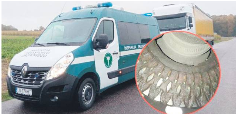
Układ oczyszczania spalin był niesprawny i wymagał natychmiastowej naprawy. Jeszcze większe zdumienie wzbudził stan układu hamulcowego naczepy.

Kierowca wpadł w sidła „krokodyli” w poniedziałek 13 października. Na drodze krajowej nr 17 w Sitańcu inspektorzy z Wojewódzkiego