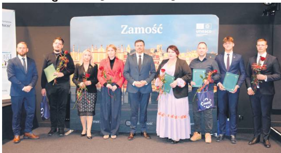
Laureaci nagród i wyróżnień.

– Bardzo się cieszę, że liczba turystów z roku na rok rośnie, ponieważ oznacza to, że po trudnym okresie pandemii odbudowujemy pozycję Zamościa na turystycznej mapie Polski. Jeśli chodzi o profil turysty – dominują rodziny z dziećmi oraz turyści indy-