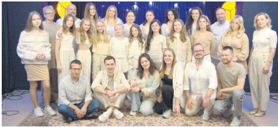
„Pieśń Pokoleń” to nie tylko muzyczny projekt, ale przede wszystkim spotkanie ludzi, których połączyła pasja, współpraca i wzajemna inspiracja.