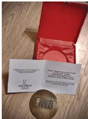
Ksiądz prałat Andrzej Puzon z Hrubieszowa otrzymał medal nadany przez Europejską Konferencję Episkopatu CCEE.

Ksiądz prałat Andrzej Puzon otrzymał medal nadany przez Europejską Konferencję Episkopatu (CCEE). Kapłan z Hrubieszowa jest pomysłodawcą i organizatorem wielokrotnej akcji pomocy rodakom za naszą wschodnią granicą.