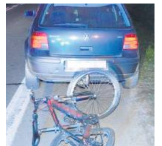
Nastolatek z obrażeniami ciała trafił do szpitala.

Tego zdarzenia można było uniknąć, gdyby tylko każdy zachowywał ostrożność i przestrzegał przepisów. Ale tak się nie stało. 14-letni rowerzysta wjechał na jezdnię bezpośrednio przed samochód. Kierująca autem nie zdążyła zahamować. Nastolatek z obrażeniami ciała trafił do szpitala.