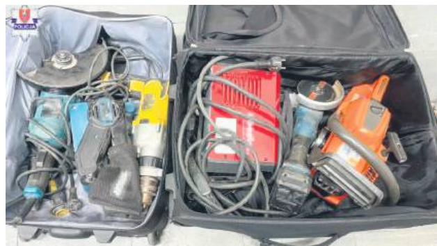
Zamojscy kryminalni odzyskali już skradzione elektronarzędzia.