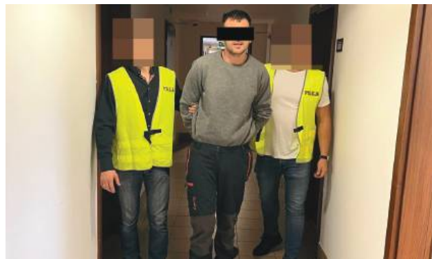
39-latek z gm. Bełzec został zatrzymany za narkotyki.