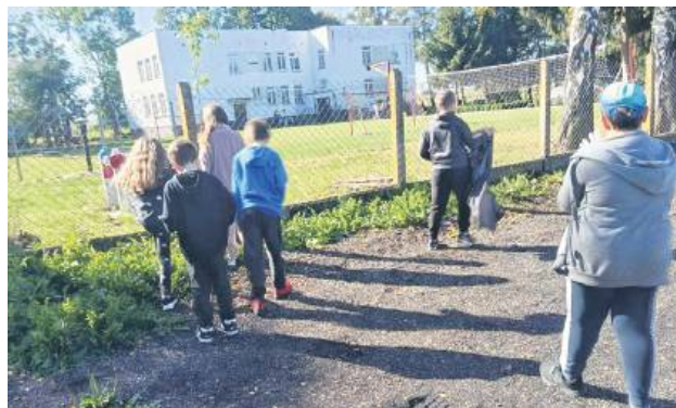
Szkoła Podstawowa w Sahryniu mieści się w budynku, który ma znacznie niższy standard niż budynek szkoły w Werbkowicach.

Ówczesna decyzja Rady Gminy Werbkowice spotkała się z oburzeniem mieszkańców Sahrynia i rodziców tamtejszych dzieci. Wtedy ich przedstawiciele interweniowali u Lubelskiego Kuratora Oświaty. Zebrali podpisy 300 mieszkańców, którzy zaprotestowali przeciwko planom likwidacji szkoły. Z tym że wtedy prognozy demograficzne nie były tak niekorzystne dla szkoły w Sahryniu, jak te na najbliższe lata.