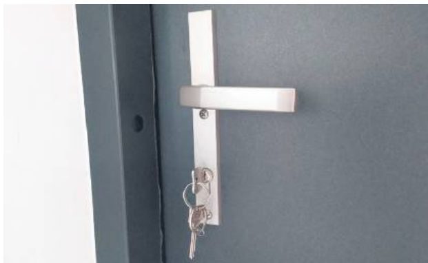
Radni dyskutowali na temat sprzedaży lokali należących do miasta.

Zwolennicy sprzedaży podkreślali, że lokale są w złym stanie technicznym i wymagają kosztownych remontów, których gmina musiałaby się podjąć w przypadku rezygnacji najemców. Zwracali uwagę, że przy obecnej sytuacji na rynku, gdzie coraz więcej działalności przenosi się do internetu, znalezienie nowych dzierżawców mogłoby być trudne, a pustostany generowałyby wyłącznie straty. Wskazywano również, że okres zwrotu wartości lokali z czynszów najmu wyniósłby od jedenasto do nawet dwudziestu lat, i to bez uwzględnienia kosztów remontowych. Tymczasem obecni użyt-