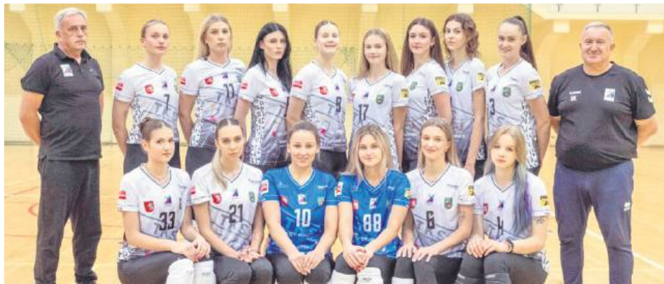
Fot. Facebook (TKS Tomasovia – drużyna siatkarek)

Związek tak ułożył terminarz rozgrywek, że w dwóch pierwszych kolejkach Tomasovia musiała grać na wyjazdach. Na inaugurację sezonu drużyna z Tomaszowa Lub. wygrała w Kętach z tamtejszym Kęczaninem 3:1 (17:25, 25:20, 25:15, 25:23). Spotkanie zaplanowane było na godz. 18, a rozpoczęło się dopiero o 19.10. A to dlatego, że awarii uległ autobus, którym do Kęt wyprawiła się tomaszowska ekipa. – Szybko musieliśmy zorganizować zastępczy środek transportu. Spóźniliśmy się na mecz, ale jakoś udało nam się zebrać do kupy. Chwała za to naszym dziewczynom. Słowa uznania należą się też drużynie z Kęt, która nie musiała czekać na nasz przyjazd, a mogła otrzymać zwycięstwo walkowerem. Gospodynie tego meczu postąpiły jednak