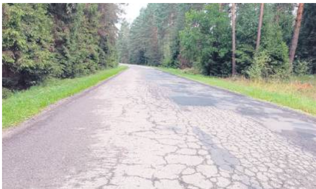
Droga jest w fatalnym stanie.

W Lubelskim Urzędzie Wojewódzkim podpisana została umowa na realizację niezwykle ważnej dla lokalnej społeczności inwestycji – przebudowę drogi powiatowej na odcinku Tereszpól-Zaorenda – Bukownica. To bardzo istotne przedsięwzięcie dla mieszkańców regionu.