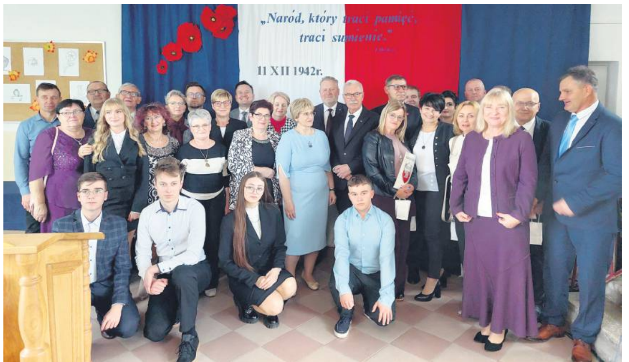
Pamiętkowe zdjęcie po uroczystości.