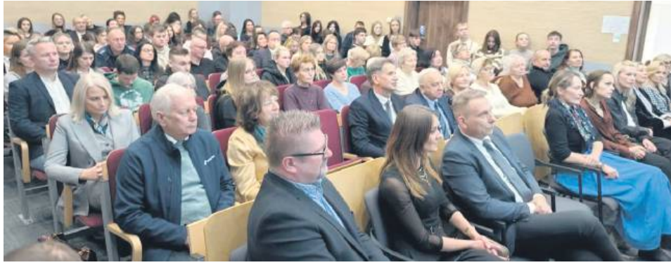
Spotkanie zgromadziło przedstawicieli środowisk prawniczych, edukacyjnych i samorządowych.