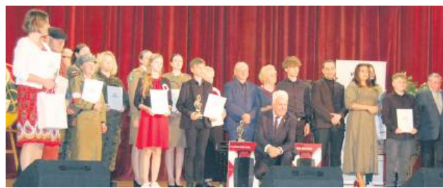
Na scenie występowały zarówno soliści, jak i zespoły.