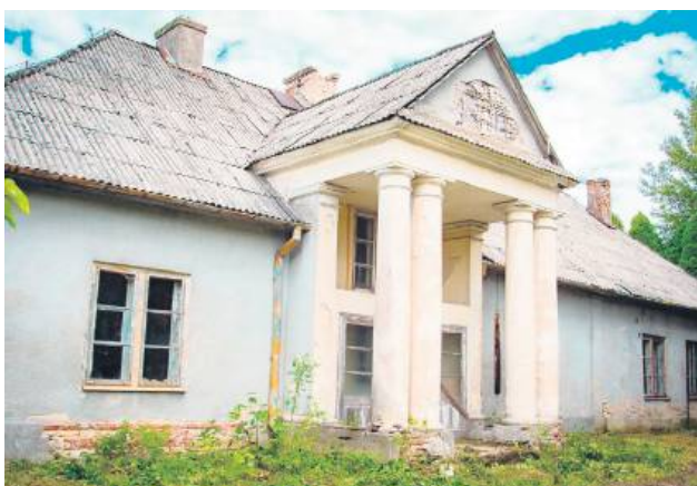
Dwór w Panasówce to jedyny zabytek na terenie gminy.

Przetrwiał wiekowe burze historii i lata zapomnienia – dziś znów ma szansę odzyskać dawny blask. Zabytkowy dwór w Panasówce, przez lata pozostający w rękach prywatnych, ponownie stał się własnością gminy Tereszpól. Samorząd rozpoczął działania zmierzające do jego zabezpieczenia i odnowy, by w przyszłości obiekt mógł służyć mieszkańcom i turystom.