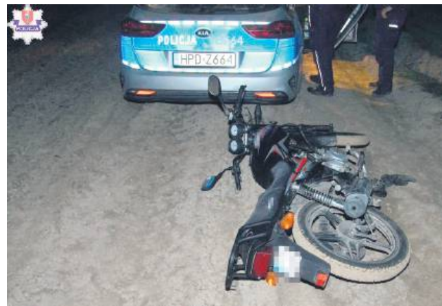
Motorowerzysta bez uprawnień próbował uniknąć policyjnej kontroli. Skończyło się to nie najlepiej zarówno dla niego, jak i dla jego ojca.

W nocy 15 października policjanci z Miączyna, patrolując gminę Sitno, zauważyli jadącego drogą motorowerzystę. Postanowili zatrzymać go do kontroli drogowej. Wydali kierującemu sygnały do zatrzymania, jednak on nie zareagował.