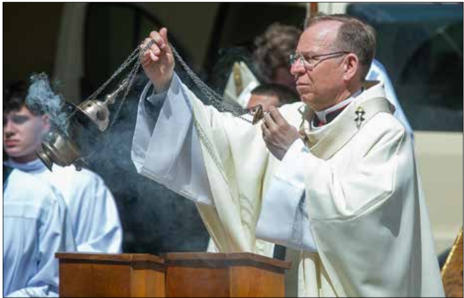
Metropolitą wileński abp. Gintarase Grušas podczas liturgii rozpoczynającej VI Światowy Apostolski Kongres Miłosierdzia

O tak! Myślę, że potrzebujemy spotkania wszystkich miast, które zostały w szczególny sposób dotknięte łaską Bożą i charyzmatem miłosierdzia. Oczywiście jest wśród nich Wilno, ale także Kraków czy Płock. Są też