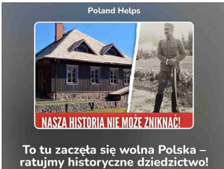
■ Graf. zw.lt

Według organizatorów roczne koszty utrzymania kompleksu przekraczają 200 tys. zł, czyli ok. 47,1 tys. euro. Do tej pory działalność obiektu była wspierana ze środków publicznych, jednak