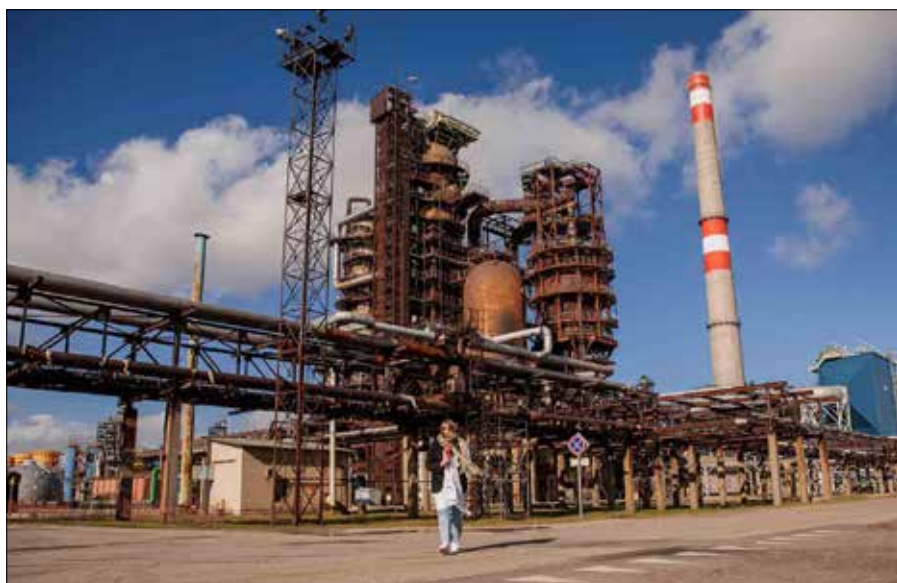
Coraz częściej odbiorca trafia do naszych treści przez telefon komórkowy — mówi Anna Grigoit