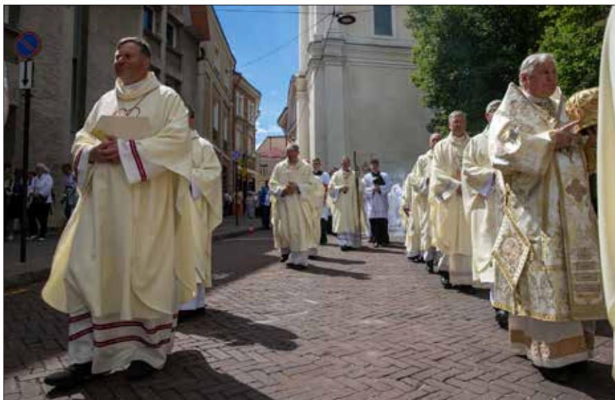
Połączenie refleksji, modlitwy i spotkania sprawia, że Kongres staje się żywym doświadczeniem wiary

Dopełnieniem tych refleksji stało się poruszające świadectwo jednego z prowadzących Kongres — młodego