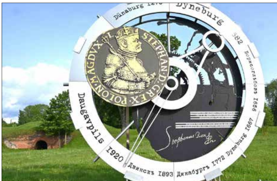
Pomnik upamiętniający postać Stefana Batorego i nadanie Dyneburgowi praw miejskich, usytuowany jest nieopodal Twierdzy

Tak, byłem tu wcześniej prywatnie, turystycznie, jeszcze w czasie