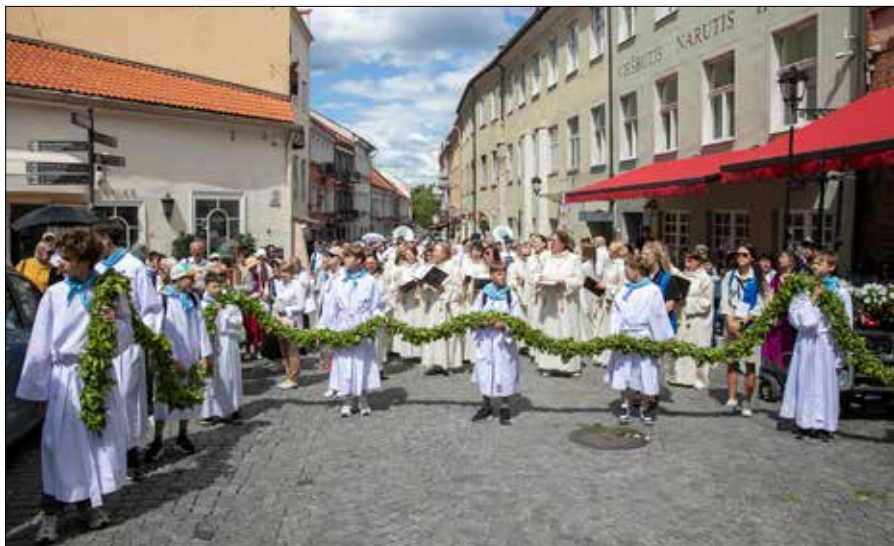
Program wydarzenia harmonijnie łączy liturgię, modlitwę, nauczanie, świadectwo oraz budowanie wspólnoty

Znaczną część swojego wystąpienia kardynał poświęcił historycznym przykładom poka-