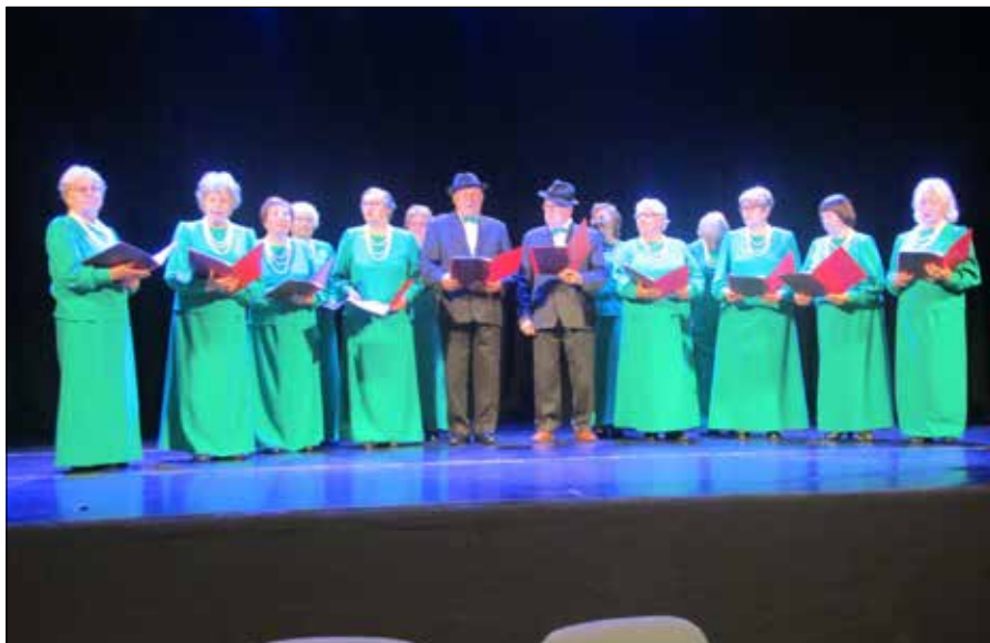
Śpiewa zespół klubu seniorów Złoty Wiek z Rudominy

Po wykładzie obejrziliśmy film o ceremonii otwarcia sesji parlamentarnej w Wielkiej Brytanii. To uroczyste wydarzenie z udziałem monarchy. Król lub królowa przybywa do pałacu i wygłasza w Izbie Lordów „Mowę tronową”, w której są przedstawione plany rządu na nową sesję parlamentarną. Ceremonii towarzyszą tradycyjne rytuały, historyczne stroje oraz