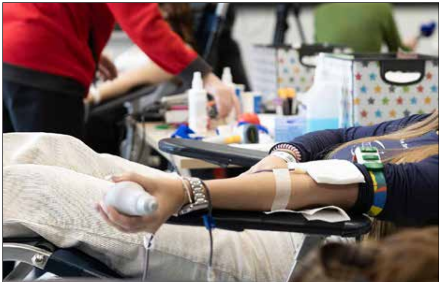
Krwiodawstwo pozostaje jedną z najprostszych form ratowania życia

Najważniejszą motywacją dawców jest chęć niesienia pomocy innym. To