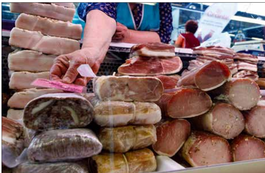
Zanieczyszczona bakterią Salmonelli żywność zazwyczaj wygląda zupełnie normalnie, świeżo i wydaje się, że nadaje się do spożycia

Jednym z głównych czynników ryzyka przedostania się bakterii do warzyw podczas ich wzrostu jest nawadnianie z użyciem wody zanieczyszczonej ściekami rolniczymi. Bezpośrednio przenosić bakterie na dojrzewające jagody, owoce lub