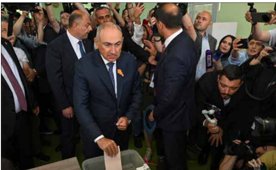
■ Paszynian zapowiedział kontynuację zbliżenia do państw zachodnich

– Ze względu na wielkość kraju, skalę zniszczeń wojennych oraz ogromne potrzeby rozwojowe Ukraina stałaby się jednym z głównych beneficjentów funduszy unijnych. Oznaczałoby to konieczność istotnego przeorganizowania budżetu UE i mogłoby prowadzić do ograniczenia części środków kierowanych obecnie do państw Europy Środkowo-Wschodniej, w tym także do Litwy – ocenia Kęstutis Girnius. Girnius podkreśla jednocześnie, że taki scenar-