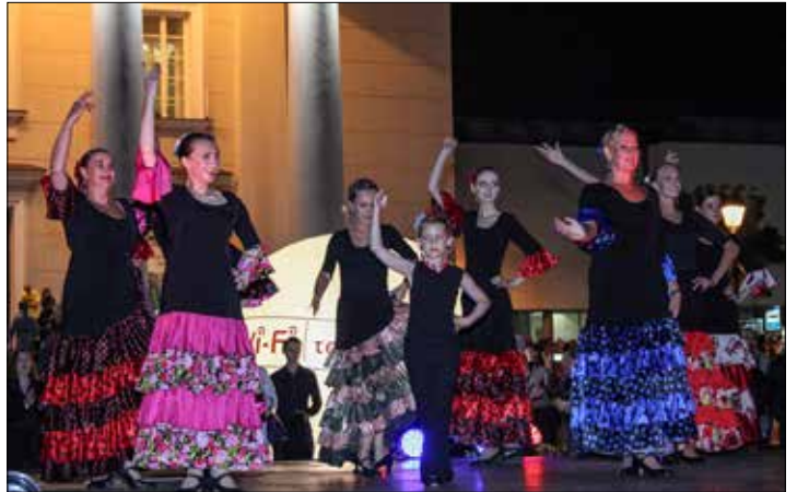
Program festiwalu Noc Kultury 2026 obejmuje ponad sto bezpłatnych wydarzeń odbywających się w różnych miejscach Wilna

– To eksperymentalna przestrzeń, w której połączy się moda, design, inicjatywy kreatywne i kultura miejska. Po raz pierwszy włączamy ten format do programu festiwa-