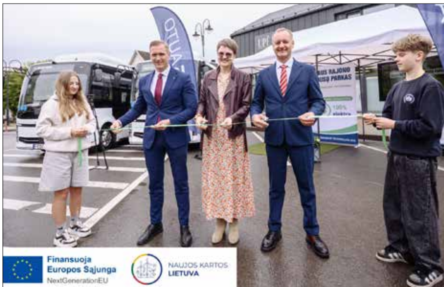
Uroczyste otwarcie nowej floty autobusowej oraz infrastruktury ładowania w Niemenczynie

Nowe, niskopodłogowe autobusy ułatwią podróż seniorom, osobom z niepełnosprawnościami oraz rodzinom z wózkami dziecięcymi. Wnętrza wyposażono w wygodniejsze fotele, nowoczesne systemy ogrzewania i wenty-