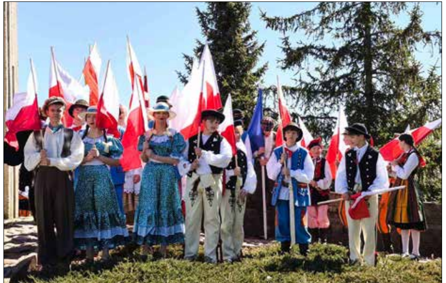
Tegoroczny Marsz Polonii zakończony pod pomnikiem i krzyżem upamiętniającym polskich legionistów