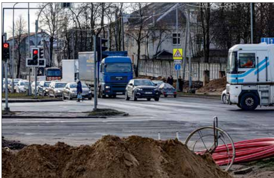
Lipówka jest uznawana za priorytetowy kierunek rozwoju miasta

W drugiej połowie XX w. na obrzeżach Helsinek i Sztokholmu zaczęto tworzyć miasteczka technologiczne, naukowe i biznesowe, które z czasem stały się ważnymi centrami innowacji i motorami wzrostu gospodarczego. Kierowano się prostą logiką — w centrach miast brakowało przestrzeni, a rozwijające się ekosystemy potrzebowały większych terenów oraz bardziej elastycznego planowania. Przez kolejne dekady obszary te przekształciły się w tętniące życiem dzielnice skupiające biznes, naukę, usługi i zabudowę mieszkaniową. Dziś