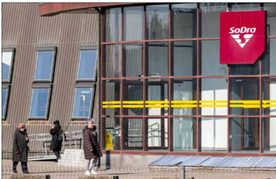
Od lipca trudniej będzie ponownie uzyskać zasiłek dla bezrobotnych

„Widzimy pewne istotne momenty, które będą w większym stopniu odzwierciedlać zasadę solidarności: aby otrzymać świadczenie, trzeba opłacać składki” – po-