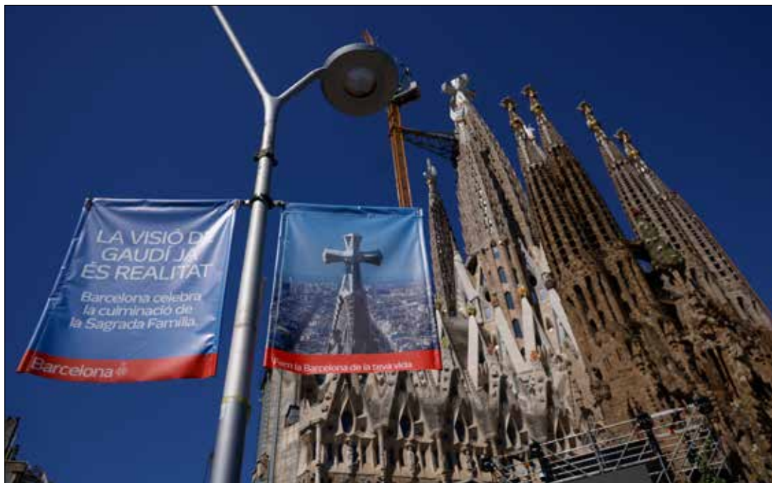
Katedra św. Rodziny w Barcelonie którą poświęcił podczas swojej pielgrzymki papież Leon XIV