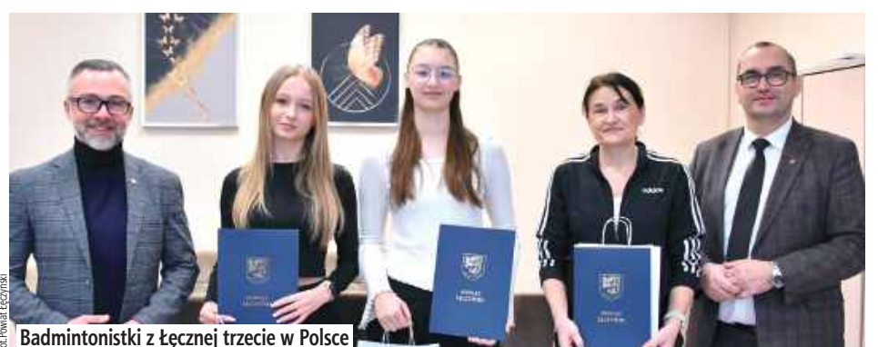
Badmintonistki z Łęcznej trzecie w Polsce