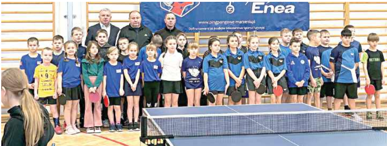
Pamiętkowe zdjęcie uczestników zmagania

Pierwsza niedziela nowego roku przyniosła wiele sportowych emocji i powodów do dumy dla lokalnego środowiska tenisa stołowego.