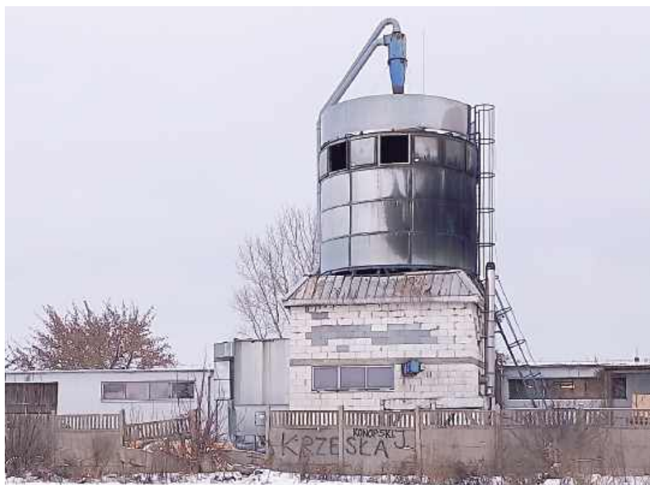
W miniony piątek w Dęblinie przy ulicy Towarowej doszło do groźnego pożaru na terenie jednego z zakładów produkcyjnych. Ogień objął trociny zgromadzone w silosie technologicznym

Trociny jako materiał łatwopalny stwarzają ryzyko długotrwałego tlenia się oraz ponownego zapłonu. Strażacy prowadzili intensywne działania gaśnicze oraz zabezpieczające, kontrolując temperaturę i stabilność konstrukcji silosu.