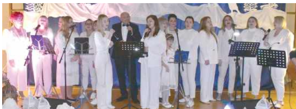
Przed publicznością zaprezentowali się: rodzice, absolwenci „Trójki” oraz zaproszeni goście