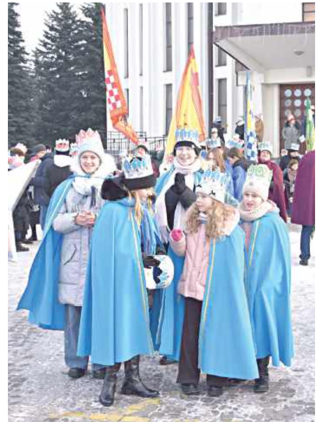
Orszak i koncert kołód w Dęblinie 2026

W Dęblinie we wtorek, 6 stycznia odbyły się obchody związane z Orszakiem Trzech Króli.