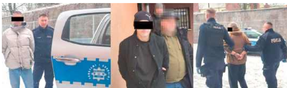
Mieszkańcy powiatu puławskiego w wieku 30, 44 i 53 lat trzy najbliższe miesiące spędzą w areszcie