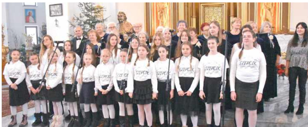
Na scenie zaprezentowali się soliści oraz zespoły wokalne „Szepcik”, „Szept” i „Jesienna Róża”, tworząc wyjątkowe, wielogłosowe i międzypokoleniowe kolędowanie

W kościele Chrystusa Miłosiernego w Dęblinie odbył się tegoroczny Koncert Noworoczny „Kolędy i Pastorałki”.