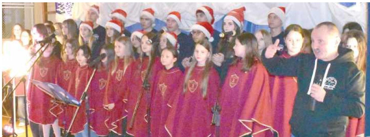
Chórek szkolny „Trójki” oraz zespół Dywizjon z Liceum Lotniczego w Dęblinie