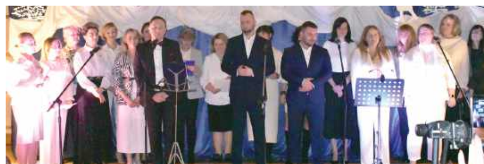
Na scenie pojawił się zespół złożony z: dyrektora, nauczycieli oraz pracowników Zespołu Szkolno-Przedszkolnego nr 3 w Dęblinie

W miniony piątek Zespół Szkolno-Przedszkolny nr 3 w Dęblinie gościł publiczność na wyjątkowym Koncercie Noworocznym, który wprowadził uczestników w magiczny nastrój pierwszych dni nowego roku. Wydarzenie zgromadziło uczniów, nauczycieli, rodziców oraz zaproszonych artystów, tworząc niezapomniane chwile pełne muzyki, wzruszeń i wspólnej radości.