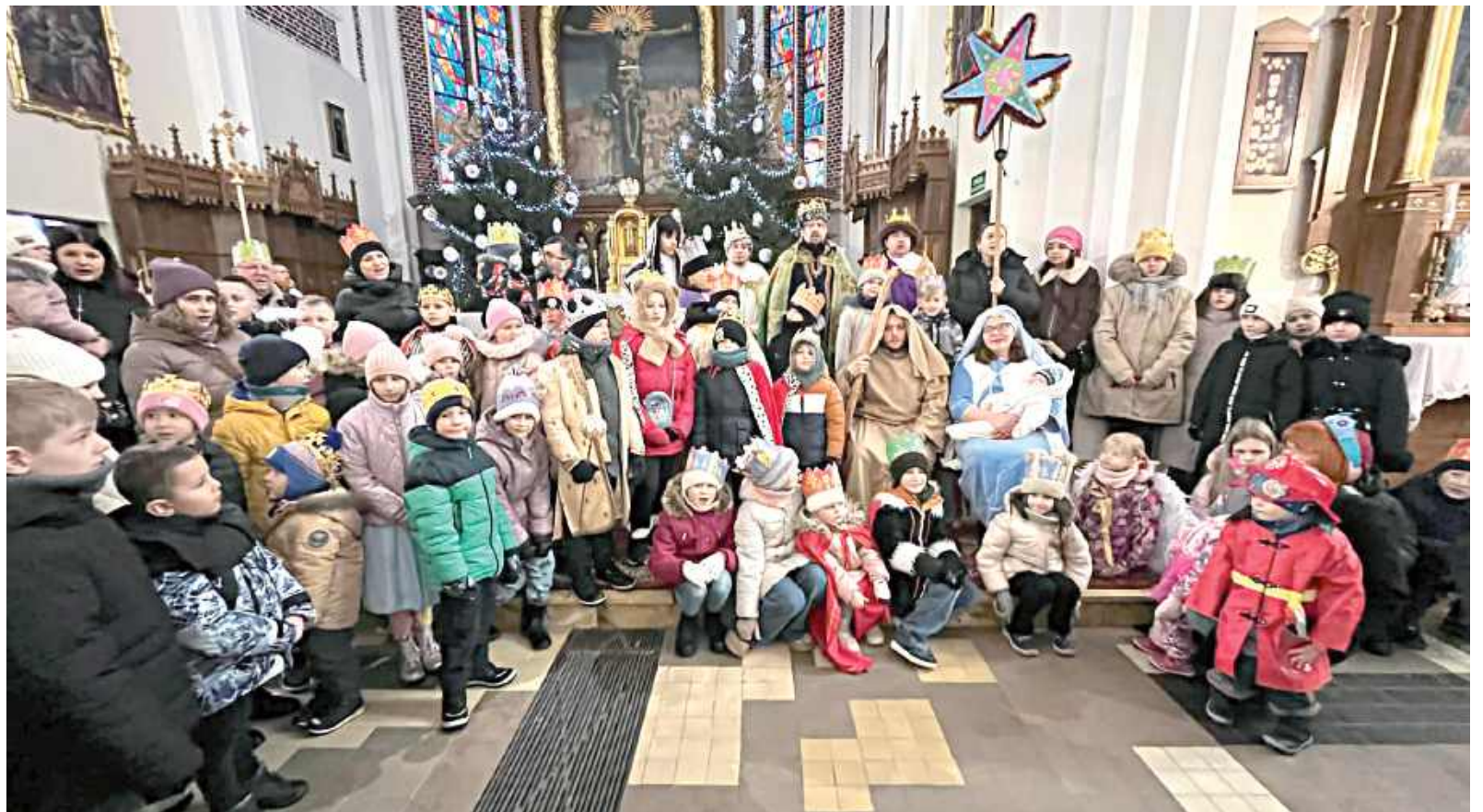
Orszak Trzech Króli w Rykach 2026