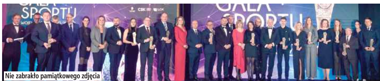
Nie zabrakło pamiątkowego zdjęcia

Za nami IV Gala Sportu Województwa Lubelskiego. Sportowcem roku została Aleksandra Mirosław.