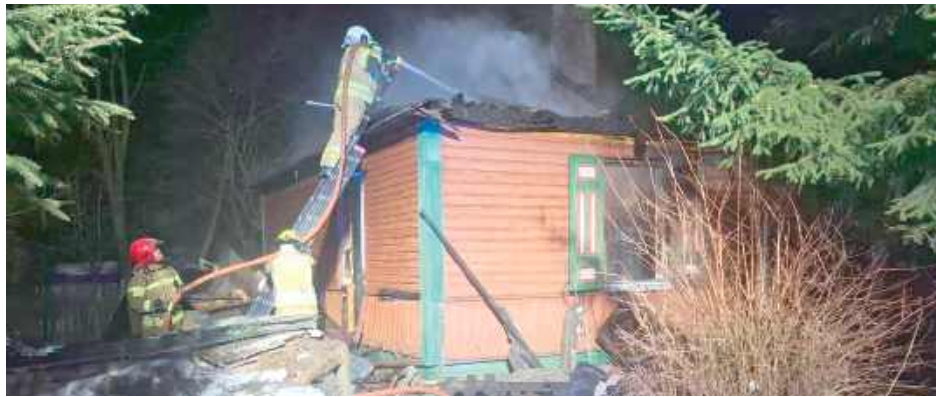
Drewniany dom spłonął doszczętnie. Czego nie strawił ogień, zostało zalane wodą podczas akcji gaśniczej

Po przybyciu na miejsce zdarzenia strażacy zastali pożar domu jednorodzinnego drewnianego, jednokondygnacyjnego. W pożarze poszkodowana została właścicielka, która doznała poparzeń przy próbie samodzielnego gaszenia pożaru - informuje bryg. Emil Głogowski, rzecznik prasowy Komendy Powiatowej Państwowej Straży Pożarnej w Puławach.