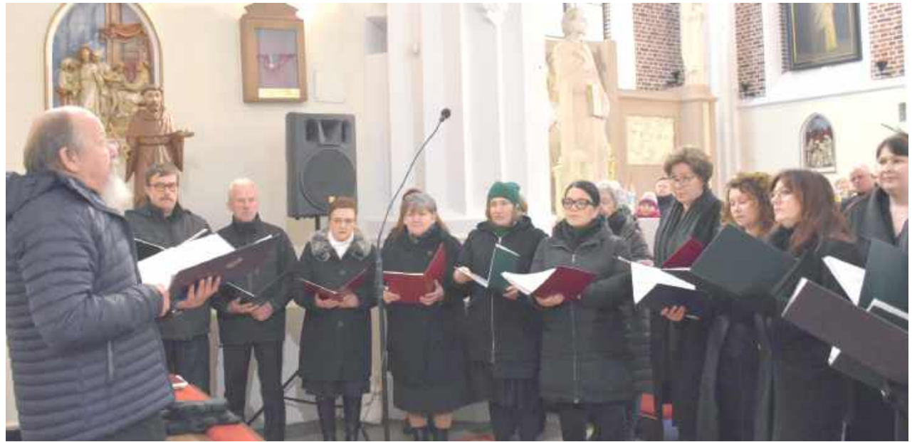
Wydarzenie było ważnym elementem kulturalnym i duchowym, łączącym wspólne przeżywanie muzyki sakralnej