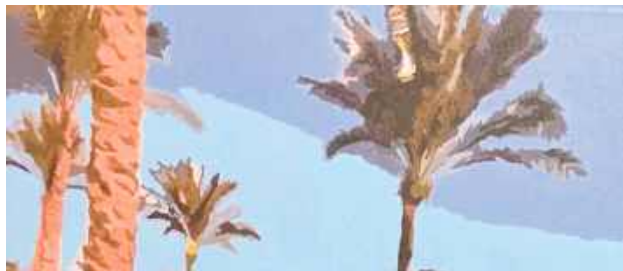
Oto część obrazu. Czy to może Ty zgubiłaś/zgubiłeś obraz?

Chodzi o malowany obraz przedstawiający młodą parę w czułym uścisku, w chwili pocałunku. Już na pierwszy rzut oka widać, że nie jest to zwykła dekoracja. Styl wykonania oraz