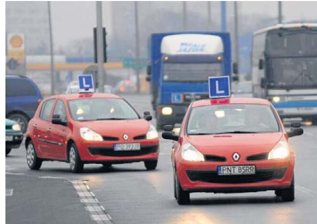
Najmniej za OC w 2026 roku płacą właściciele Renault Clio (średnio 602 zł)

Jeśli kierowca świadomie poda nieprawdziwy adres by obniżyć składkę, ubezpieczyciel może to później zweryfikować, szczególnie po kolizji lub wypadku. Firmy analizują wtedy m.in. miejsce zgłoszonych szkód, dane z CEPIK, adres korespon-