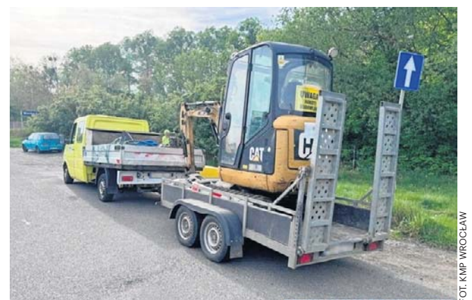
Policjanci od razu wyculi, że coś się nie zgadza. 46-latek pokazał podrobione, ukraińskie prawo jazdy.

Policjanci byli jednak pewni, że dokument jest podrobiony. Okazało się również, że mężczyzna nie miał uprawnień do kierowania zestawem pojazdów. Teraz sprawą zajmie się sąd. Za posługiwanie się podrobionym dokumentem grozi nawet 5 lat więzienia. ©