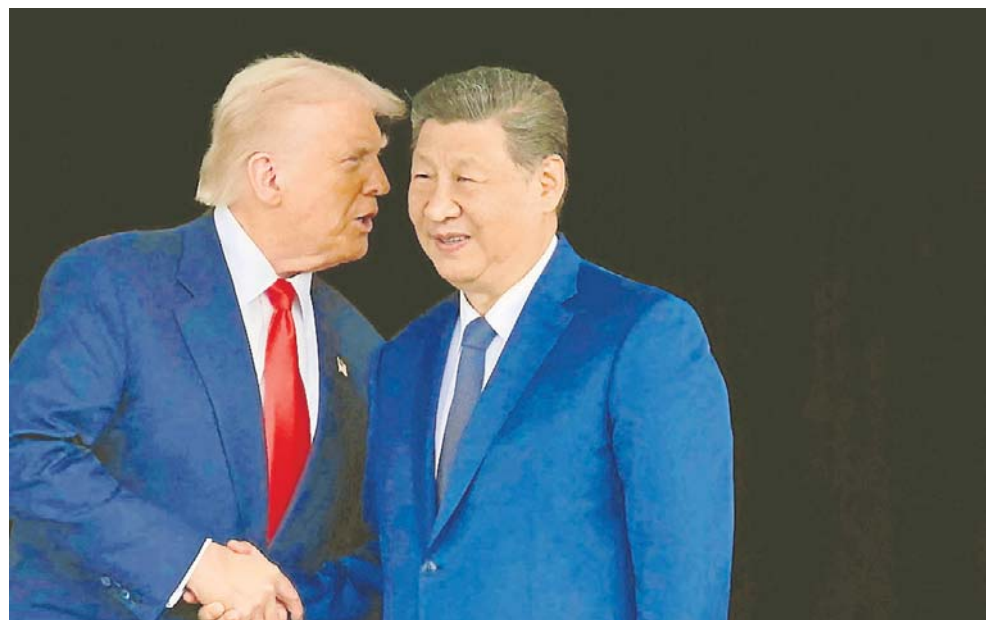
Przywódcy USA i Chin podczas ostatniego spotkania w październiku 2025 roku w Korei Południowej