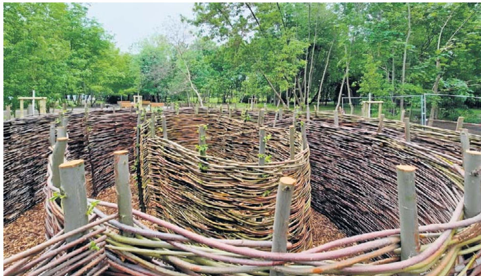
Wiklinowy labirynt dla dzieci będzie jedną z większych atrakcji parku.