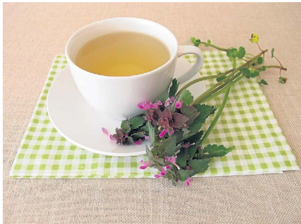
Jasnota purpurowa to cenny surowiec zielarski. Herbatka z jasnoty łagodzi objawy przeziębienia, wzmacnia organizm, ma też m.in. działanie moczopędne, antybakteryjne czy przeciwbólowe. Ten leczniczy chwast rośnie właśnie na potęgę

Dla większości osób jasnota purpurowa to ciężki do wypełnienia chwast. Jednak warto wiedzieć, że stanowi ona również cenny surowiec zielarski, który wspomaga leczenie wielu dolegliwości. Kwiaty jasnoty purpurowej to znakomite źródło kwasów fenolowych, w tym kwasu cynamonowego, rozmarynowego i kumarynowego. Dodatkowo znajdziemy w nich olejki eteryczne, saponiny, śluzę, garbniki, cholinę oraz flawonoidy - rutynę i kwercetynę. Zieleńki jasnoty stanowią również bogactwo witaminy C i beta-karotenu.