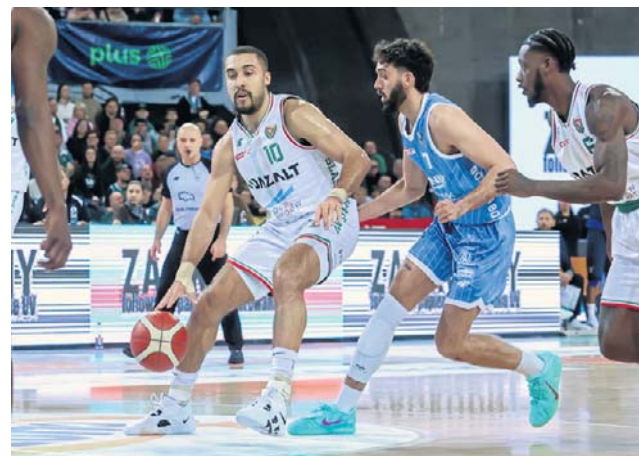
WKS Śląsk Wrocław dwa pierwsze mecze fazy play-off rozegra w Hali Orbita. Pierwsze spotkanie z Arką już dziś

WKS w ostatnim czasie musiał gasić pożar, po tym jak za-