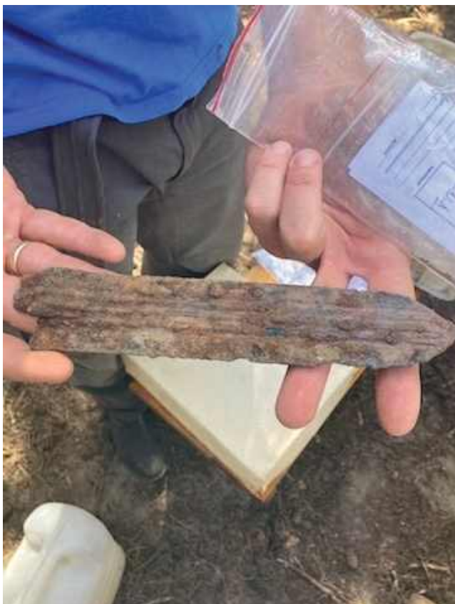
Fragment żelaznego miecza