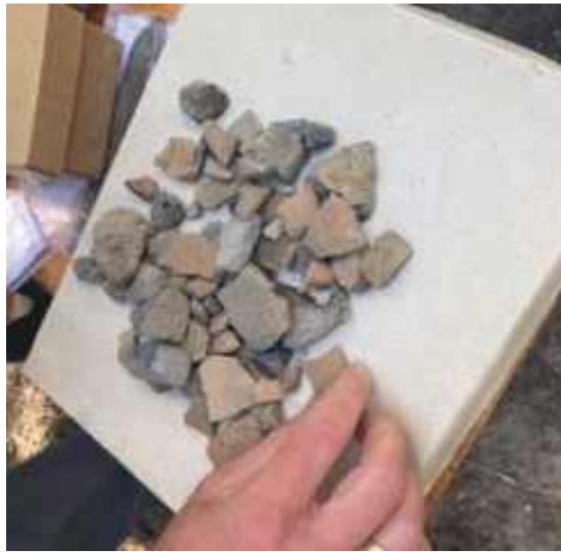
Fragmenty naczyń, być może po prochach zmarłych

W.O.: Wszystko wskazuje, że wykopaliska pochodzą z cmentarzyska kultury przeworskiej. Zostało ono w Janówku Pierwszym odkryte dość dawno. O ile się nie mylę, to w latach 70-tych XX w. Obok było cmentarzysko kultury przeworskiej. Miejsce znaleziska nie jest więc zaskoczeniem.