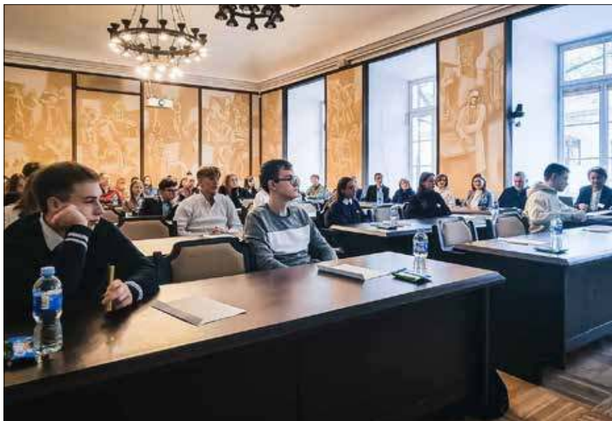
W części pisemnej olimpiady uczestniczyło 28 uczniów szkół polskich z Wilna i Wileńszczyzny