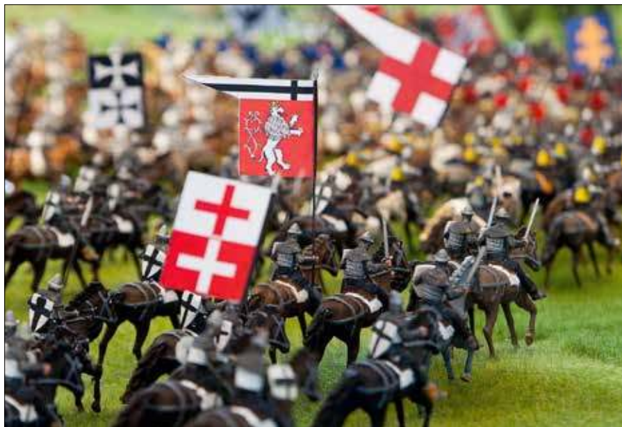
Konsekwencją koronacji Jagiełły było zwycięstwo polsko-litewskie pod Grunwaldem (na zdj. fragment makiety bitwy)