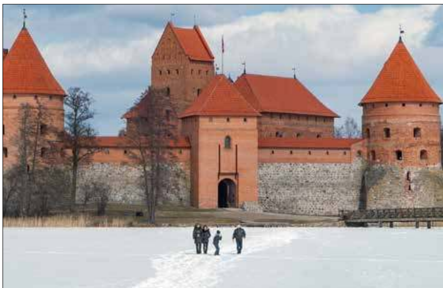
Dla jednej osoby stosunkowo bezpieczny jest lód o grubości 7-10 cm, natomiast dla grupy ludzi — od 12 cm

Trzeba szeroko opierać ręce o krawędź lodu, czołgać się poziomo i używać kolców. Po wydostaniu się nie należy wstawać od razu — bezpieczniej jest sturlać się lub przesunąć kilka metrów od przerębli, a dopiero potem wstać i wracać tą samą drogą. Po zdarzeniu należy jak najszybciej się ogrzać, zmienić mokre ubrania, a w przypadku drżenia, osłabienia, dezorientacji lub senności — wezwać pomoc. ■