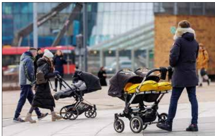
Pomysł zakłada przyznanie państwowej emerytury matkom lub ojcom, którzy wychowali troje lub więcej dzieci