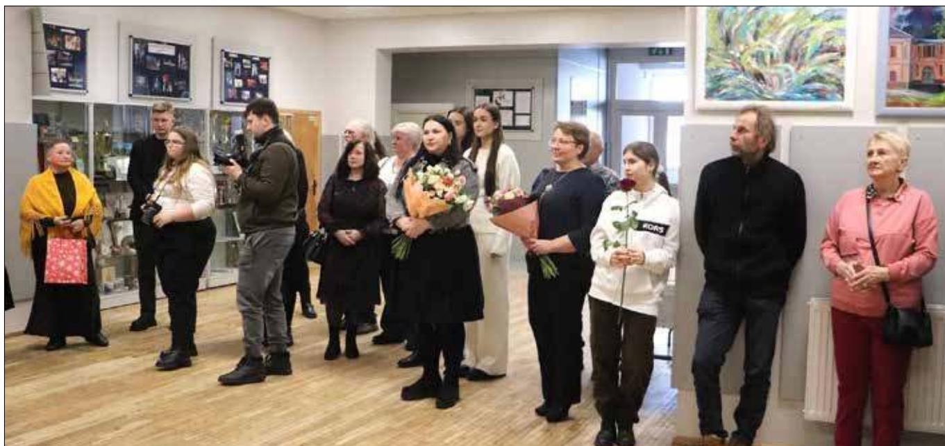
W wydarzeniu wzięli udział malarze, których obrazy zostały zaprezentowane na wystawie

Inf. i fot.: Centrum Kultury w Rudominie