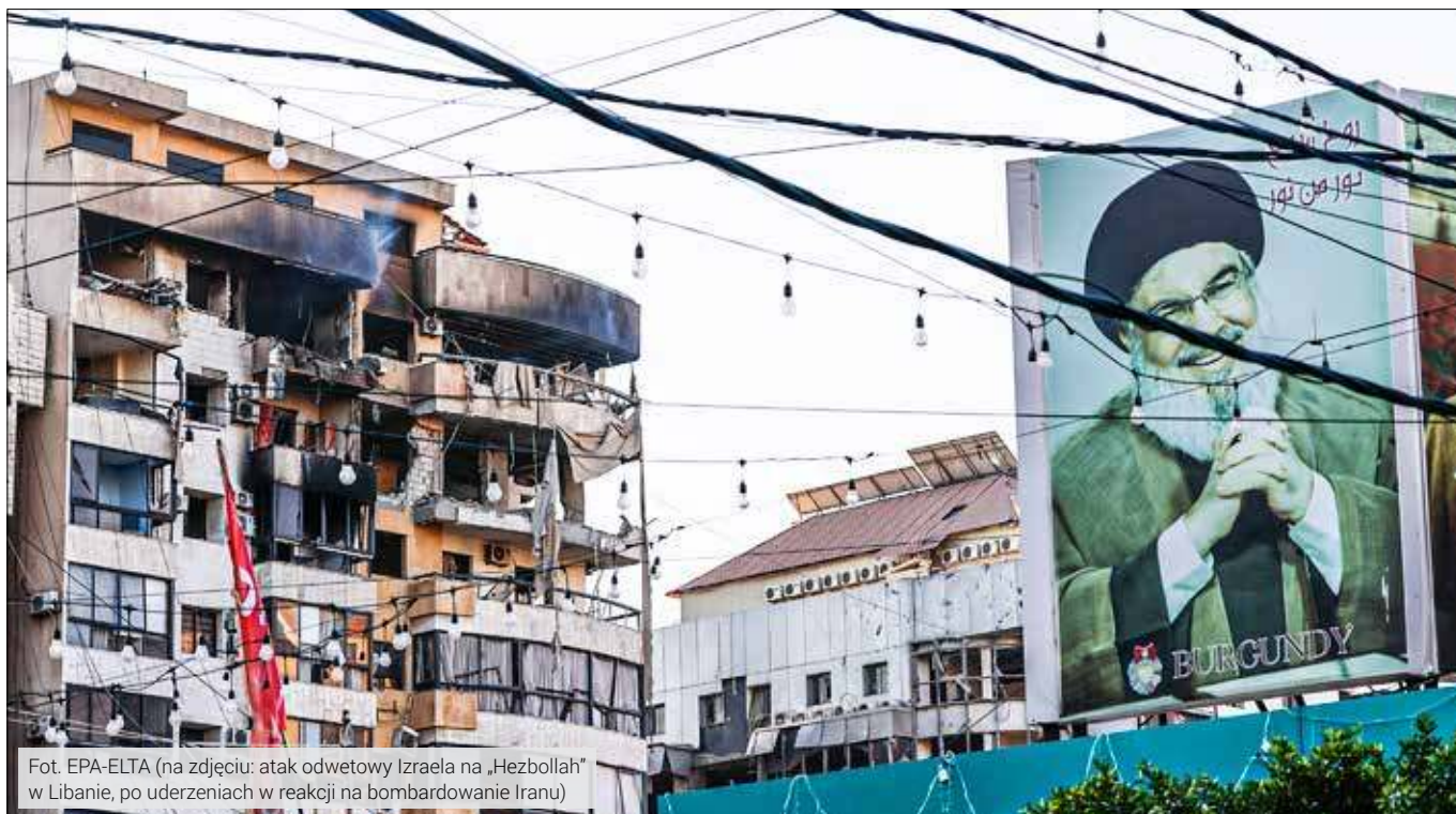
(na zdjęciu: atak odwetowy Izraela na „Hezbollah” w Libanie, po uderzeniach w reakcji na bombardowanie Iranu)

Amerykanie nie chcą „wprowadzać demokracji”