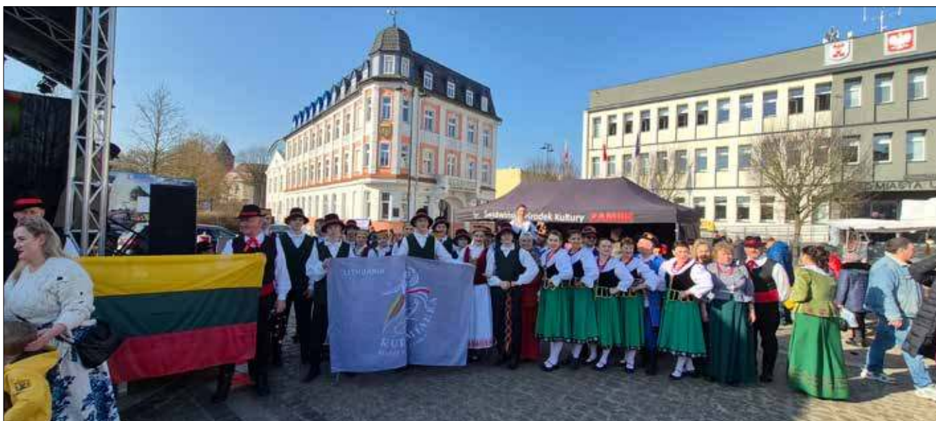
■ W dwa ostatnie dni lutego (27 i 28) Świdwin po raz kolejny stał się miejscem spotkania historii, tradycji i żywej kultury Kresów