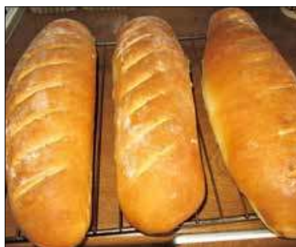
■ Fot. autorka

letnie mleko, olej. Całość wyrabiać dłonią dolewając po trochu letnią wodę. Ciasto na bułki wyrabiamy, aż będzie odchodziło od dłoni. Stolnicę oprószyć odrobiną mąki, wyłożyć ciasto i zagniatą jeszcze chwilę. Tak wyrobione ciasto przekładamy do miski, przykrywamy ściereczką i zostawiamy w cie-