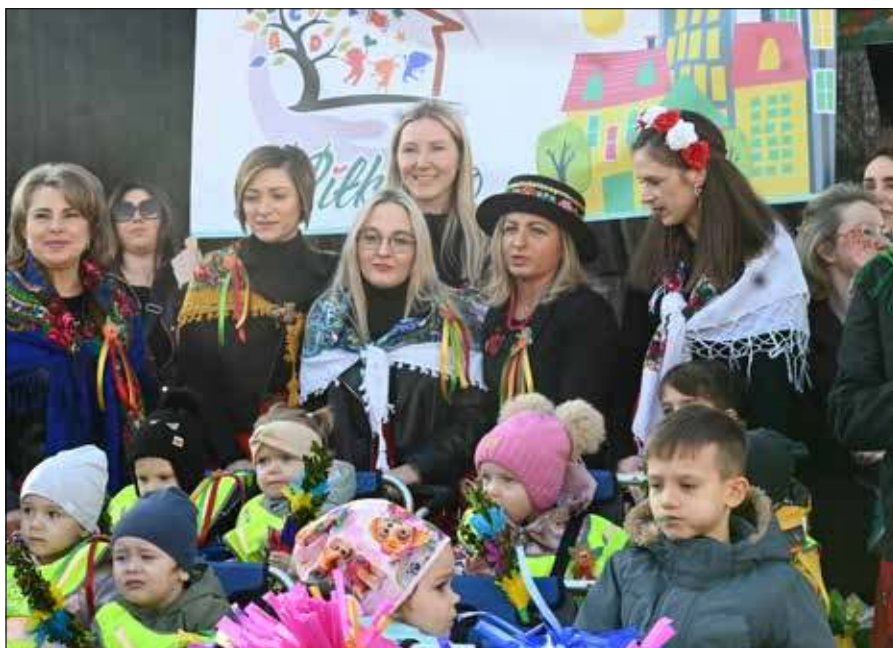
Ważnym elementem tegorocznych Kaziuków były występy dzieci i młodzieży