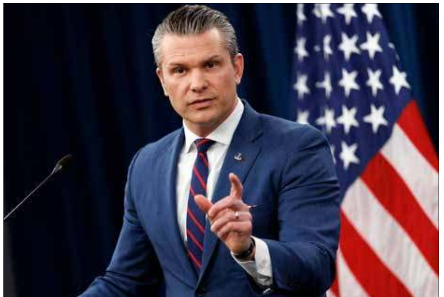
Amerykański minister wojny twierdzi, że „nie będzie żadnych ćwiczeń z wprowadzania demokracji”