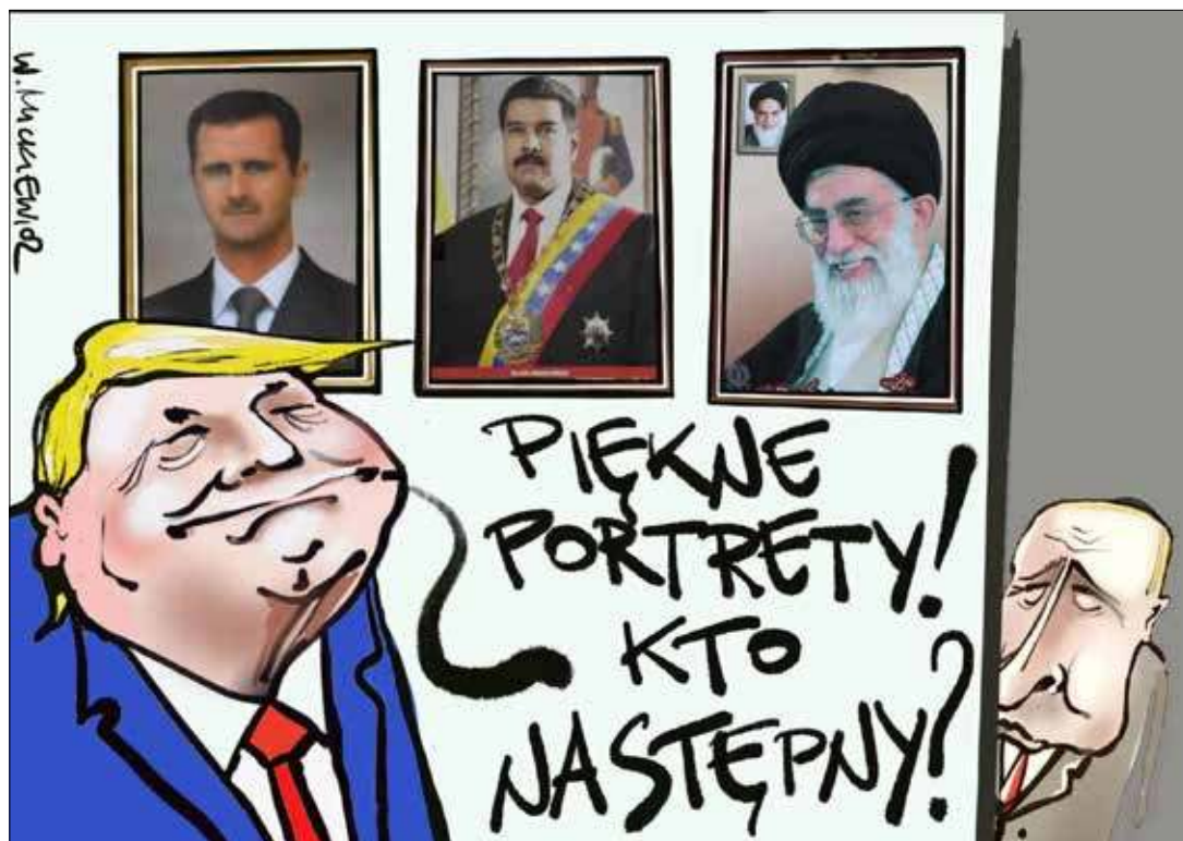
■ Rys. Władysław Mickiewicz