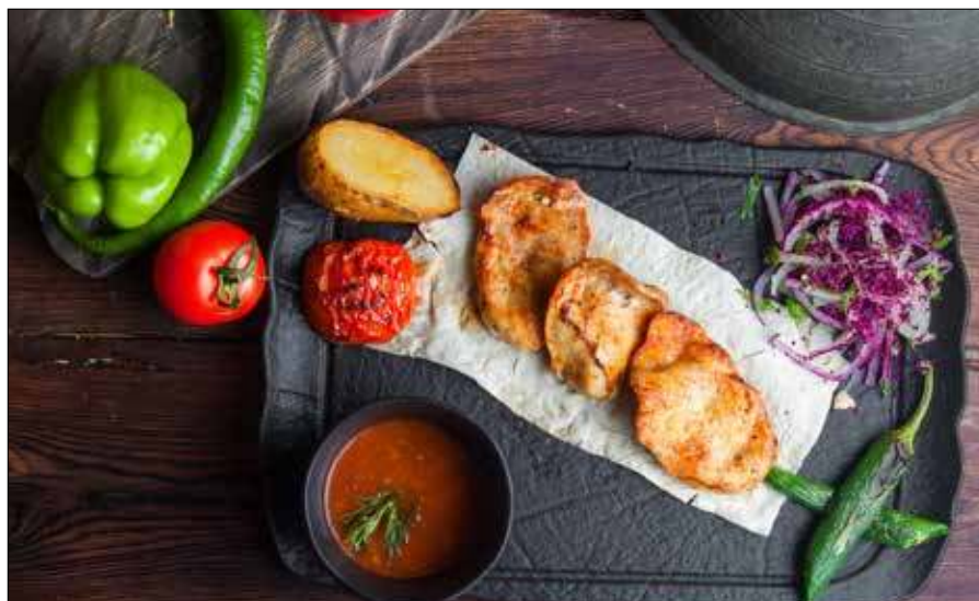
■ Fot. Freepik

Piersi z kurczaka oczyścić z błonek, przekroić wzdłuż na cieńsze płyty i delikatnie rozbić tłuczkiem przez