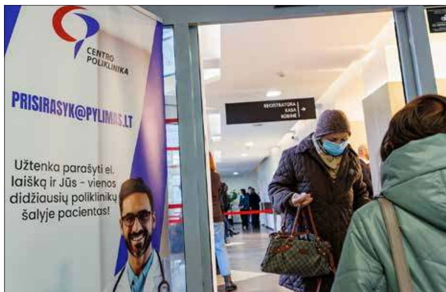
■ Na razie nie ma mowy o zakończeniu sezonu grypy