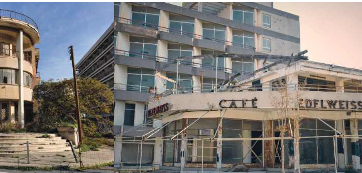
Spacer po Varosha potrafi być przynębiający.