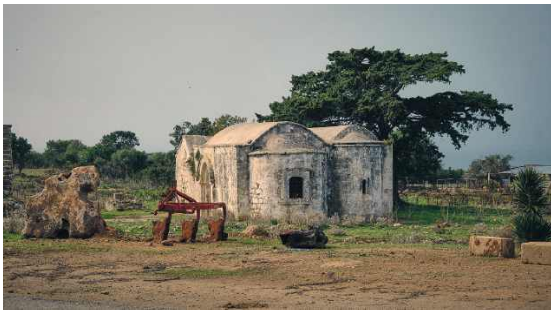
Północny Cypr – ziemia z trudną historią.

Powojenna rzeczywistość zaczęła się na Cyprze kształtować pod wpływem nowej dla wyspiarzy nacjonalistycznej idei „enosis”. Idea ta nawiązywała do finalnego zjednoczenia się Cypru z Grecją. Z którą to zarówno kulturowo, jak i cywilizacyjnie oraz historycznie od wieków łączyło Cypryjczyków bardzo wiele. Dokładnie takie poglądy przejawiał pierwszy prezydent Cypru Makarios III (jednocześnie biskup Autokefalicznego Kościoła Cypryjskiego), któremu udało się wokół idei „enosis” zjednoczyć niemal wszystkich cypryjskich Greków. Dowodem na to miał być przeprowadzony w 1950 roku w Atenach plebiscyt, w którym grecka ludność w 95,73 proc. opowiedziała się za przyłączeniem do Grecji.