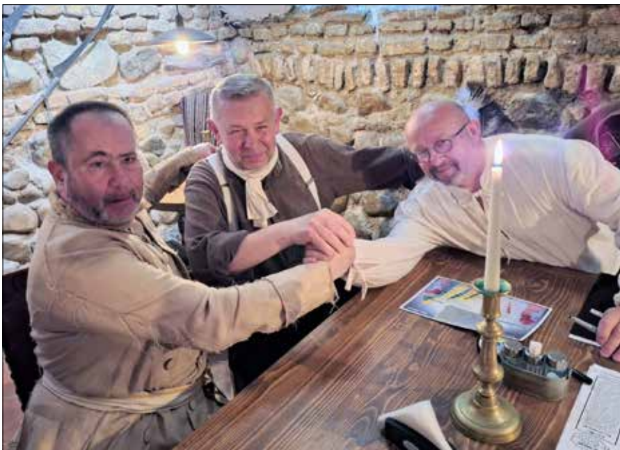
Podpisanie porozumienia 3 maja 2025 r. w Wilnie. Trzy środowiska historyczne podejmą próbę rekonstrukcji wydarzeń na Litwie. Projekt przeprowadzą: Wolni Strzelcy Powiatu Kowieńskiego, Klub Historyczny Rok 1863 i Klub Historyczny Szlakiem Narbutta