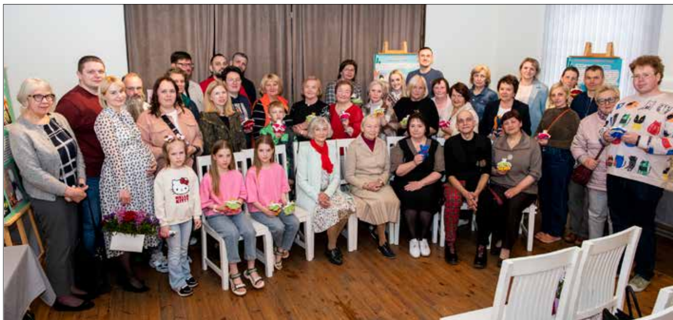
■ Zdjęcie pamiątkowe na zakończenie wieczoru

Inf.: Muzeum Szkolnictwa im. Gabriela Jana Mincewicza, filia Muzeum Etnograficznego w Niemenczynie