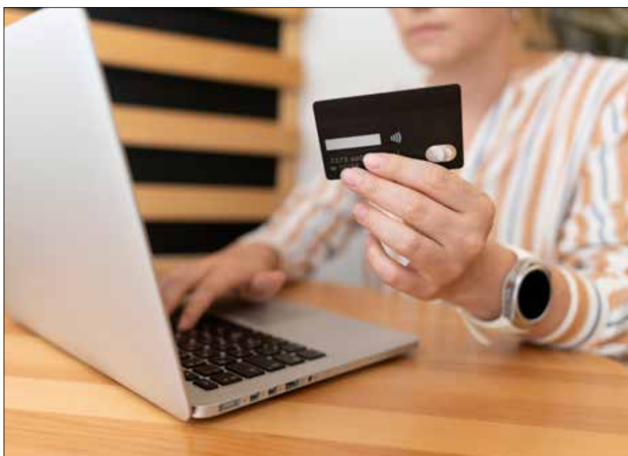
Policja prowadzi postępowania przygotowawcze w związku ze zgłoszeniami mieszkańców