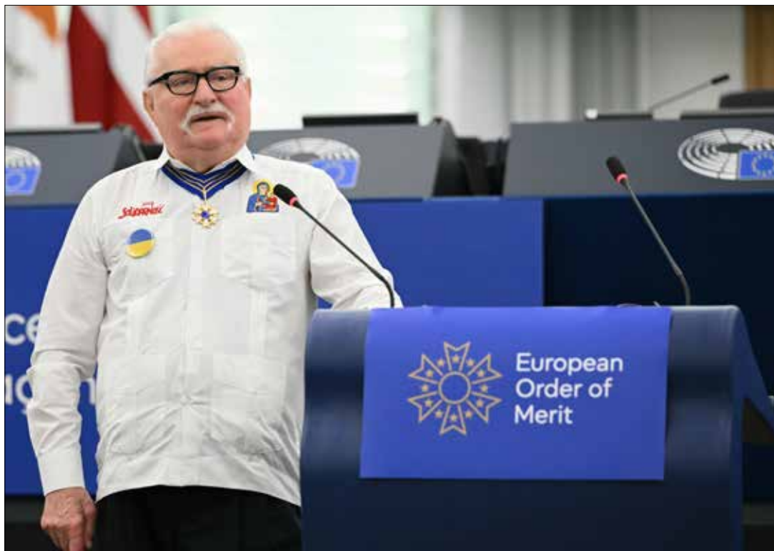
Były prezydent Polski i były lider Solidarności Lech Wałęsa został odznaczony Europejskim Orderem Zasługi w Parlamencie Europejskim