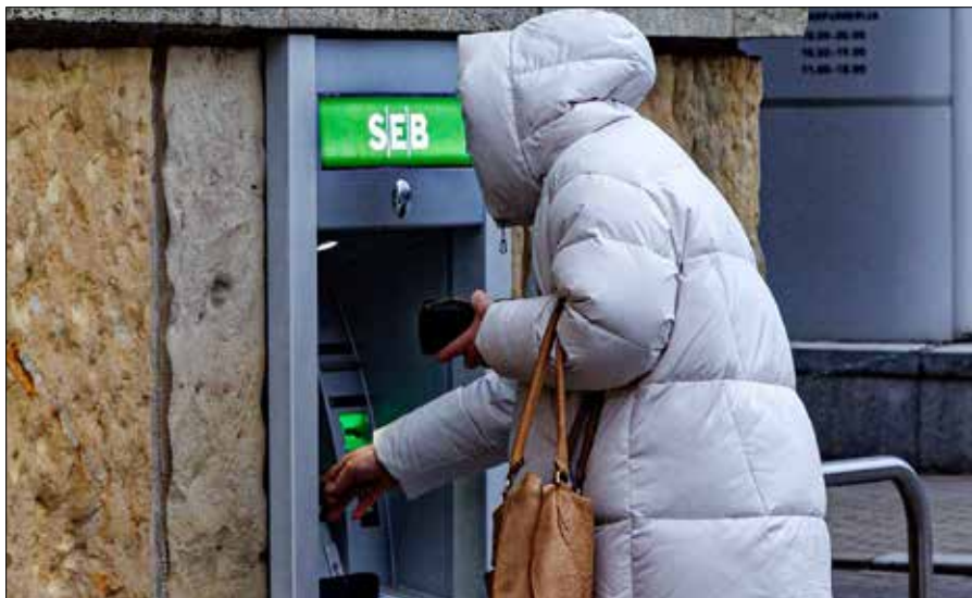
Do zakłóceń doszło w systemie międzynarodowego operatora infrastruktury płatności natychmiastowych EBA CLEARING