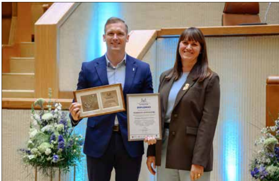
Samorząd Rejonu Wileńskiego doceniony na szczeblu krajowym za dostosowanie przestrzeni publicznych do potrzeb rodzin

Ta nagroda, przyznana przez Ministerstwo Środowiska za dostosowanie przestrzeni publicznych do potrzeb rodzin, to dla nas niezwykle ważne wyróżnienie. Potwierdza ono, że nasze wysiłki na rzecz tworzenia zielonego, bezpiecznego i przyjaznego środowiska dla wszystkich pokoleń – od najmłodszych do najstarszych – są zauważane i doceniane” – powiedział mer R. Duchniewicz.