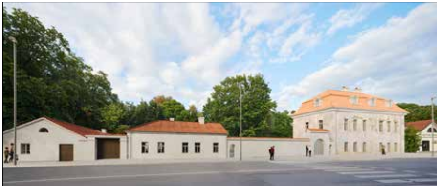
Wizualizacja odnowy Pałacu Kirdejów

W ramach projektu odnowione zostaną: główny budynek pałacu, oficyna, dawna stajnia, dziedziniec