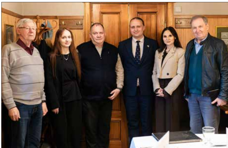
13 maja Forum Wileńskie spotkało się z Laurynasem Šedvydisem, by omówić kwestie praw polskiej społeczności na Litwie w kontekście szkół w rejonie trockim.

Dyskusja była szczerą i, jak określił przewodniczący Komitetu Praw Człowieka, „serdecznie bezpośrednią”, co pozwoliło na lepsze rozeznanie w skomplikowanej sytuacji wokół wrażliwego tematu.