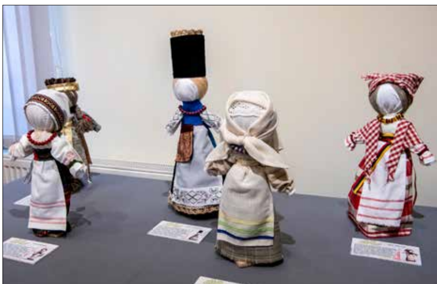
Na wystawie znalazły się liczne lalki-motanki, wykonane różnorodną techniką, ale o wspólnych tradycjach oraz symbolice