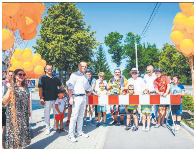
27 czerwca w oficjalnym otwarciu ścieżki wzięli udział samorządowcy, mieszkańcy oraz dzieci i młodzież

– Rozpoczynając program budowy dróg rowerowych, naszym priorytetem było bezpieczeństwo mieszkańców. Ale myślimy również o rozwijaniu turystyki i zachęcaniu mieszkańców, by odwiedzali najpiękniejsze miejsca w naszym powiecie – powiedział Starosta Płocki Sylwester Ziemkiewicz.