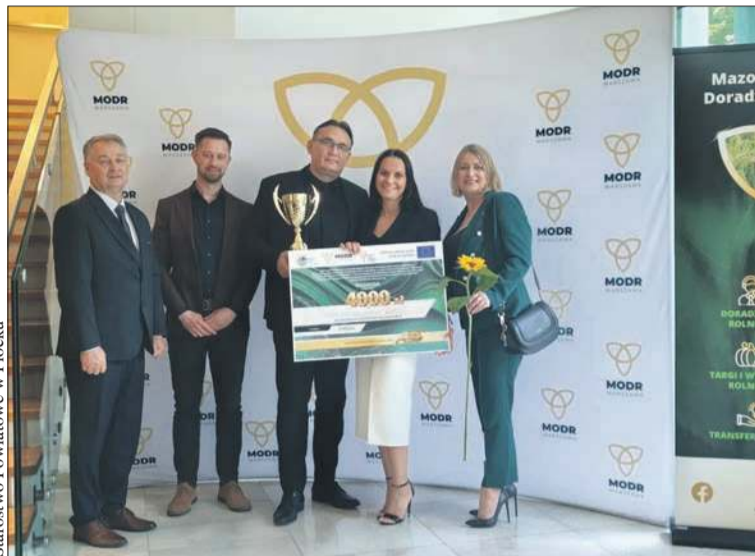
Centrum Handlowo-Usługowe Bugaj z Zagot zdobyło drugie miejsce w wojewódzkim etapie konkursu AgroLiga 2026 i tytuł wicemistrza w swojej kategorii

Powiat płocki podczas wydarzenia reprezentował dyrektor Wydziału Środowiska i Rozwoju Obszarów