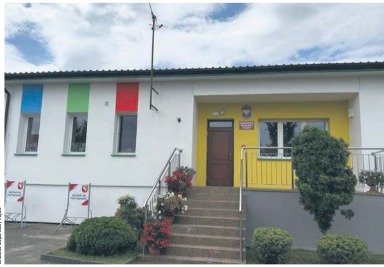
Samorządowe Przedszkole w Łącku

Nowe wyposażenie ma ułatwić prowadzenie zajęć oraz stworzyć uczniom i przedszkolakom lepsze warunki do nauki. Program zakłada również wsparcie dzieci korzystających z różnych form pomocy terapeutycznej.