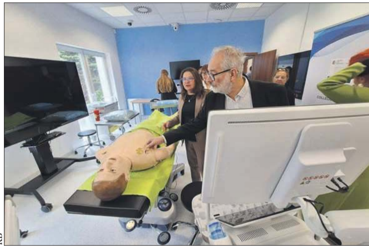
Wyposażenie Collegium Medicum

Budynki trzeba było wyposażyć, w czym pomogła dotacja od miasta w wysokości 520 tys. zł. Dalsza mo-