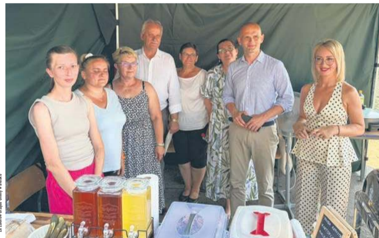
Stoisko Koła Gospodyń Wiejskich w Rudawie

Partnerem wydarzenia był Samorząd Województwa Mazowieckiego, Mazowsze serce Polski