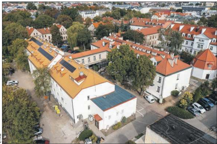
Poradnia Psychologiczna dla Dzieci i Młodzieży działa w ramach Centrum Zdrowia Psychicznego przy ul. Reja w Płocku, które jest częścią Szpitala św. Trójcy

Poradnia Psychologiczna dla Dzieci i Młodzieży od lat zapewnia bezpłatną pomoc diagnostyczną i terapeutyczną dzieciom oraz młodzieży do 18. roku życia. W uzasadnionych przypadkach na pomoc mogą liczyć również osoby do 21. roku życia. Zakres udzielanej pomocy obejmuje m.in. porady psychologiczne, psychoterapię indywidualną, rodzinną i grupową, terapię środowiskową, trening umiejętności społecznych, warsztaty dla rodziców oraz wsparcie w sytuacjach kryzysowych. (kb)