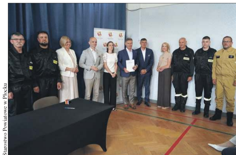
Podpisano umowy w ramach IX edycji programu „Zakup sprzętu ratowniczego i umundurowania – 2026”. Jednostki OSP z regionu ze znacznym wsparciem

Dzierżanowo, OSP Wrogocin, OSP Nagórki Dobrskie, OSP Chudzyno, OSP Białobrzegi, OSP Gromice, OSP Grodkowo, OSP Strzemeszno, OSP Lipińskie, OSP Grabie Polskie, OSP