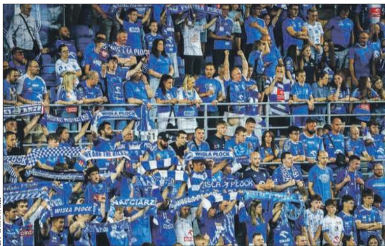
Na emocje kibice muszą poczekać do września

Wioślarze po regatach kontrolnych w Kruszwicy