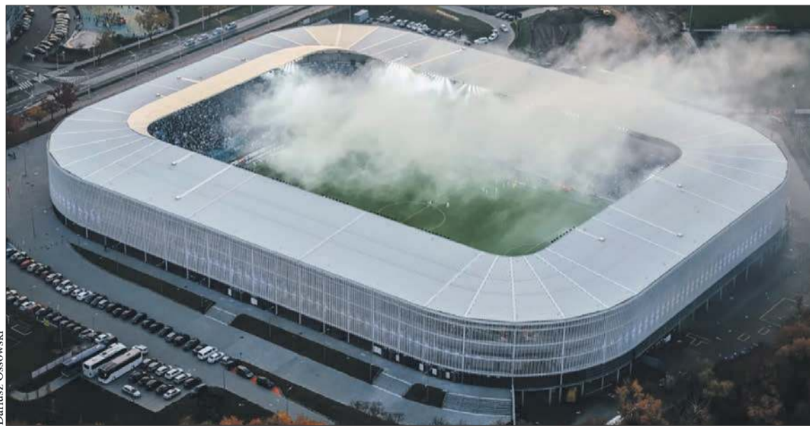
Stadion Wisły Płock w Płocku