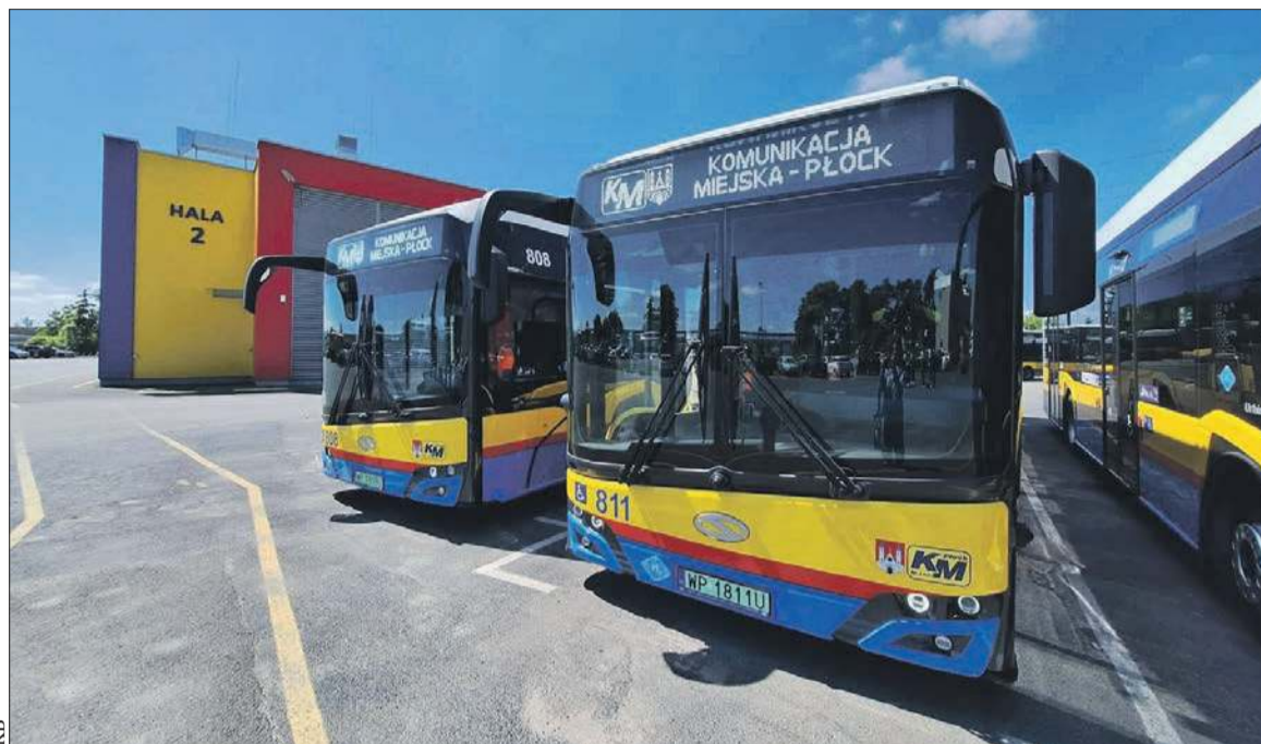
Nowe autobusy wodorowe już wyruszyły na płockie ulice

Jednocześnie miasto rozpoczęło starania o pozyskanie środków unijnych na zakup zeroemisyjnych autobusów. Finalnie zakupy kosztowały ponad 70 mln zł, w tym ponad 57 mln zł stanowiło unijne dofinansowanie (pieniądz pochodził z Krajowego Planu Odbudowy). Trzeba było zmodernizować halę Komunikacji Miejskiej (za blisko 3 mln zł, koszt ponio-