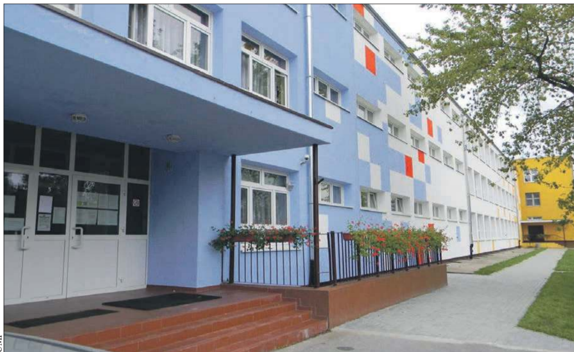
Szkoła Podstawowa nr 3 w Płocku