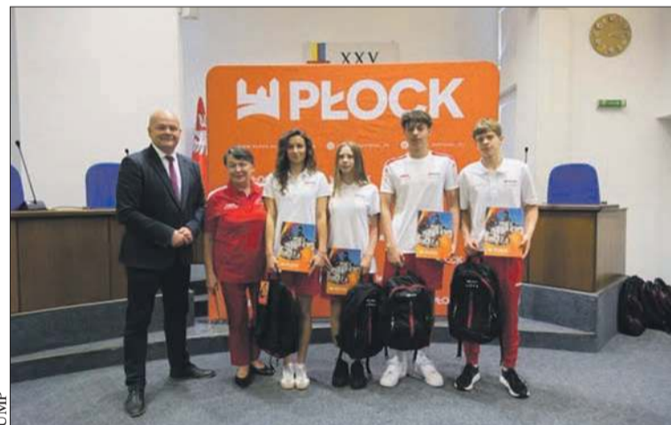
Ekipa pływacka SWIM Płock

Młodzi sportowcy z Płocka w sierpniu wezmą udział w 58. Międzynarodowych Igrzyskach Szkolnych (International Children's Games), które odbędą się w miejscowości Hualien na Tajwanie.