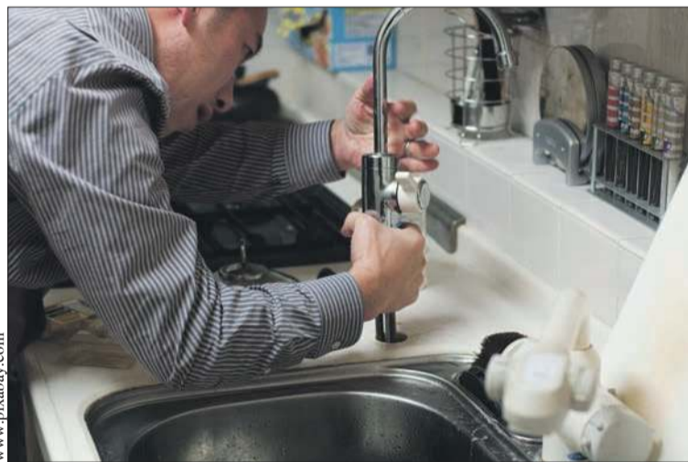
Program obejmuje m.in. pomoc przy uszczelnieniu kranu

nosprawności lub równoważne. Szansę na kwalifikację mają osoby mieszkające samotnie lub mieszkające z osobami bliskimi, które ze względu na wiek nie są w stanie im pomóc (również mają ukończone 65 lat) bądź są niepełnosprawne co najmniej w stopniu umiarkowanym. Oprócz tego usługa powinna być wykonana w lokalu, w którym mieszka osoba potrzebująca „złotej rączki”. To nie będzie program dla osób mających już dorosłe dzieci lub wnuki, mieszkające w Płocku lub w gminach ościennych.