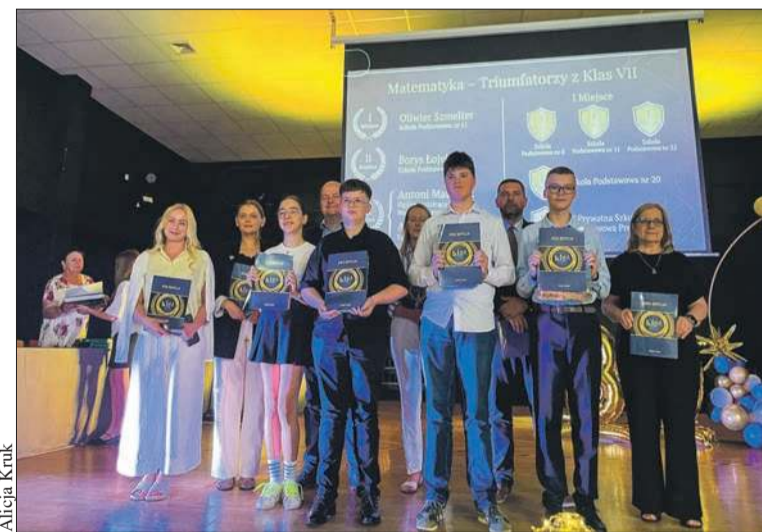
Laureaci XXX Ligi Przedmiotowej odebrali zasłużone wyróżnienia

– Chciałbym bardzo serdecznie podziękować wszystkim tym, którzy przez 30 lat również wierzyli, że edukacja, pojmowanie wiedzy, poszerzanie horyzontów jest niesamowitą wartością,