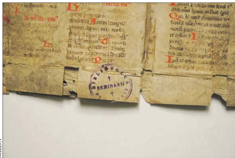
Fragment średniowiecznego rękopisu z zapisem „Gaude Mater Polonia”

będzie stawalo się zadość – podkreślił duchowny.