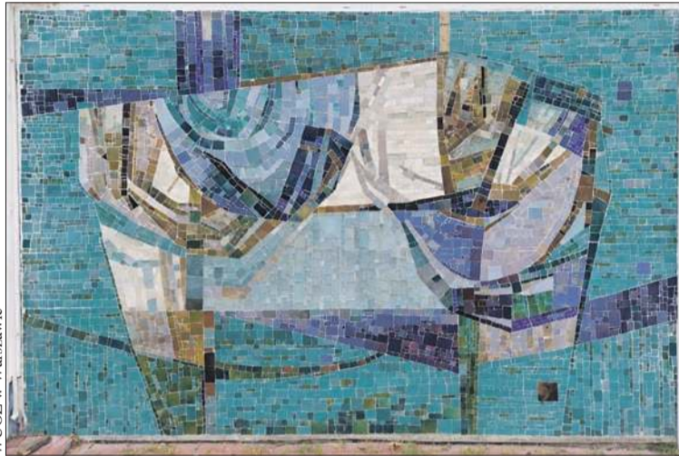
Płockie mozaiki w Al. Kobylińskiego

Twórcą tych kompozycji był Zbigniew Brodowski, jeden z najważniejszych twórców wielkoformatowych dekoracji architektonicznych w powojennej Polsce. Ten sam artysta stworzył mozaikę w ambasadzie polskiej w Pekinie i okładzinę na fasadach Filharmonii Podkarpackiej w Rzeszowie. Swoją mozaikową spuściznę zostawił również w Warszawie – zdobiącą fasadę kamieniczki przy ul. Mostowej, we wnętrzu biurowca PZM im. Marcelego Nowotki (obecnie Polski Holding Obrony) i w kinie Bajka (aktualnie Teatr Kwadrat).