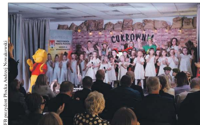
Przedzkolaki z patronem Kubusiem Puchatkiem