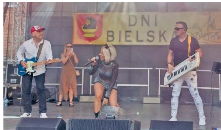
Zespół muzyczny „Twoja Ex”