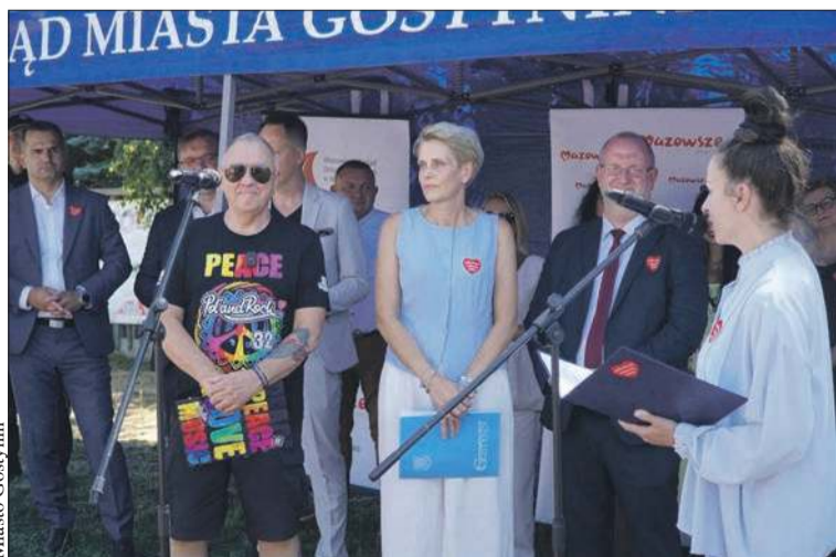
Uroczyste otwarcie dwóch rond w Gostyninie z udziałem Jurka Owskiaka