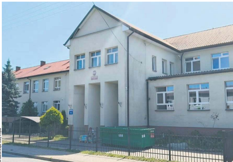
Szkoła Podstawowa w Łącku