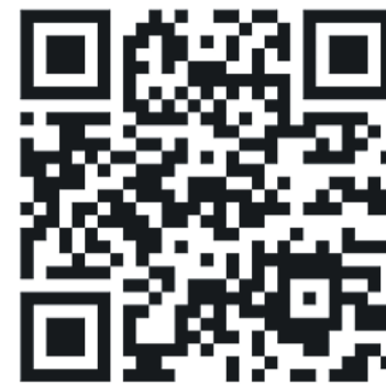
Kod QR do zrzutki

Stowarzyszenie „Murem za Dworcem PKP w Sierpcu” dąży do sprowadzenia do miasta kultowego parowozu OL49. Ta inicjatywa, będąca marzeniem wielu mieszkańców pamiętających czasy świetności tutejszej kolei, ma realne szanse na powodzenie. Kluczową barierą są jednak finanse – na realizację przedsięwzięcia potrzeba ponad 100 tys. złotych.