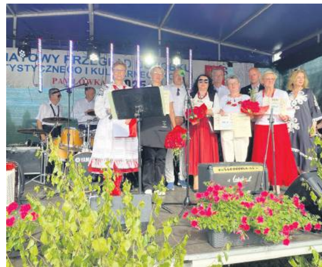
Koła biorące udział w konkursach nagrodzono czekami.

„Tyszowianki” z Tyszowic i wręczono bono o wartości 500 zł, drugie miejsce otrzymało KGW „Dolinianki” z Bełzca II (400 zł), a trzecie miejsce przypadło KGW „Werechanki” z Were-