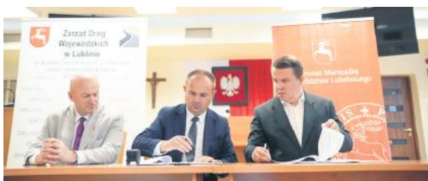
Prace potrwają do lipca 2027 roku.

Po wielu latach oczekiwań ta ważna inwestycja o wartości około 77 mln zł wkracza w fazę realizacji. Nowa droga ma wyprowadzić z Tarnogrodu ruch na trasie wojewódzkiej z Lublina w stronę autostrady A4. Będzie