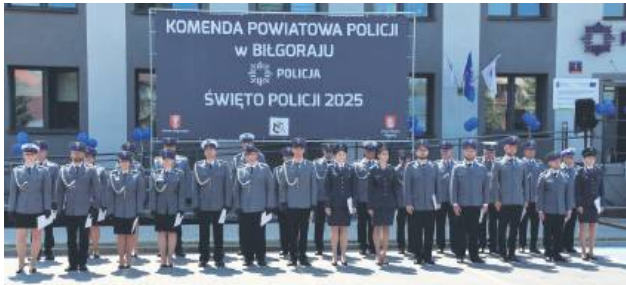
W tym roku na wyższy stopień służbowy mianowano 38 policjantów.

Uroczysty apel z okazji 106. rocznicy powstania Policji Państwowej odbył się przed budynkiem Komendy Powiatowej Policji w Biłgoraju. W wydarzeniu uczestniczył I zastępca Komendanta Wojewódzkiego Policji w Lublinie, mł. insp. Olgierd Oleksiak. Swoją obecnością za-