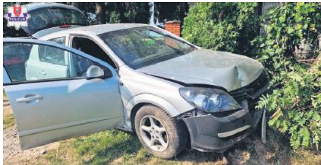
9 lipca podejrzany usłyszał zarzuty.