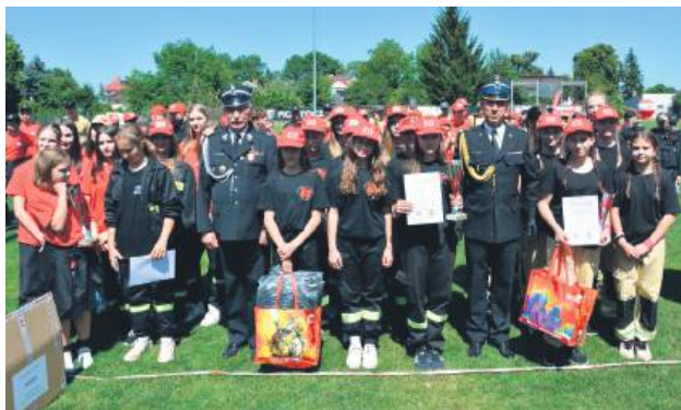
Była to nie tylko sportowa rywalizacja, lecz także okazja do integracji, wymiany doświadczeń oraz promocji postaw obywatelskich i służby społecznej.

S tadion w Szczebreszynie stał się areną zmagania najlepszych drużyn pożarniczych z terenu powiatu zamojskiego w dniach 5-6 lipca. Pierwszy dzień potyczek