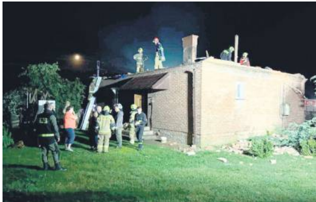
W powiecie hrubieszowskim największe straty odnotowano w Anopolu oraz Horodle.