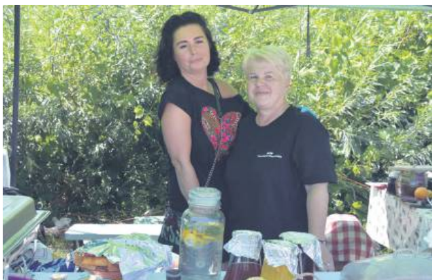
Koło Gospodyń Wiejskich „Zaorendzianki” z Tereszpola-Zaorendy.

dla konkursu kulinarnego dla kół gospodyń wiejskich zrodziła się z zamiłowania do polskiej kuchni regionalnej, rodzimego folkloru oraz chęci promocji polskiej żywności. Jego celem było promowanie regionalnych potraw, a także bogactwa i różnorodności lokalnych tradycji kulinarnych. W Tarnogrodzie odbył się etap powiatowy konkursu, w którym udział wzięło jedenaście organizacji z terenu powiatu biłgorajskiego i tomaszowskiego. Kolejne będą zma-