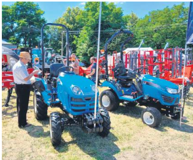
Główną atrakcją były maszyny rolnicze.

W pierwszy weekend lipca Sitno ponownie stało się stolicą rolnictwa w regionie. XXXVII Wystawa Maszyn i Urządzeń Rolniczych, zorganizowana przez Lubelski Ośrodek Doradztwa Rolniczego w Końskowoli, przyciągnęła ponad 300 wystawców i tysiące gości z całej Polski.