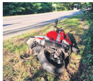
48-letni motocyklista z Tomaszowa Lub. miał ponad promil alkoholu w wydychanym powietrzu.

W podtomaszowskich Pasiekach 48-latek na motocyklu yamaha zderzył się z samochodem osobowym volvo. Rannego motocyklistę z Tomaszowa przewieziono do tamtejszego szpitala. A wcześniej kierujący motocyklem nadmuchał w alkomat ponad 1 promil alkoholu.