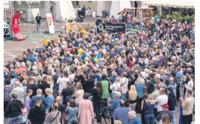
Koncerty na Rynku Wielkim cieszyły się ogromnym zainteresowaniem.