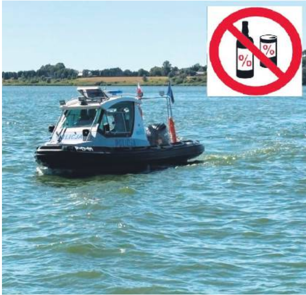
Policja apeluje, aby po spożyciu alkoholu nie wchodzić do wody ani nie korzystać ze sprzętu wodnego.

To nie koniec. Pełniący tego dnia służbę na łodzi policjant z Nielisza podczas