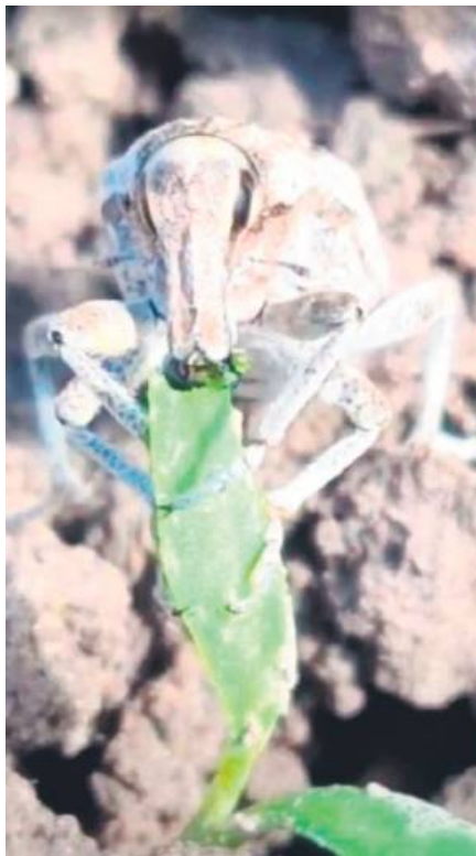
Wcześniejszy siew buraków i ruszenie ich vegetacji przy mniejszych opadach deszczu wiosną doprowadziły do wyjątkowo nasilonego ataku szarka komośnika.