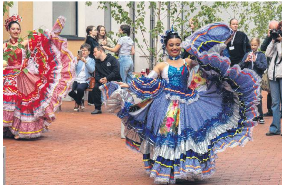
Taneczne popisy przy kawiarni Arabeska.