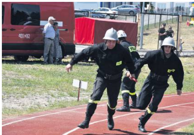
W zawodach udział wzięło 31 zespołów.

6 lipca na stadionie w Tarnogrodzie odbyły się Powiatowe Zawody Sportowo-Pożarnicze, które zgromadziły drużyny OSP z całego powiatu. Pokaz umiejętności, szybkości i współpracy przyciągnął liczne grono kibiców i był prawdziwym świętem lokalnego pożarnictwa.