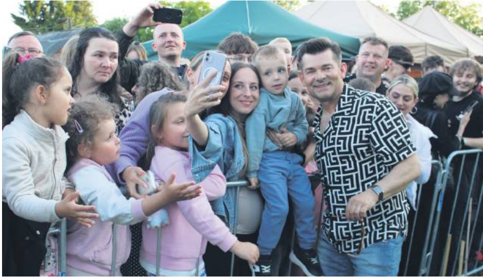
Tego pana przedstawiać nie trzeba.

Ta jedna z największych letnich imprez folklorystycznych na terenie województwa lubelskiego przyciąga corocznie kilkanaście tysięcy osób. Nie inaczej było w tym roku. Gwiazdami trwającego trzy dni Jarmarku św. Kiliana w Skierbieszowie były zespół MiG, Zenon Martyniuk oraz Czadoman.