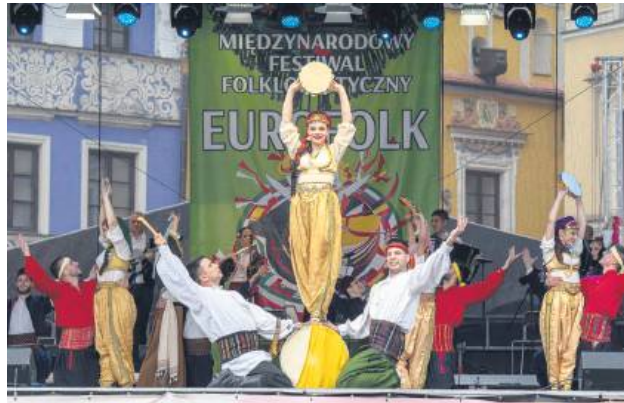
Zespoły występujące podczas Eurofolku prezentowały najwyższy poziom.