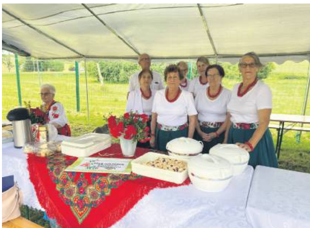
Zgłoszone koła przedstawiły krótką charakterystykę i opis swojej działalności, zaprezentowały też swój dorobek kulinarny, artystyczny i społeczny.

29 czerwca w Pawłówce odbył się XV Powiatowy Przegląd Dorobku Kulinarnego i Artystycznego Kół Gospodyń Wiejskich. W wydarzeniu wzięły udział przedstawicielki dziesięciu kół z terenu powiatu tomaszowskiego: z Siemierza, Pawłówki, Rachań, Pukarzowa, Nabroża, Polan, Werechań, Tyszowic, Grodyślavic i Bełzca II.