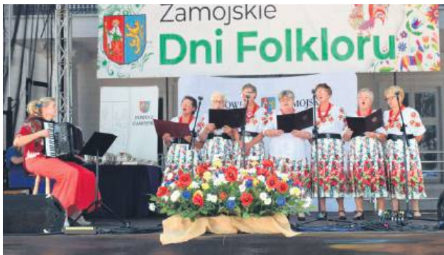
To wydarzenie ożywia dawne melodie, pieśni i przysłówki ludowe Zamojszczyzny.

Organizowana przez Starostwo Powiatowe w Zamościu impreza odbyła się 6 lipca na dziedzińcu Zespołu Szkół i Placówek Oświatowych w Zwierzyncu.