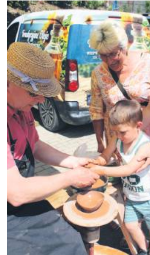
Odbywały się pokazy dawnych zawodów.

oraz niezapomniane wrażenia. Nie zabrakło degustacji potraw regionalnych i kultywowania dawnych obrzędów. Magnese-