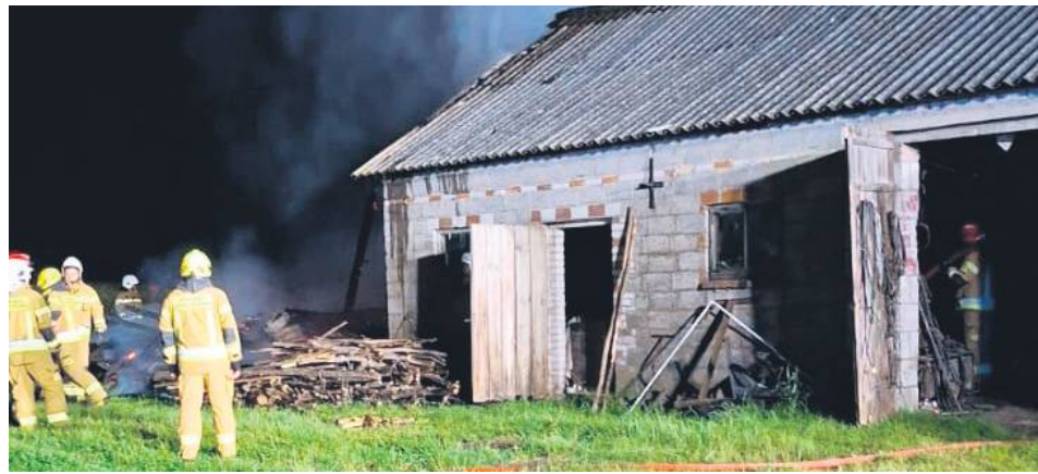
Podejrzany o podpalenie 36-latek kręcił się w pobliżu płonącej stodoły. Policjantom, którzy go zauważyli, przyznał się, że to on podpalił budynek.

36-latek z gminy Werbkowice został zatrzymany na gorącym uczynku podpalenia zabudowań w Terebiniu. Policjanci przybyli na miejsce pożaru, a podpalacz wyszedł z zapalniczką z płonącej stodoły.