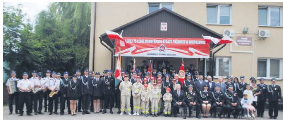
Pamiątkowe zdjęcie z jubileuszu 75-lecia OSP Wieprzów.

Na koniec swojego przemówienia podziękowała darczyńcom i sponsorom, którzy