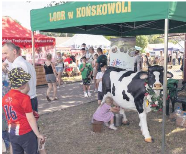
Dzieci mogły „wydoić” makietę krowy.