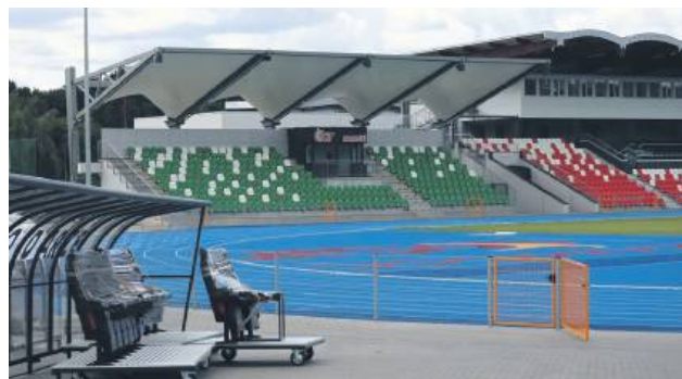
Stadion może obecnie pomieścić 1 753 kibiców, ale w ramach drugiego etapu modernizacji pojemność obiektu wzrośnie do 5 000 miejsc.

Odbiór obejmował m.in. trybunę honorową, budynek szatniowo-sanitarny, wieżę sędziowską, kasy biletowe i towarzyszącą infrastrukturę. Przypomnijmy, że kluczowym elementem było uzyskanie pozytywnej opinii straży pożarnej, która warunkowała decyzję Powiatowego Inspektora Nadzoru Budowlanego. O tym,