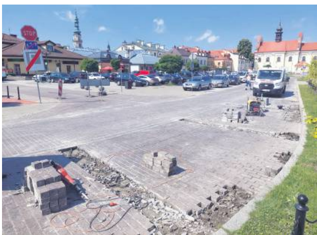
Prace przy ul. Łukasińskiego w Zamościu potrwać do końca wakacji.