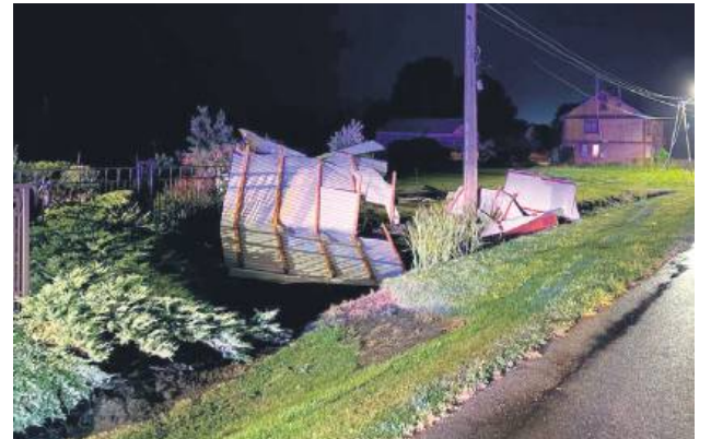
Gmina Komarów-Osada. Tutaj strażacy interweniowali 8 razy.