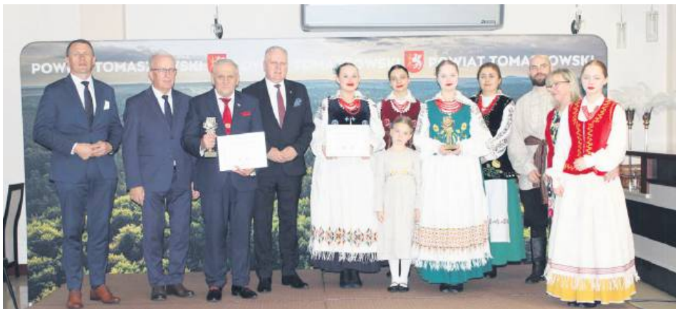
Laureaci Srebrnych Gryfów: Zespół Folklorystyczny „Roztocze” oraz Roztoczański Związek Pszczelarzy.