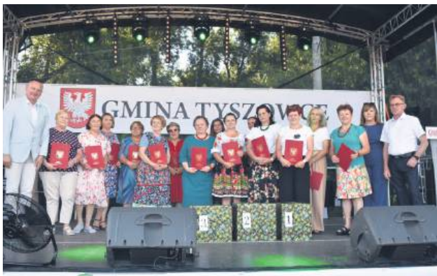
KGW nagrodzone w konkursie kulinarnym.

W pierwszy weekend lipca mieszkańcy Tyszowic i okolic mieli podwójny powód do świętowania. Zorganizowane po raz 28. Święto Kwitnącej Fasoli połączone z obchodami 25-lecia odzyskania przez Tyszowice praw miejskich.