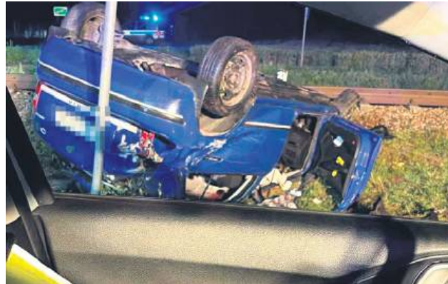
Na miejscu zdarzenia pracowali policjanci pod nadzorem prokuratora.

Do groźnego wypadku doszło w czwartek, 11 lipca, przed godziną 20:30 na niestrzeżonym przejeździe kolejowym bez