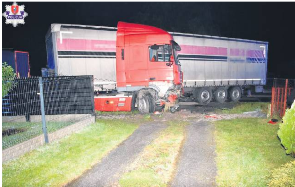
Do zdarzenia doszło na drodze krajowej nr 74 w Miączynie.

W Miączynie 61-letni kierowca ciężarówki z naczepą stracił panowanie nad pojazdem i wjechał do rowu. Trafił do szpitala, ale po badaniach wrócił do domu. Obywatel Ukrainy nie odniósł poważniejszych obrażeń. Policja ustaliła, że przyczyną kolizji było niedostosowanie prędkości do warunków na drodze. Mężczyzna został ukarany mandatem.