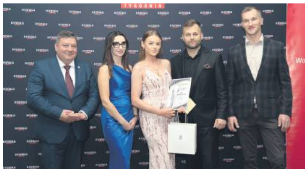
Ubiegłoroczny Debiut Roku, czyli Kina MakeUp Artist.

„Kronika Tygodnia” po raz kolejny organizuje „Perły Biznesu”. To już ósma edycja tego prestiżowego plebiscytu. Nasze nagrody to wyjątkowe wyróżnienie dla firm, instytucji i osób, które mają realny wpływ na rozwój gospodarczy Zamojszczyzny i codziennie udowadniają, że lokalny biznes ma ogromny potencjał.