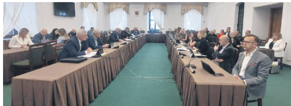
4 lipca radni przyjęli stanowisko.