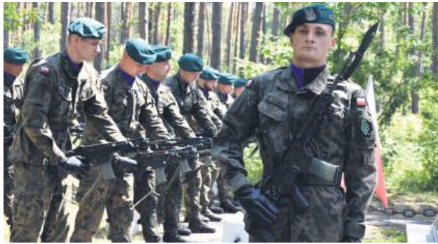
Salwą honorową uczczono pamięć poległych.

W lipcowy poranek 1944 roku z budynku mieszczącego się przy dzisiejszej ul. Wandy „Wacek” Wasilewskiej w Biłgoraju Niemcy wyprowadzili uwięzionych partyzantów. Byli to członkowie polskich oddziałów leśnych – młodzi ludzie, często jeszcze nastolatki, którzy działali w strukturach Armii Krajowej i Batalionów Chłopskich. Ich jedyną „winą” była walka o niepodległość Polski, sprzeciw wobec okupanta i chęć przywrócenia wolności swojemu narodowi. Związanych, pobitych i poniżo-