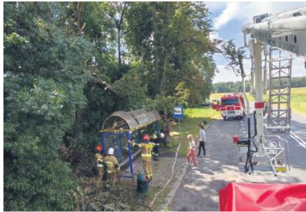
Usuwanie skutków wichury w powiecie tomaszowskim.