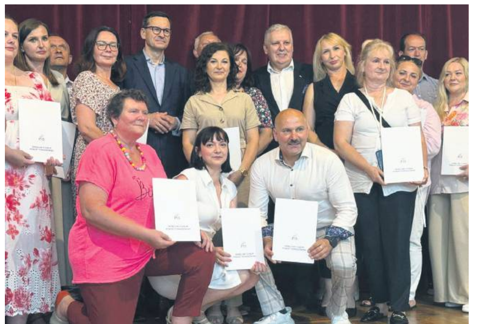
Spotkanie z byłym premierem w Tomaszowie Lubelskim.