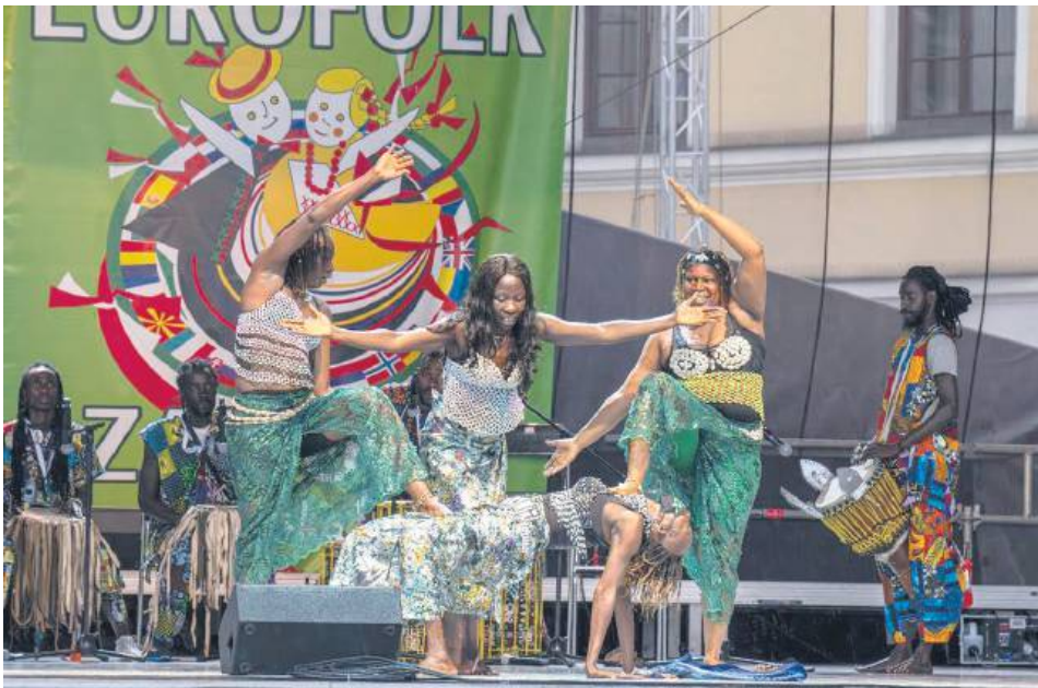
Na Eurofolku występowały zespoły z kilku kontynentów.