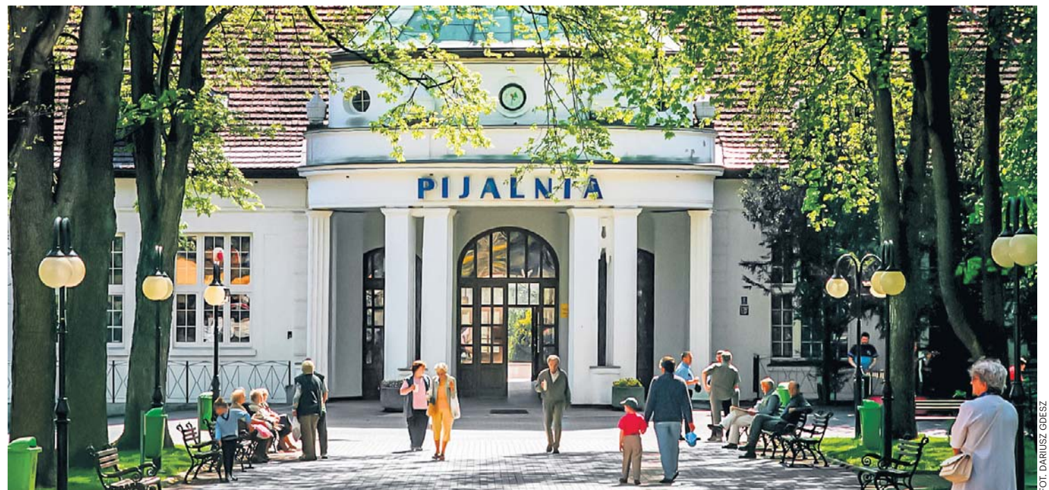
Polanica-Zdrój. Na zdjęciu deptak w Parku Zdrojowym i pijalnia wód mineralnych

Polańczyk został uznany oficjalnie za uzdrowisko całkiem niedawno, dopiero w 1999 r., ale leczenie uzdrowiskowe prowadzi się tu od połowy lat 70., a urokliwe pensjonaty i sanatoria wzniesiono jeszcze dekadę wcześniej