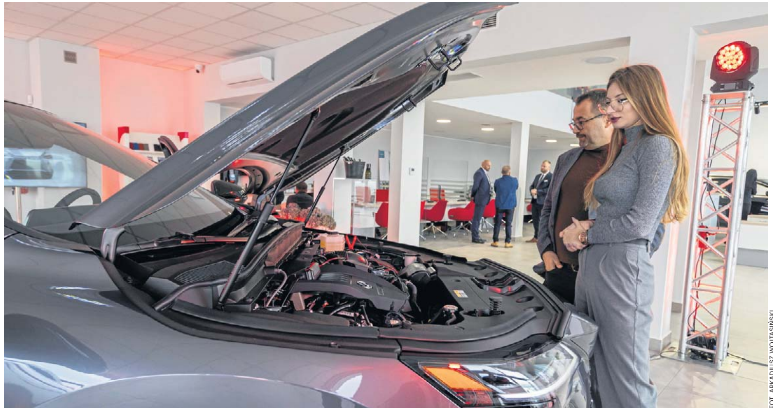
Liczba czynników wpływających na ostateczny rachunek zakupu i posiadania auta jest duża. Najważniejsze z nich to: wydatki na paliwo, naprawy i części, utrata wartości, podatki i opłaty związane na przykład z ubezpieczeniem

Polski park samochodów osobowych nadal rośnie. Na koniec 2025 roku zarejestrowanych było 21 mln samochodów osobowych. Od stycznia do końca maja tego roku zarejestrowano 253 067 nowych aut, czyli