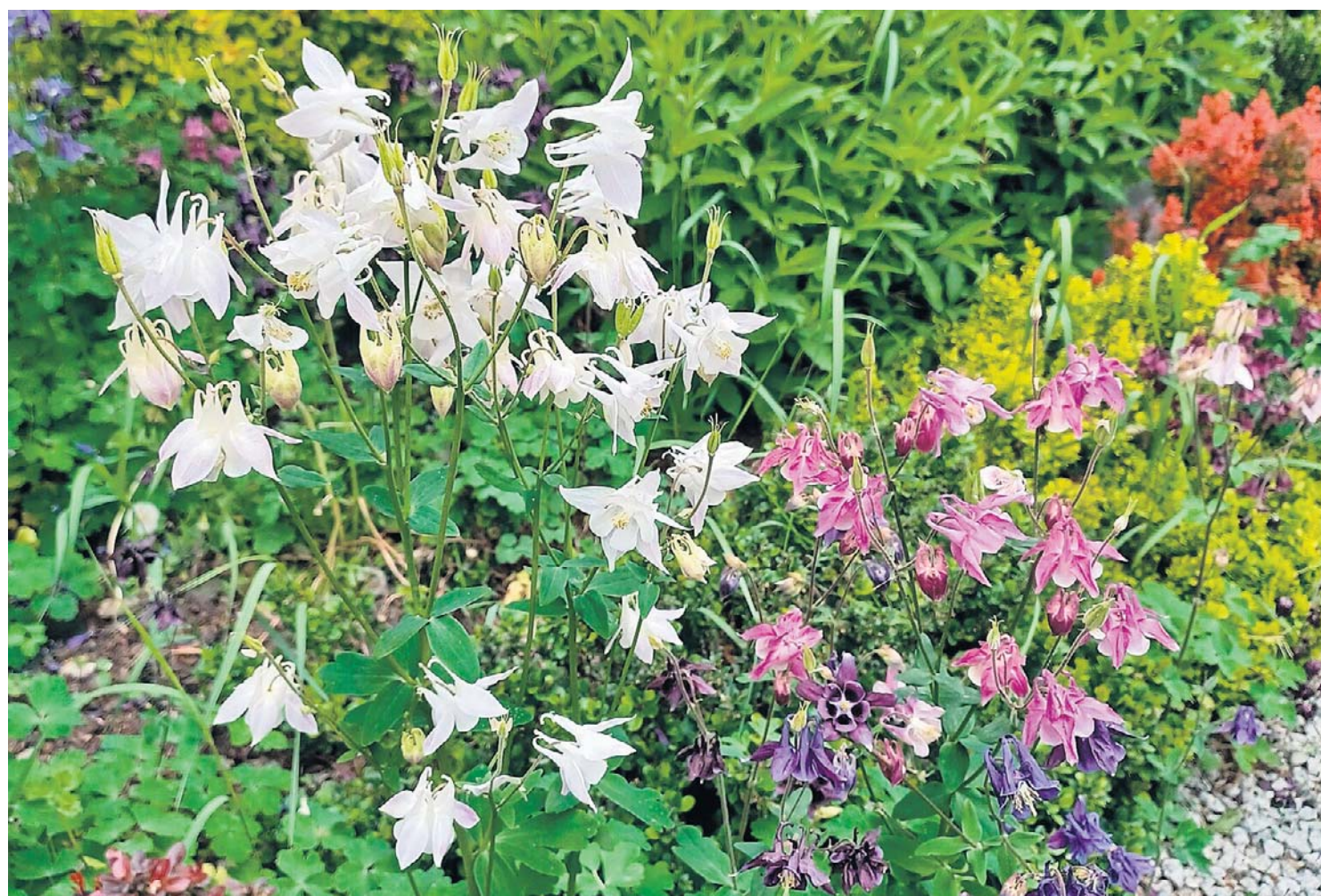
Kwiaty orlików mają różne kolory. Chętnie krzyżują się i co sezon pojawia się jakaś nowa barwa