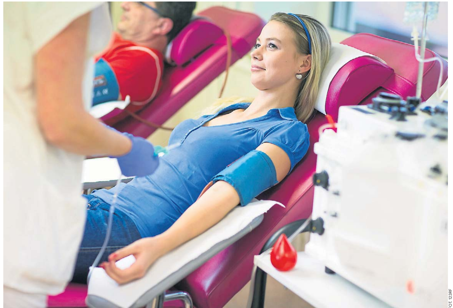
Krew pełną można oddawać nie częściej niż co 8 tygodni (kobiety 4 razy w roku, mężczyźni 6 razy). Osocze można oddawać znacznie częściej - nawet co 2 tygodnie. Krwiodawcom przysługują różne profity

W Ministerstwie Zdrowia przyjęta została kolejna edycja programu polityki zdrowotnej, którego celem jest zapewnienie samowystarczalności Polski w krew i jej składniki w lata 2027-2032. Na ten cel resort przeznaczy kwotę ponad 130 mln złotych. PAP