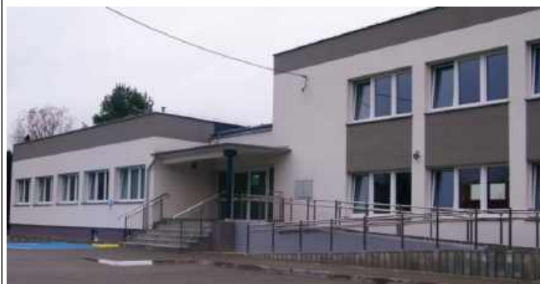
Gminne Centrum Kultury w Kamieniu

wynoszącym jedynie 329 500 zł. W ramach tego zadania wykonano wiaty zadaszeniowe, utwardzono teren kostką brukową, wyasfaltowano drogi dojazdowe. Zamontowana została także waga najazdowa, oraz kontener biurowy dla pracownika. Zakupione zostały kontenery na poszczególne frakcje odpadów. Całość została ogrodzona, wykonano również oświetlenie i monitoring. Na dachu wiat zamontowana została instalacja fotowoltaiczna o mocy 50 KW, z której wyprodukowana energia zasilać będzie znajdująca się na tej samej działce gminną oczyszczalnię ścieków.