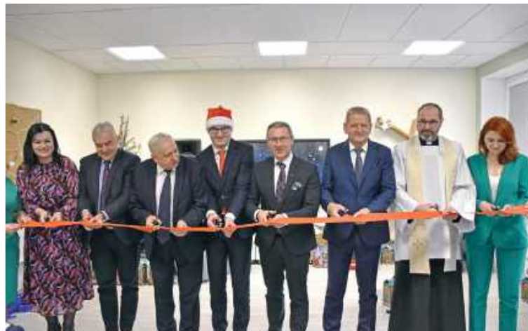
Otwarcie Gminnego Żłobka „Małe Ziółka” w Boniewie

Dzięki konsekwentnym działaniom i decyzjom akceptowanym przez Radę Gminy Fajstławice zrealizowane dotychczas na terenie gminy inwestycje w gospodarce wodno-ściekowej spowodowały, że z roku na rok wzrasta długość sieci oraz liczba nowych przyłączy do zbiorczej sieci kanalizacyjnej czy wodociągowej.