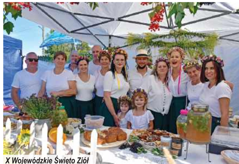
X Wojewódzkie Święto Ziół

W skład pomieszczeń wchodzi: sala żłobkowa do odpoczynku dziennego, odpowiednio przystosowana do maluchów