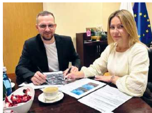
fol. Miasto Krasnostaw

Dzięki tym środkom miasto planuje przeprowadzić między innymi modernizację przestrzeni publicznych obejmującą m.in. renowację ratusza miejskie-