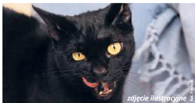
zdjęcie ilustracyjne

- Niepokojące jest także i to, że w tym gospodarstwie kontakt z chorym zwierzęciem miały