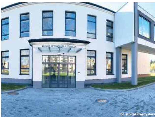
fol. szpital Krasnostaw

W odpowiedzi na rosnące potrzeby mieszkańców samorząd podjął decyzję o rozbudowie Zakładu Opiekuńczo-