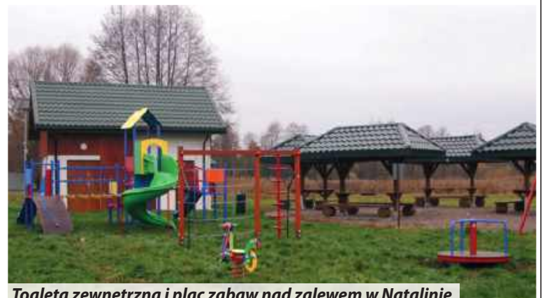
Toaleta zewnętrzna i plac zabaw nad zalewem w Natalinie

W ramach Chełmskiego Obszaru Funkcjonalnego uzyskano dofinansowanie na termomodernizację budynków użyteczności publicznej tj. budynku Gminnego Ośrodka Pomocy Społecznej, a także budynku Punktu Przedszkolnego „Tęczowa Kraina” w Strachosławiu w kwocie 755 000 zł. Również z CHOF pozyskano dofinansowanie w wysokości 698 000 zł na zagospodarowanie terenu