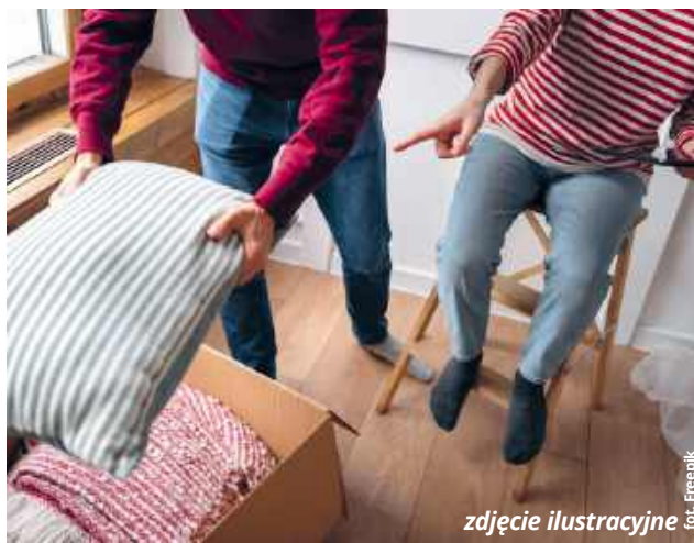
zdjęcie ilustracyjne

- Wartość tego projektu to prawie 600 tys. zł. Jeśli idzie o środki własne, to musielibymy przygotować na ten cel 116 tys. zł - powiedziała Anna Flisiuk . RC