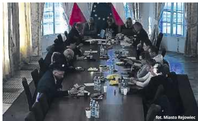
fol. Miasto Rejowiec

w Lublinie pozytywnie zaopiniował złożone w październiku tego roku wnioski w sprawie remontu chodnika przy ul. Kościuszki oraz budowy chodnika przy ul. Chełmskiej. Realizacja tych zadań uzależniona jest jednak od tego, czy zostaną ujęte w budżecie na przyszły, 2025 rok - wyjaśniła pod koniec ubiegłego roku przewodnicząca Nowak .