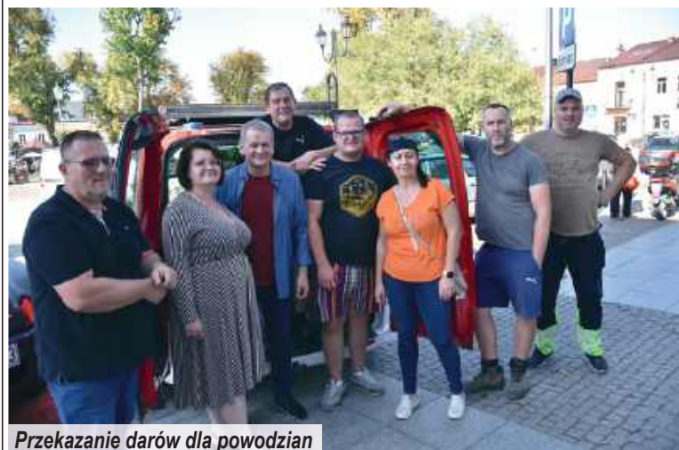
Przekazanie darów dla powodziar

W przyszłym roku Gmina Fajstławice planuje wydać na inwestycje blisko 13 mln zł, za które zrealizuje szeroką gamę projektowych zadań.