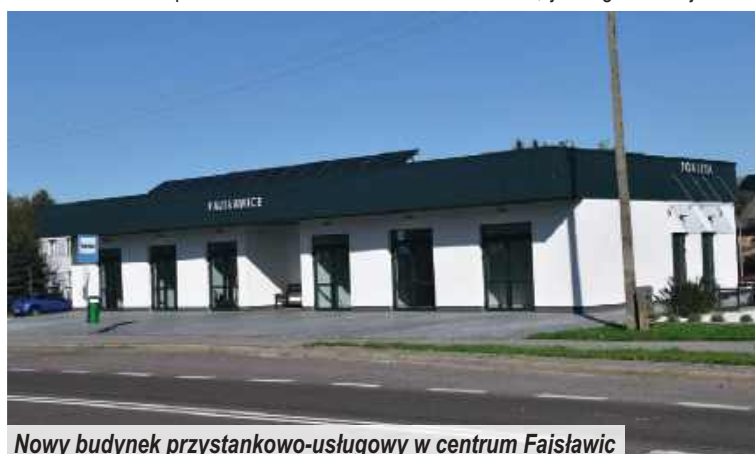
Nowy budynek przystankowo-usługowy w centrum Fajstławic

tem Krasnostawskim na prawie półkilometrowym odcinku powstała nowa nawierzchnia asfaltowa o szerokości jezdni 5,5 m. W ramach zadania przebudowano również