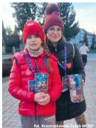
fol. Krasnostawski Sztab WOŚP