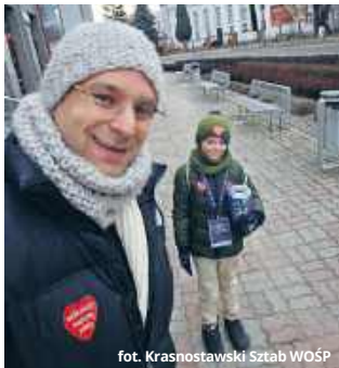
fol. Krasnostawski Sztab WOŚP

● KRASNYSTAW Mieszkańcy Krasnegostawu po raz kolejny udowodnili, że mają wielkie serca i potrafią się jednoczyć w szczytnym celu. Podczas tegorocznego finału Wielkiej Orkiestry Świątecznej Pomocy lokalna społeczność zebrała 92 454,38 złotych, bijąc dotychczasowy rekord! Ale to nie wszystko, kwota jeszcze wzrośnie!