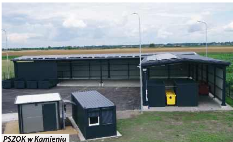
PSZOK w Kamieniu

Wybudowano profesjonalny i pierwszy w powiecie Punkt Selektywnego Zbierania Odpadów Komunalnych w Kamieniu za kwotę 2 205 500 zł przy wkładzie własnym