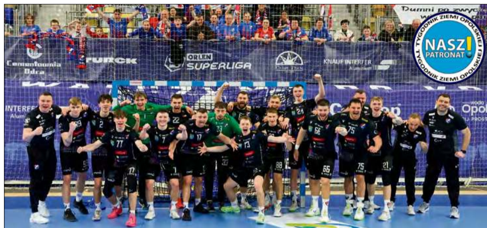
Dzięki tym trzem punktom Gwardia po niezwykle trudnym sezonie może być pewna utrzymania w Orlen Superlidze.

Mecz 24. serii Orlen Superligi był wyjątkowo zacięty. Walka pomiędzy Corotop Gwardią Opole, a Piotrkowianinem Piotrkowem Trybunalskim toczyła się do ostatniej minuty. Ostatecznie to Opolanie wywalczyli zwycięstwo 27:25 i zapewnili sobie utrzymanie w najwyższej klasie rozrywkowej.