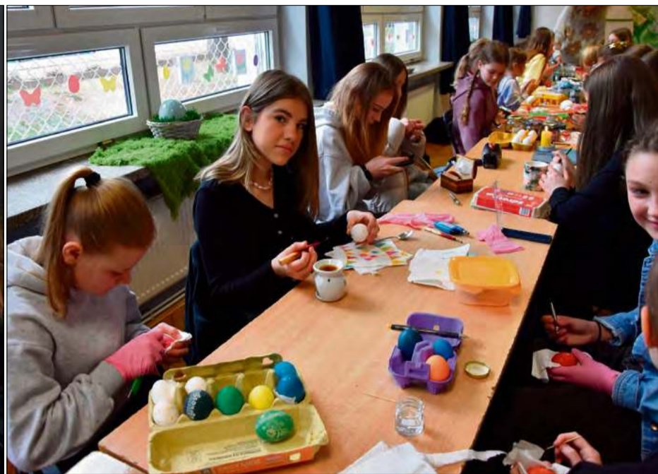
XXIV Gminny Konkurs Kroszonkarski.

dopuszczamy różne techniki zdobienia jajek. Chcemy również pobudzać inwencję twórczą oraz promować dziecięcą twórczość. Nasi uczniowie już na początku marca dopytywali, kiedy odbędzie się konkurs.