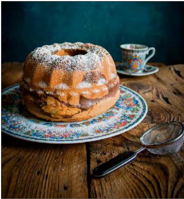
Babka zista, zwana ucieraną czy piaskową, podawana jest w kilku wariantach smakowych.

Do popularnych należą też kruche ciastka – nazywane kekсы - wyciskane przez maszynkę do mięsa. To wypiek obecny niemal w każdym domu, przygotowywany na różne uroczystości – od świąt, przez wesela, po