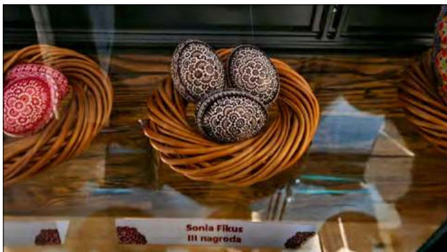
Kroszonki Soni Fikus wykonane techniką rytowniczą.