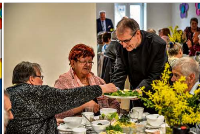
Mieszkańcy gminy cyklicznie spotykają się na wielkanocnych śniadaniach.

S eniorzy z sześciu klubów działających na terenie gminy Dąbrowa wzięli udział w uroczystym śniadaniu wielkanocnym. Wydarzenie, które odbyło się w Centrum Aktywności Lokalnej w Chróście miało wyjątkowy,