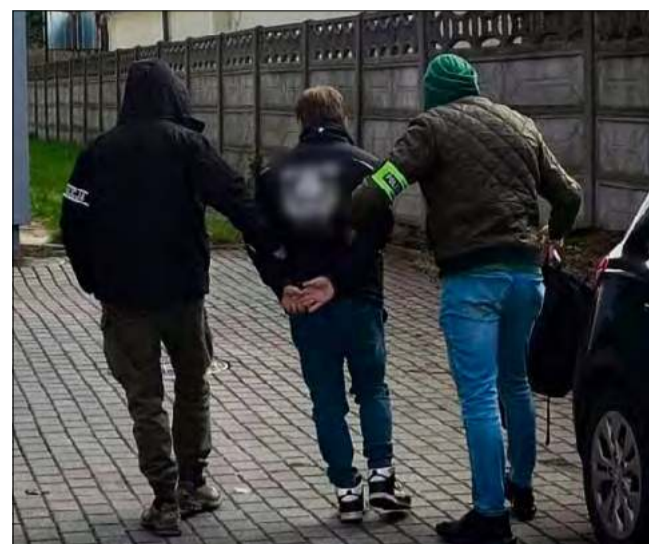
Na cmentarzu zatrzymany zniszczył 15 nagrobków.

Nad sprawą pracują funkcjonariusze z Komisarjatu I Policji w Opolu, do których wpłynęło zgłoszenie od osoby zwiedzającej cmentarz o tym, że 27 marca około godz. 23.00 zniszczono kilkanaście nagrobków. Po otrzymaniu zgłoszenia mundurowi niezwłocznie podjęli czynności, które doprowadziły do ustalenia tożsamości podejrzanego. Mężczyzna został zatrzymany 30 marca w godzinach porannych przez kryminalnych. 27-latek usłyszał już zarzut dotyczący zbezczesz-