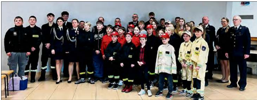
Laureaci gminnych eliminacji Ogólnopolskiego Turnieju Wiedzy Pożarniczej „Młodzież Zapobiega Pożarom”

Wydarzenie cieszyło się dużym zainteresowaniem ze strony uczestników. W tym roku w gminnej odsłonie Ogólnopolskiego Turnieju Wiedzy Pożarniczej „Młodzież Zapobiega