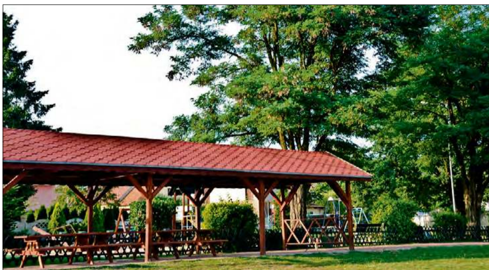
Jeśli gmina otrzyma wsparcie z EIS, to w Osinach powstanie kontenerowa świetlica.