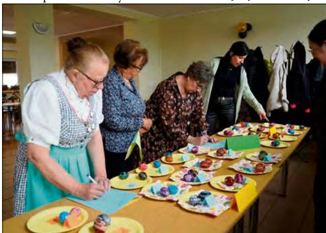
Komisja konkursowa nie miała łatwego zadania.