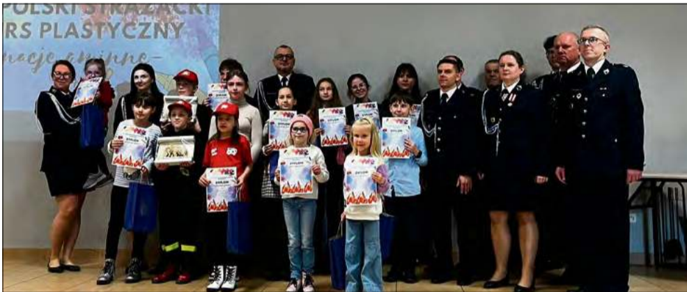
Organizatorzy podkreślają, że konkurs ma charakter artystyczny oraz edukacyjny.

P odsumowano etap gminny Ogólnopolskiego Strażackiego Konkursu Plastycznego, którego tematem przewodnim było „OSP – strażacy w służbie drugiemu człowiekowi, nie tylko w czasie pożaru”. Uroczyste wręczenie nagród było okazją do docenienia talentu i zaangażowania mieszkańców gminy Ozimek, którzy poprzez swoje prace pokazali, jak postrzegają służbę strażaków oraz zagadnienia związane z bezpieczeństwem.