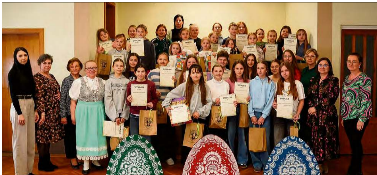
W tegorocznej edycji konkursu wzięli udział uczniowie wszystkich szkół z terenu gminy, wyłonieni we wcześniejszych szkolnych eliminacjach.

W tegorocznej edycji konkursu wzięli udział uczniowie wszystkich szkół z terenu gminy, wyłonieni we wcześniejszych szkolnych eliminacjach. Młodzież rywalizowała w dwóch kategoriach: „Kroszonki” oraz „Praca tradycyjna i innowacyjna”. Na wykonanie swoich prac uczestnicy mieli