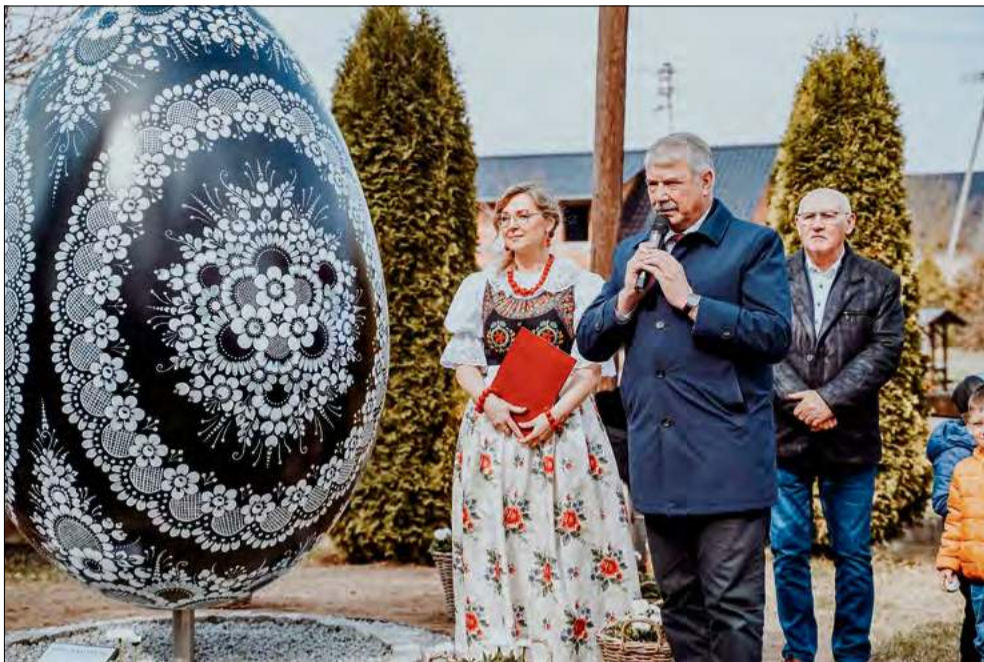
To było wielkie wydarzenie nie tylko w Dębku, ale także w całej gminie Chrzastowice.