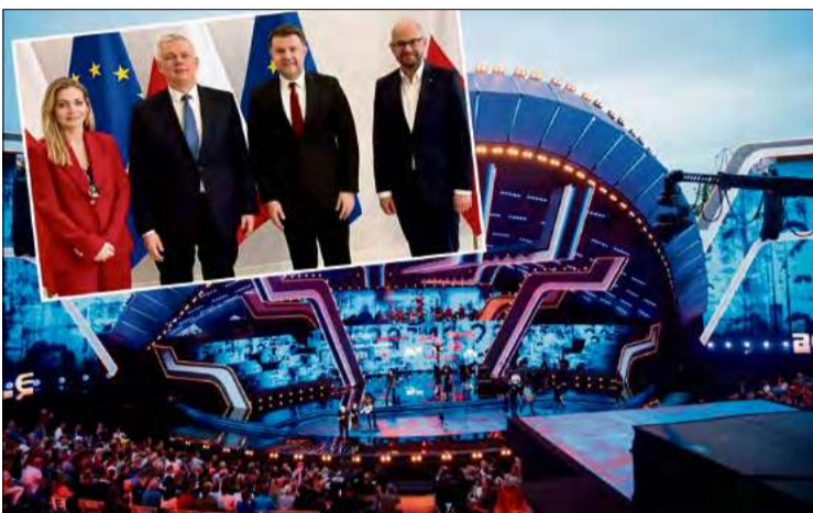
Zarówno Ratusz jak i Urząd Marszałkowski patronują pomysłowi zadaszenia widowni amfiteatru.