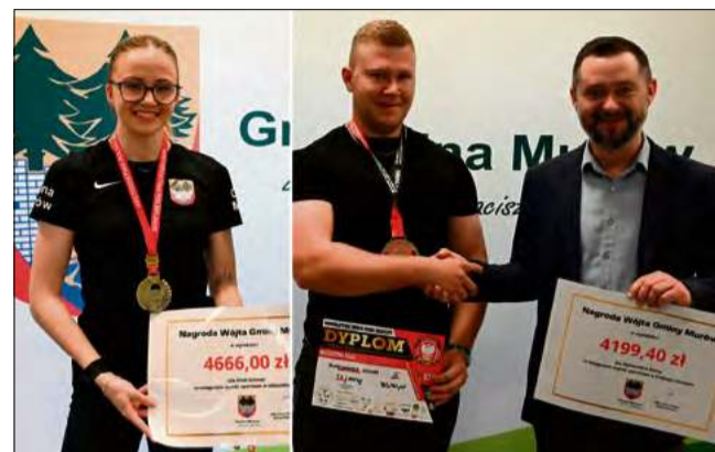
Władze gminy złożyły gratulacje oraz wyraziły nadzieję na dalszy rozwój kariery sportowej wyróżnionych.

W uzasadnieniu podkreślono, że osiągnięcia te są efektem konsekwentnej pracy i zaangażowania obojga za-