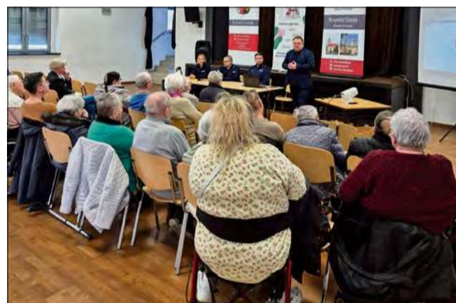
Spotkania zorganizowano w mieście Prószkowie oraz czterech sołectwach.

- W przypadku podejrzanych SMS-ów czy maili należy przede wszystkim zachować spokój i nie klikać w linki ani załączniki - wyjaśnia pod-