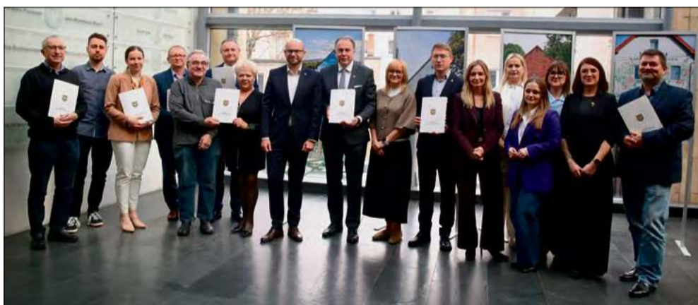
W ramach projektu odbędą się m.in. warsztaty muzyczne dla dzieci i młodzieży.

P ředstawiciele gminy Prószków podpisali umowę na realizację projektu „Muzyka łączy pokolenia”, wybranego w ramach 8.edycji Marszałkowskiego Budżetu Obywatelskiego. Projekt będzie realizowany przez Młodzieżową Orkiestrę Dętą „Kaprys”, a na jego wykonanie w 2026 roku przeznaczono 75 tys. zł.