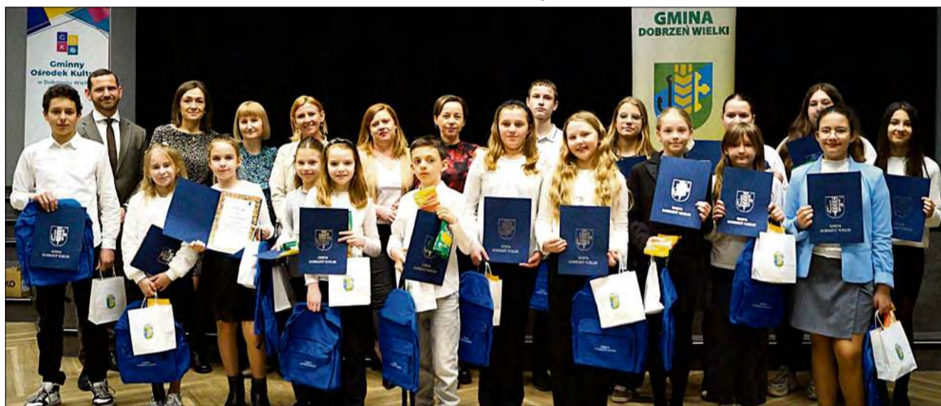
19 marca odbył się gminny etap XXXII Konkursu Recytatorskiego w języku niemieckim „Jugend trägt Gedichte vor”.

W Gminnym Ośrodku Kultury w Dobrzaniu Wielkim rozstrzygnięto gminny etap XXXII Konkursu Recytatorskiego w języku niemieckim „Jugend trägt Gedichte vor”. W zmaganiach wzięło udział 25 uczniów z trzech podstawówek, a komisja wyłoniła laureatów w trzech kategoriach wiekowych. Zwycięzcy reprezentują gminę podczas etapu rejonowego, który odbędzie się w kwietniu w Łubnianach.