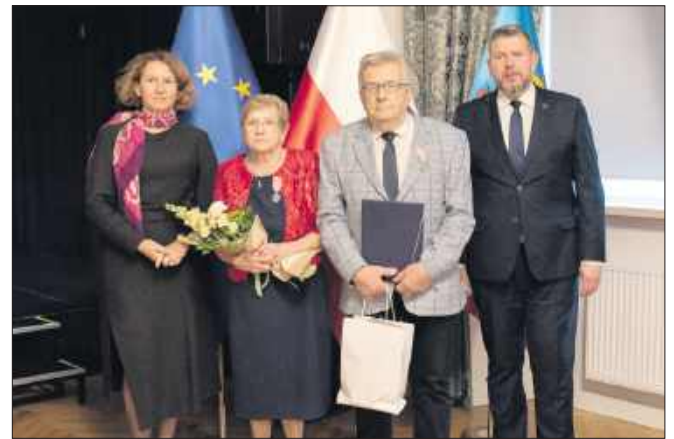
■ 50 Wita Franciszek i Łucja