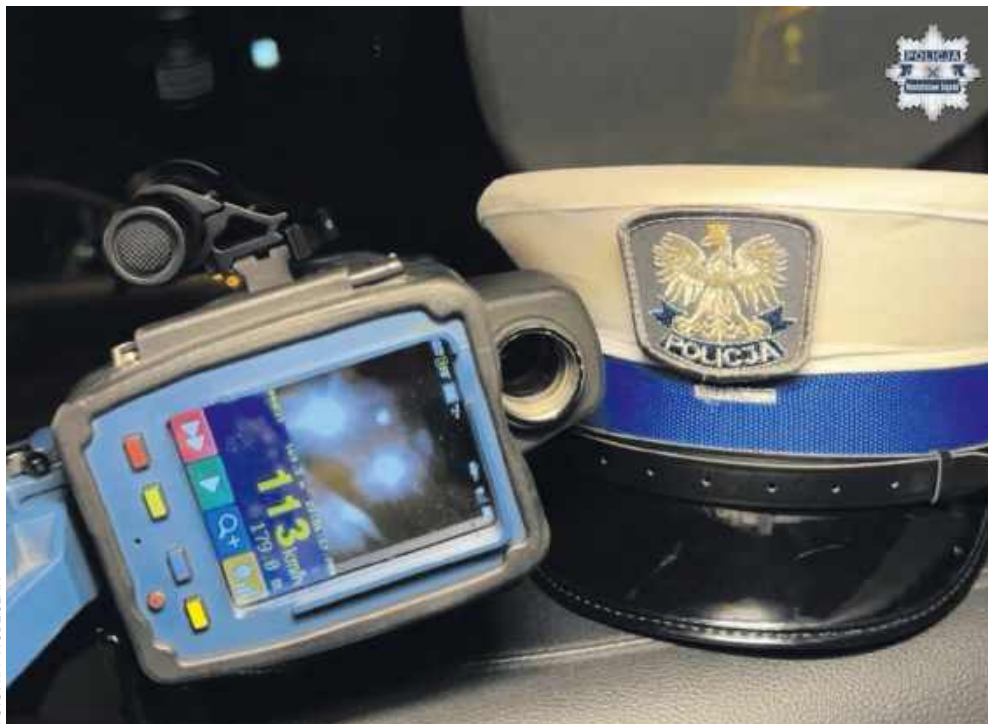
■ 43-latek z powiatu cieszyńskiego pędził przez Mszaną z prędkością ponad 110 km/h.

Mężczyzna został ukarany mandatem w wysokości 2000 zł, otrzymał 14 punktów karnych i stracił prawo jazdy na trzy miesiące. Policjanci apelują o rozsądek za kierownicą i przypominają, że nadmierna prędkość wciąż pozostaje jedną z głównych