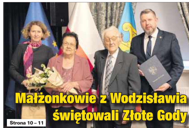
Małżonkowie z Wodzisławia świętowali Złote Gody