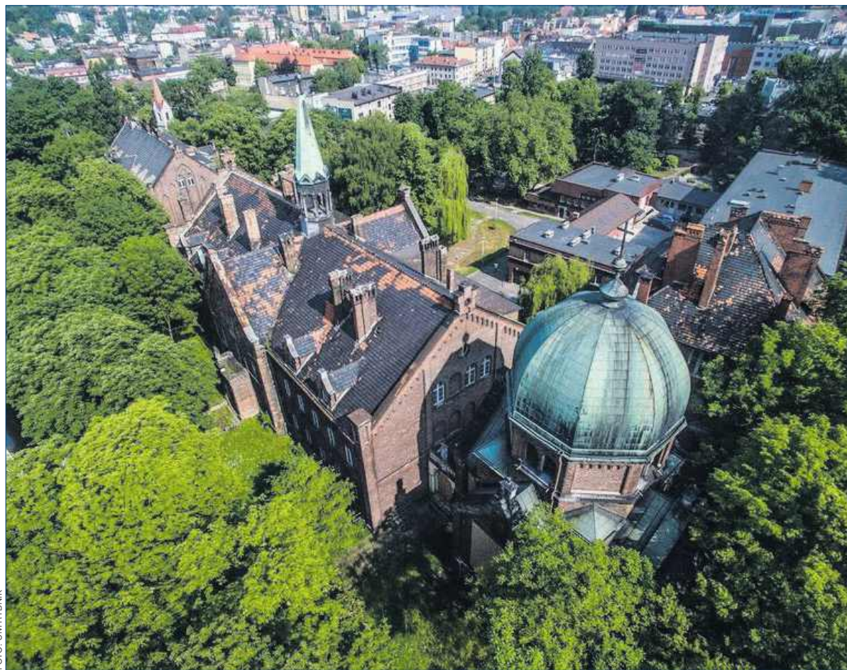
■ Dawna kaplica i kompleks szpitalny Juliusz położony w centrum Rybnika.

Po publikacji oświadczenia duchowny nie pozostał dłużny. – Kłamstwo idzie w zaparte.