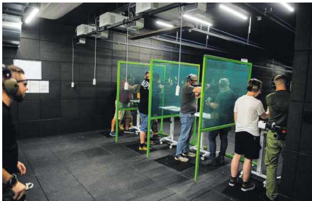
■ Na strzelnicy można trenować na czterech stanowiskach

W tym roku Rydułtowy po raz pierwszy dołączyły do ogólnoregionalnej akcji „RowerON 2025 -wsiadaj na koło, będzie wesoło!”, organizowanej przez Wydawnictwo Nowiny. Rydułtowy znalazły się na trasie „Skałkowej”. Uczestnicy przejechać mogą m.in. przez centrum przesiadkowe, tężnię solankową – miejsce idealne na chwilę relaksu – oraz punkt zdjęciowy przy tzw. „skałce”, czyli wyjątkowym stanowisku dokumentacyjnym przyrody nieożywionej. To świetna okazja, by zobaczyć nasze miasto z zupełnie nowej perspektywy! Pełne informacje o trasach, punktach kontrolnych i zasadach udziału można znaleźć na stronie: www.roweron.pl .