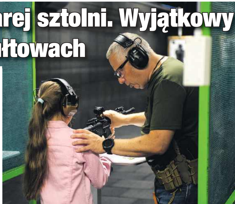
■ Instruktorzy przekazują wiedzę o strzelectwie i bezpieczeństwie osobom w każdym wieku

To prawda. Strzelnicę ma pod swoją pieczęć Pszowskie Stowarzyszenie Strzeleckie Kaliber. Wybór partnera nastąpił na podstawie art.39 ustawy z dnia 28. kwietnia