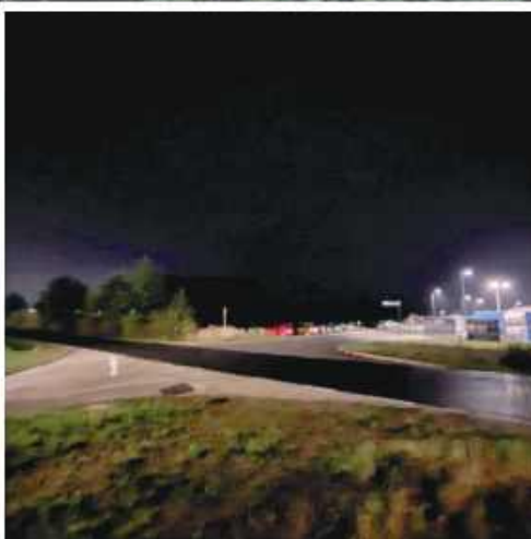
■ Prace mają się rozpocząć jeszcze w tym roku.

Jak się okazało ma tam powstać rondo, zaś prace ruszą jeszcze w tym roku.