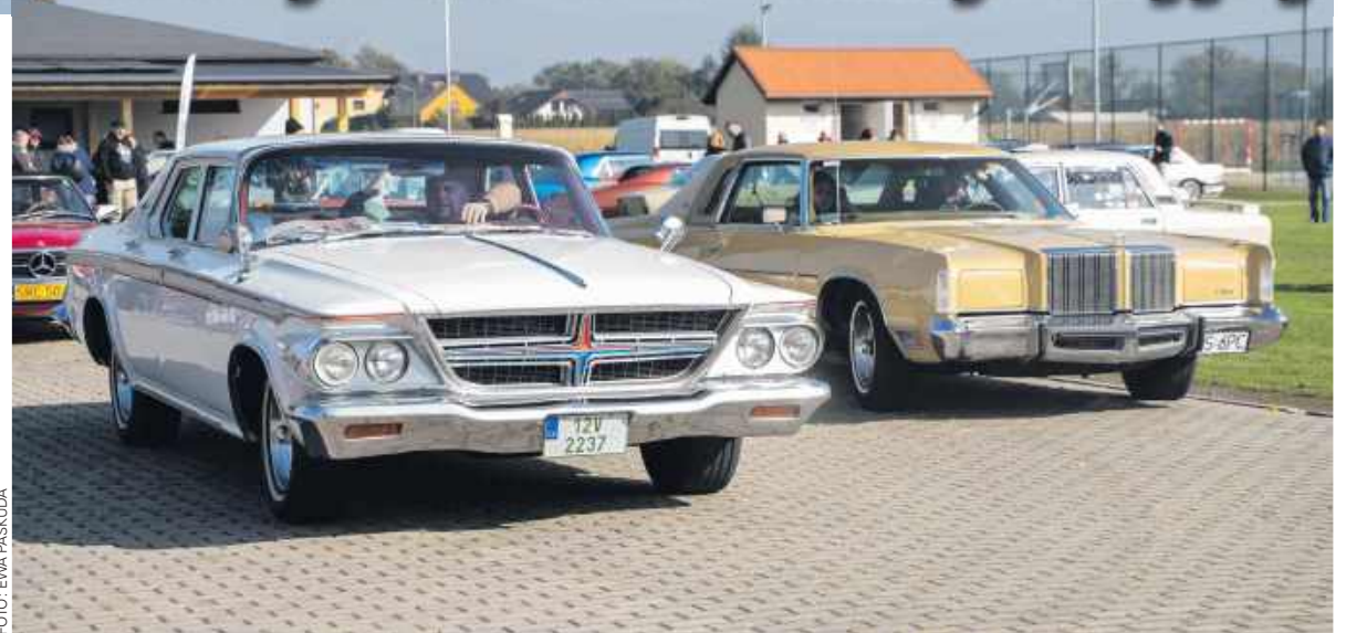
■ Zabytkowe amerykańskie klasyki – przede wszystkim Cadillaci oraz Fordy, które zachwycały elegancją, chromowanymi detalami i charakterystyczną sylwetką,

Różnorodność pojazdów sprawiła, że każdy miłośnik motoryzacji mógł znaleźć coś dla siebie