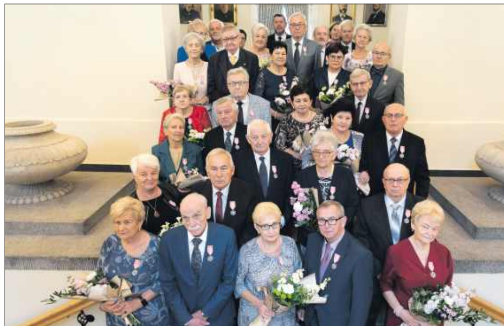
Wspólne zdjęcie par świętujących Złote Gody