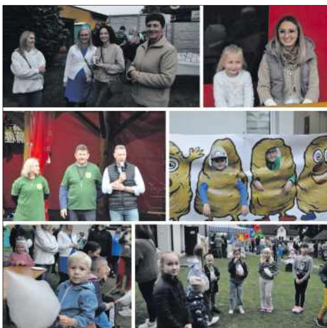
■ Wspólne świętowanie w Bluszczowie.

W programie wystąpili: dzieci ze Szkoły Podstawowej im. Powstańców Śląskich w Bluszczowie oraz zespoły artystyczne działające przy Gminnym Centrum Kultury w Gorzycach: „Bluszcz”, „Gorzycanie” i „ATB”. Ponadto