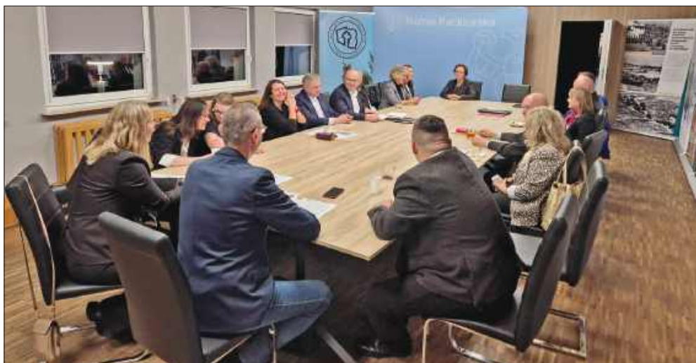
■ Forum Szlaku Cysterskiego w Rudach to ogólnopolskie spotkanie historyków, samorządowców i miłośników kultury