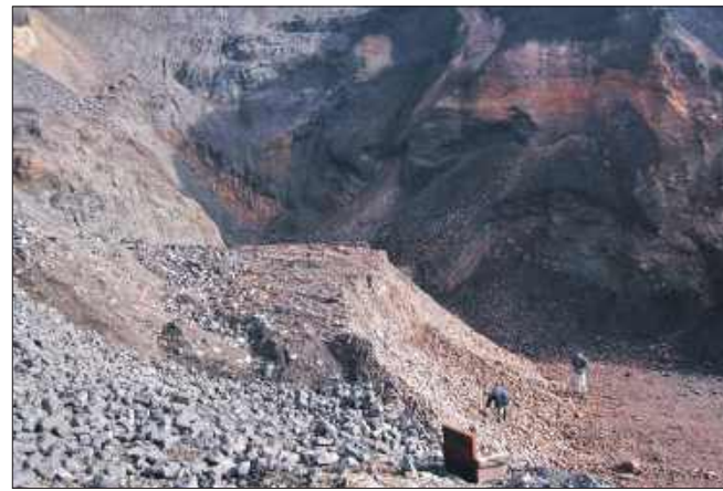
■ Pyły, odpady i wody z kopalń. O tym debatowano w siedzibie urzędu górniczego

Rozmawiano również o zasadach gospodarki