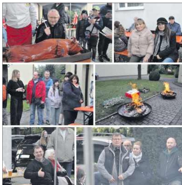
■ Wspólne świętowanie, rozmowy i muzyka sprawiły, że tegoroczne powitanie jesieni w Kokoszyckach zyskało niepowtarzalny charakter.