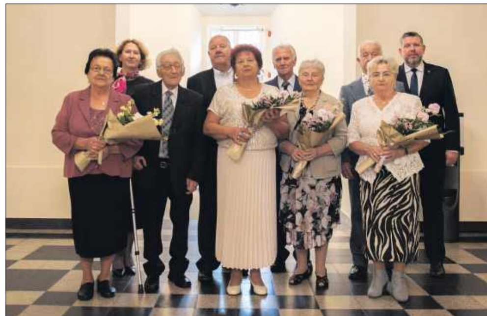
Pary świętujące 55, 60 i 65 lat pożycia małżeńskiego