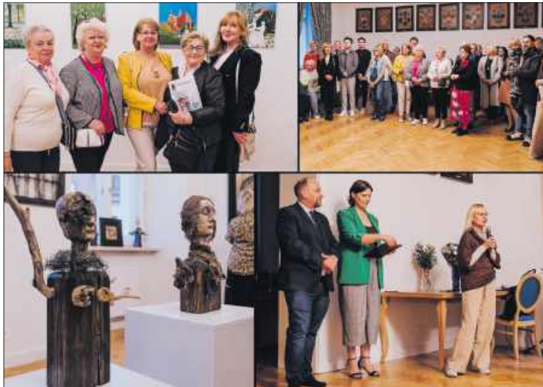
■ Podwójny wernisaż w Pałacu Dietrichsteinów odbył się w piątek 26 września