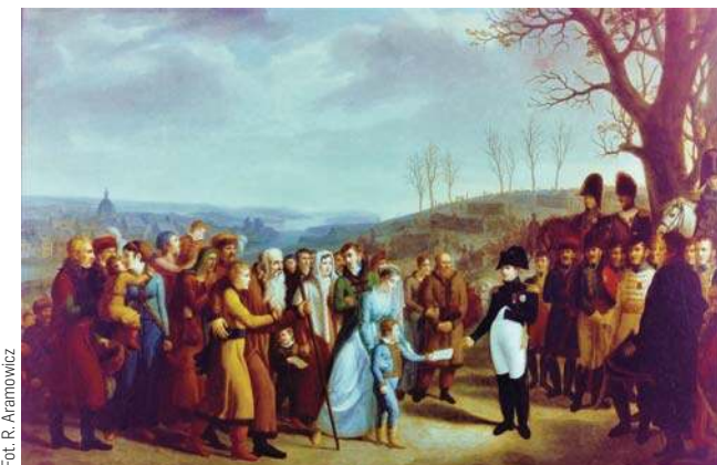
„Napoleon udziela łask mieszkańcom Ostródy. Marzec 1807”. Fotograficzna reprodukcja oryginału z Muzeum w Wersalu