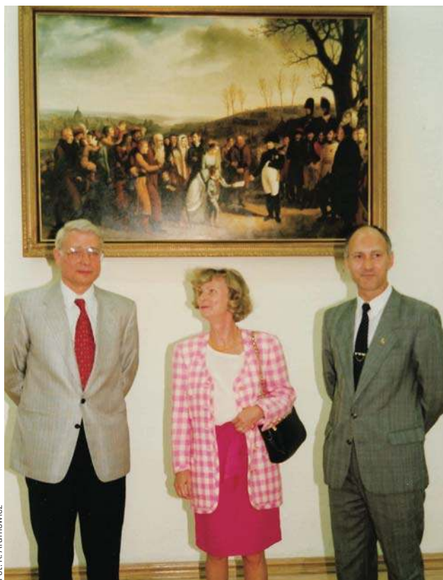
Rozmowy z darczyńcami