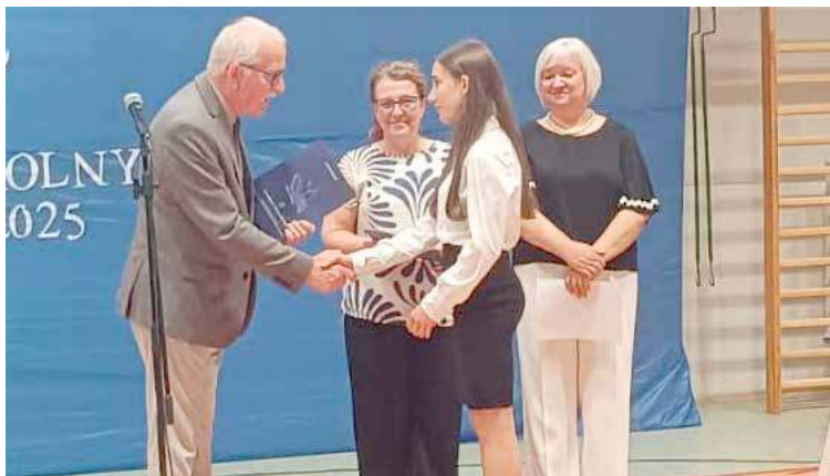
W szkołach Gminy Stepnica wręczano nagrody dla uczniów za szczególne osiągnięcia

Szkolnej pracy dobiegł koniec i nadeszły wakacje. Uczniowie szkół na terenie Gmin Stepnica, Maszewo i Przybiernów pożegnali szkolne mury na najbliższe dwa miesiące.