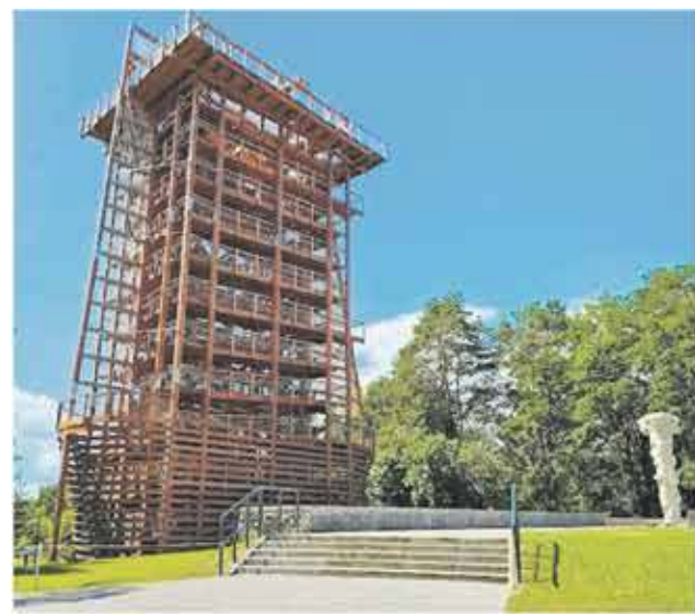
Wieża widokowa, Wolin