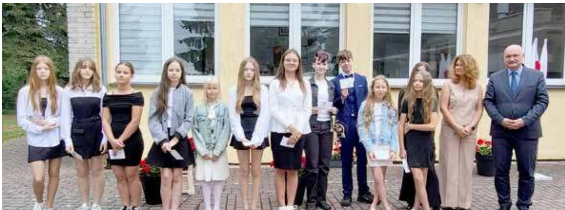
Uczniowie pożegnali mury szkolne (fot. Gm. Maszewo)

składają Burmistrz Miasta i Gminy Stepnica wraz z pracownikami