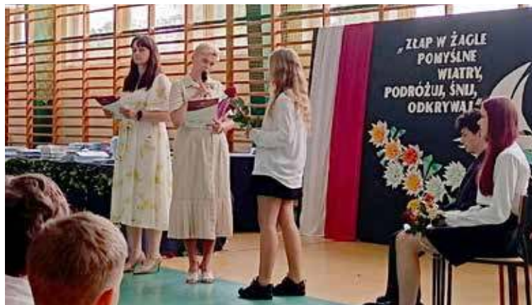
Zakończenia roku odbyły się w Gminie Przybiernów