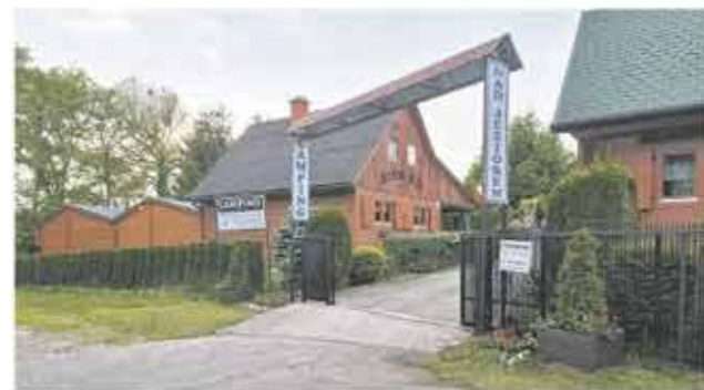
Camping „Nad jeziorem” nr 131, Golczewo