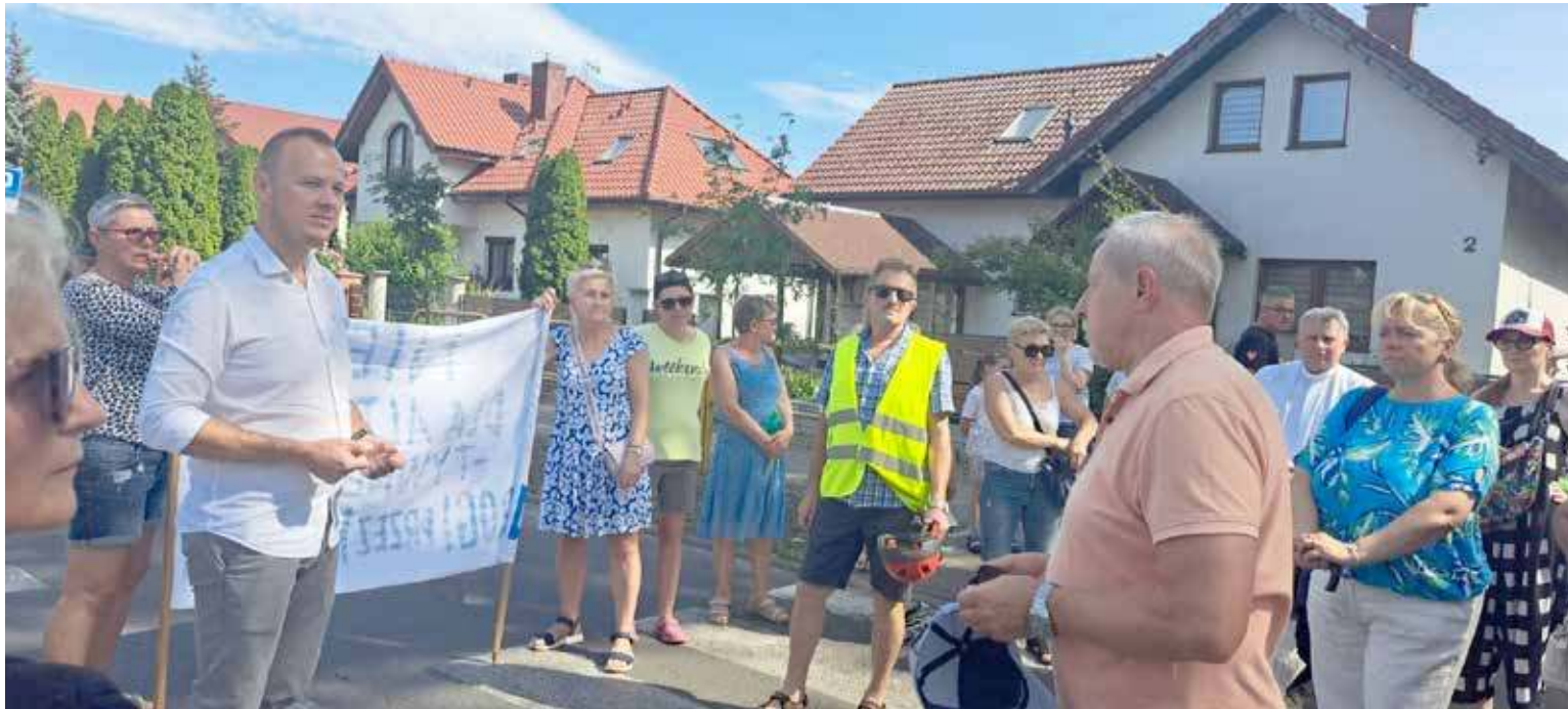
Protest odbył się w Kliniskach

W związku z tym od pewnego czasu mieszkańcy coraz aktywniej protestują w tej sprawie. W ostatnich dniach zaś ów sprzeciw przybrał formę protestu. W niedzielę, 22 czerwca, odbył się tam protest. Mieszkańcy zebrali się na parking przy sklepie Dino i wyrazili swój sprzeciw takiemu stanowi rzeczy. Prócz protestowania przeciwko rozjeżdżaniu drogi, chodników, hałasowi i niebezpiecznym sytuacjom spowodowanym przez pojazdy