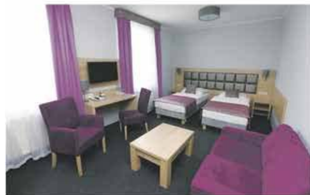
Hotel JF Duet, Goleniów