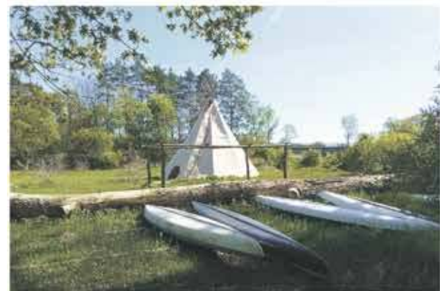
Splywy Iną, Inica