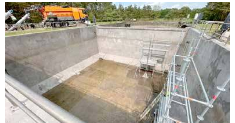
Remont oczyszczalni trwa