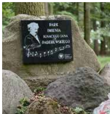
Kwiaty zostały złożone pod tablicą pamiątkową

W uroczystości udział wzięli reprezentanci lokalnego samo-