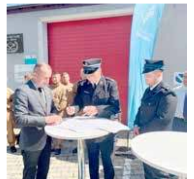
Remont oczyszczalni trwa