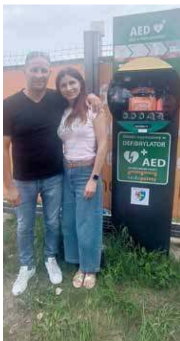
Urządzenie zawieszono przy ulicy Golczewskiej

- Zależy nam na wspieraniu mieszkańców i dbaniu o zdrowie oraz życie – to dla nas coś więcej niż działalność gospodarcza. To część naszej odpowiedzialności za miejsce, w którym działamy i ży-