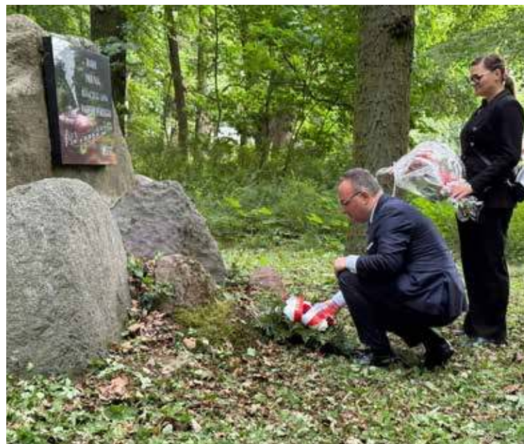
Reprezentanci samorządu oraz IPN złożyli kwiaty