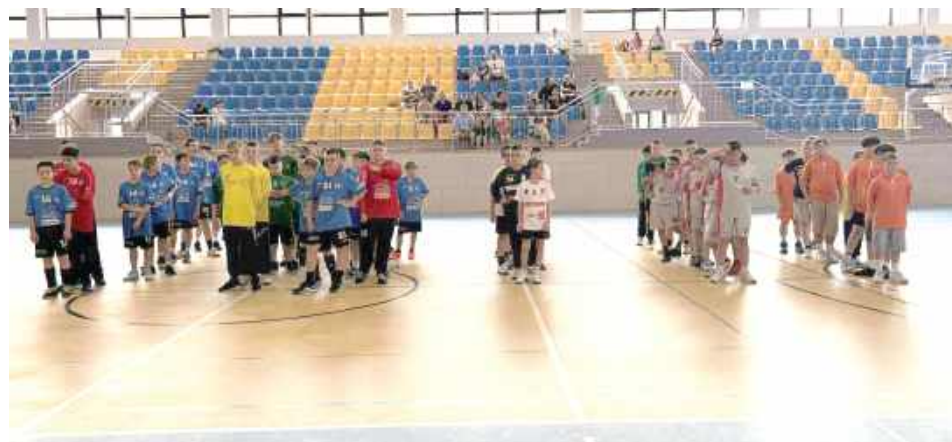
Młodzi szczypiorniści z sześciu miast, walczyli o puchar w Biłgoraju

Młodzi szczypiorniści walczyli w Biłgoraju w turnieju mini piłki ręcznej o Puchar Dyrektora Powiatowego Centrum Sportu. Rywalizowali w dwóch kategoriach wiekowych - rocznik 2014 oraz rocznik 2013.