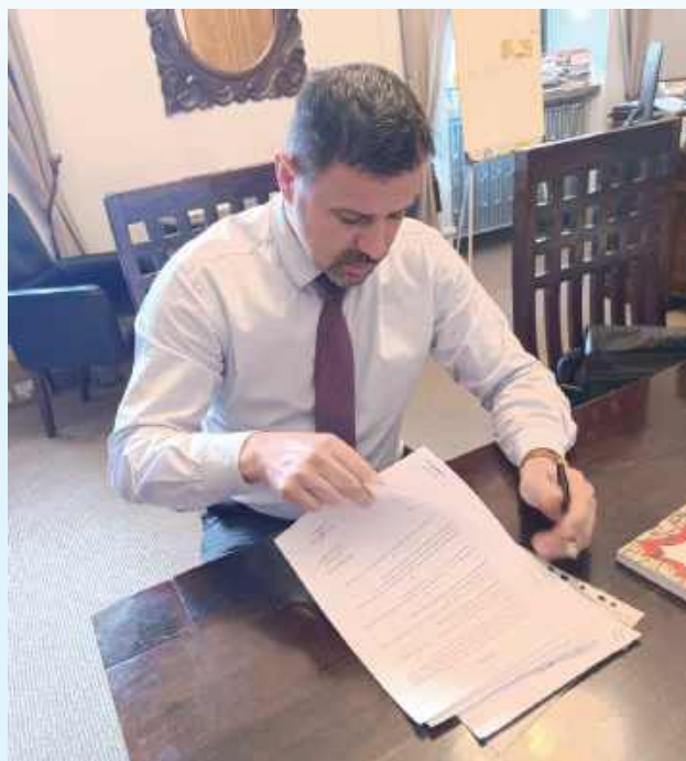
Prezydent Zamościa napisał do mieszkańców tuż po ogłoszeniu wyników wyborów prezydenckich

Drodzy Mieszkańcy, za nami wybory prezydenckie. Jakie były dla nas Zamościan ważne - i emocjonujące - świadczy bardzo duża frekwencja. Swoją rolę, korzystając z przywileju wolności, oddało 30 tysięcy 474 Zamościan. To aż 68,17 procent. Za każdy głos - absolutnie wszystkim, bez względu na sympatie i wybór kandydata - bardzo dziękuję. Tak duża obecność przy urnach wyborczych świadczy o tym, że nie tylko chcemy świadomie korzystać ze swoich praw obywatelskich, ale przede wszystkim zależy nam na przyszłości.