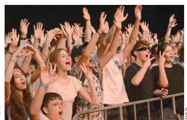
Publiczność szalała podczas koncertów