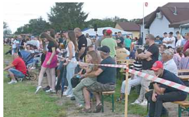
Poczyniom strażakom przyglądali się mieszkańcy