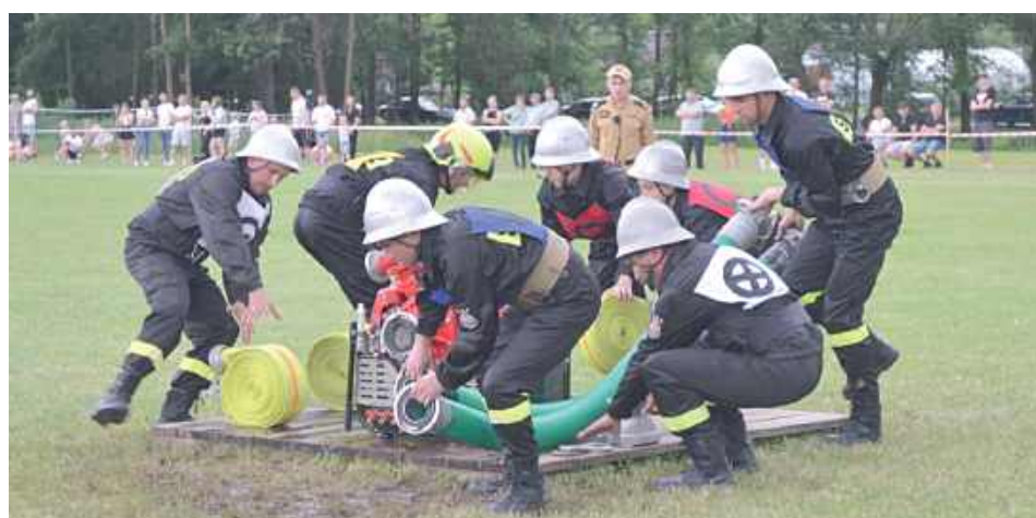
Momentami było bardzo gorąco...