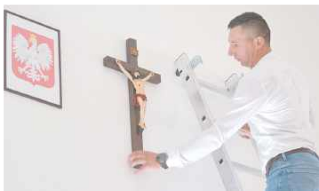
Uroczyste zawieszenie krzyża

Po Mszy Świętej, koncelebrowanej przez bpa Mariusza Rojka, ordynariusza diecezji zamojsko-lubaczowskiej na-