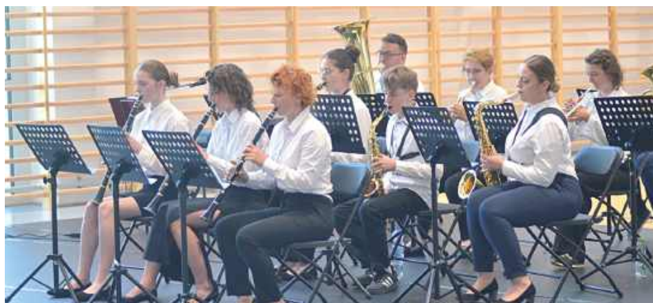
Gminna Orkiestra Dęta w Potoku Górnym usławiła uroczystości