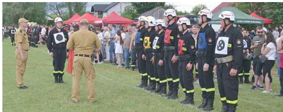
Zbiórka przed startem

W niedzielę (8 czerwca) przeprowadzono zawody strażackie w Płusach. Udział w nim wzięło 30 zespołów męskich i 3 żeńskie. Zawody odbywały się w trzech konkurencjach: musztra, sztafeta 7x50 i ćwiczenia bojowe. W zawodach wzięły zespoły OSP z gmin Ksieźpol, Biszcza, Potok Górny i Tarnogród.