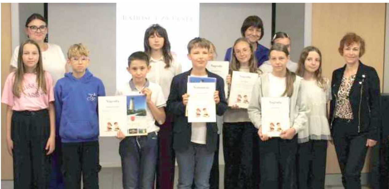
Im czytanie sprawia wielką radość!

Eliminacje gminne odbyły się we wtorek, 3 czerwca, w Miejskiej Bibliotece Publicznej w Józefowie. Wzięło w nich udział dziesięcioro uczniów, których zadaniem było piękne prze-