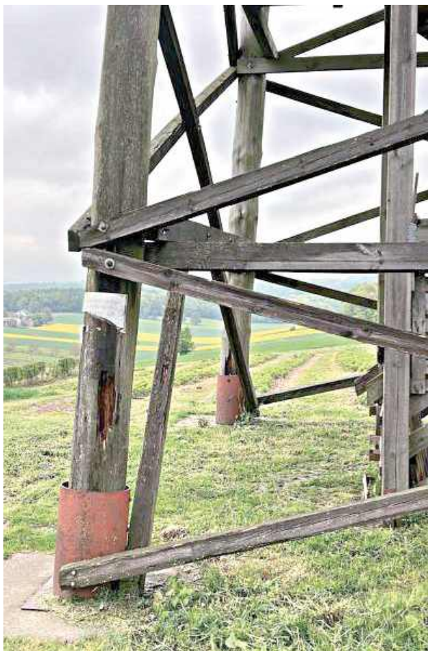
Wieża widokowa w Hoszni Ordynackiej niszczeje i jest zamknięta od lat

Sprawa nie kończy się na wieży. Od trzynastu lat zamknięty pozostaje również zbiornik wodny w Goraju. „Niegdyś popularne miejsce rekreacji dziś strasznie pustką” – czytamy w liście mieszkańców. Dla porównania: w sąsiedniej gminie Turobin powstaje nowy zalew, od podstaw, z częściowym dofinansowaniem zewnętrznym. „W Goraju wystarczyłoby zrewitalizować istniejący zbiornik. Ale tu zawsze jest brak pieniędzy” – komentują autorzy listu.