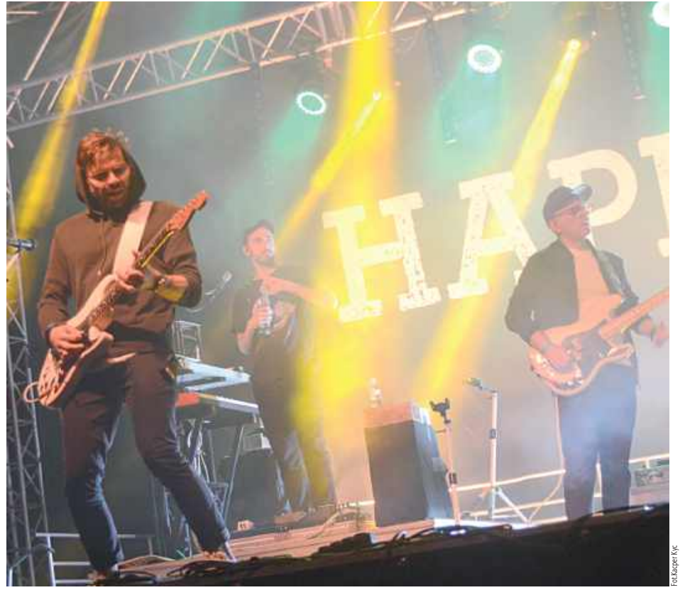
Kiedy Happysad wyszedł na scenę, zaczęło się prawdziwe show