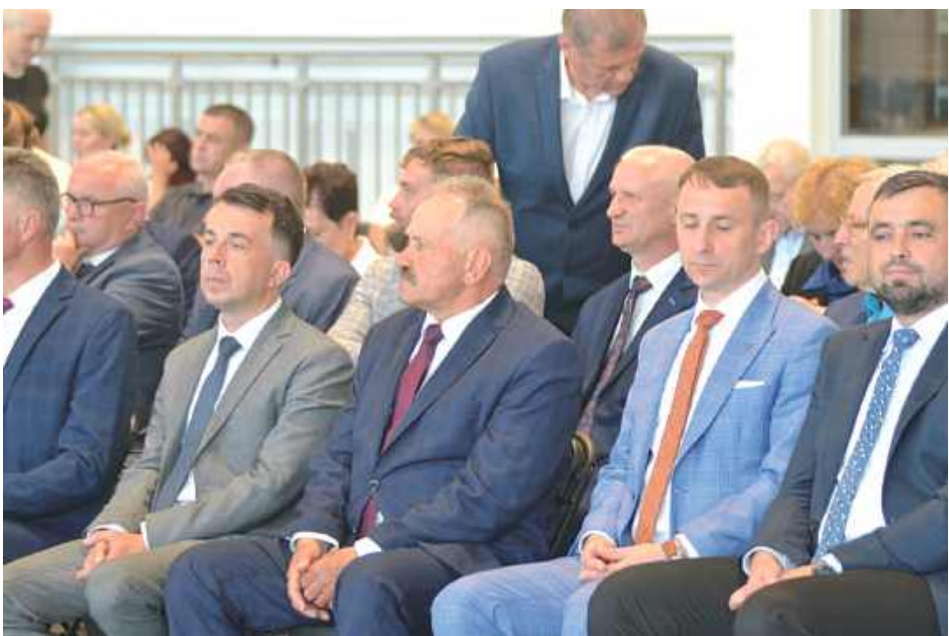
Samorządowcy z powiatu biłgorajskiego brali udział w uroczystościach