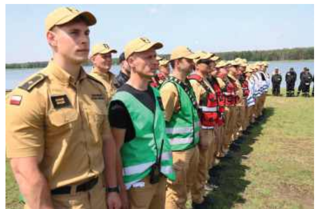
Służby w pełnej gotowości

W dniach 4-5 czerwca na terenie powiatu biłgorajskiego zostały przeprowadzone dwudniowe ćwiczenia ratownicze pod kryptonimem „BIŁGORAJ 25”.