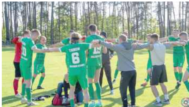
Tanew Majdan Stary ma się z czego cieszyć. Awans do IV ligi jest dosłownie o włos

Zwycięzca okręgówki bezpośrednio awansuje do IV ligi, zespół z drugiego miejsca zagra w barażach. Najpierw 18 czerwca wyjazdowy mecz