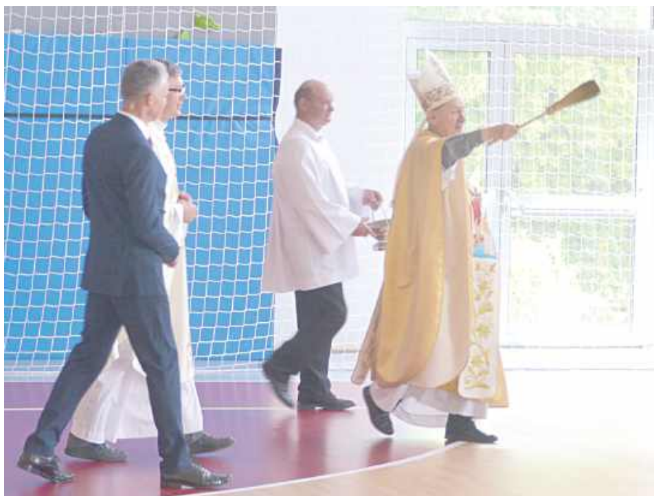
Uroczyste poświęcenie sali sportowo-rekreacyjnej

4 czerwca w Potoku Górnym odbywały się uroczystości otwarcia nowej hali sportowo-rekreacyjnej. Wartość tej inwestycji wyniosła ponad 12 mln zł.