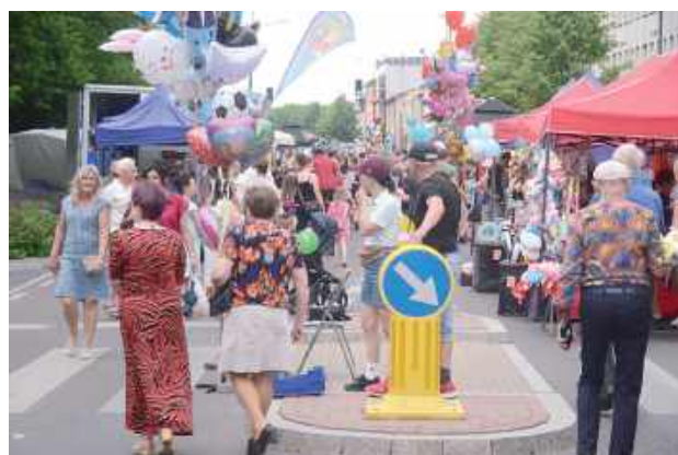
Podczas jarmarku mieszkańcy mogli kupić rękodzieła, pyszne jedzenie czy też wiele innych ciekawych rzeczy