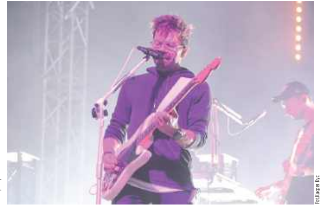
Ten koncert zostanie w pamięci Biłgoraja na długo