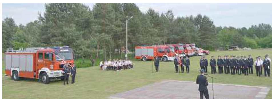
W uroczystościach udział wzięło m.in. postowie RP, delegacje OSP z gminy Biłgoraj i mieszkańcy wsi

W sobotę (7 czerwca) w Bukowie uroczyście przekazano wóz bojowy marki MAN dla miejscowego OSP. Wóz bojowy dla OSP Bukowa tak naprawdę nie jest fabrycznie nowy - należał wcześniej do PSP w Biłgoraju. Najpierw odbyła się msza św. w kościele św. Andrzeja Boboli, następnie druhowie i delegacje OSP z całej gminy Biłgoraj przemaszerowali na plac strażacki.