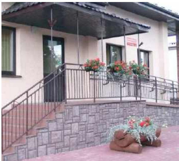
W Józefowie zmieniła się nazwa. Od 1 czerwca to już nie jest MOPS tylko Centrum Usług Społecznych

- Ośrodek Pomocy Społecznej w Józefowie został przekształcony w Centrum Usług Społecznych w odpowiedzi na rosnące