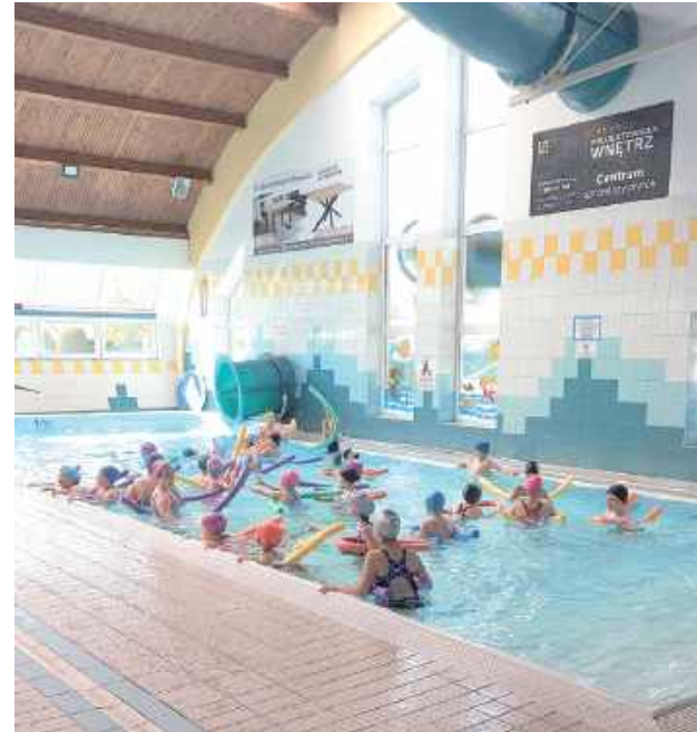
Z darmowych lekcji pływania skorzystają uczniowie klas I-III ze szkół podstawowych na terenie gminy Księżpol

Stowarzyszenie Aktywnych Mieszkańców Gminy Księżpol otrzymało dofinansowanie ze środków Funduszu Zajęć Sportowych dla Uczniów. To ponad 12,5 tysiąca złotych na organizację zajęć nauki pływania.