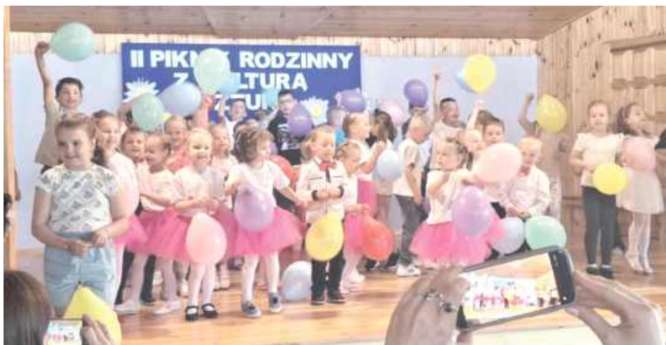
Było kolorowo i wesoło

Duże zainteresowanie wzbudziły również pokazy Ochotniczej Straży Pożarnej ze Smólska, które nie tylko prezentowały sprzęt i umiejętności strażaków, ale także pozwalały dzieciom wcielić się w rolę małych ratowników. Nie zabrakło także