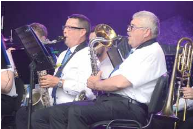
Jako pierwsi na scenie pojawili się muzycy z naszej biłgorajskiej orkiestry