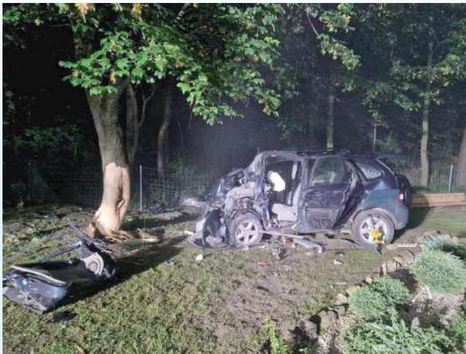
22-latka jechała bez prawa jazdy i na podwójnym gazie

Do wypadku doszło 3 czerwca około godziny 23. Według wstępnych ustaleń policji kierująca samochodem marki Renault Scenic, mieszkanka miejscowości Rachanie, jechała od strony Pasiek. Na skrzyżowaniu z drogą powiatową nie dostosowała prędkości do warunków panujących na drodze, co doprowadziło do utraty panowania nad pojazdem. Samochód wjechał do przydrożnego rowu,