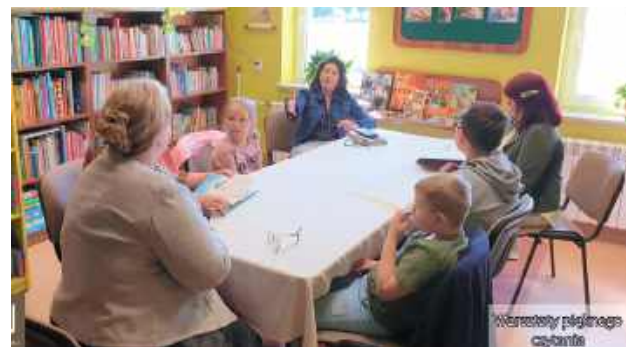
Dzieci uczyły się pięknie czytać

W piątek, w Bibliotece Publicznej Gminy Łukowa oraz jej Filii w Chmielku, odbyły się Warsztaty Pięknego Czytania – inicjatywa, która powstała jako kontynuacja konkursu „Radość Czytania”. Wydarzenie skierowane było do najmłodszych czytelników, których celem było rozwijanie umiejętności czytania na głos oraz odkrywanie