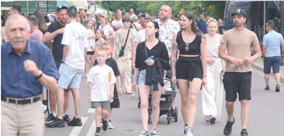
Ulica Kościuszki zamieniła się w jeden wielki chodnik