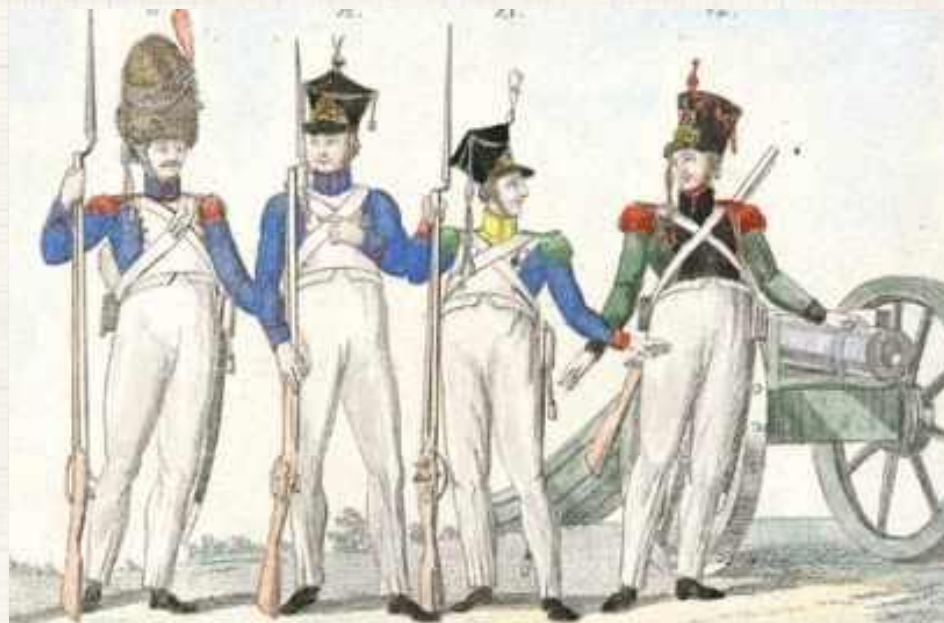
Żołnierze Księstwa Warszawskiego. Takie były widoki na Ziemi Biłgorajskiej w 1809 roku. Niestety, nie na długo, bowiem Księstwo Warszawskie istniało do 1815 roku

Do 1795 roku granica między Rzeczypospolitą a Austrią znajdowała się m.in. w Dereźni, Korczowie czy wzdłuż Tanwi. Stały się tam numerowane słupy graniczne. Podobno jeszcze w latach 90. XX wieku, na polach Dereźni Majdańskiej zostały odnalezione domniemane pozostałości po słupie granicznym. Dereźnia Solska i Majdańska są tak naprawdę jedną pozostałością po granicy polsko - austriackiej z okresu 1772-1795 roku, dlatego, że wówczas majdańska część Dereźni leżała po stronie austriackiej (i należała do klucza Majdanu Księżyńskiego), natomiast Solska po stronie