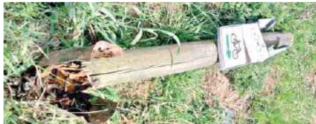
Nie został ślad po turystycznym szlaku

na dokumentację projektową nowej konstrukcji: „Obecnie trwa procedura wyłonienia autora projektu”. Nie wskazano jednak konkretnego terminu rozpoczęcia prac ani planowanej daty otwarcia.