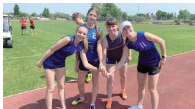
Uczennice z I LO w Biłgoraju bezkonkurencyjne w półfinale wojewódzkim Licealiady

W Biłgoraju odbył się półfinał wojewódzkiej Licealiady w Festiwalu Sztafet. I Liceum Ogólnokształcące im. ONZ w Biłgoraju reprezentowały uczennice startujące w dwóch sztafetach, po wcześniejszym zwycięstwie w etapie powiatowym.