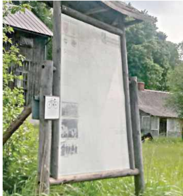
Tablice informacyjne niszczeją

W odpowiedzi na list otwarty burmistrz Goraja przyznaje, że stan wieży jest zły. Zapewnia, że w budżecie zabezpieczono środki