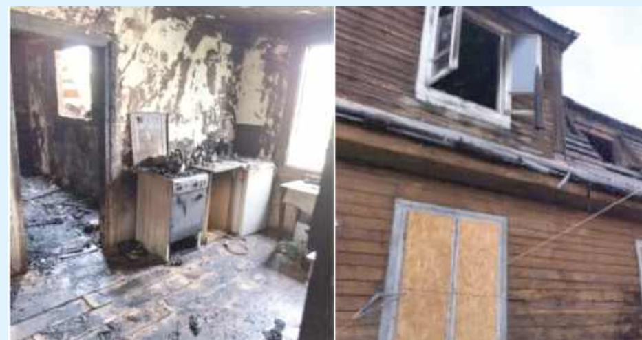
W budynku przy ulicy Odrodzenia w Zamościu, spaleni uległy dwa pomieszczenia na poddaszu

Pożar domu przy ulicy Odrodzenia w Zamościu. Ogień strawił dwa pomieszczenia budynku. Zniszczeniu uległo także znajdujące się pod tymi pomieszczeniami mieszkanie.