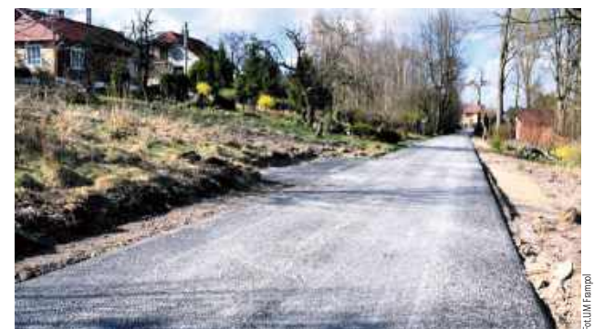
Przebudowana droga gminna w Radzięcinie jest już oddana do użytku

W ramach inwestycji wykonano drogę asfaltową o szerokości 3,5 z poszerzeniem jezdni do pięciu metrów. To w obrębie skrzyżowania z drogą powiatową 2910L. Zadanie obejmowało także obustronne utwardzenie poboczy kruszywem oraz wprowadzono stałą organizację ruchu polegającą na wykonaniu oznakowania pionowego oraz poziomego.