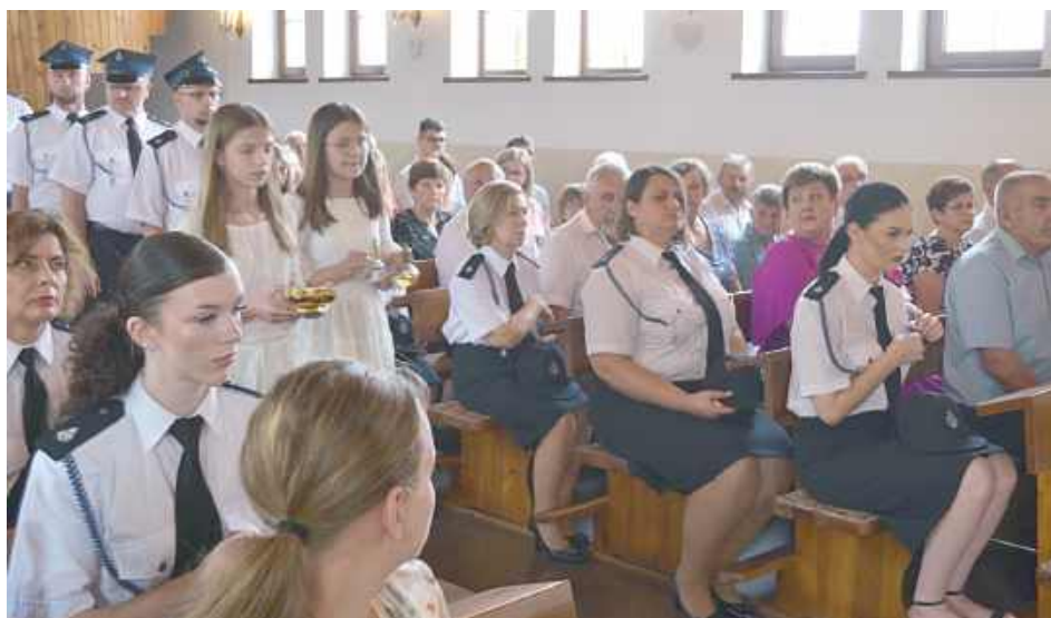
Od lat uroczystości odpustowe w Ciosmach gromadzą wielu mieszkańców