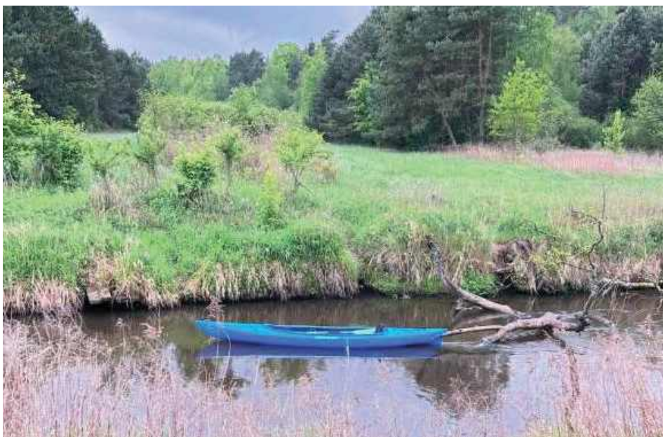
Z ustaleń wynika, że w spływie uczestniczyło 35 uczniów i sześć opiekunek z jednej ze szkół w Rzeszowie

skierowano patrole policji, które wyciągnęły z rzeki dwóch chłopców i udzieliły im pierwszej pomocy przedmedycznej. Starszy z nich miał atak paniki, a podczas próby wyjścia z kajaka wpadł do zimnej wody i był wychłodzony oraz przestraszony. Na miejsce przybyła także karetka pogotowia i ratownik zamykający spływ. Policjanci pomogli także innym chłopcom wydostać się na brzeg.