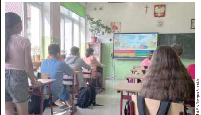
Warsztaty nt. uzależnienia od telefonu w Tereszpolu-Zaorendzie

Blisko 40 proc. osób poniżej 21. roku życia jest uzależnionych od telefonu komórkowego. W Tereszpolu przynajmniej próbują coś z tym zrobić. W miejscowej szkole były specjalne warsztaty na temat uzależnienia od telefonu.