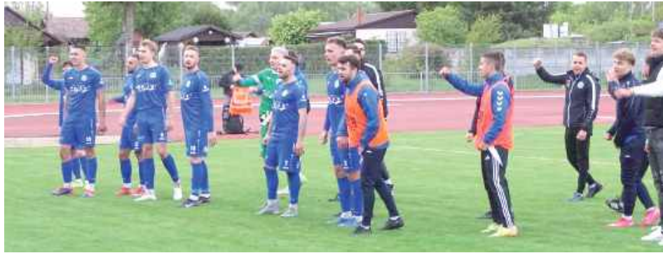
Łada 1945 Biłgoraj ma jeszcze dwie okazje do pomocowej radości. W środę Puchar Polski, a w sobotę ostatni mecz sezonu z Hetmanem Zamość. Oba spotkania w Biłgoraju