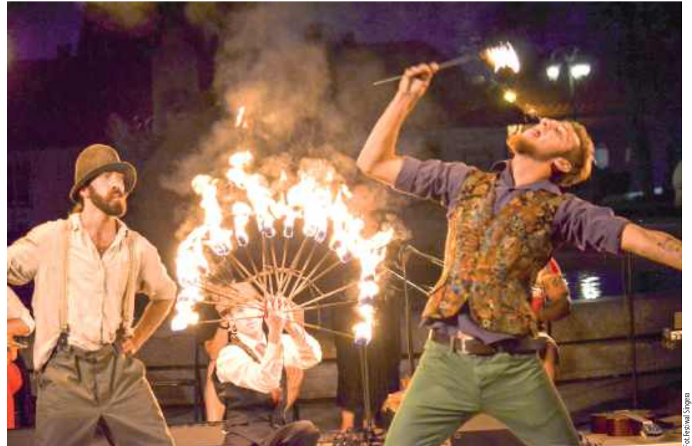
Na co dzień mieszkańcy naszych wiosek i miasteczek raczej tego nie zobaczą. Teraz takie widoki przyjadą do nich

jektacja filmu dokumentalnego, monodram - teatralna opowieść (storytelling), ale też efektowne widowisko plenerowe z udziałem artystów z Argentyny, Chile, Francji, Czech, USA i Polski. Efektowne, bo za każdym razem towarzyszy mu ogień, dym, efekty specjalne i wielkie zainteresowanie mieszkańców. Spektakle z elementami muzyki, tańca, żonglerki i cyrkowego show, są organizowane po zmroku w centrach miasteczek. Co najważniejsze, wszystkie wy-