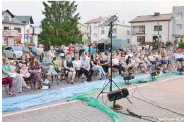
W poprzednich latach festiwalowe spektakle przyciągały mnóstwo mieszkańców Goraja

- Ma na celu ożywienie pamięci o minionych czasach, edukację i bawienie poprzez sztukę. Odbywa się w wielu miasteczkach Lubelszczyzny, często wspólnie z lokalnymi samorządami, szkołami i bibliotekami. Festiwal jest inspirowany twórczością Izaaka Baszewisa Singera, który wiele ze swoich opowiadań osadził