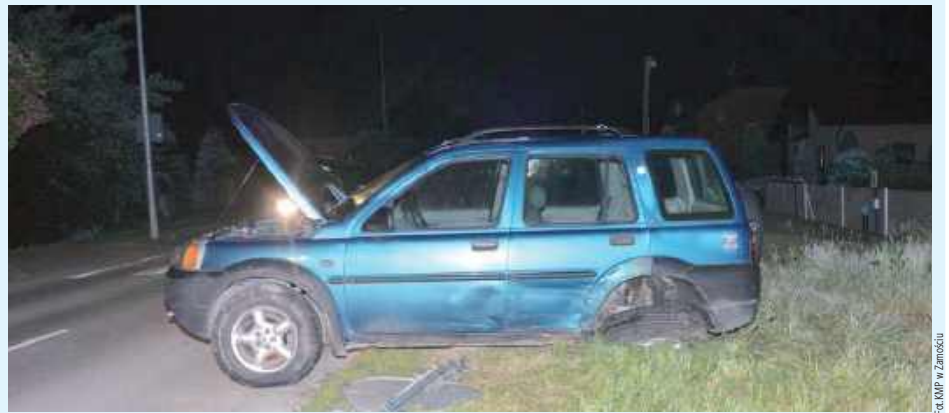
Po przejechaniu kilkuset metrów, pijany 20-latek zjechał na przeciwny pas ruchu, uderzył w znak drogowy i zatrzymał się na poboczu

Są zarzuty dla nietrzeźwego kierowcy, który doprowadził do kolizji z Toyotą. Do wypadku doszło w Krasnobrodzie, a mężczyzna miał w organizmie promil alkoholu.