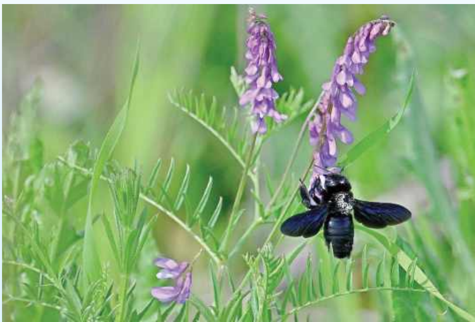
Zadrzechnia fioletowa, nazywana czasem czarną pszczołą, uważana do niedawna za wymarłą w Polsce, właśnie pojawiła się na Roztoczu

Roztocze znowu zaskakuje! W samym sercu naszych lasów i łąk pojawił się owad, o którym wielu już myślało, że zniknął na zawsze. To zadrzechnia fioletowa, nazywana czasem czarną pszczołą. - Uważany do niedawna za wymarły w Polsce owad, odzyskuje lub zdobywa nowe tereny - tłumaczy pracownicy Roztoczańskiego Parku Narodowego, którym udało się uchwycić niezwykle rzadki widok.