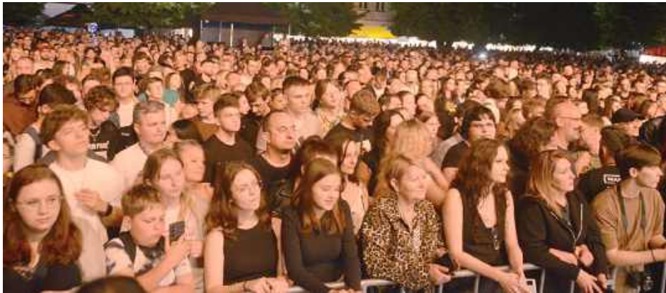
Plac przy BCK pękał w szwach