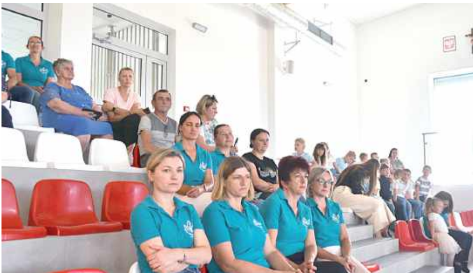
W otwarciu nowej hali brali udział uczniowie, nauczyciele czy mieszkańcy