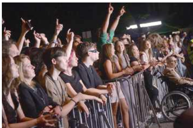
Happysad grał, a publiczność śpiewała. Śmiało możemy stwierdzić, że w naszym mieście jest ogrom fanów tego zespołu