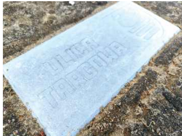
Małe elementy architektury upiększą miasto

W Biłgoraju pojawiły się nowe, charakterystyczne elementy małej architektury, które odmieniają wygląd miejskiej przestrzeni i podkreślają jej tożsamość. To oryginalne połączenie funkcjonalności z estetyką.