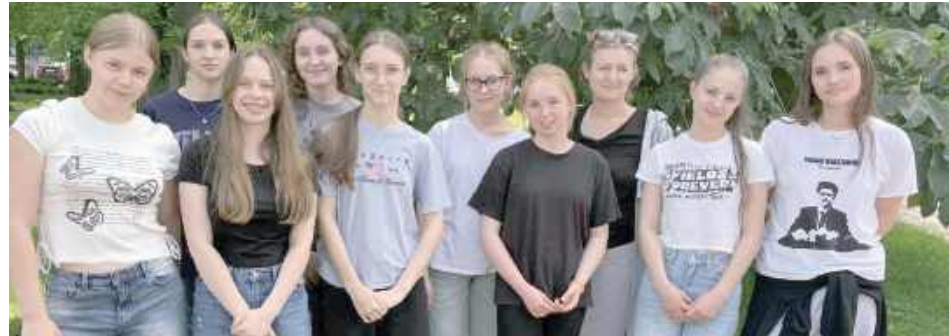
Ósmoklasiści spędzili niezapomniany dzień w Biłgoraju