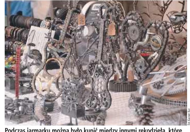
Podczas jarmarku można było kupić między innymi rękodzieła, które robiły ogromne wrażenie na innych