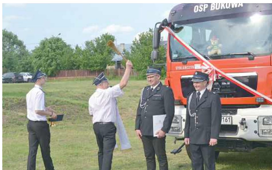
Święcenie wozu bojowego OPS Bukowa