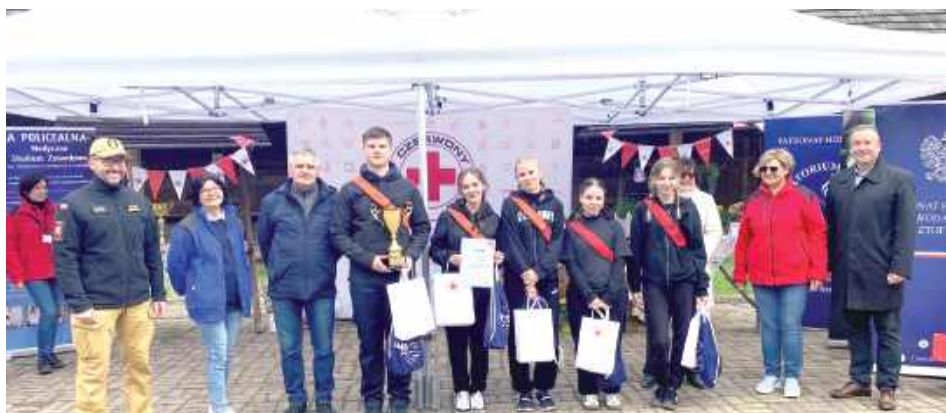
Oni wiedzą o pierwszej pomocy wszystko!

W sobotę, 24 maja w Muzeum Wsi Lubelskiej odbył się etap okręgowy XXXI Ogólnopolskich Mistrzostw Pierwszej Pomocy PCK. W wydarzeniu wzięły udział najlepsze zespoły ratownicze z województwa lubelskiego, wyłonione w eliminacjach rejonowych. Duży sukces odniosła drużyna z I Liceum Ogólnokształcącego im. ONZ w Biłgoraju, która zajęła II miejsce.