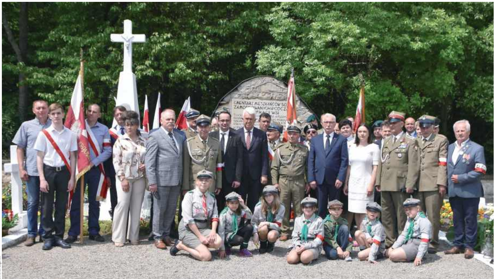
Oddali hołd zamordowanym mieszkańcom

Przed kościołem filialnym pw. Miłosierdzia Bożego w Sochach zebrały się całe rodziny, mieszkańcy, w tym naocznymi świadkami tamtych dramatycznych chwil, a także poczty sztandarowe, delegacje policji, nadleśnictwa, Straży Granicznej, kombatancki, członkowie Światowego Związku Żołnierzy Armii Krajowej z Lubaczowa i Horyńca Zdroju, przedstawiciele Dzieci Zamo-