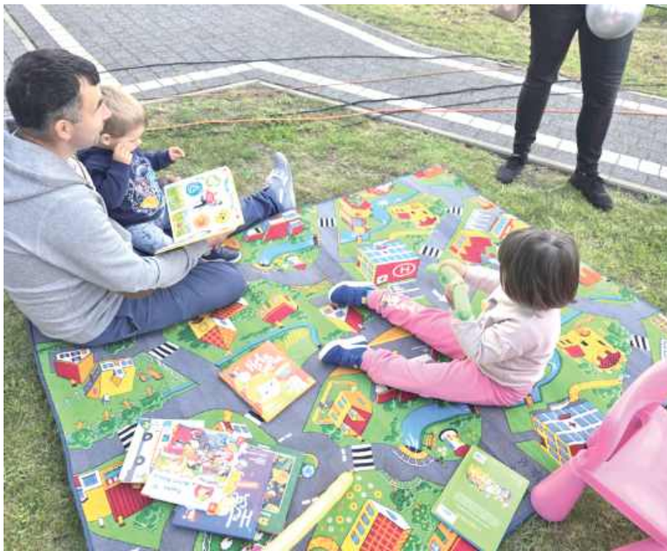
Nie zabrakło dobrej zabawy!

Kolejnym punktem programu były emocjonujące konkurencje sportowe, które przyciągnęły liczne grono uczestników. Dużym zainteresowaniem cieszył się również konkurs wiedzy o gminie Księżpol, w którym chętne dzieci mogły sprawdzić swoją znajomość lokalnej historii i tradycji.