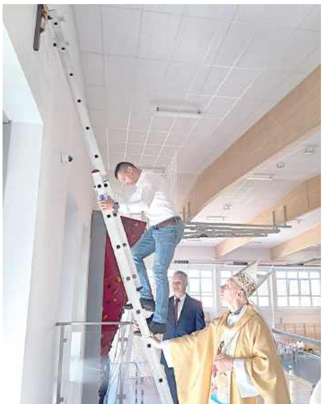
Uroczyste wieszanie krzyża. Biskup i wójt asekurowają przy drabinie

stąpiło uroczyste poświęcenie hali sportowej, zawieszenie krzyża na hali. Uczniowie zaprezentowali pokaz artystyczno-sportowy. Występowała także Gminna Orkiestra Dęta w Potoku Górnym, natomiast Koło Gospodyń Wiejskich w Potoku Górnym przygotowa-