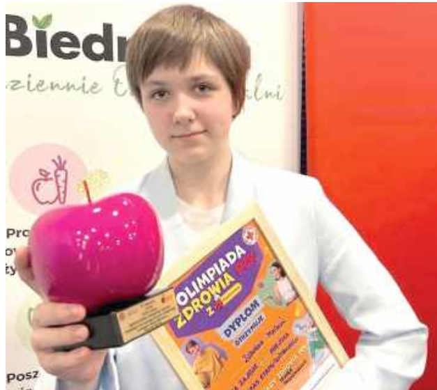
Zuzia nie miała sobie równych, gratulacje!

Olimpiada Zdrowia PCK to ogólnopolski konkurs adresowany do uczniów klas VI–VIII szkół podstawowych oraz mło-