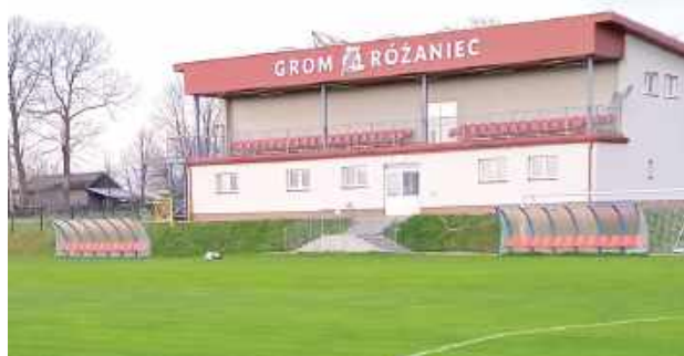
Stadion w Różańcu zamarł na kolejkę przed zakończeniem sezonu. Odżyje jeszcze w sobotnie popołudnie?

półfinałowy z wiceliderem wiceliderem klasy okręgowej (na ten moment Orleńca Łuków), a ewentualny finał ze zwycięzcą rywalizacji wiceliderów grup chełmskiej i lubelskiej.